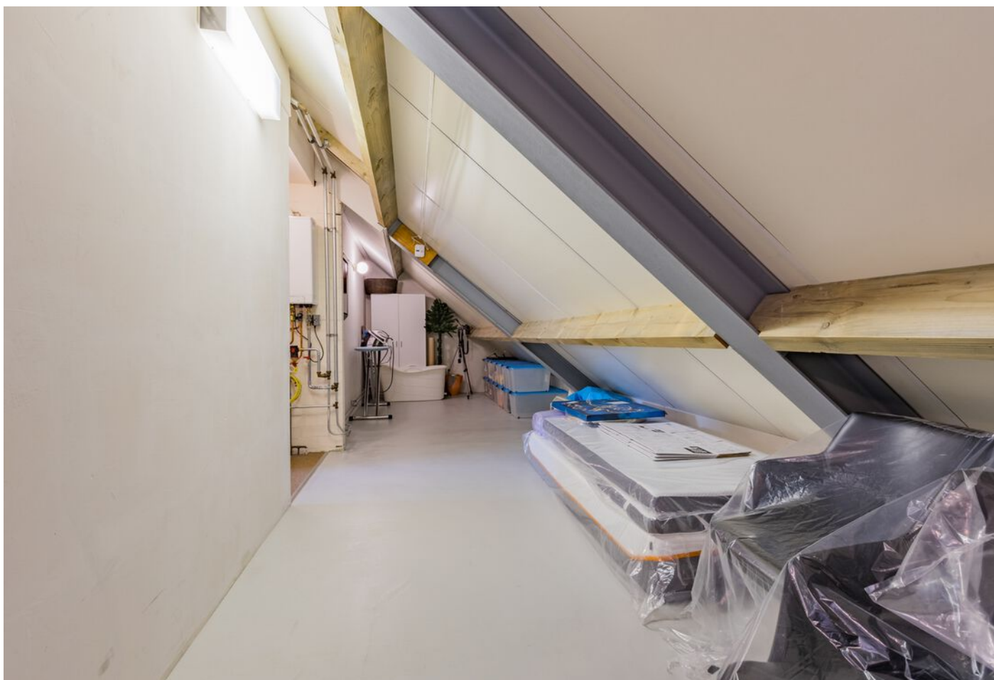
Verzetsheldenlaan 34, Eindhoven