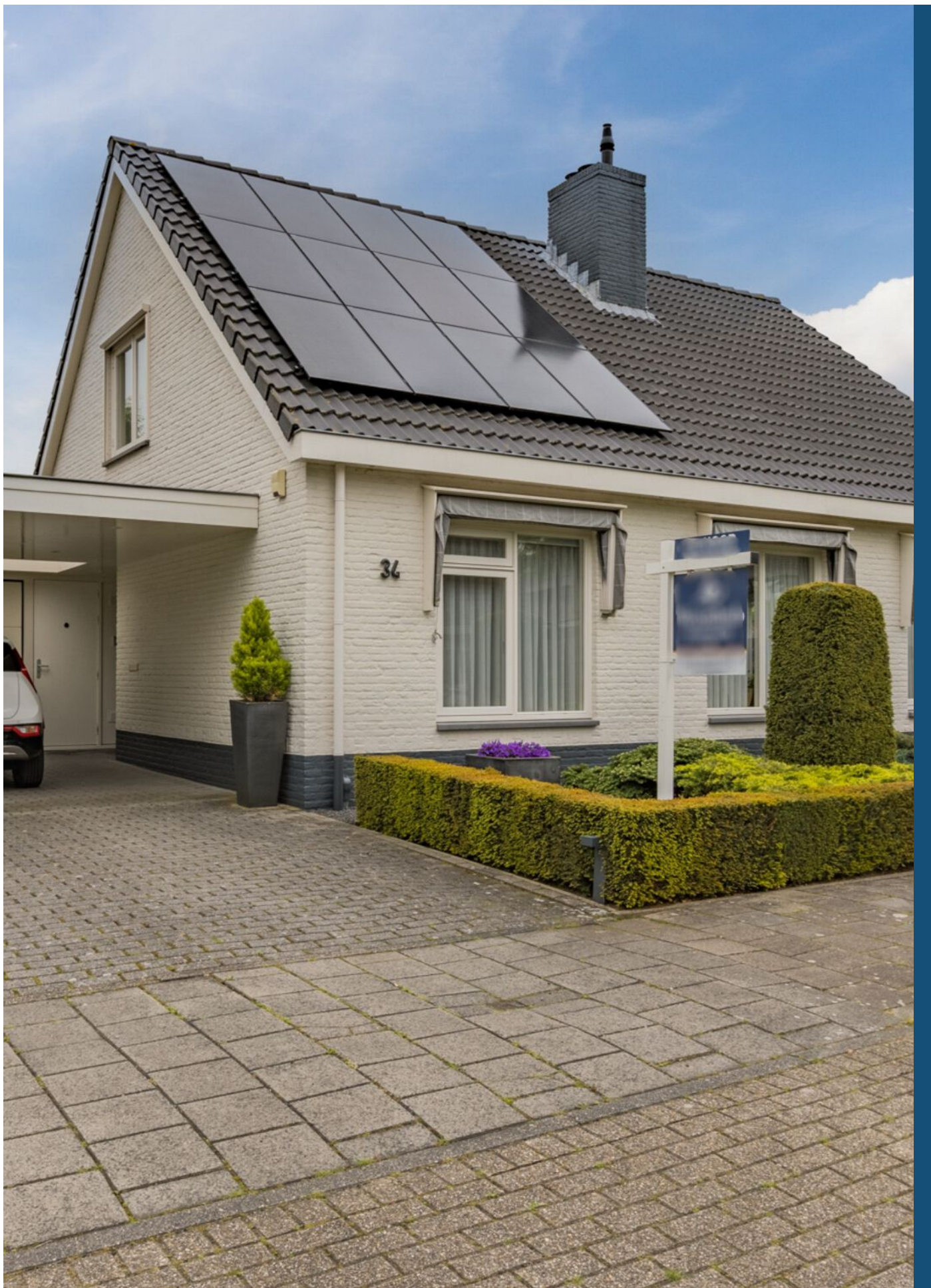
Verzesheldenlaan 34, Eindhoven