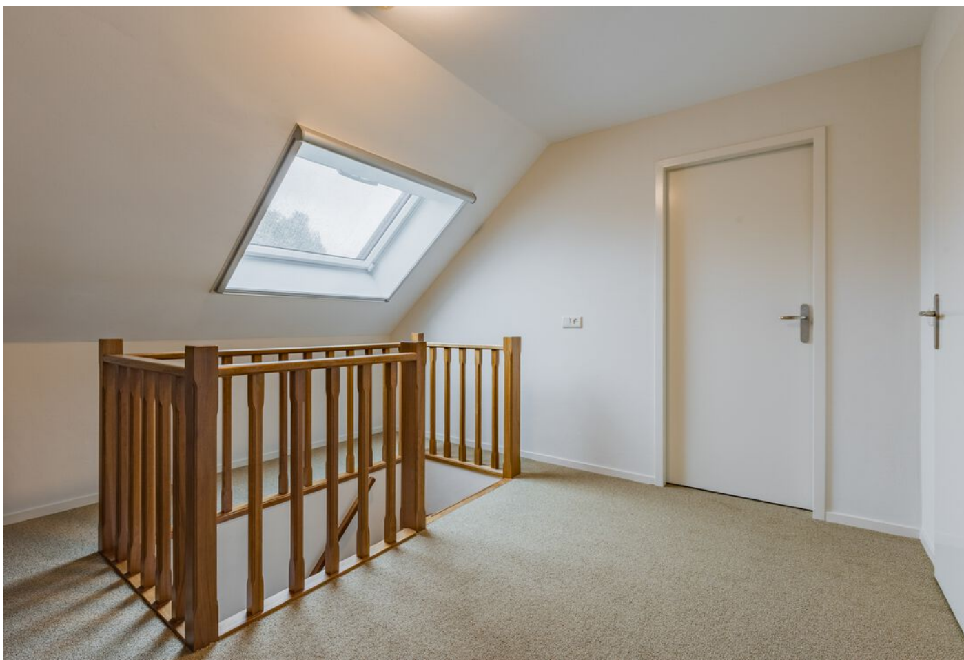
Verzetsheldenlaan 34, Eindhoven