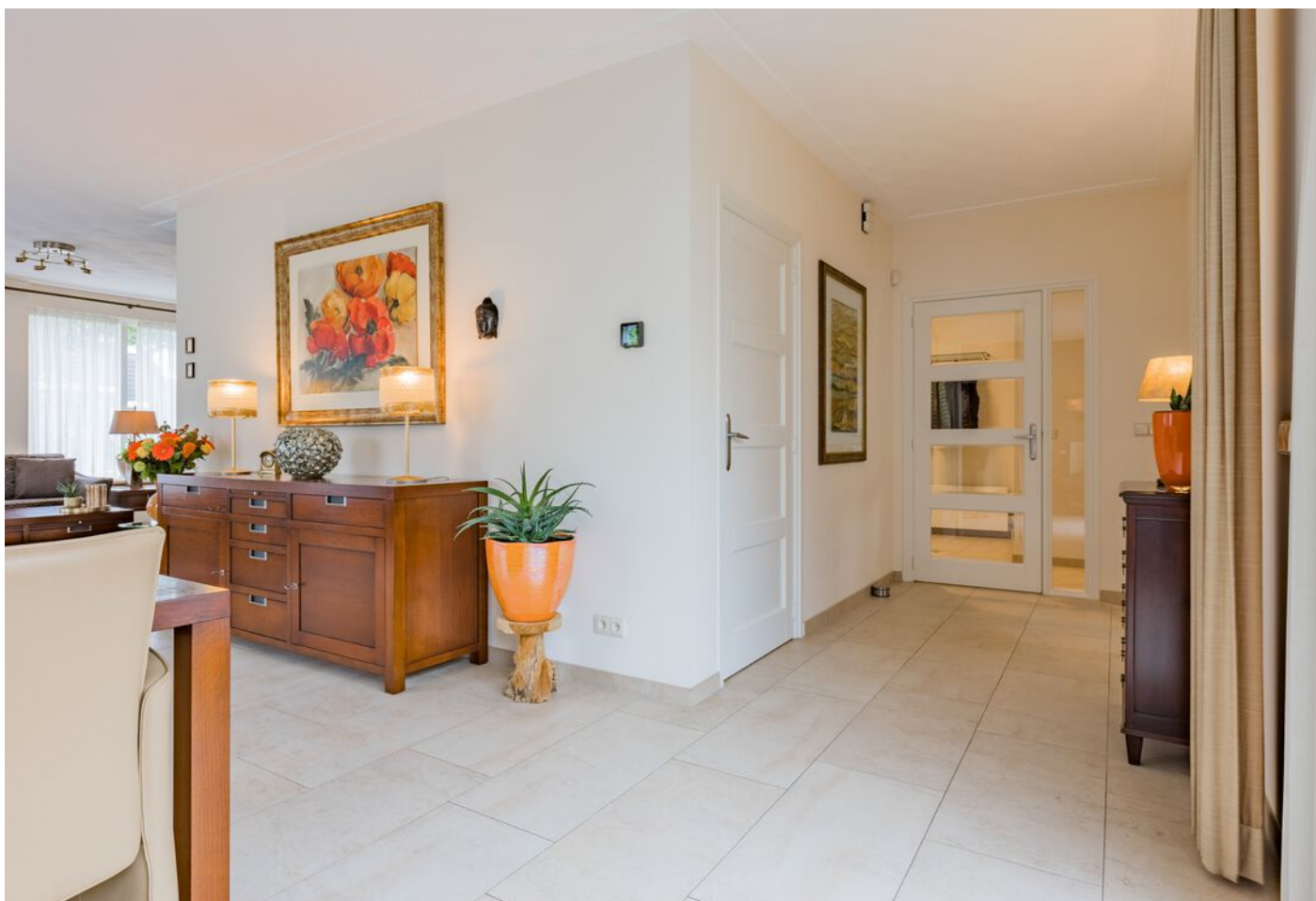
Verzesheldenlaan 34, Eindhoven