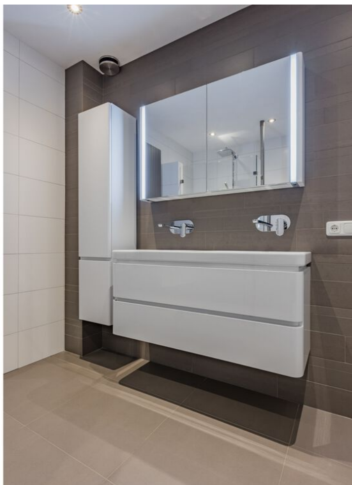
Verzetsheldenlaan 34, Eindhoven