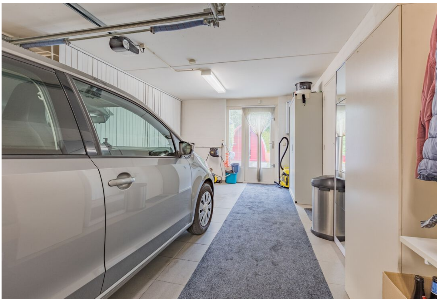
Verzesheldenlaan 34, Eindhoven