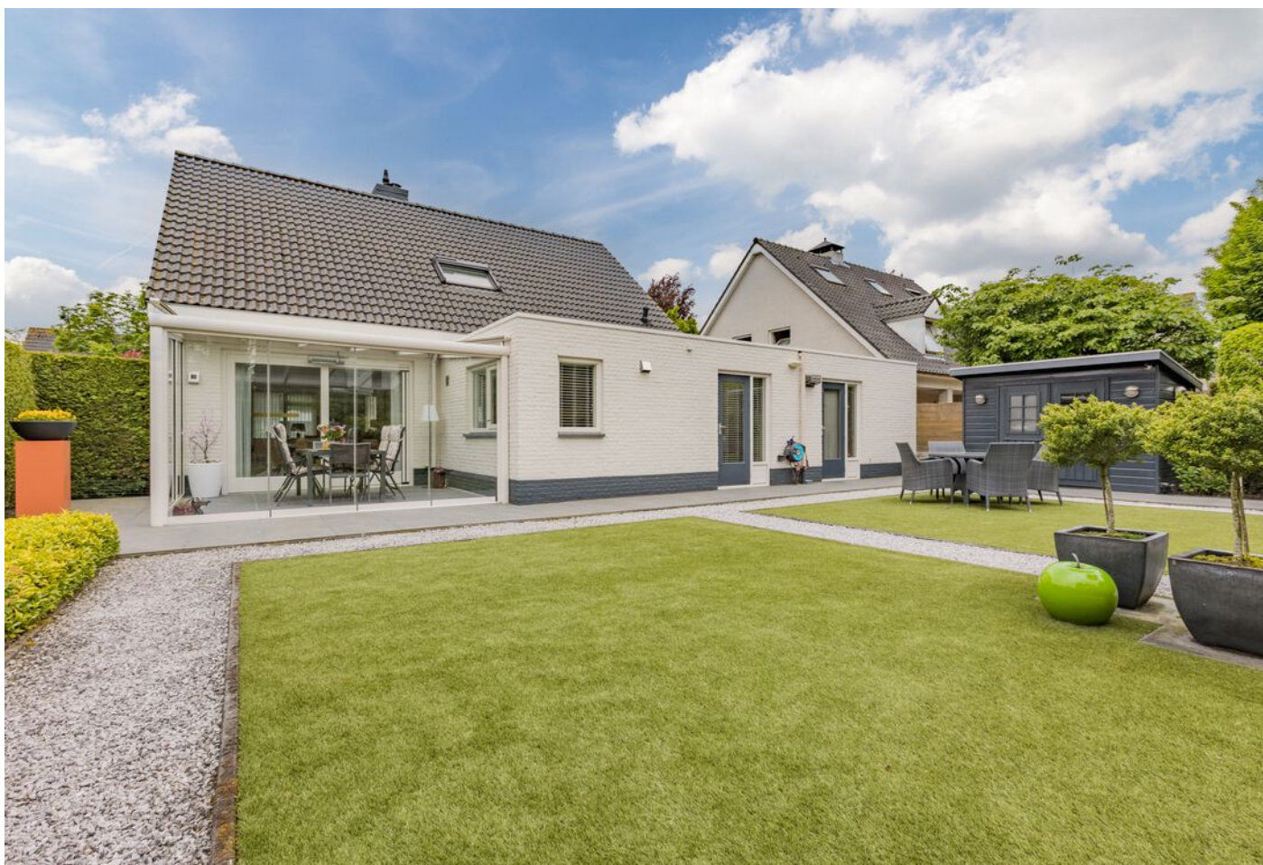
Verzetsheldenlaan 34, Eindhoven