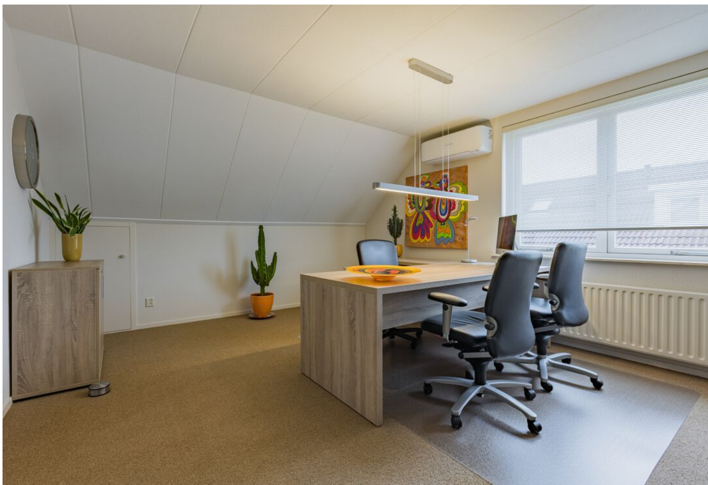
Verzesheldenlaan 34, Eindhoven