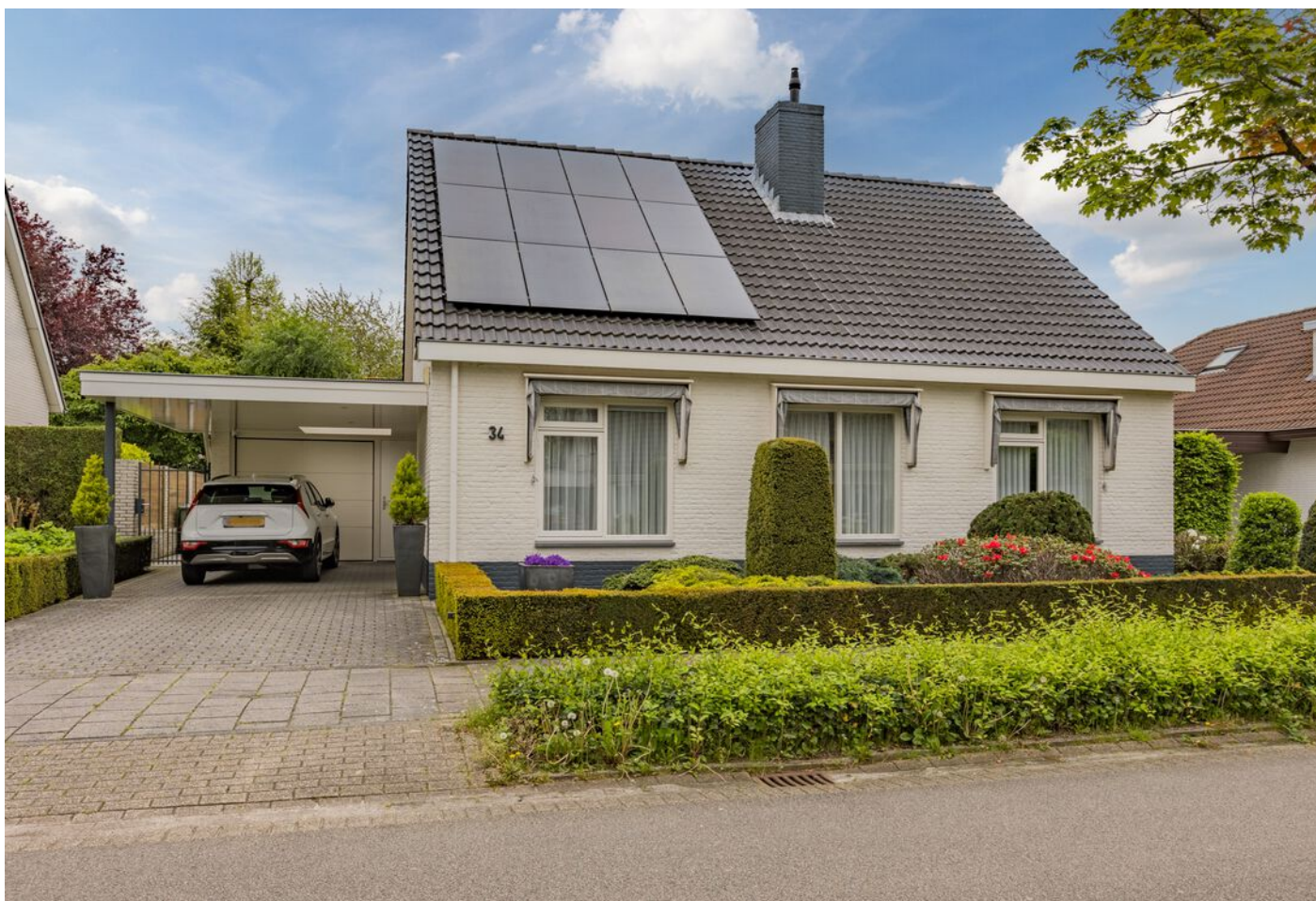
Verzetsheldenlaan 34, Eindhoven