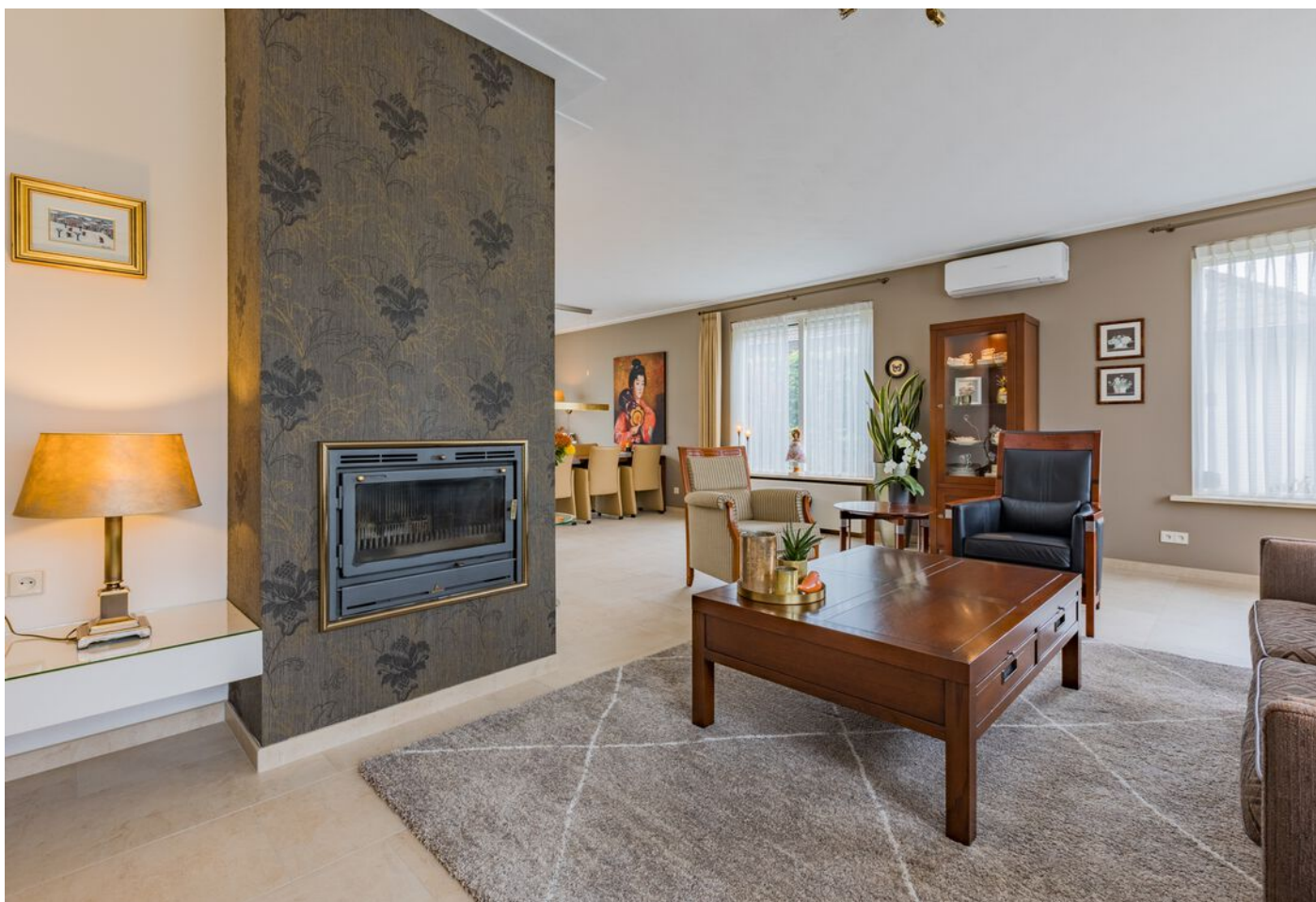
Verzetsheldenlaan 34, Eindhoven