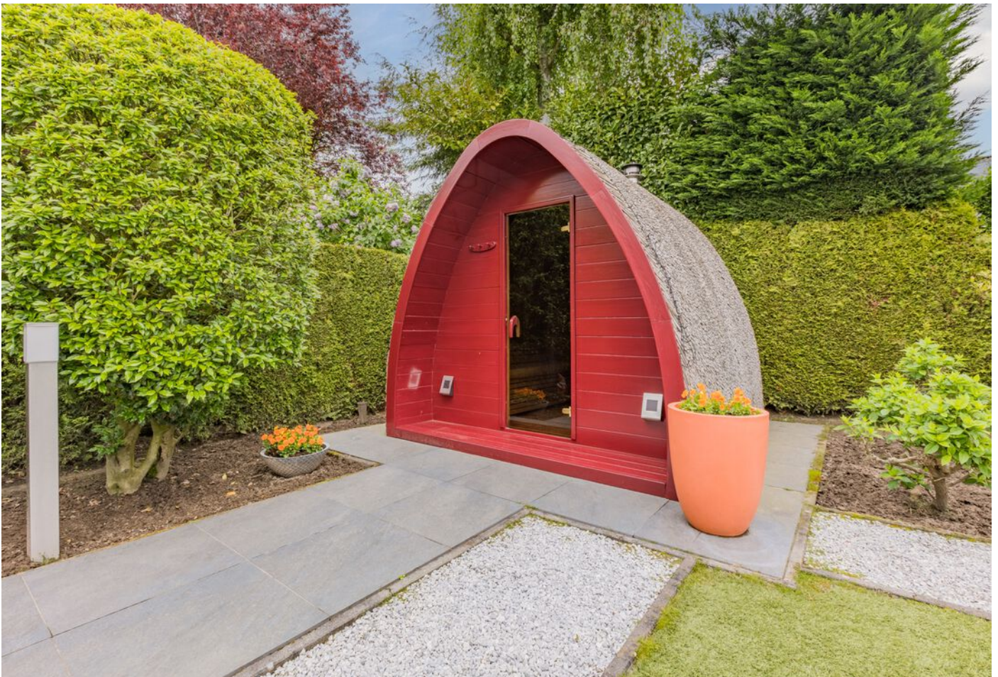
Verzetsheldenlaan 34, Eindhoven