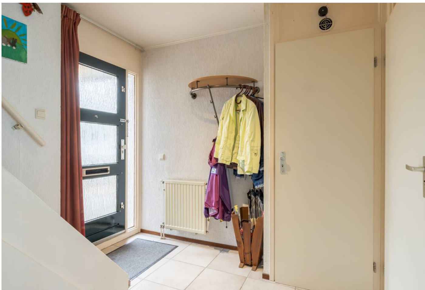
Veronaplein 22, 's-Hertogenbosch