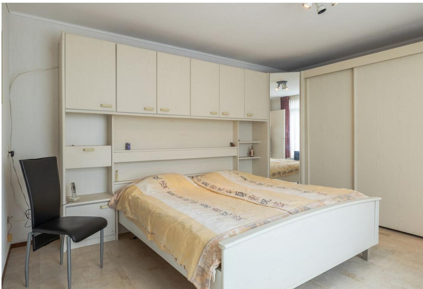
Veronaplein 22, 's-Hertogenbosch