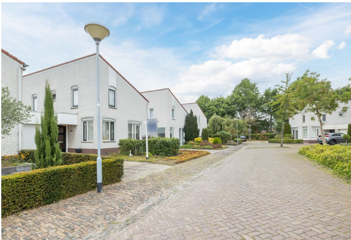
Veronaplein 22, 's-Hertogenbosch