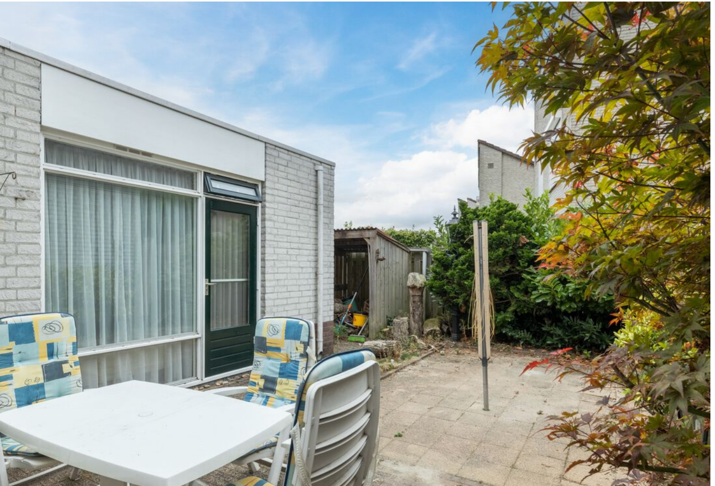
Veronaplein 22, 's-Hertogenbosch