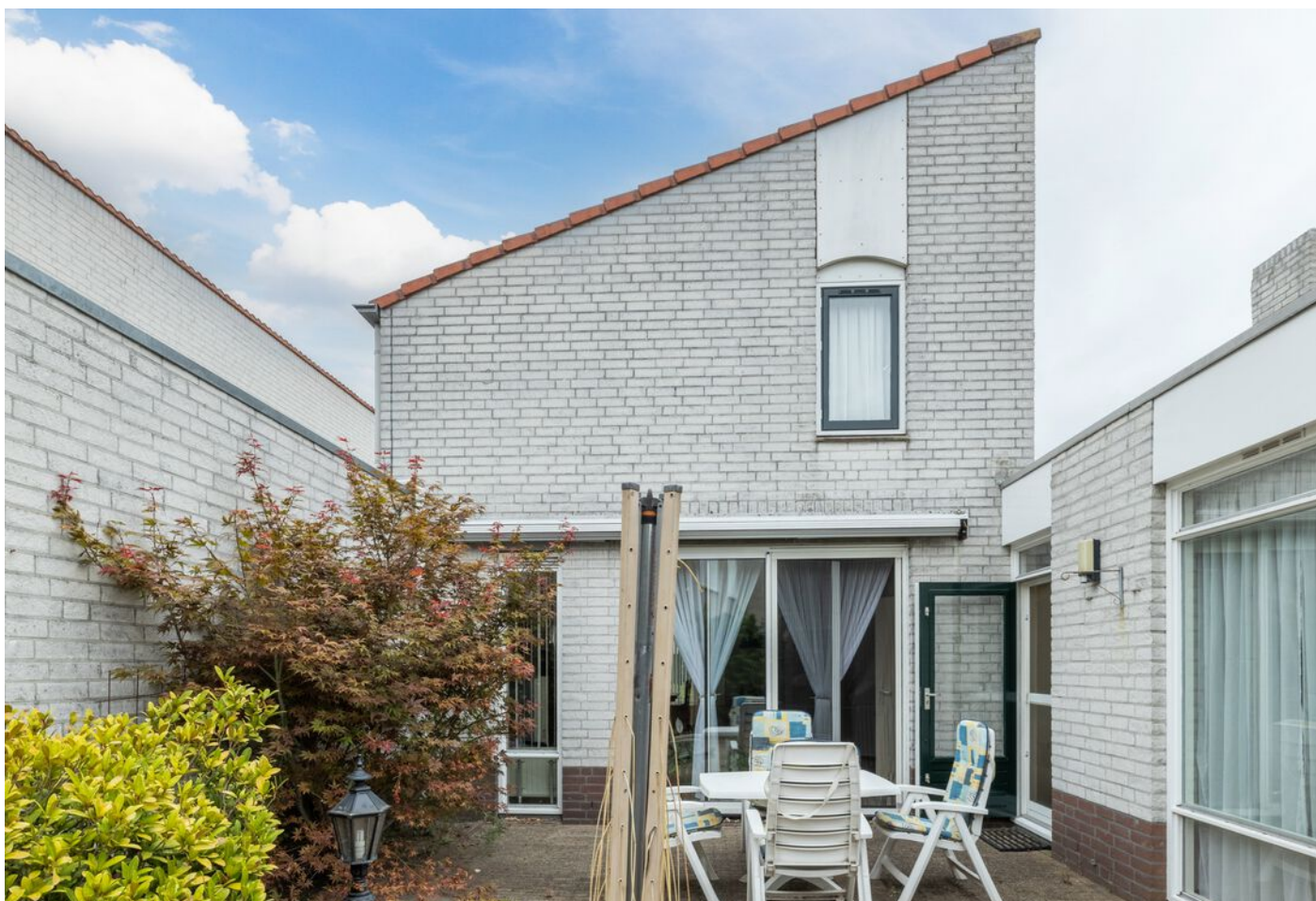
Veronaplein 22, 's-Hertogenbosch