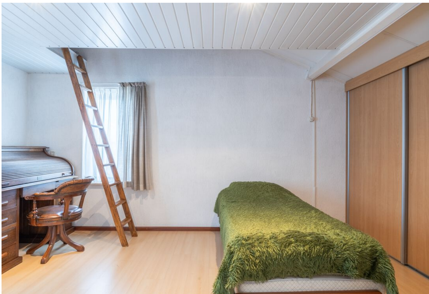
Veronaplein 22, 's-Hertogenbosch