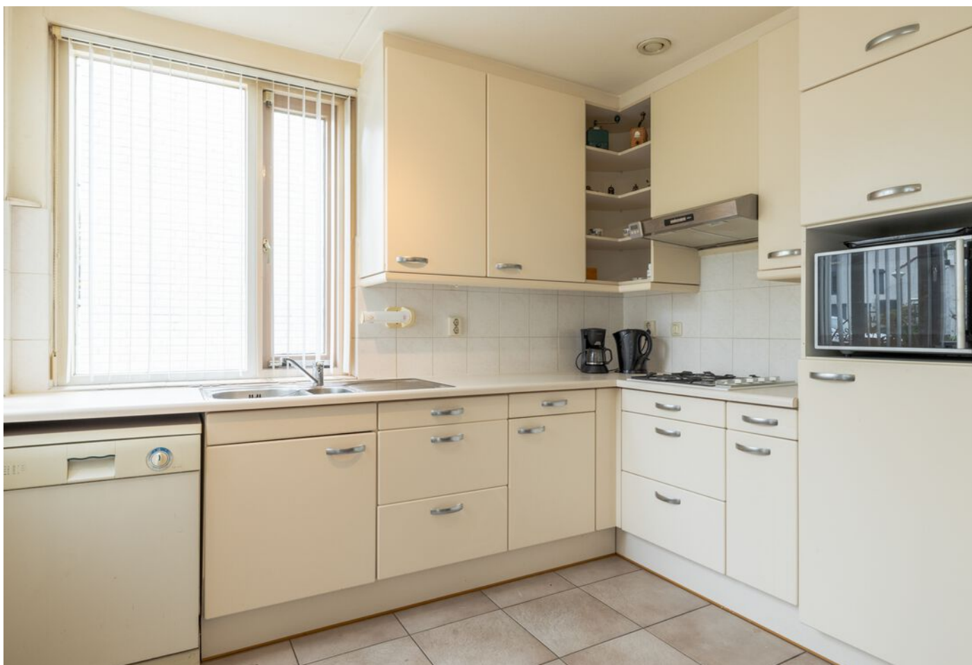
Veronaplein 22, 's-Hertogenbosch