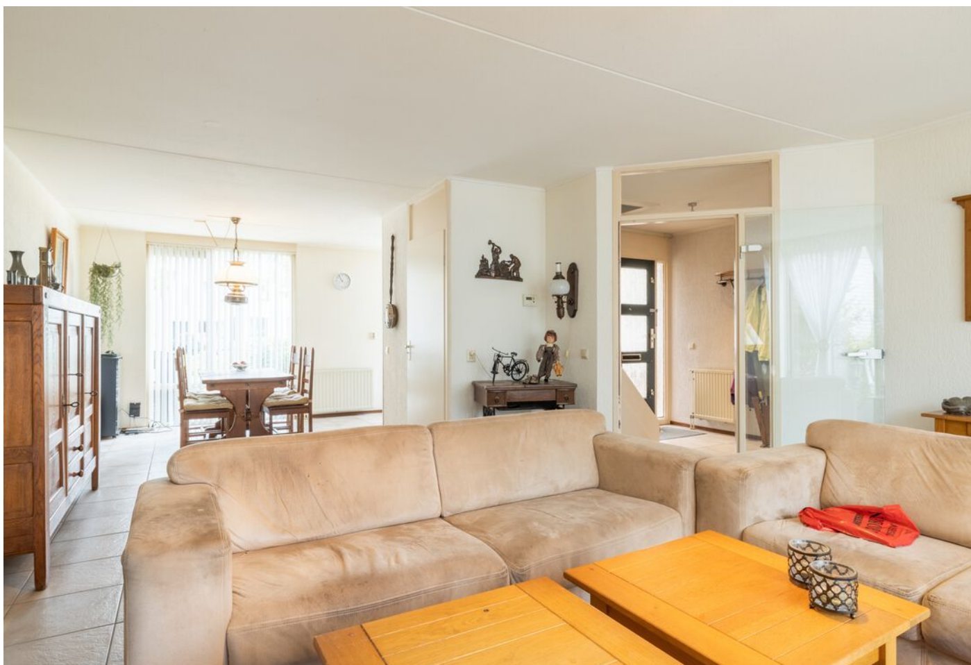
Veronaplein 22, 's-Hertogenbosch