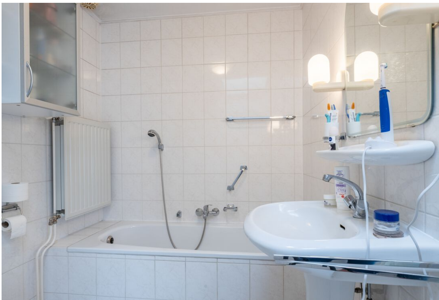
Veronaplein 22, 's-Hertogenbosch