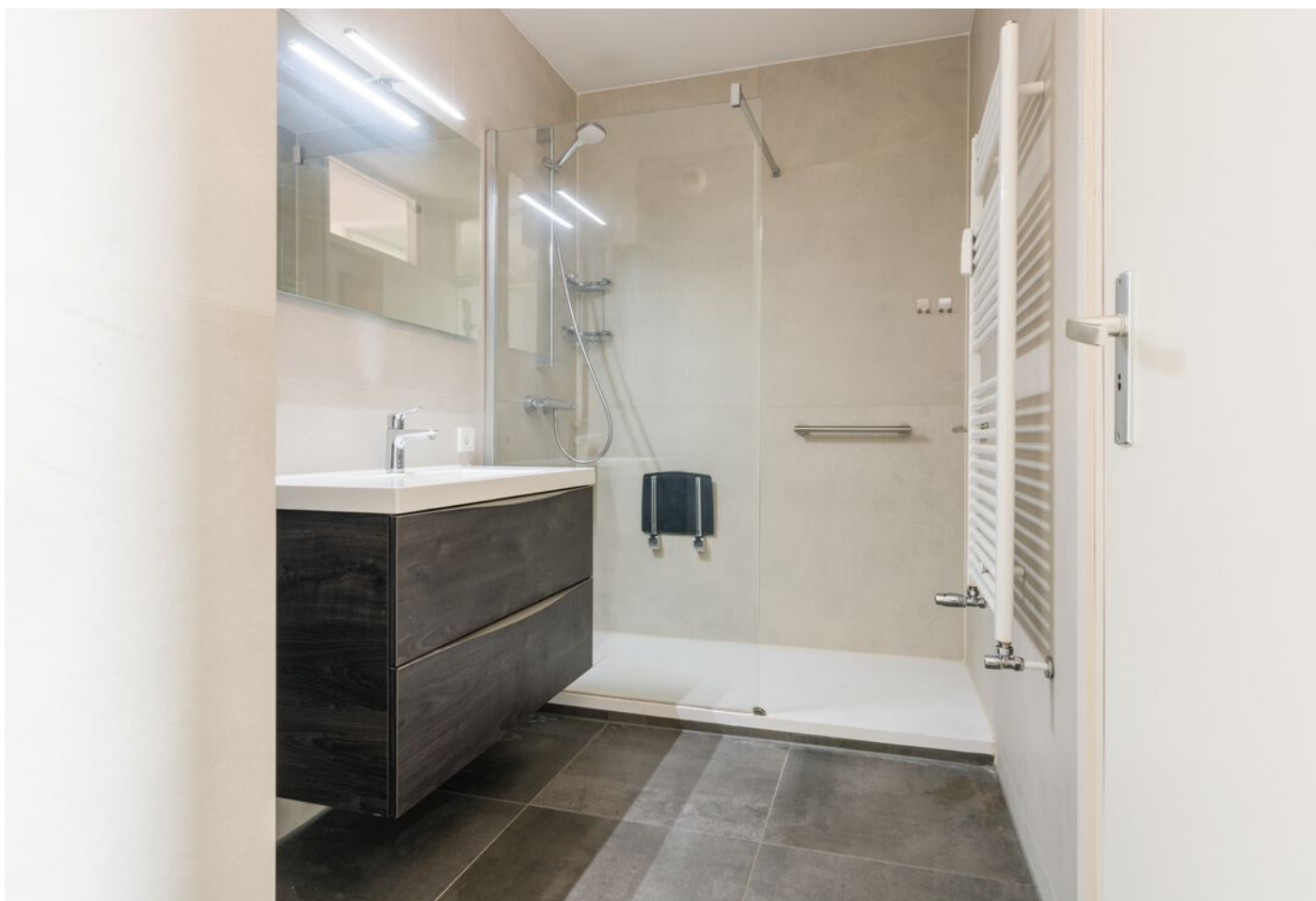
Vergiliuslaan 68, 's-Hertogenbosch