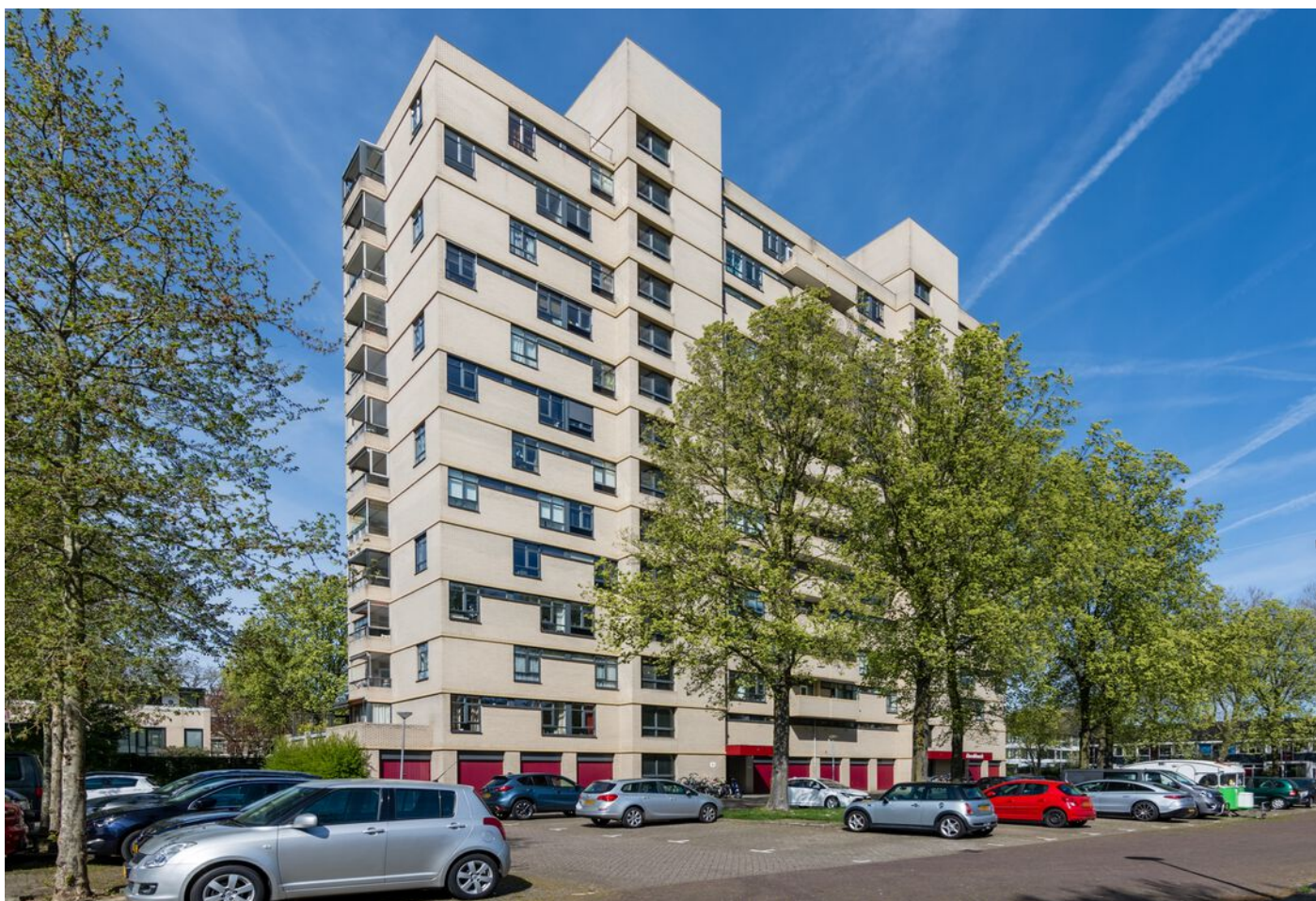
Vergiliuslaan 68, 's-Hertogenbosch