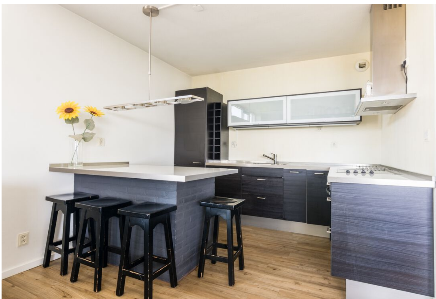
Vergiliuslaan 68, 's-Hertogenbosch