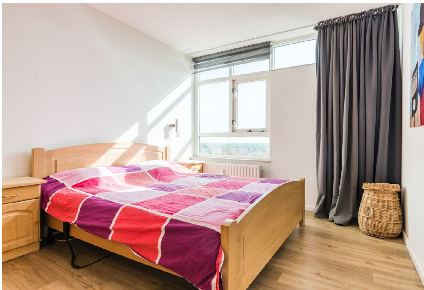
Vergiliuslaan 68, 's-Hertogenbosch