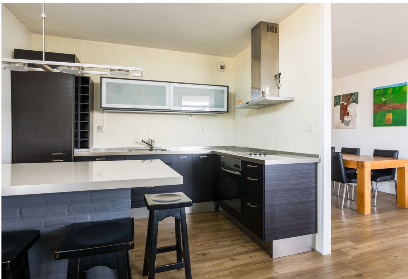
Vergiliuslaan 68, 's-Hertogenbosch