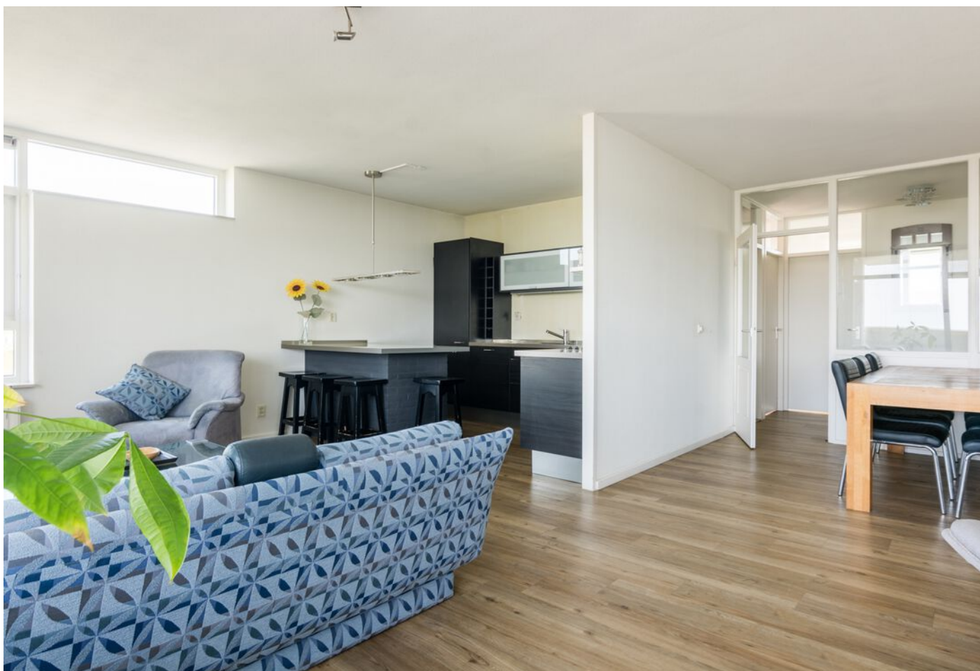
Vergiliuslaan 68, 's-Hertogenbosch