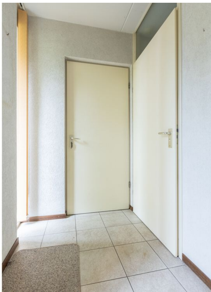
Turfveldenstraat 4, Eindhoven