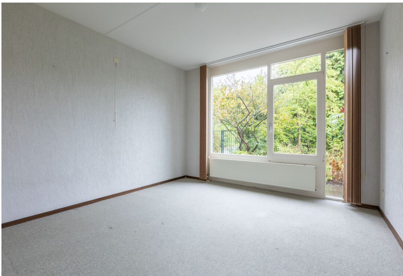
Turfveldenstraat 4, Eindhoven