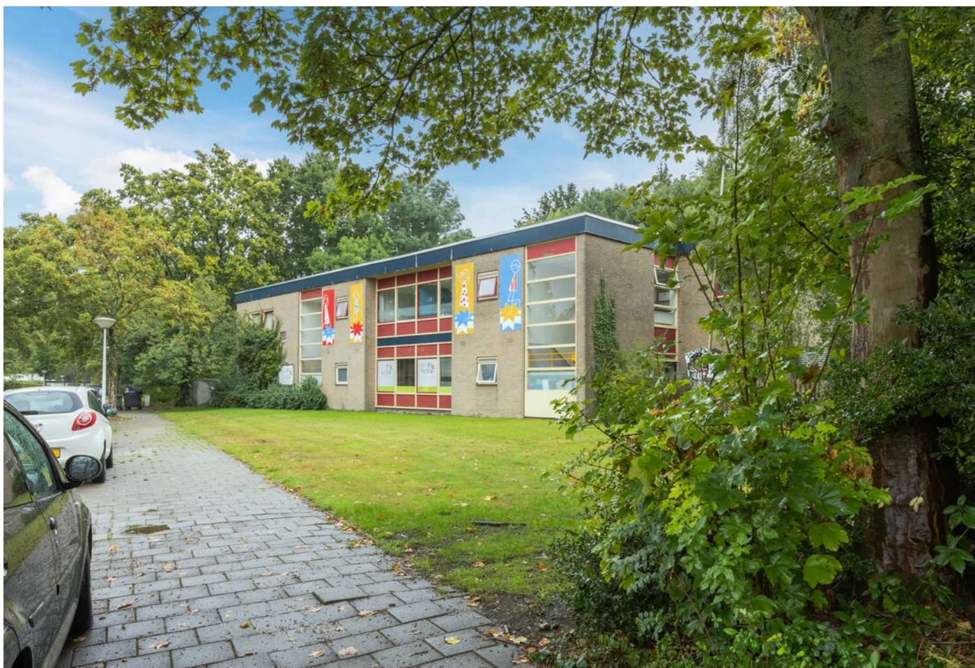
Turfveldenstraat 4, Eindhoven