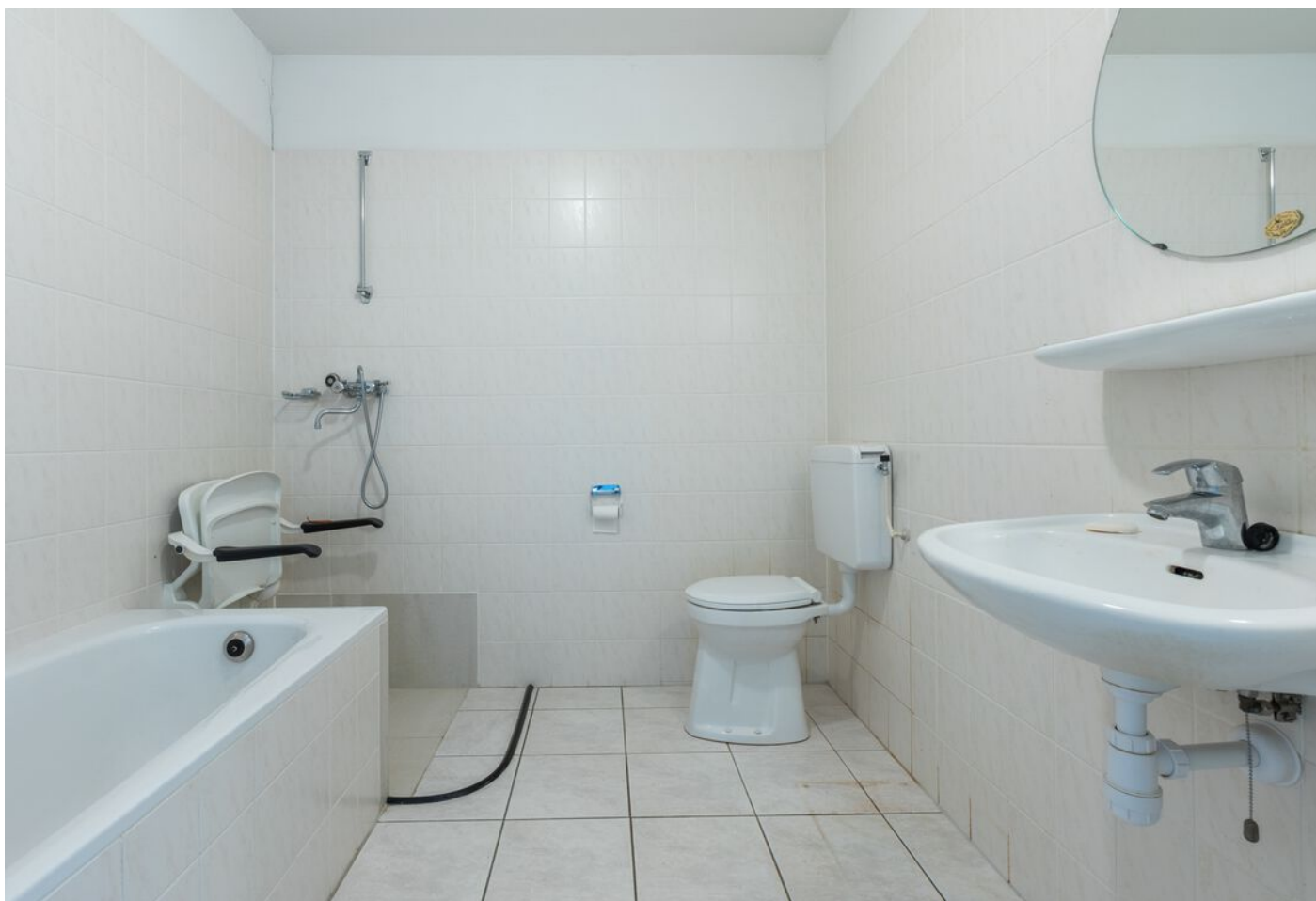
Turfveldenstraat 4, Eindhoven