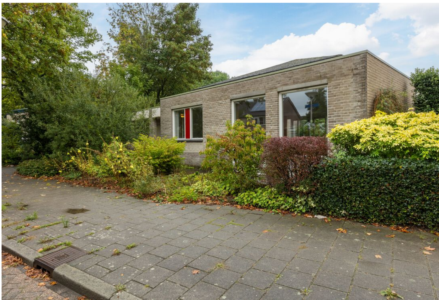
Turfveldenstraat 4, Eindhoven