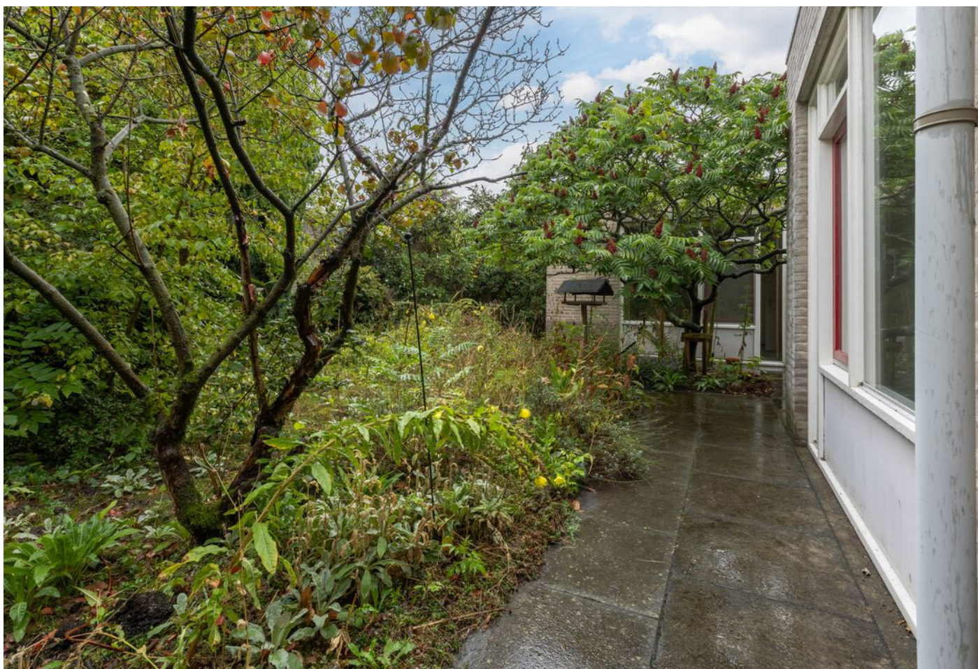
Turfveldenstraat 4, Eindhoven