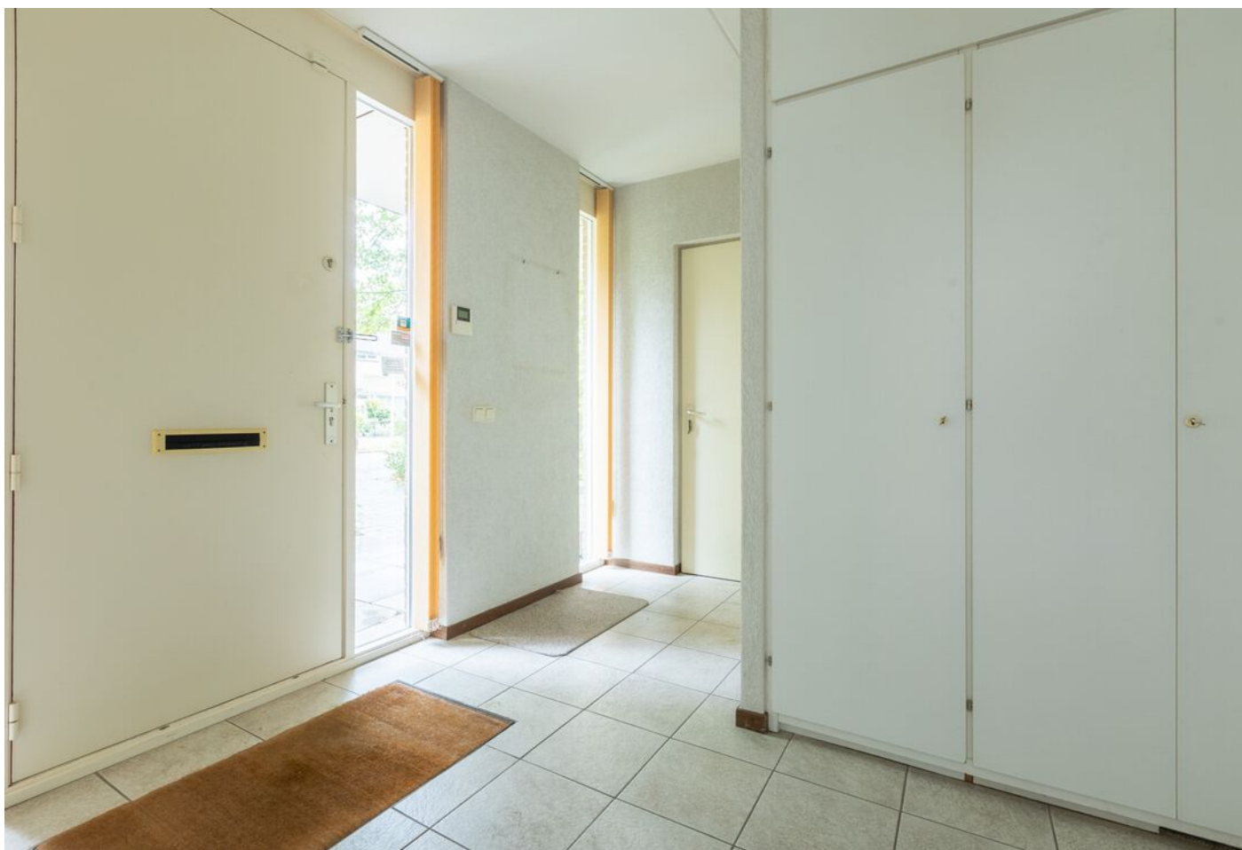
Turfveldenstraat 4, Eindhoven