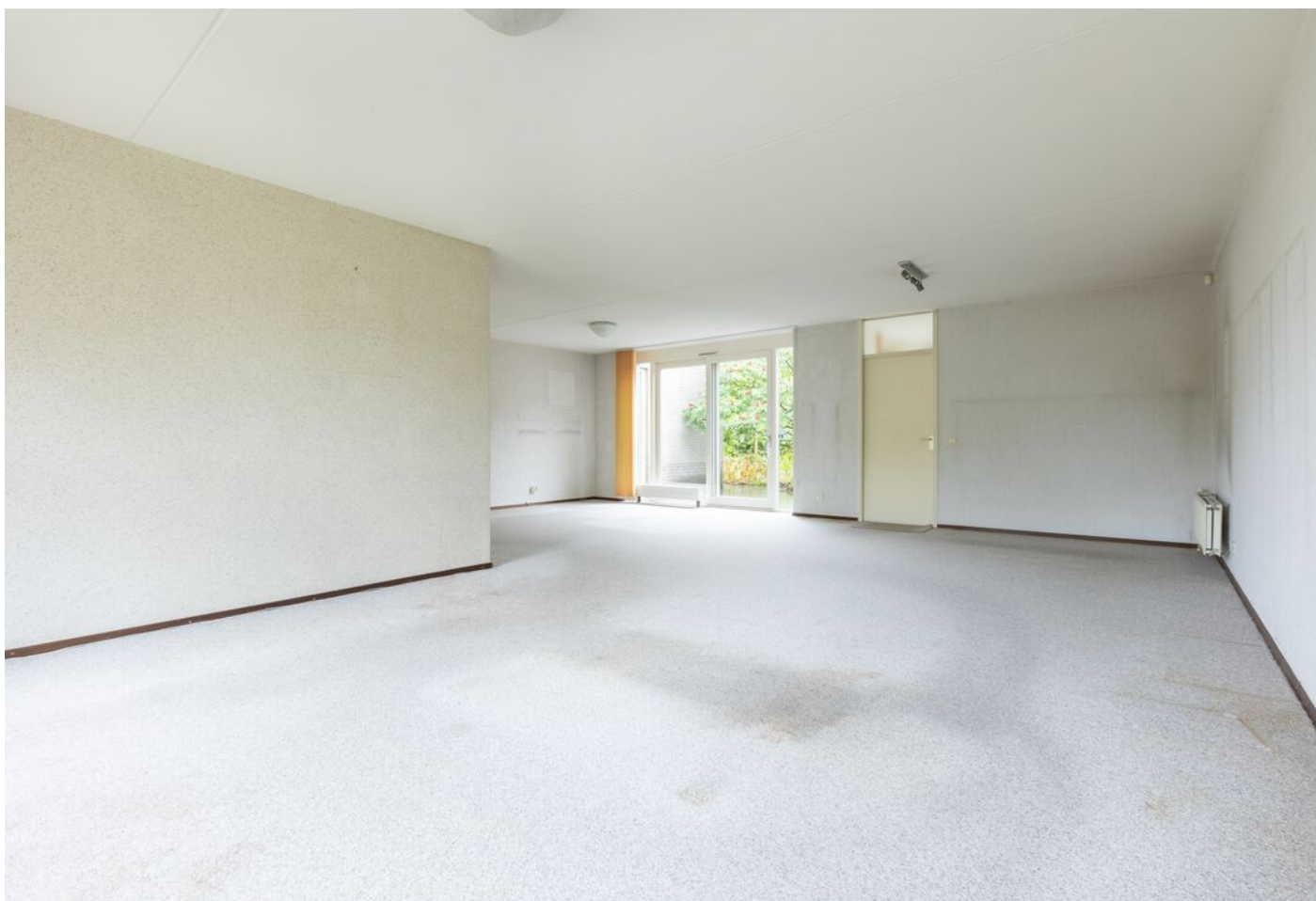
Turfveldenstraat 4, Eindhoven