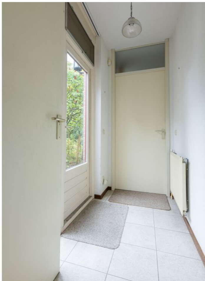
Turfveldenstraat 4, Eindhoven