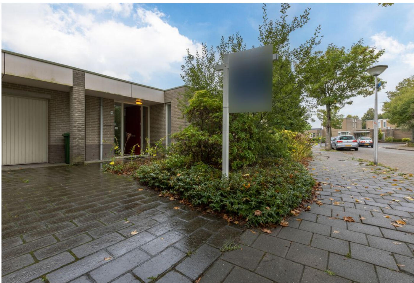
Turfveldenstraat 4, Eindhoven