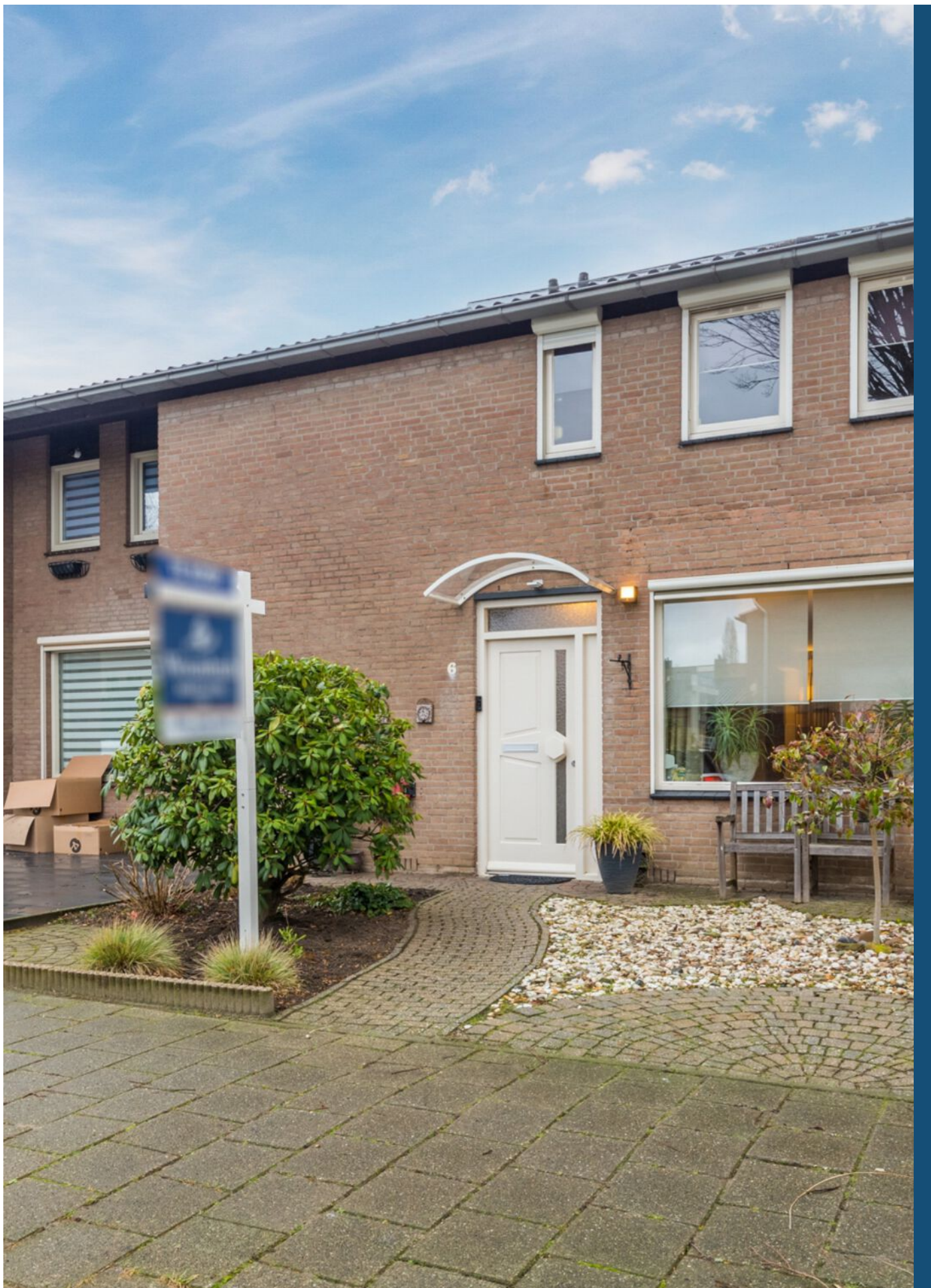
Tarantstraat 6, Eindhoven