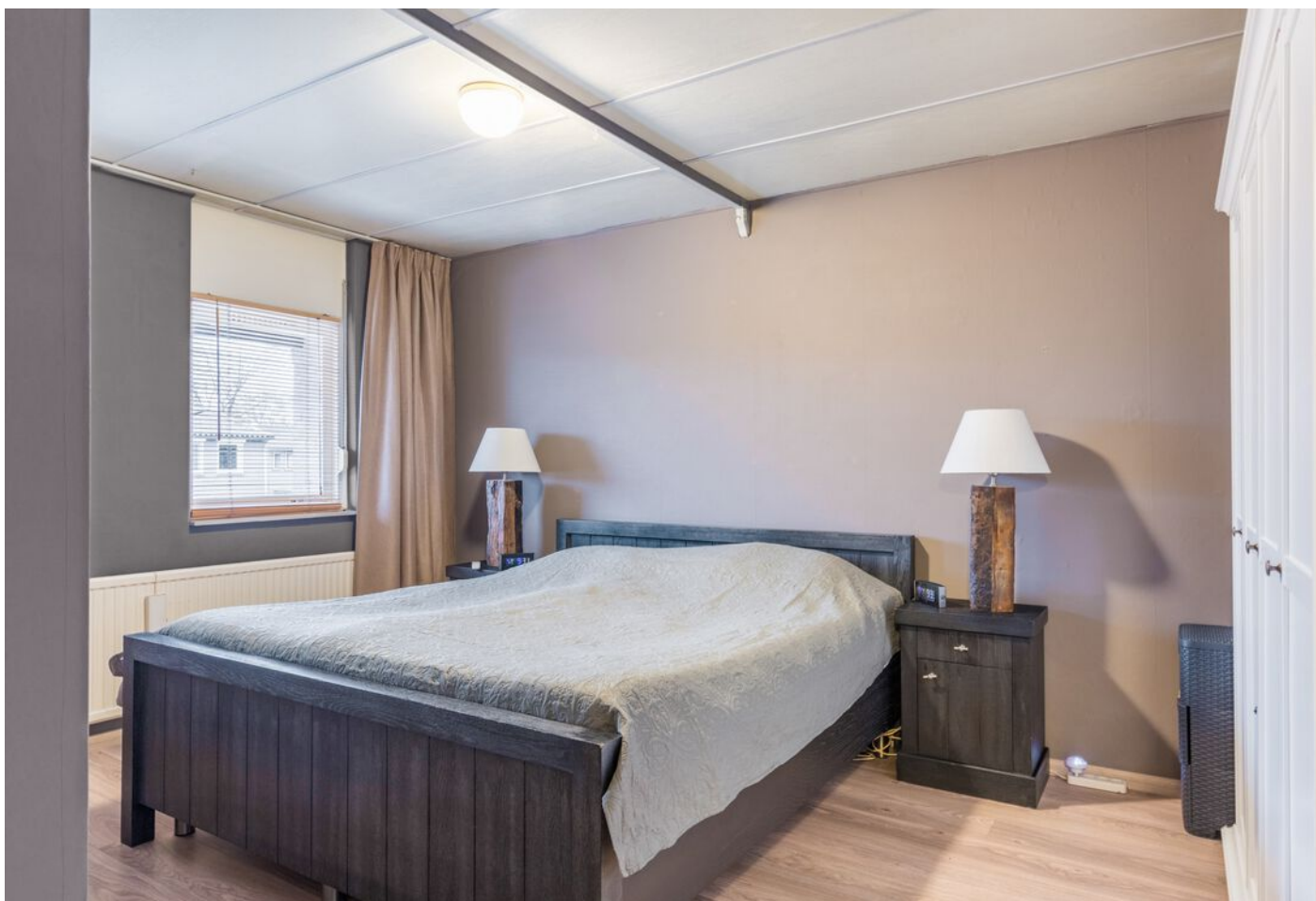
Tarantstraat 6, Eindhoven