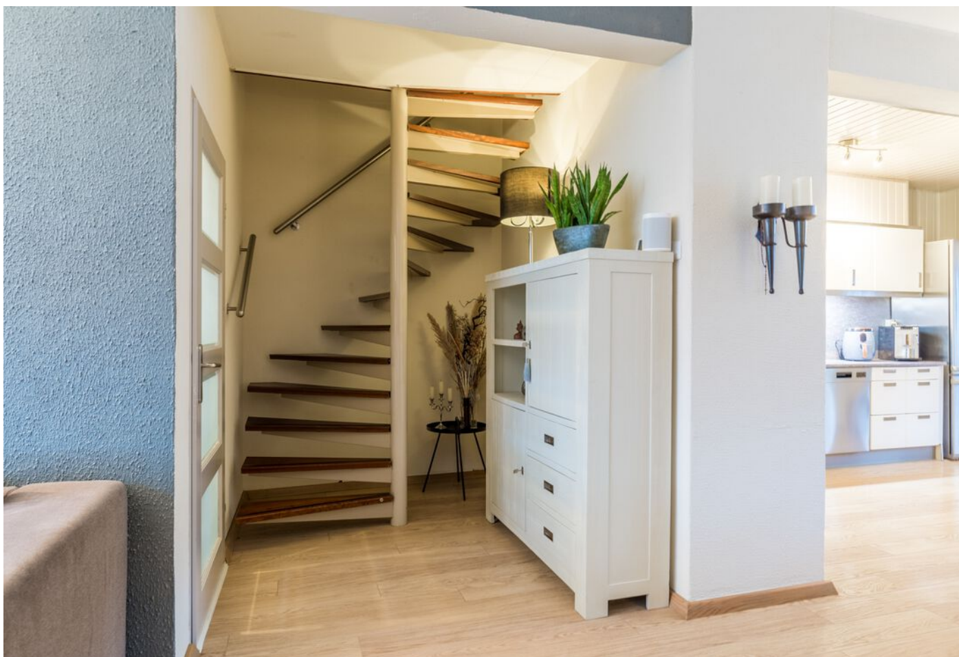
Tarantostaat 6, Eindhoven