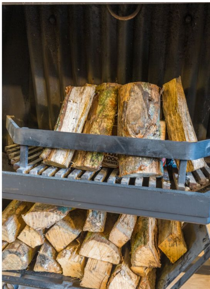
Tarantstraat 6, Eindhoven