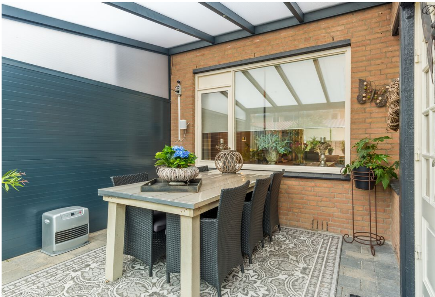
Tarantstraat 6, Eindhoven