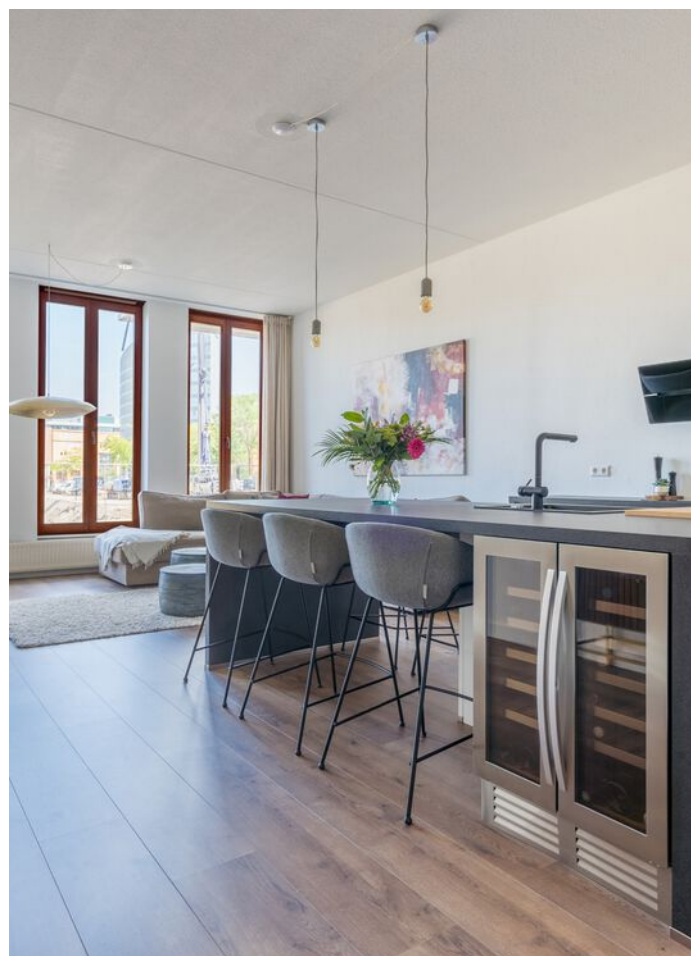
Statenlaan 177, 's-Hertogenbosch