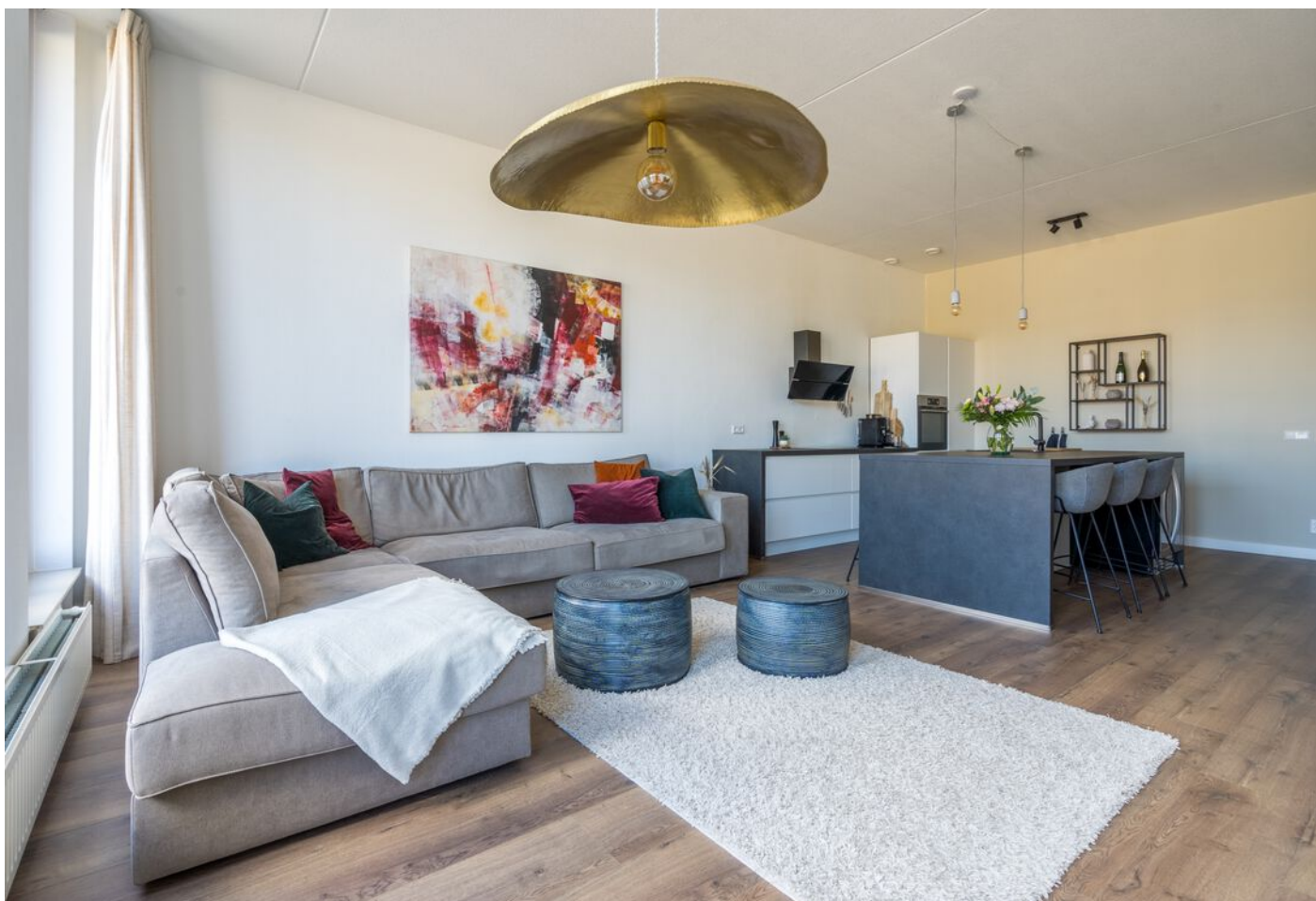
Statenlaan 177, 's-Hertogenbosch