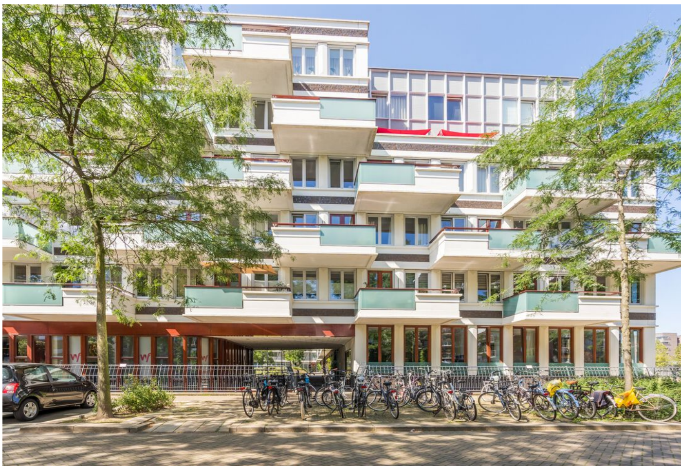
Statenlaan 177, 's-Hertogenbosch