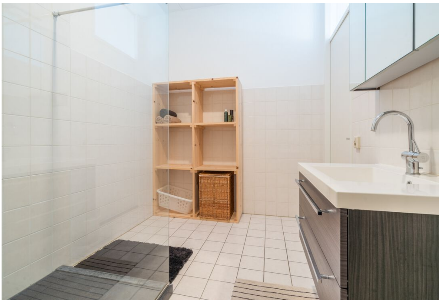
Statenlaan 177, 's-Hertogenbosch