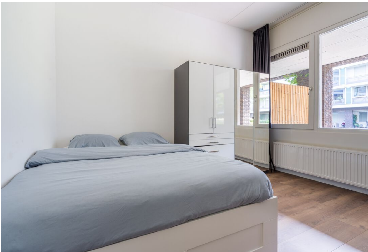
Statenlaan 177, 's-Hertogenbosch