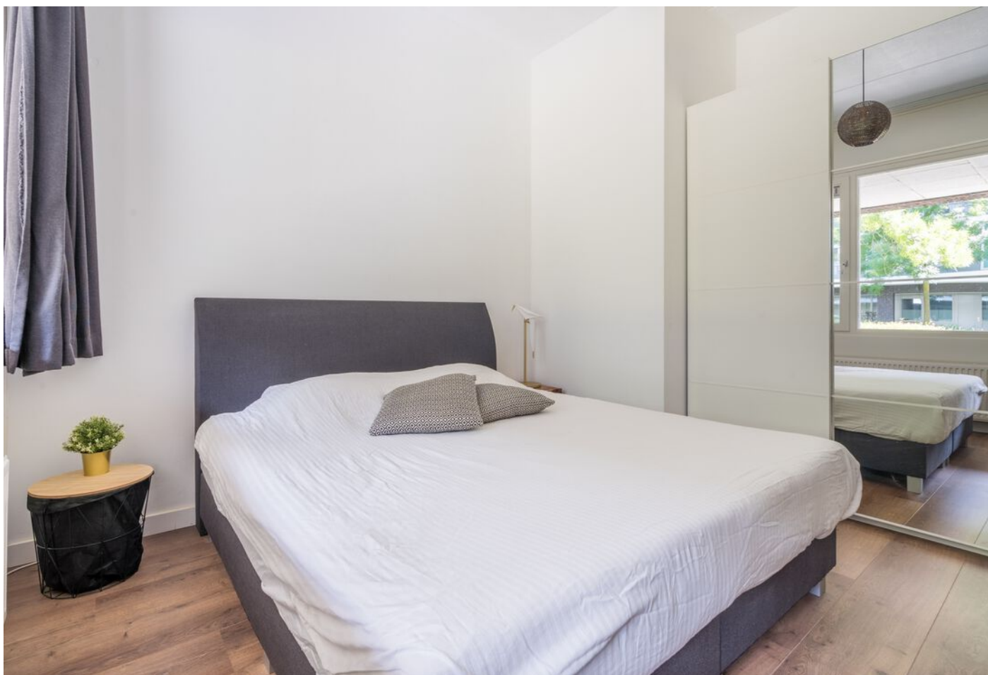
Statenlaan 177, 's-Hertogenbosch