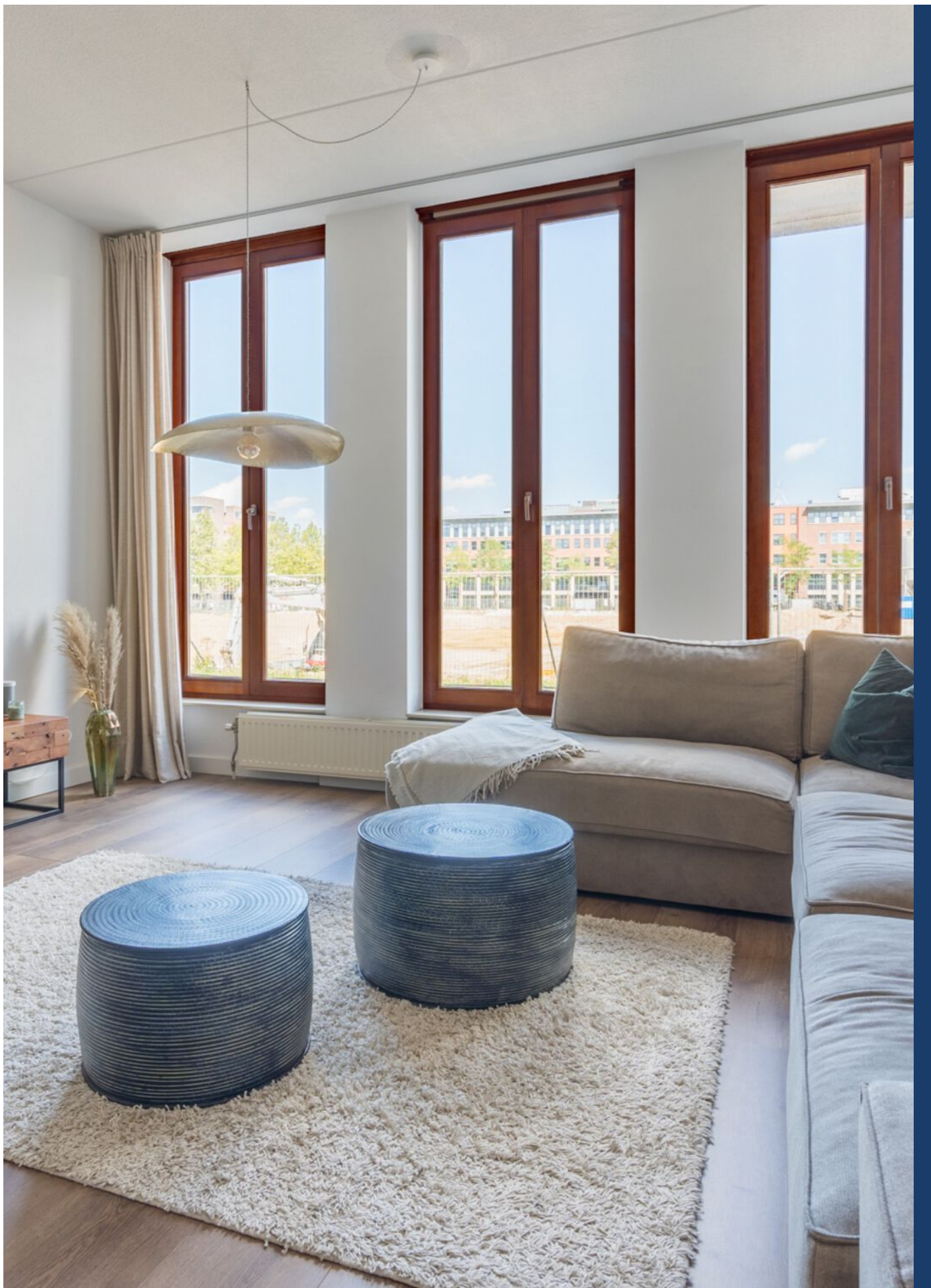
Statenlaan 177, 's-Hertogenbosch