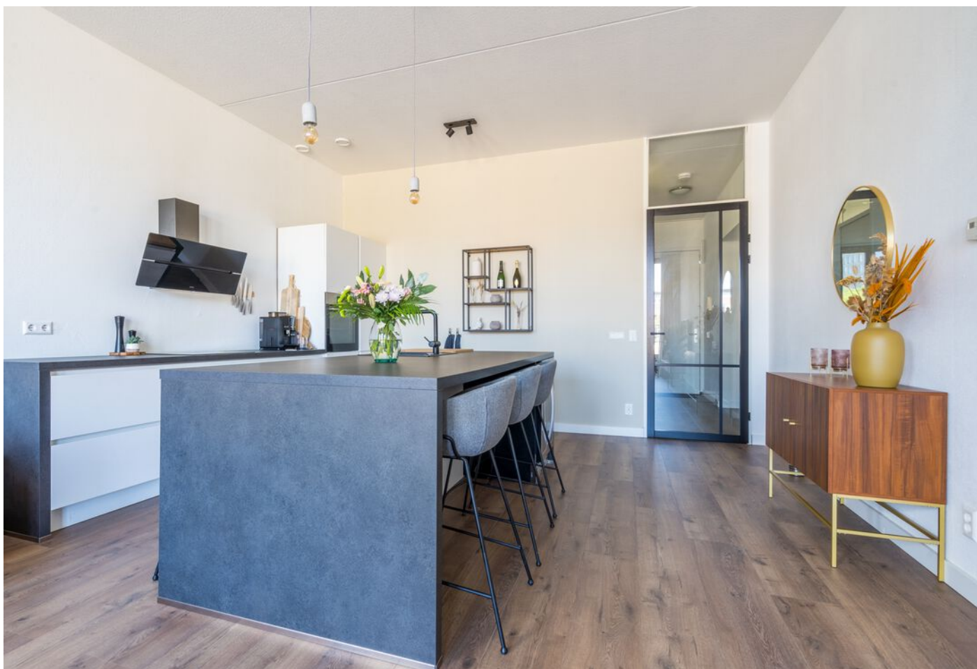
Statenlaan 177, 's-Hertogenbosch