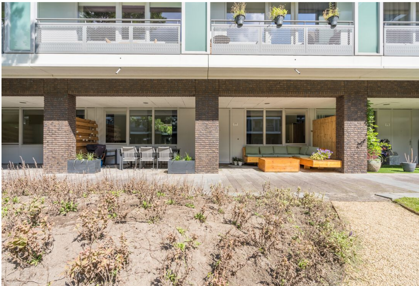
Statenlaan 177, 's-Hertogenbosch