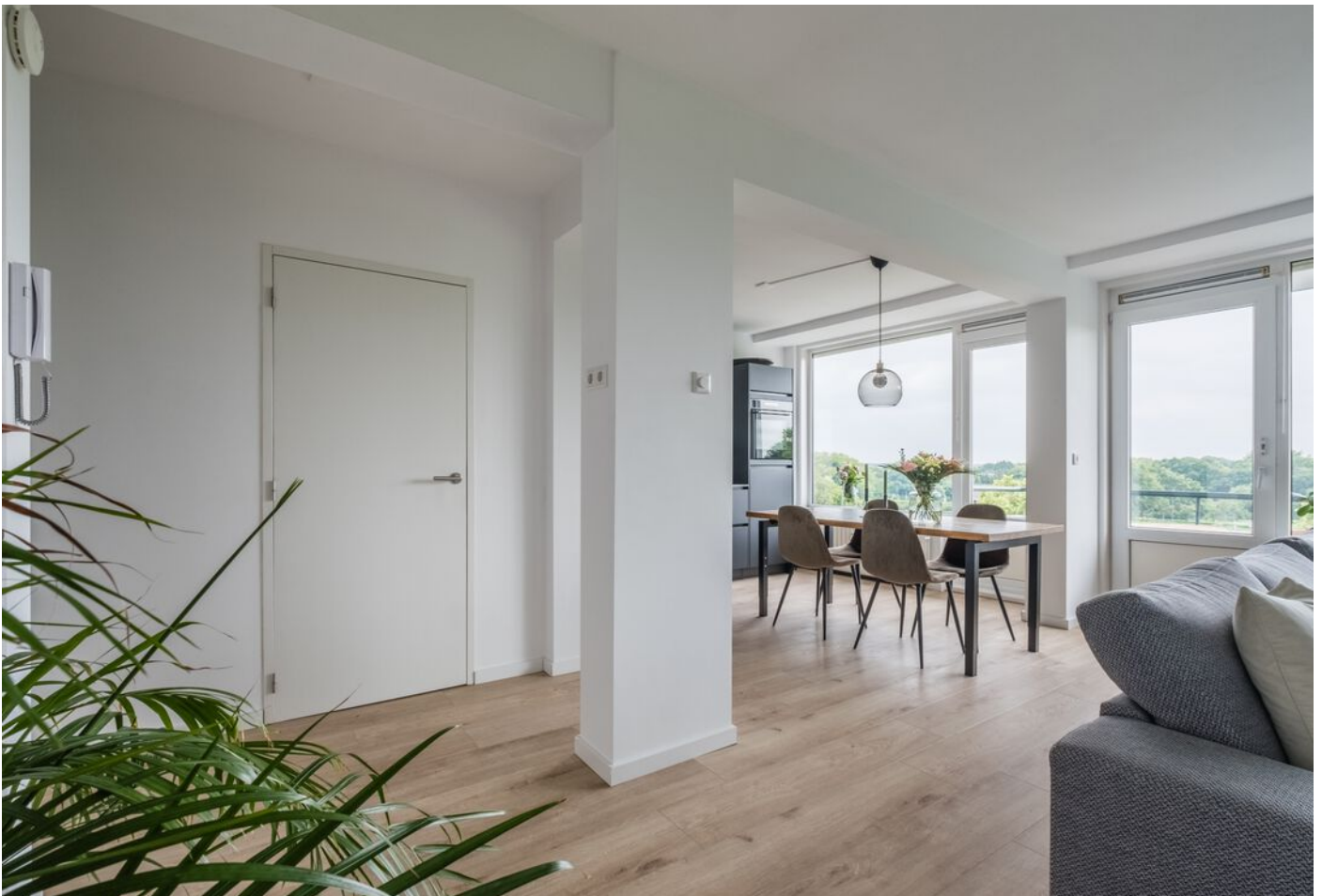
Stanleystraat 57, 's-Hertogenbosch