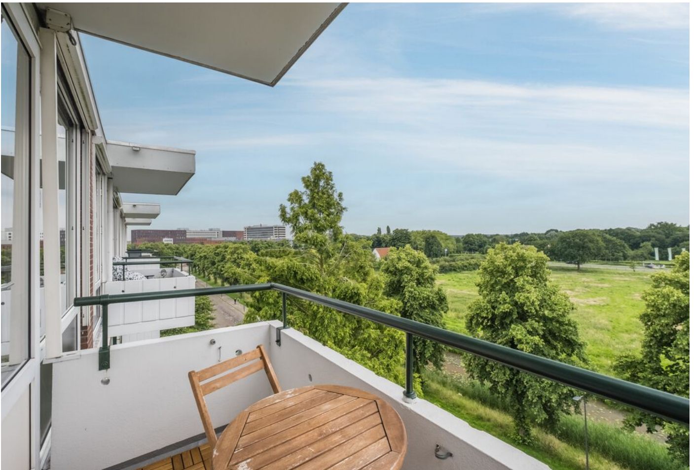
Stanleystraat 57, 's-Hertogenbosch