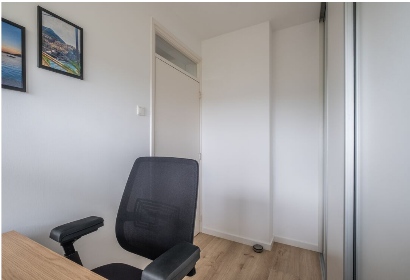
Stanleystraat 57, 's-Hertogenbosch