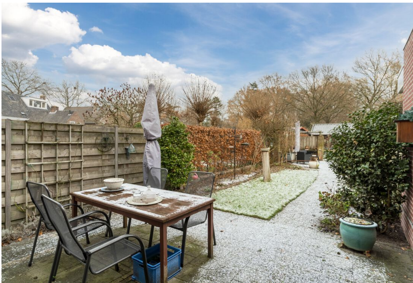
Repelweg 17, Vught