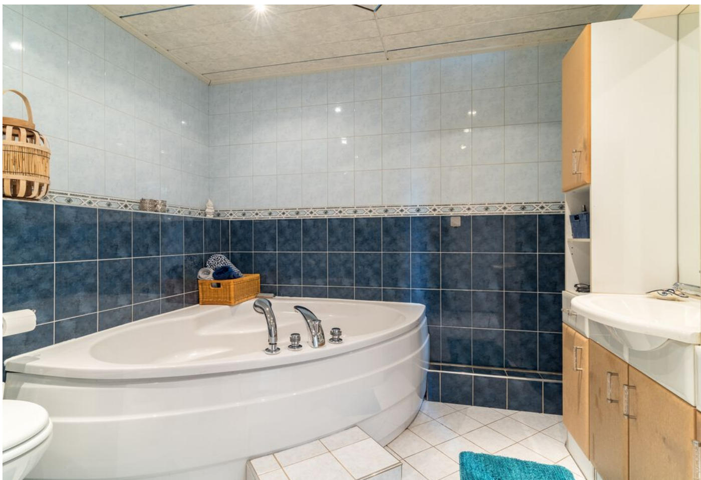
Repelweg 17, Vught