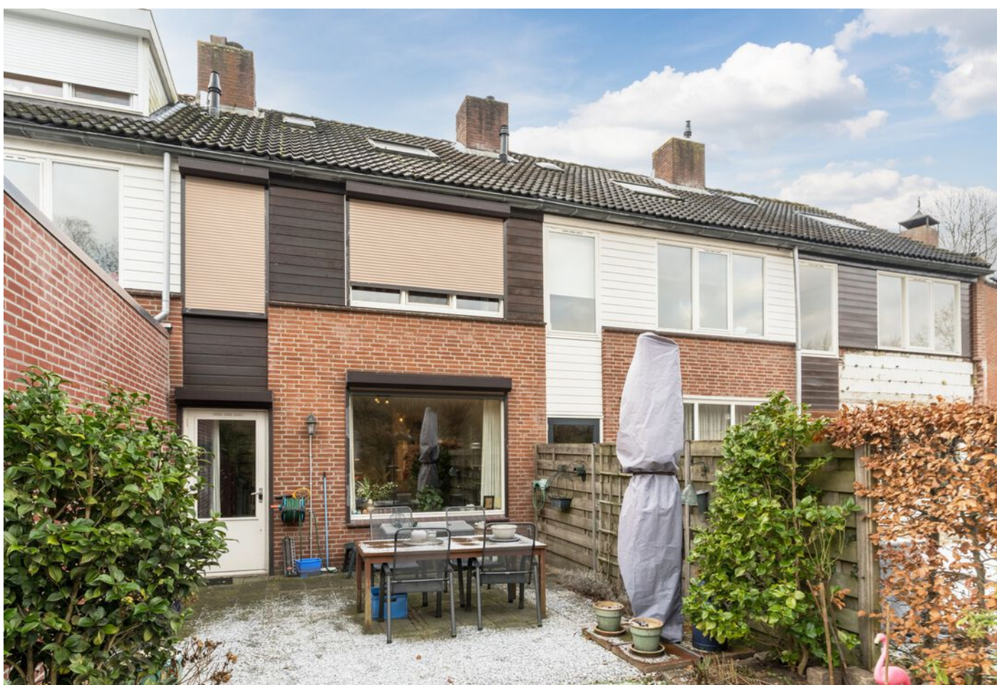
Repelweg 17, Vught