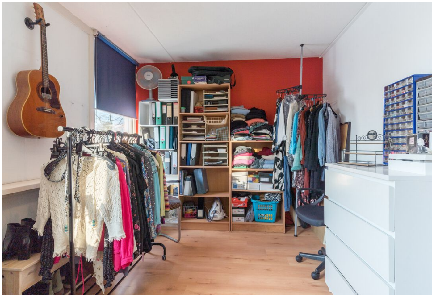
Repelweg 17, Vught