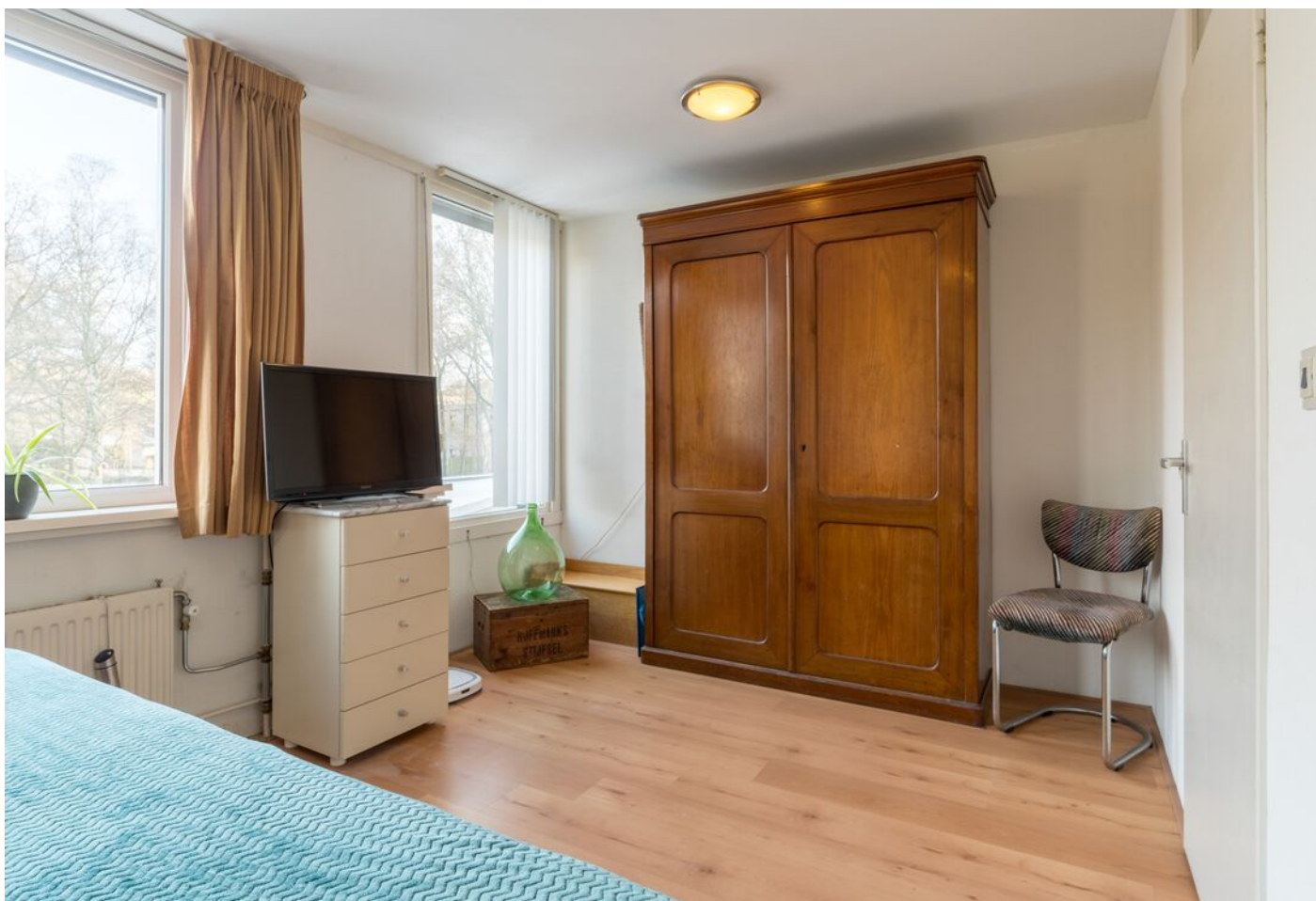
Repelweg 17, Vught