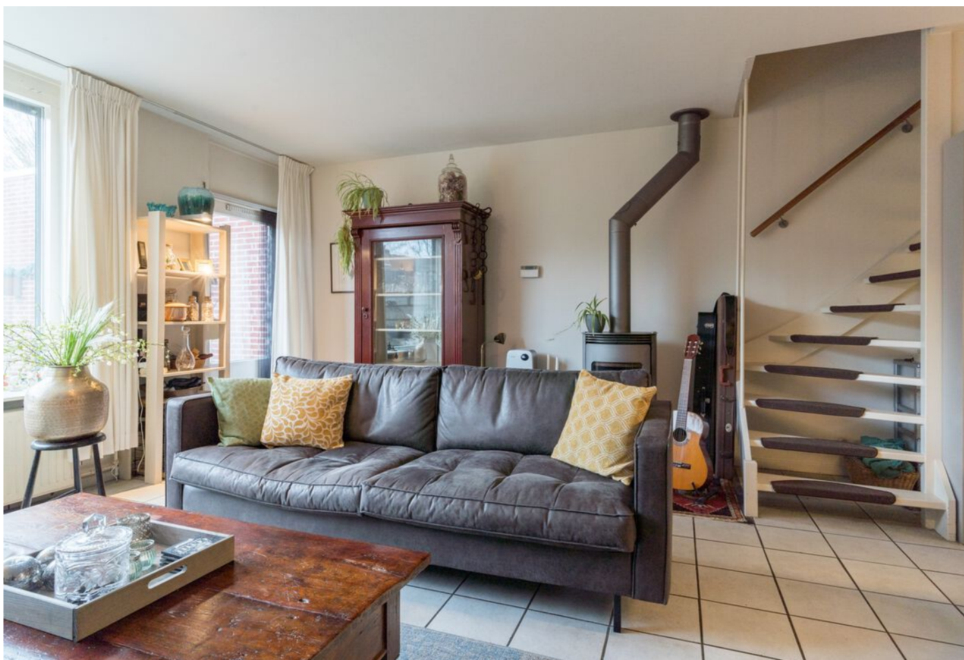
Repelweg 17, Vught