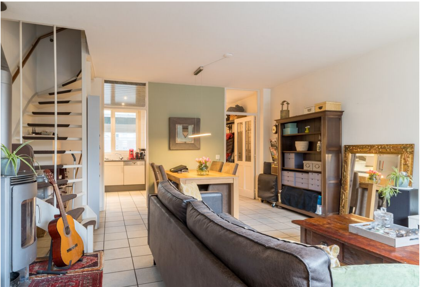
Repelweg 17, Vught