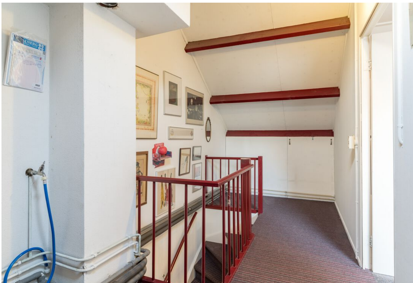
Repelweg 17, Vught