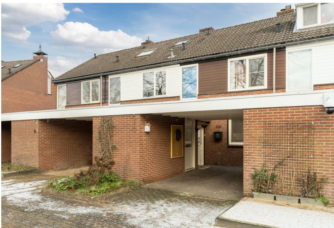
Repelweg 17, Vught