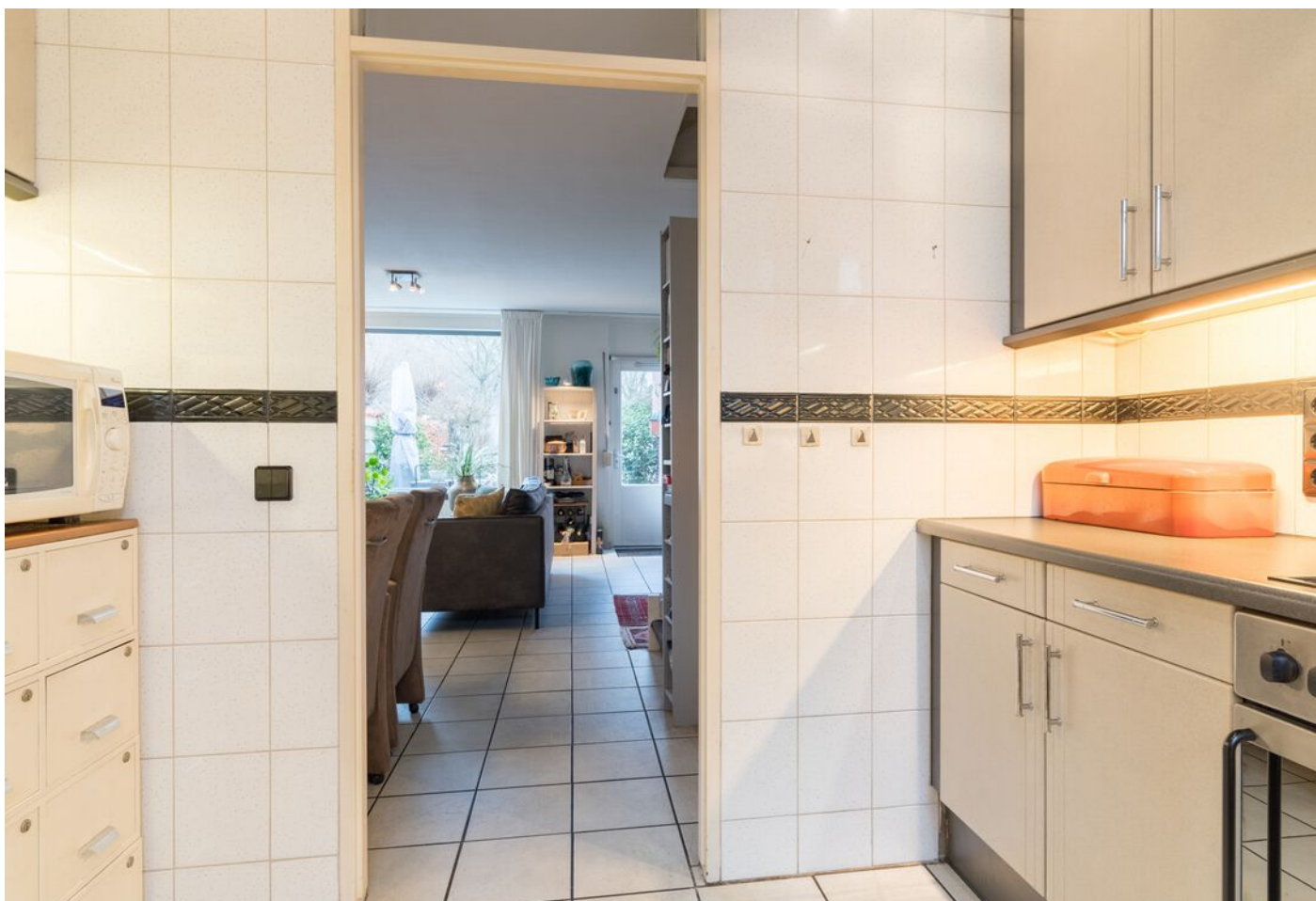
Repelweg 17, Vught