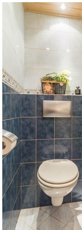
Repelweg 17, Vught