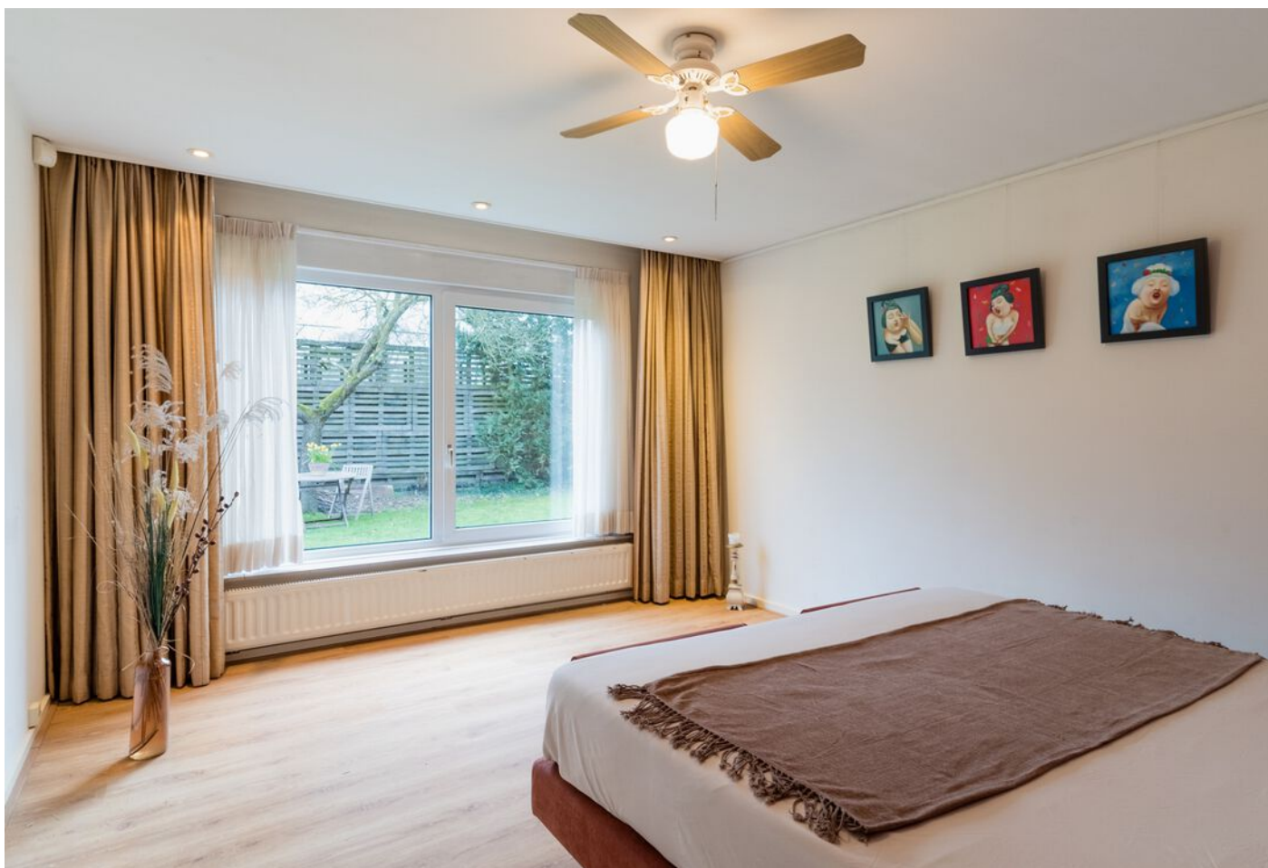
Pieter Bruegelstraat 22, Vlijmen