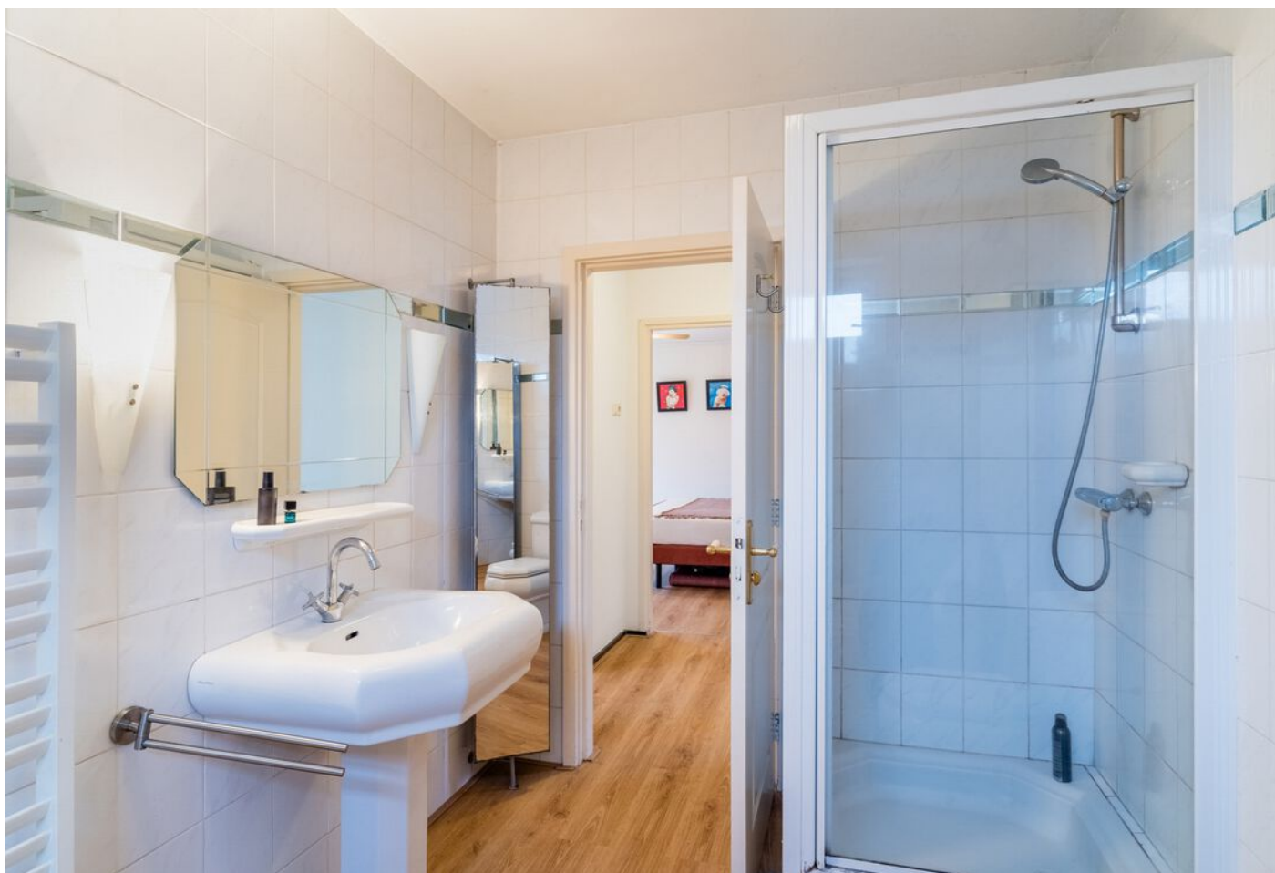
Pieter Bruegelstraat 22, Vlijmen