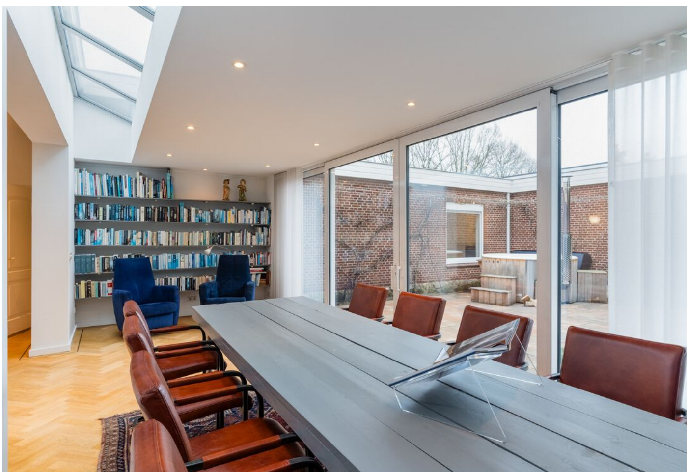
Pieter Bruegelstraat 22, Vlijmen