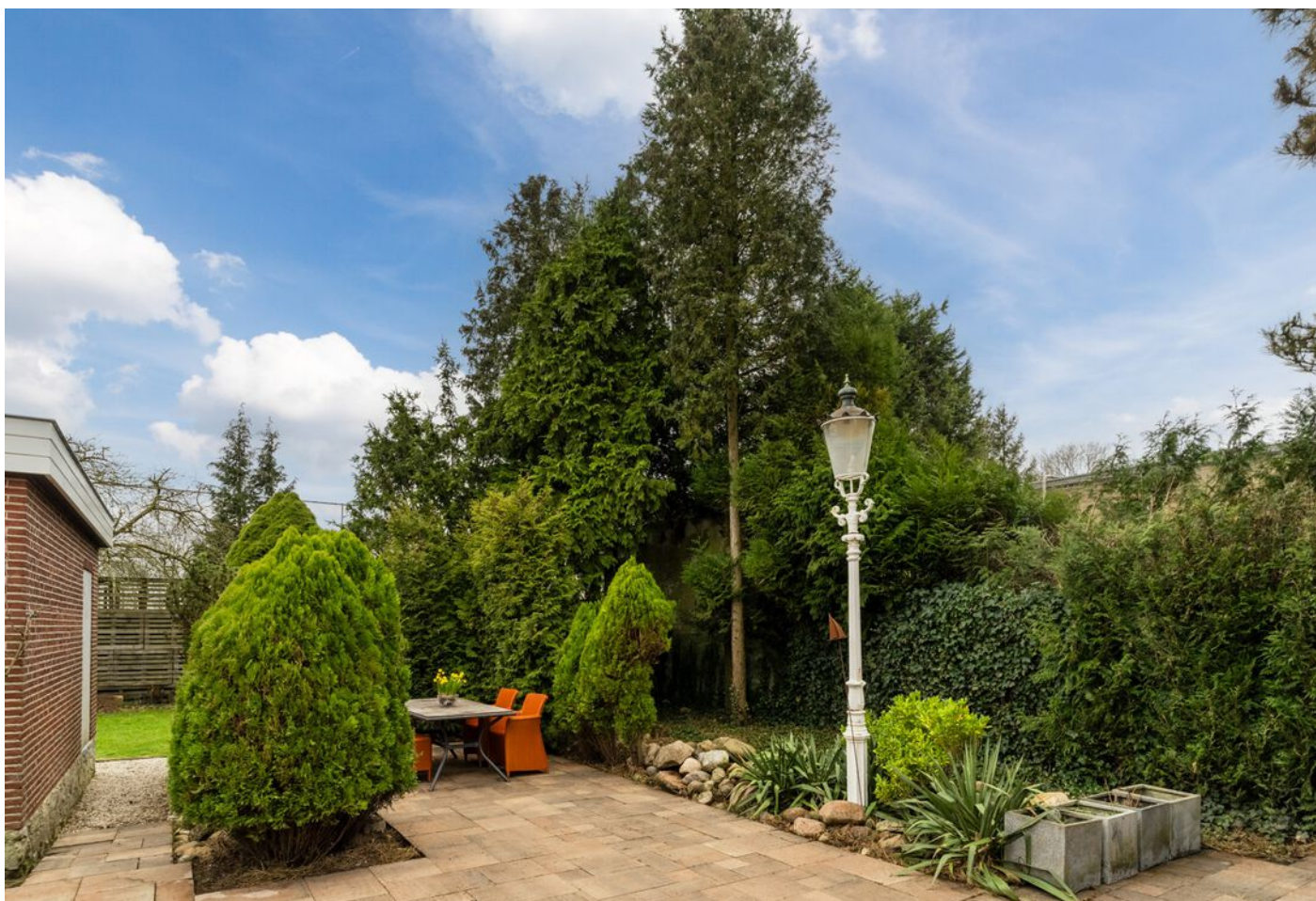
Pieter Bruegelstraat 22, Vlijmen