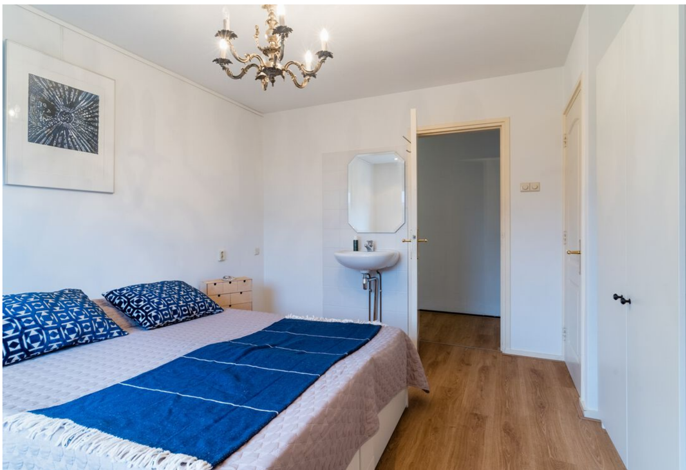
Pieter Bruegelstraat 22, Vlijmen