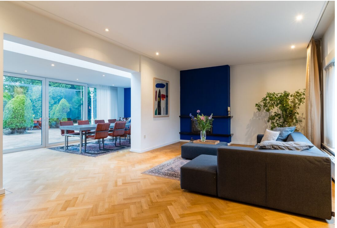
Pieter Bruegelstraat 22, Vlijmen