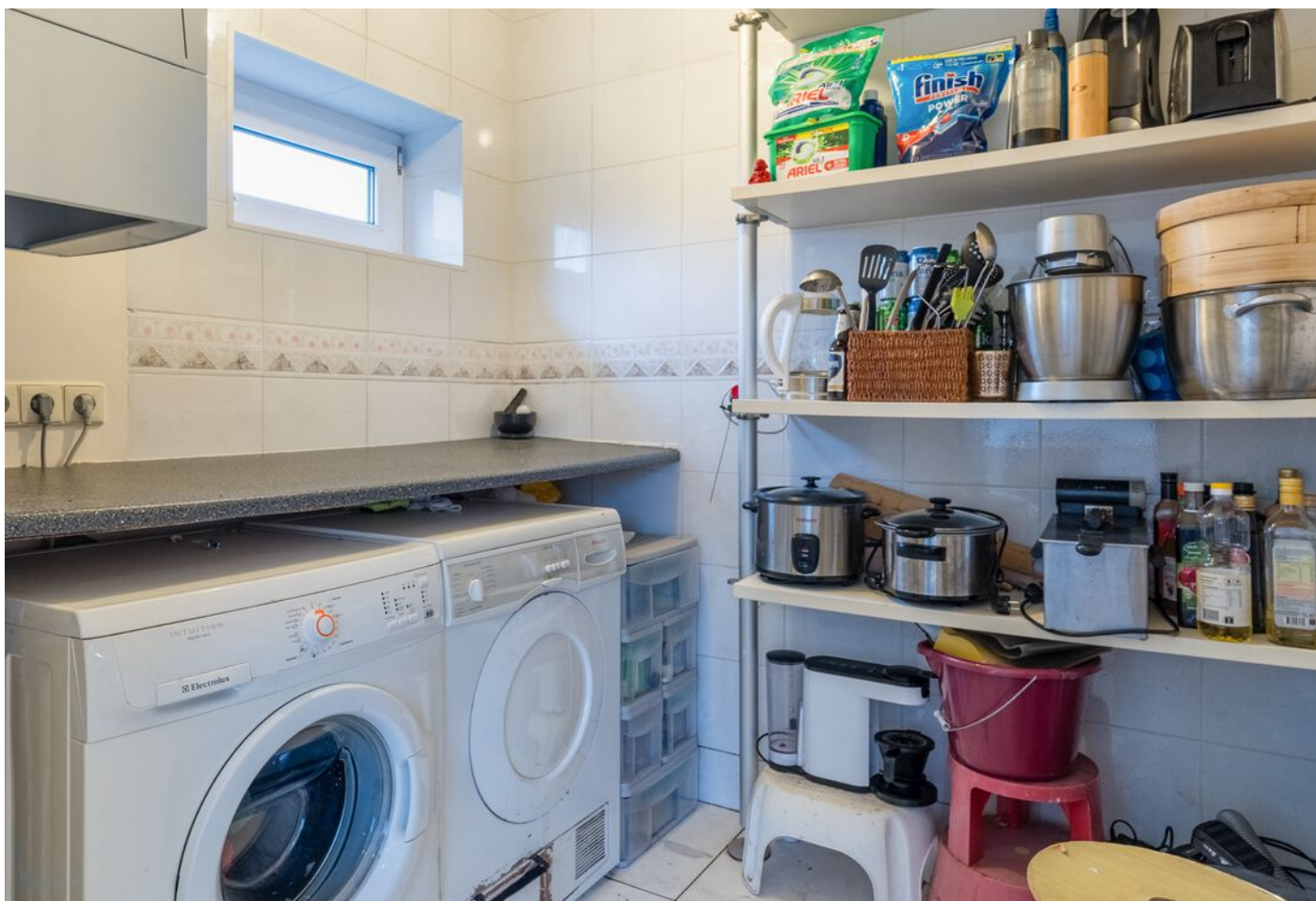
Pieter Bruegelstraat 22, Vlijmen