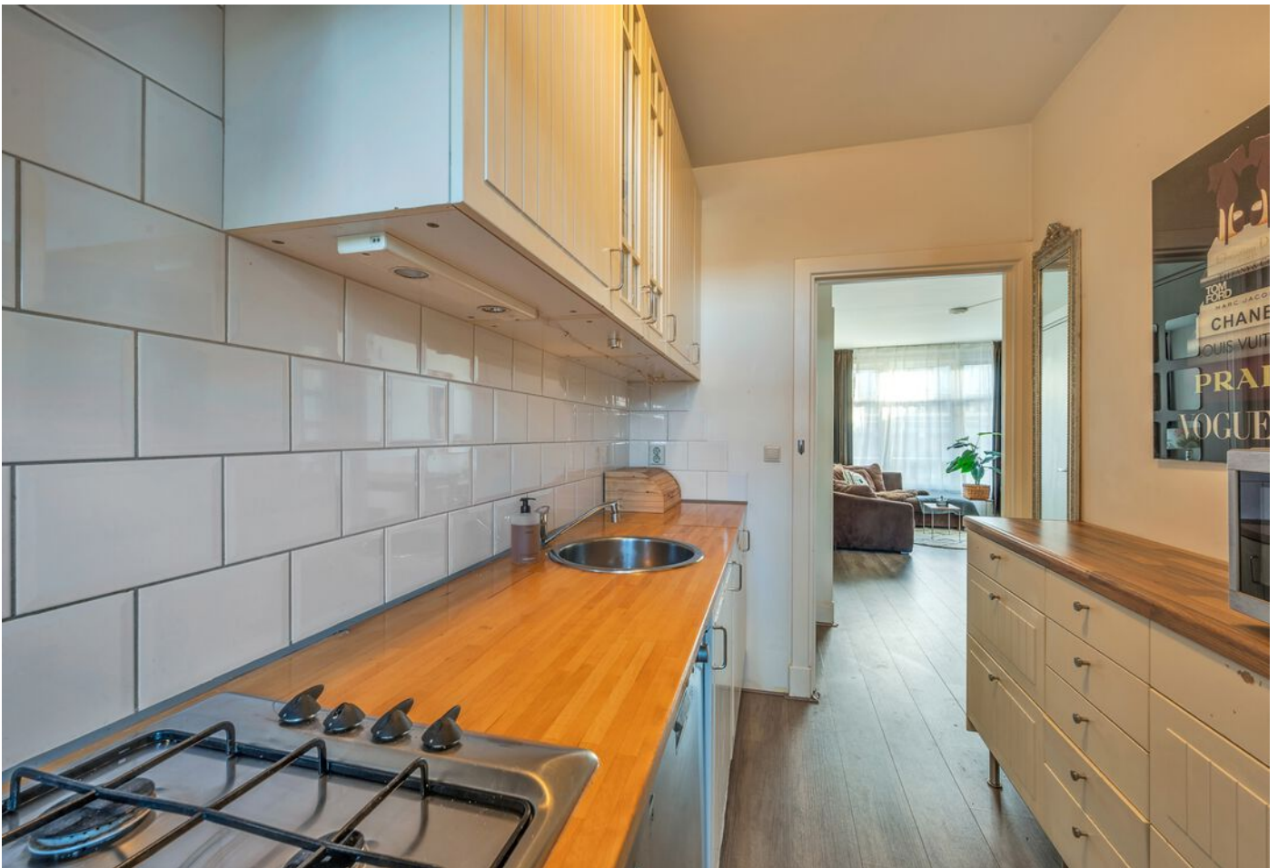
Pieter Aertszstraat 123 b, Amsterdam