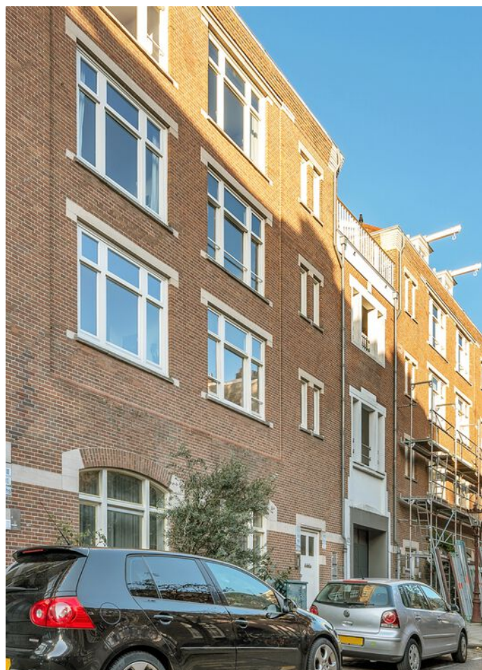
Pieter Aertszstraat 123 b, Amsterdam