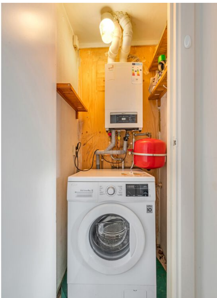
Pieter Aertszstraat 123 b, Amsterdam