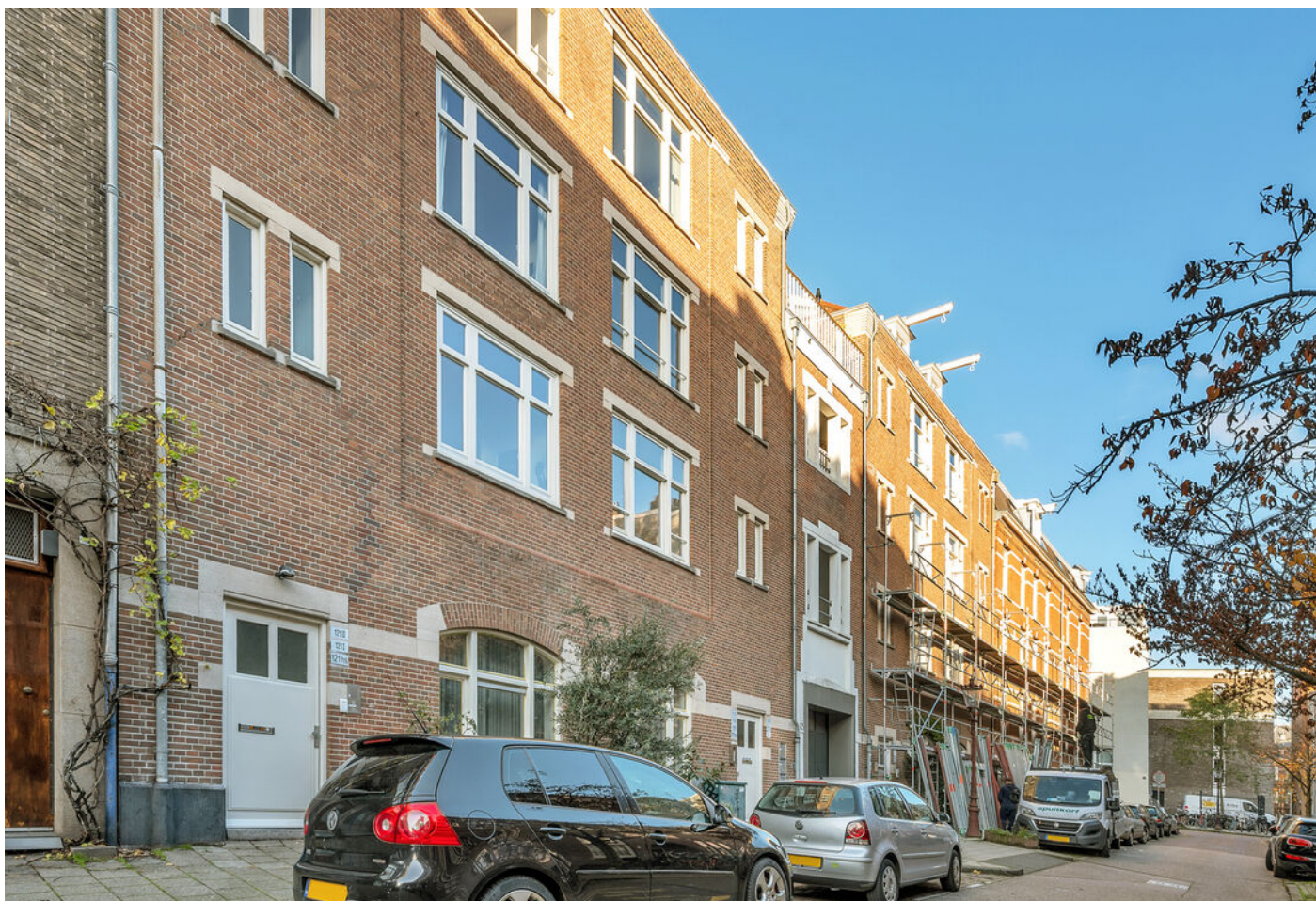
Pieter Aertszstraat 123 b, Amsterdam