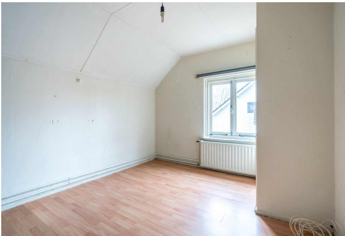
Pastoor Hordijkstraat 3, Rosmalen