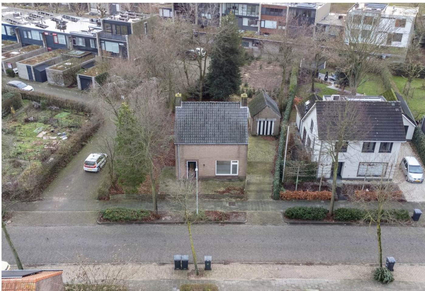
Pastoor Hordijkstraat 3, Rosmalen