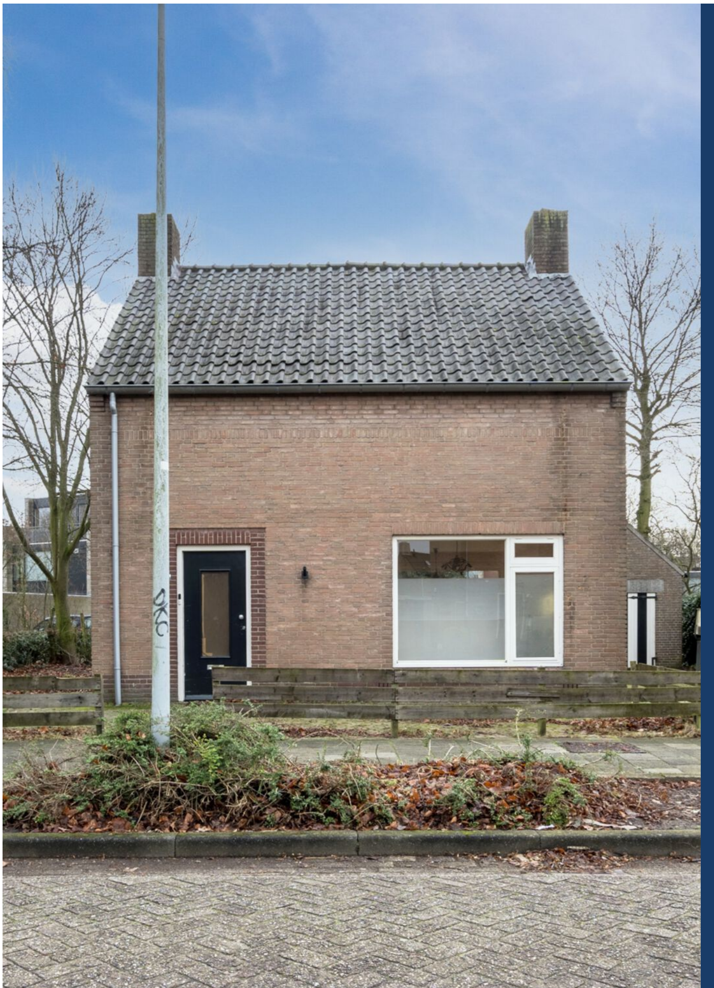
Pastoor Hordijkstraat 3, Rosmalen