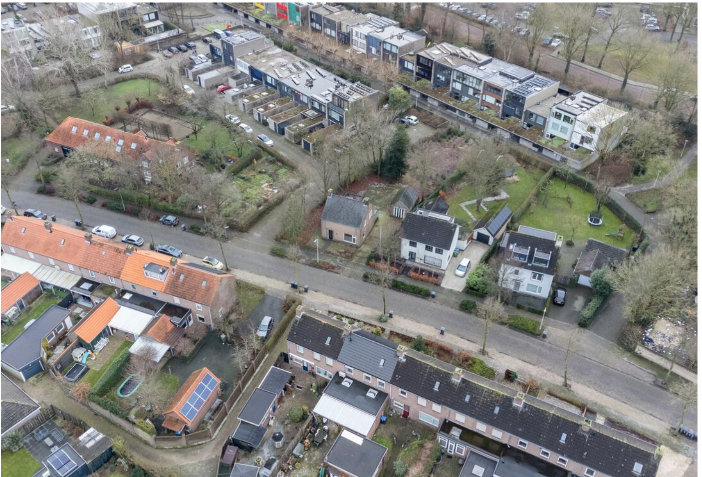
Pastoor Hordijkstraat 3, Rosmalen