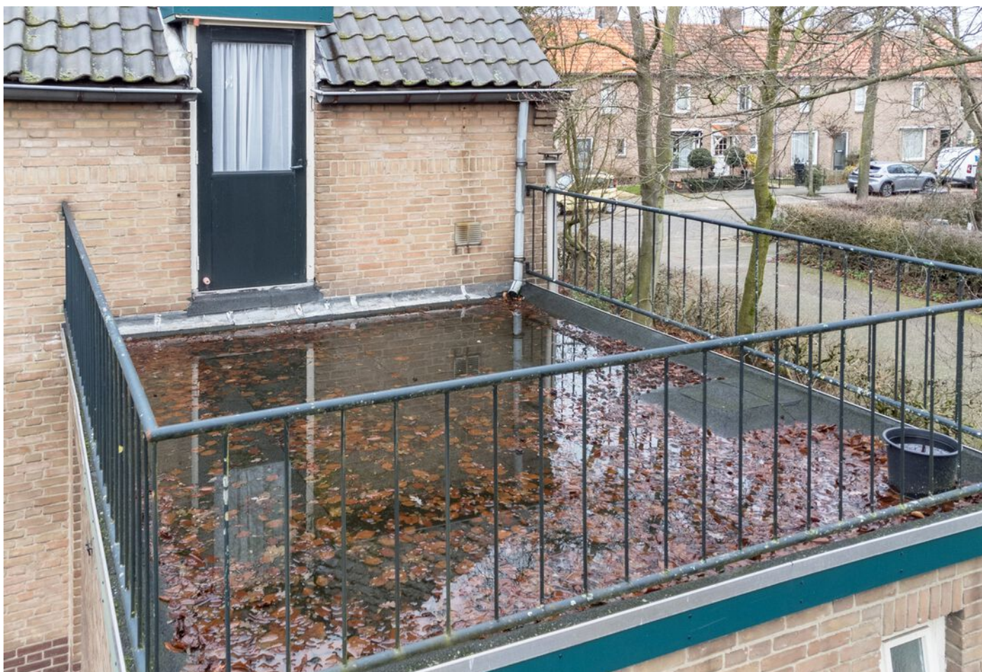
Pastoor Hordijkstraat 3, Rosmalen