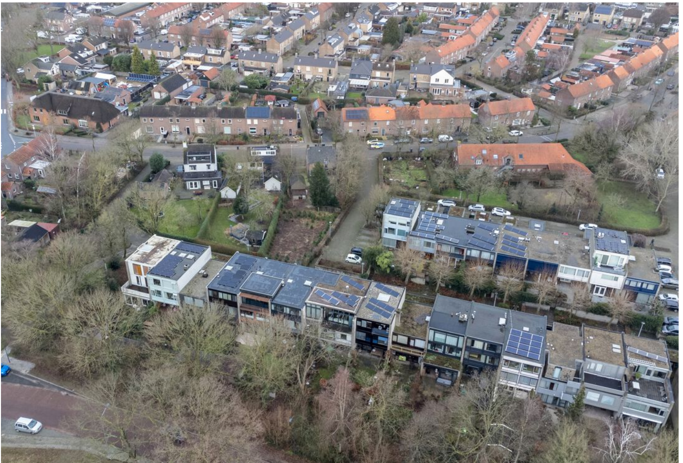
Pastoor Hordijkstraat 3, Rosmalen