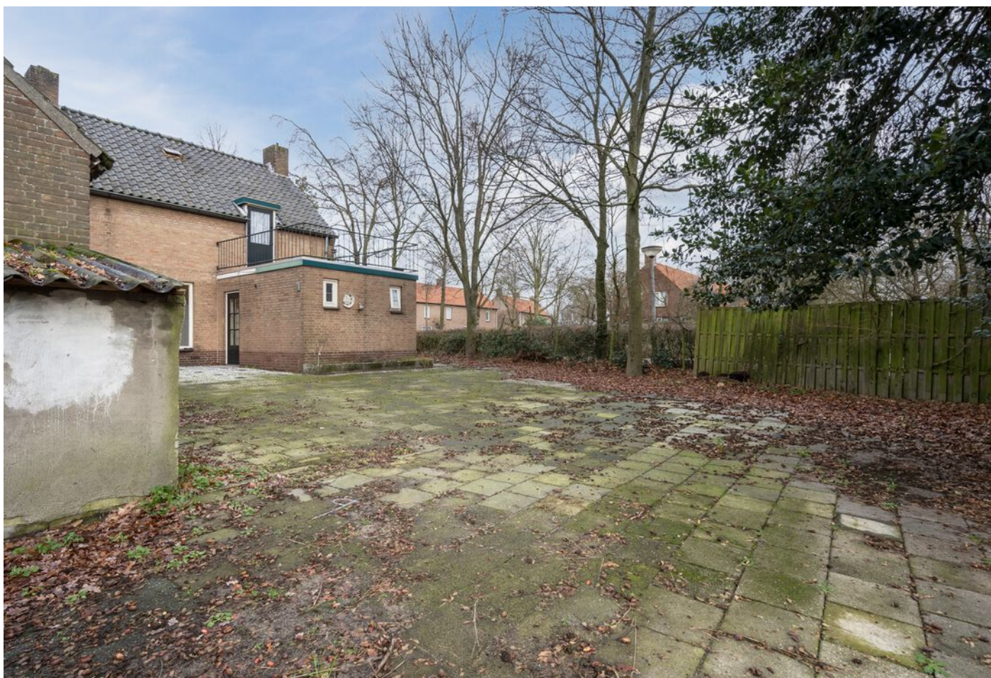
Pastoor Hordijkstraat 3, Rosmalen