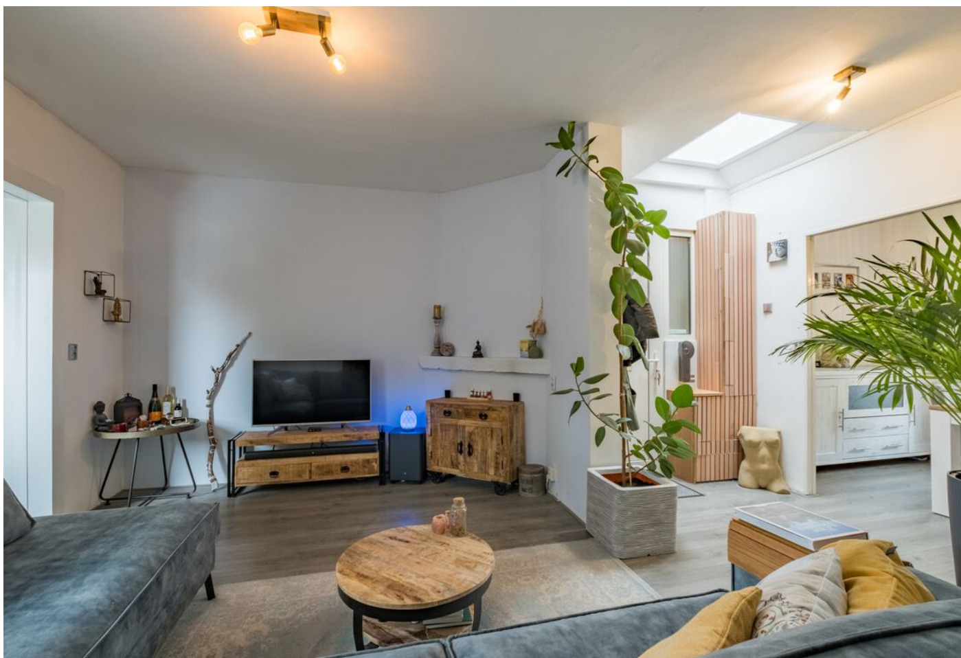
Maastrichtseweg 39, 's-Hertogenbosch