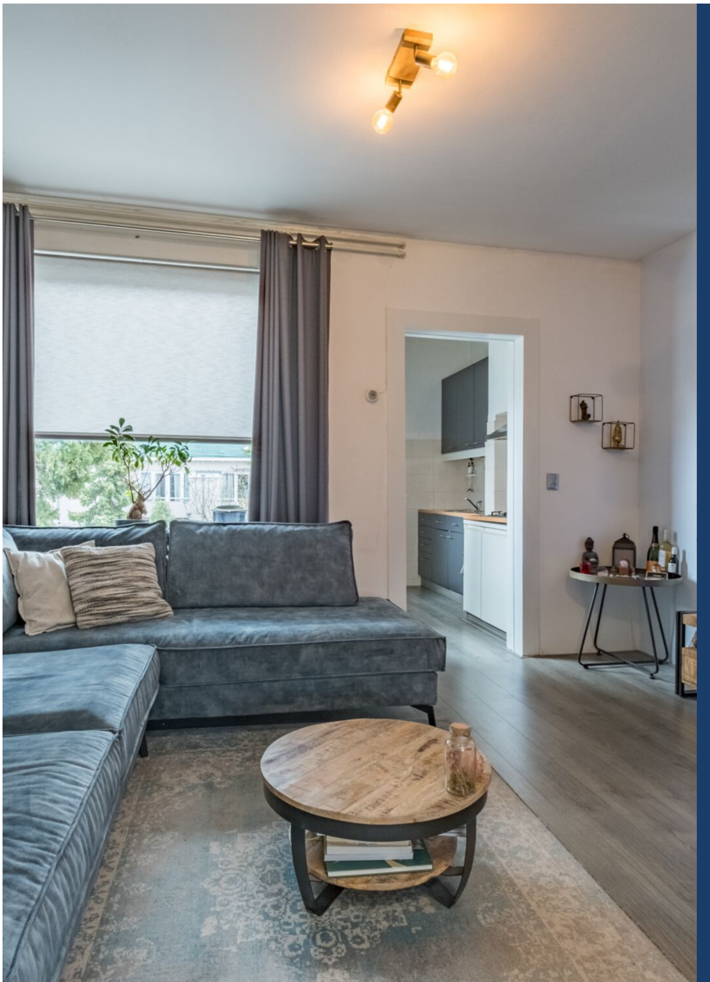
Maastrichtseweg 39, 's-Hertogenbosch