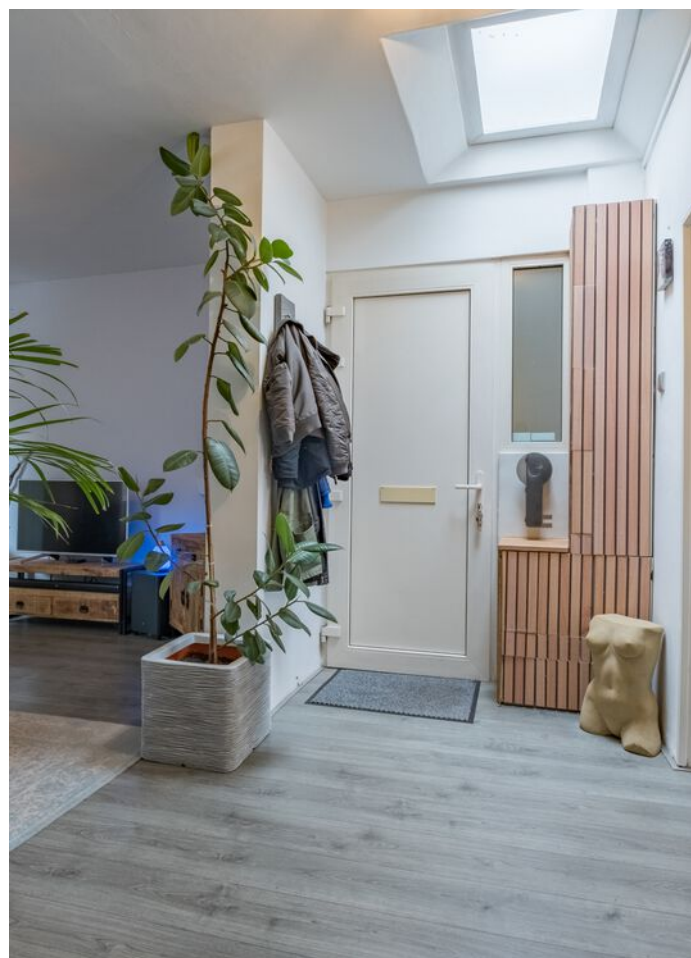
Maastrichtseweg 39, 's-Hertogenbosch