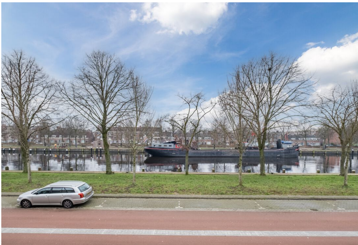
Maastrichtseweg 39, 's-Hertogenbosch