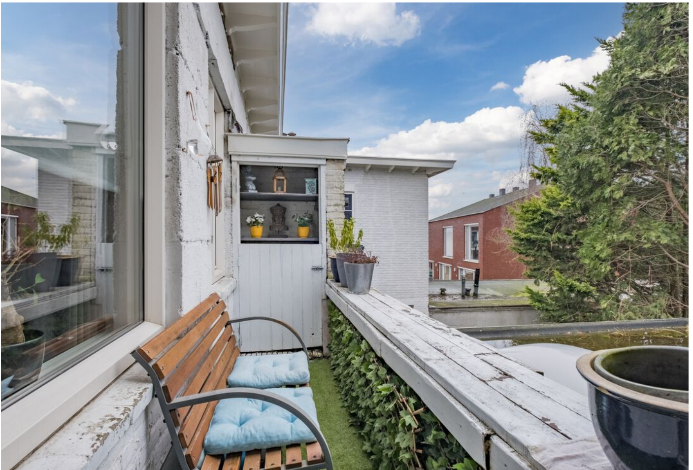
Maastrichtseweg 39, 's-Hertogenbosch