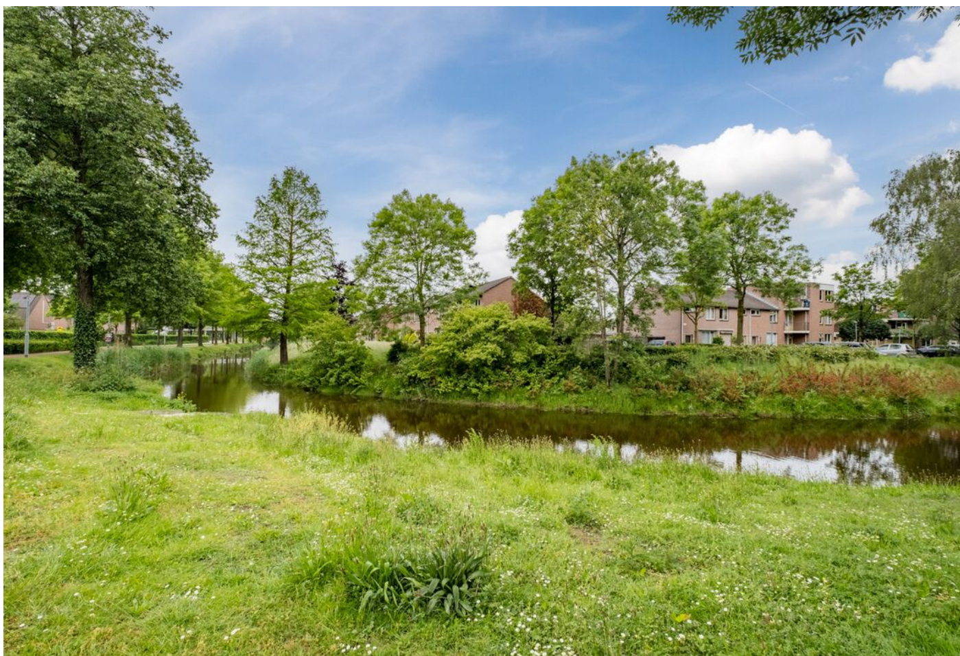
Lokerenpassage 46, 's-Hertogenbosch