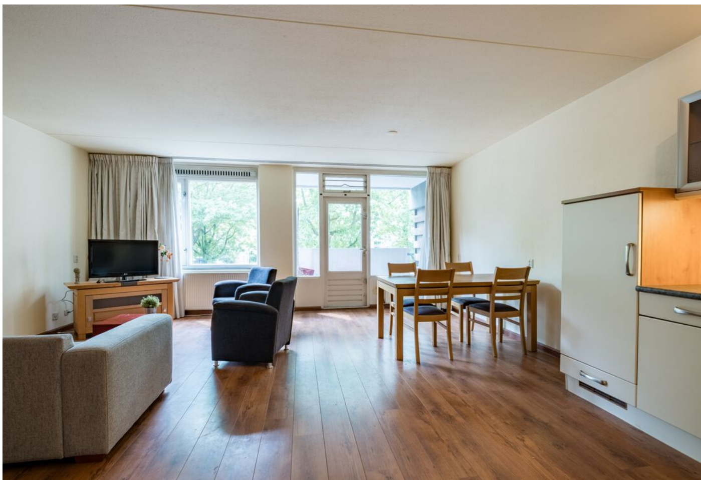
Lokerenpassage 46, 's-Hertogenbosch