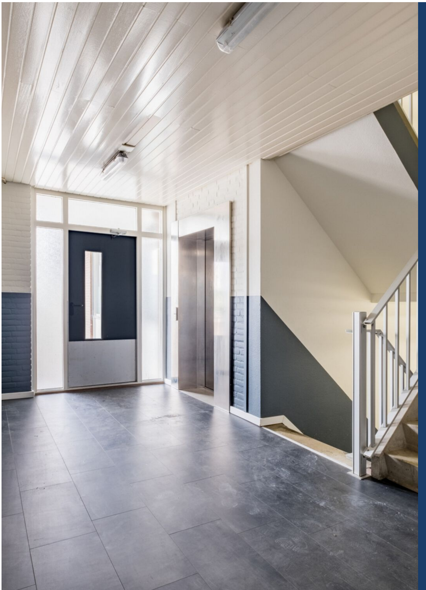
Lokerenpassage 46, 's-Hertogenbosch