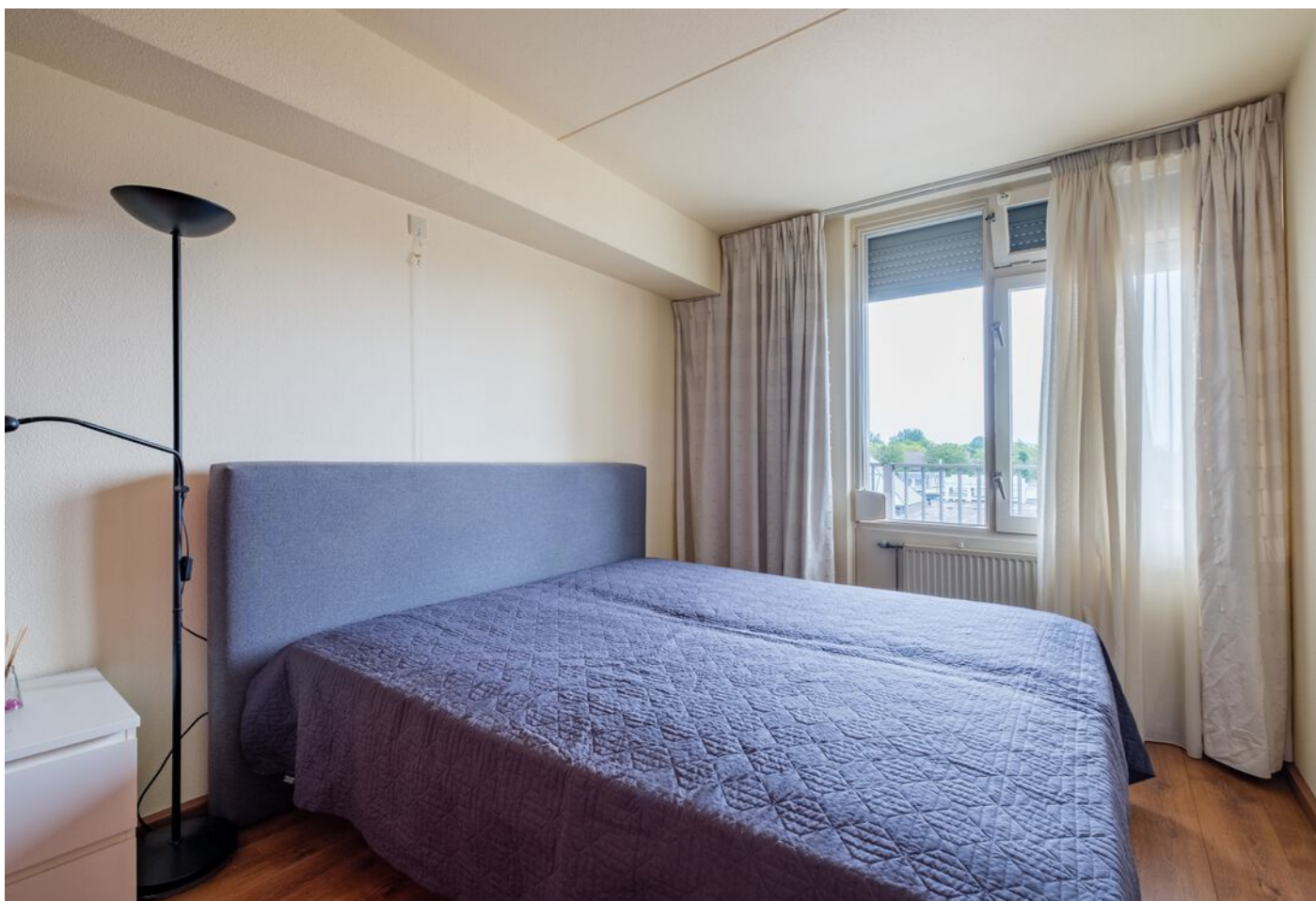
Lokerenpassage 46, 's-Hertogenbosch