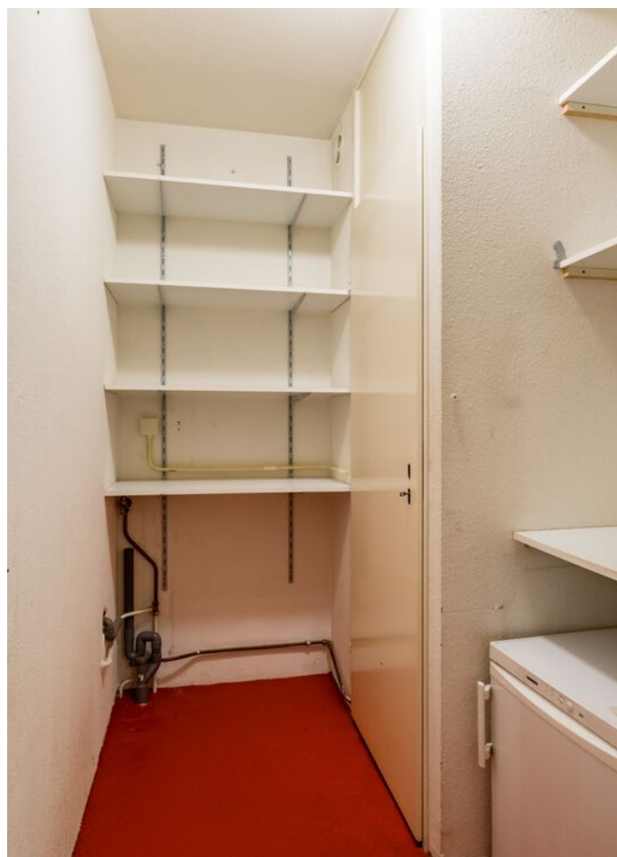
Lokerenpassage 46, 's-Hertogenbosch