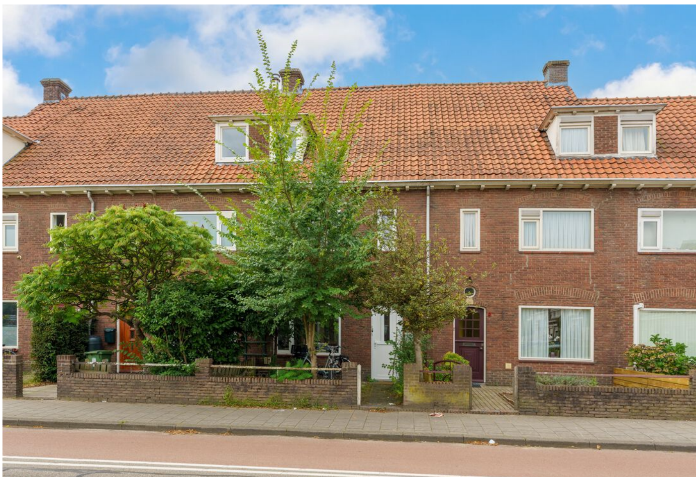
Lagelandstraat 11 A, 's-Hertogenbosch