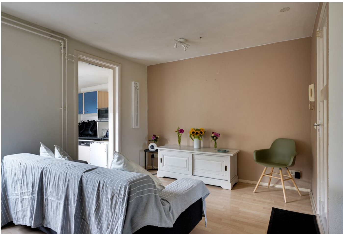
Lagelandstraat 11 A, 's-Hertogenbosch