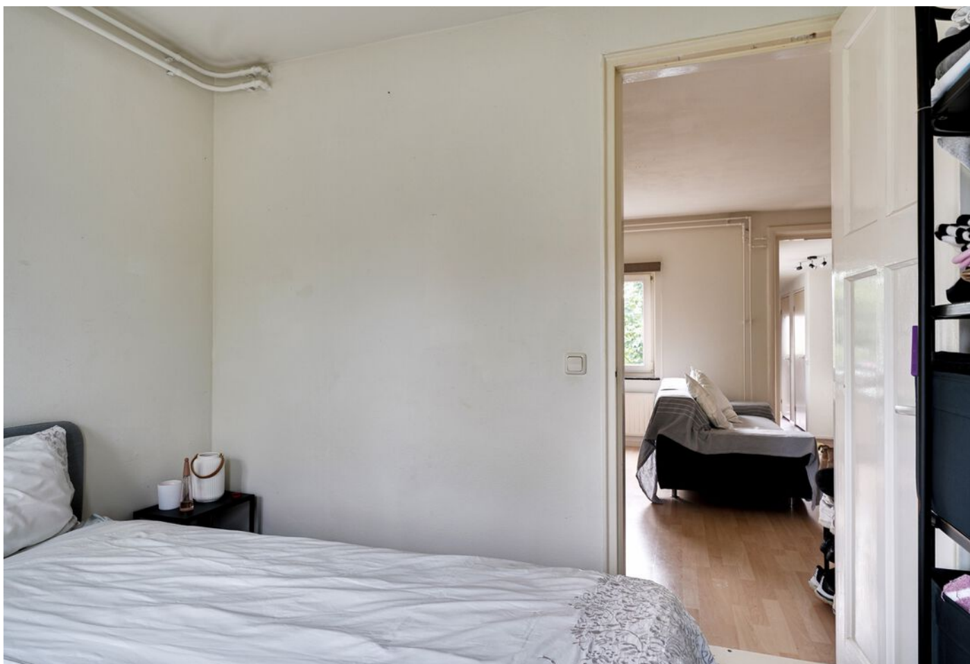
Lagelandstraat 11 A, 's-Hertogenbosch