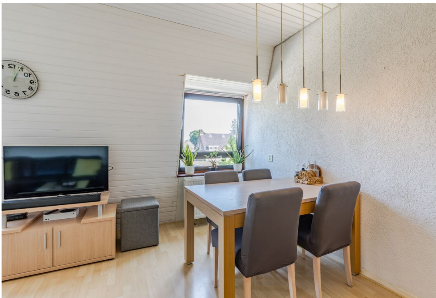
Laagstraat 282 a, Eindhoven