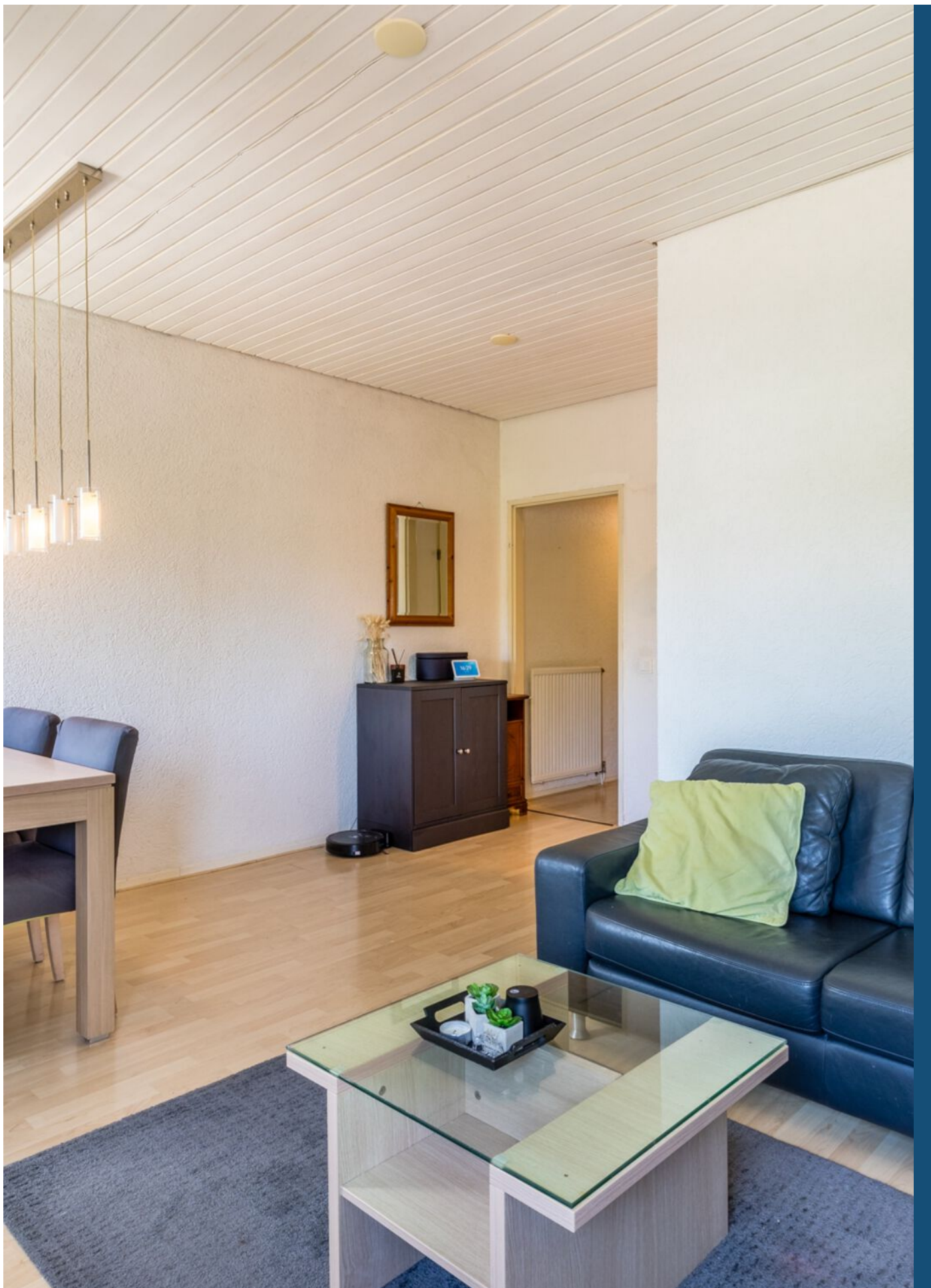
Laagstraat 282 a, Eindhoven