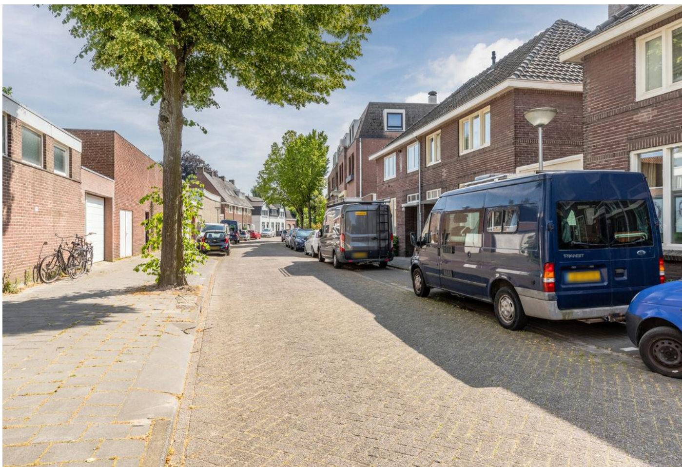
Laagstraat 282 a, Eindhoven