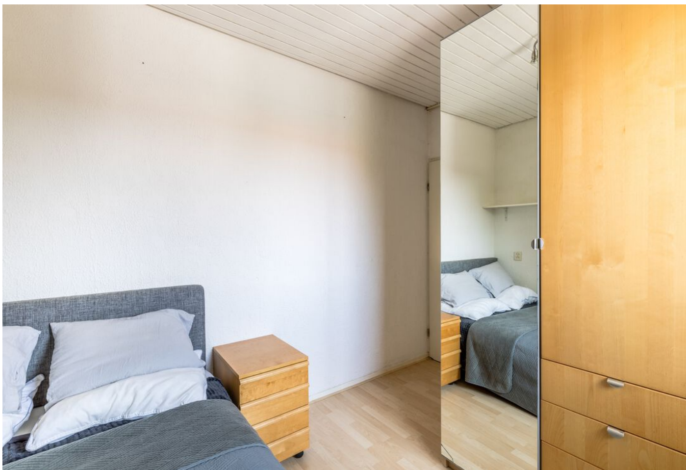
Laagstraat 282 a, Eindhoven