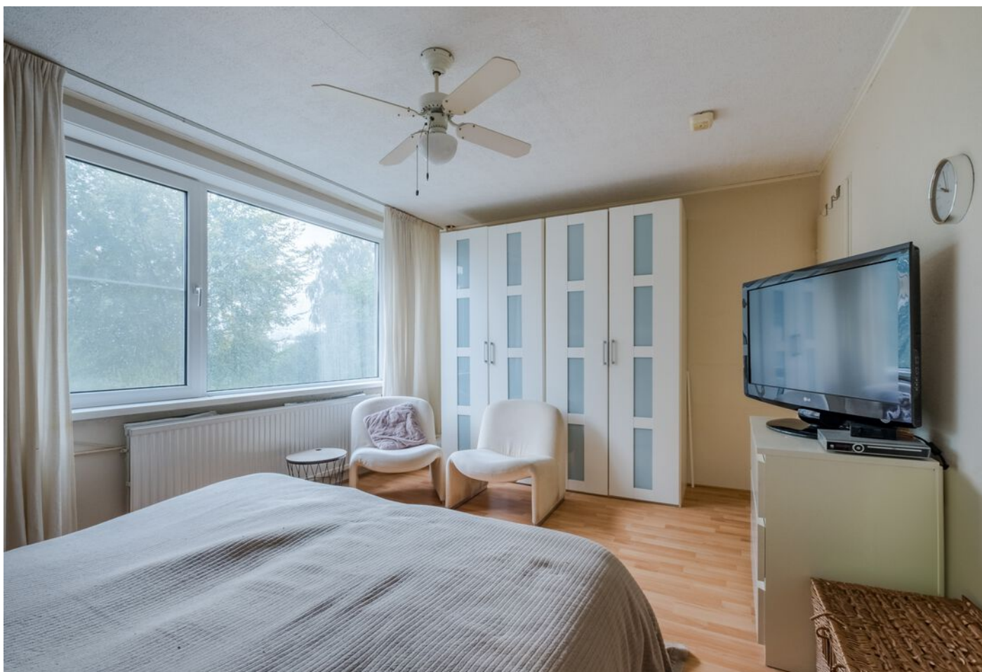
Koning Markweg 17, Eindhoven