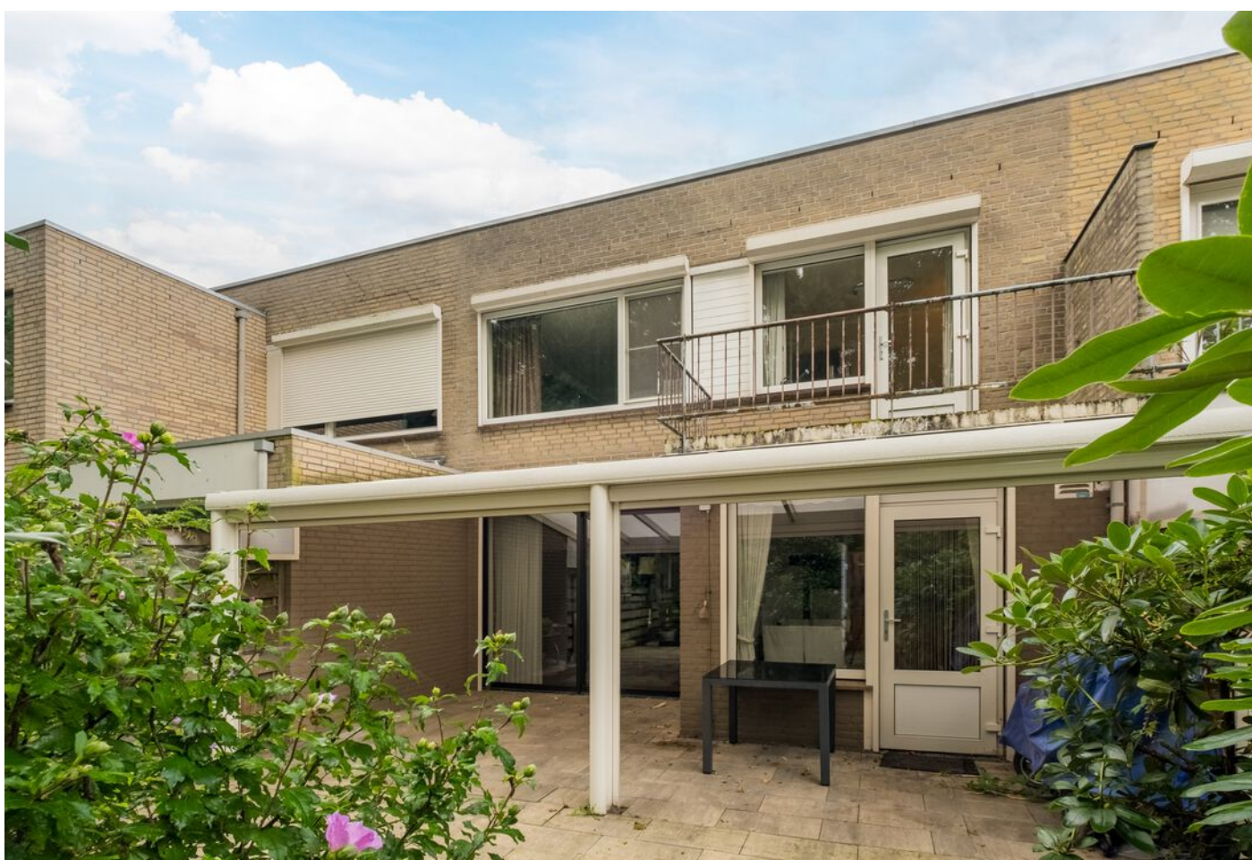
Koning Markweg 17, Eindhoven