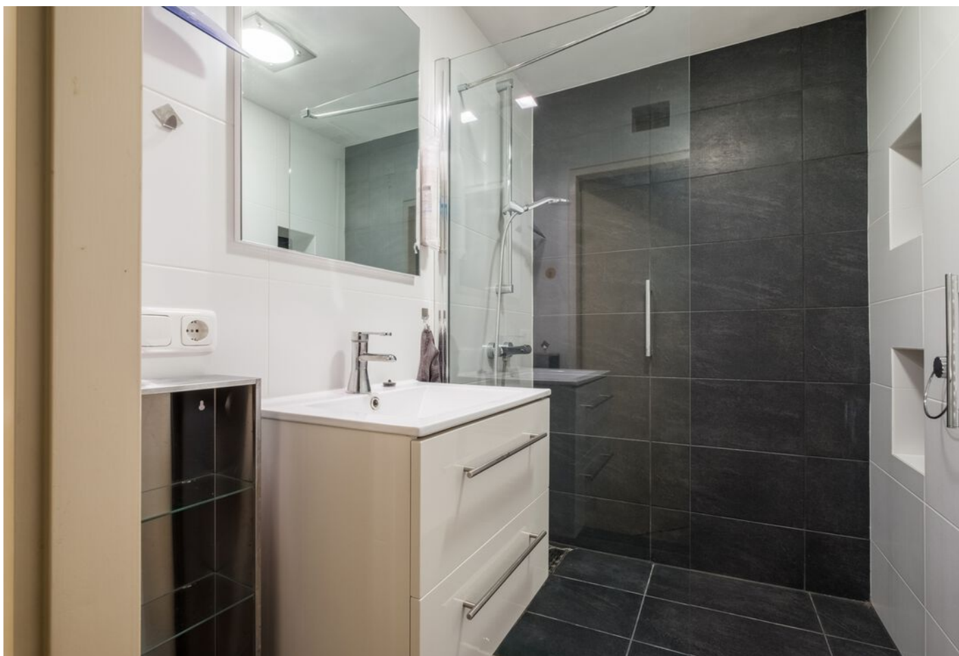
Koning Markweg 17, Eindhoven