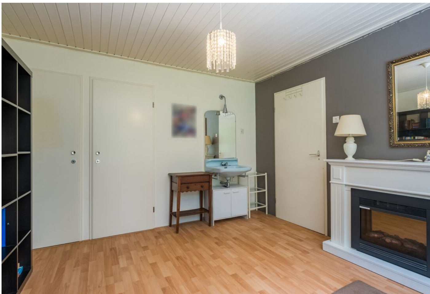
Koning Markweg 17, Eindhoven