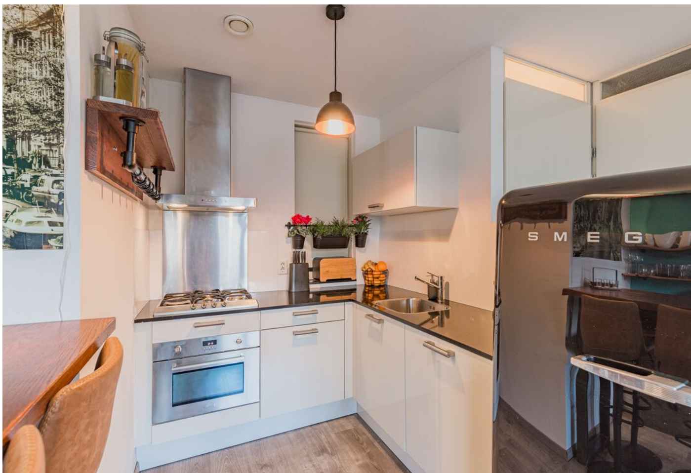
Kloosterdreef 14, Eindhoven