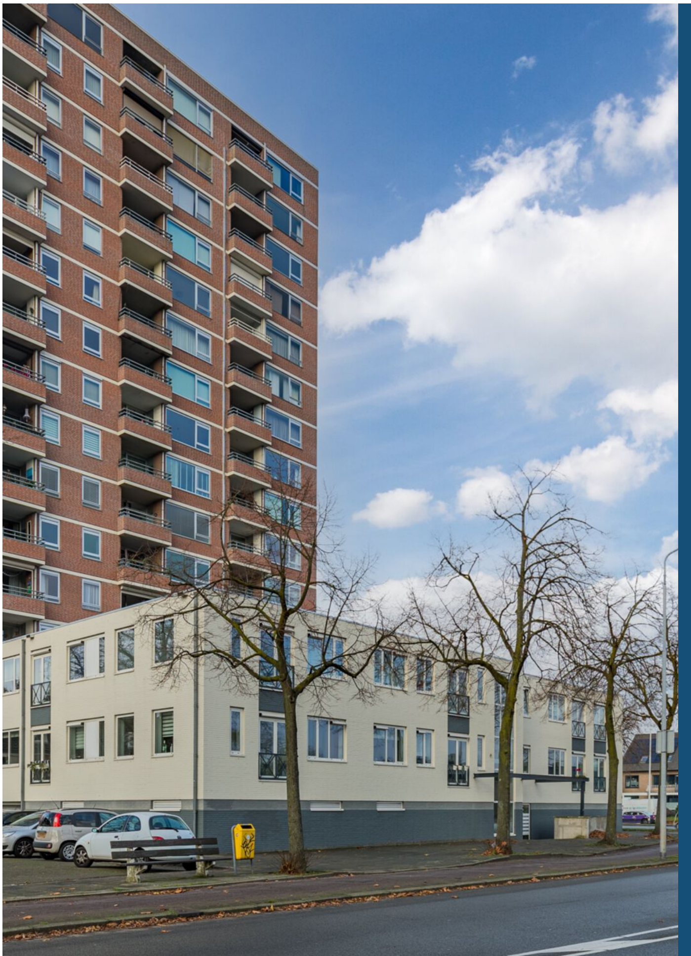
Kloosterdreef 14, Eindhoven