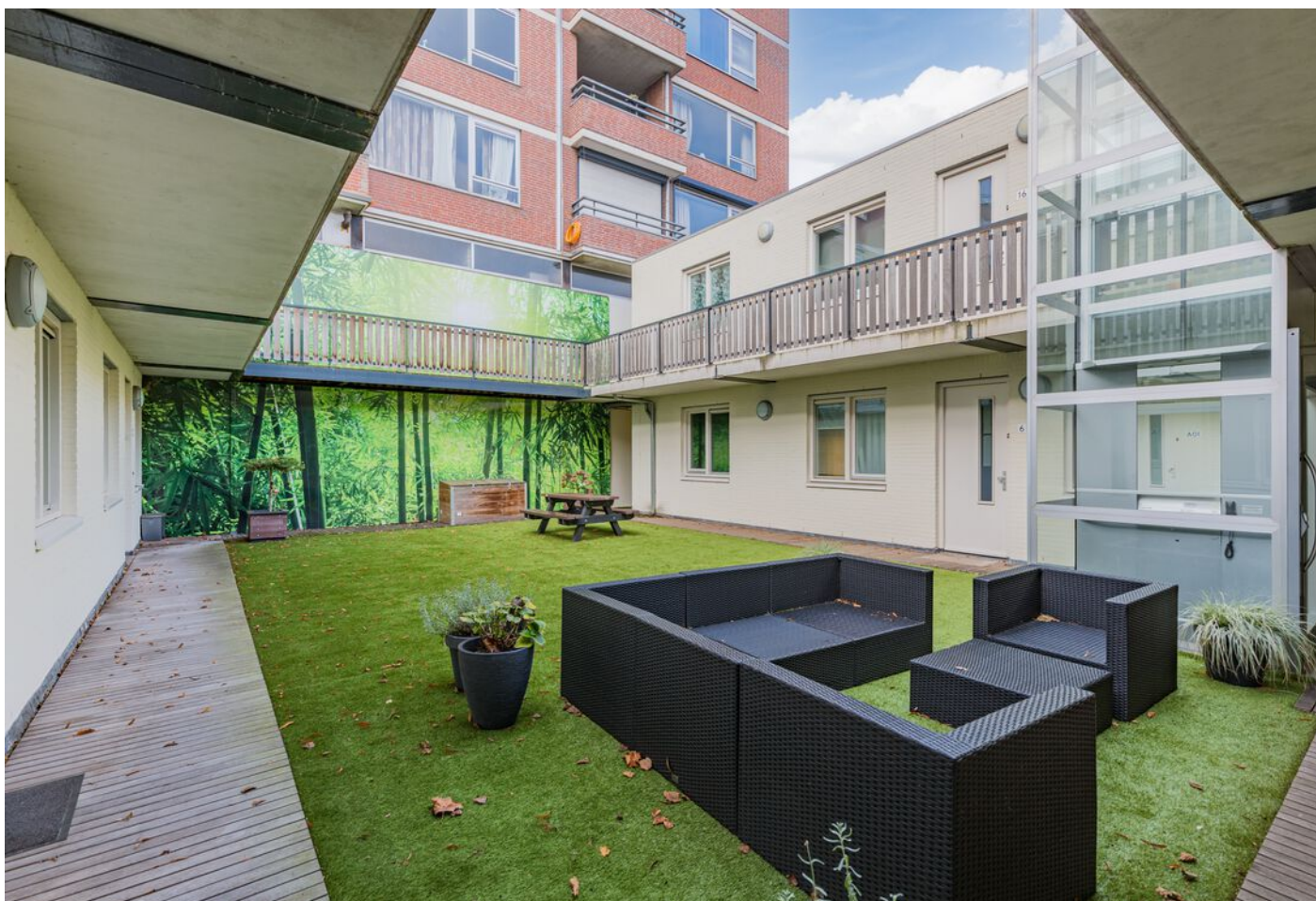
Kloosterdreef 14, Eindhoven