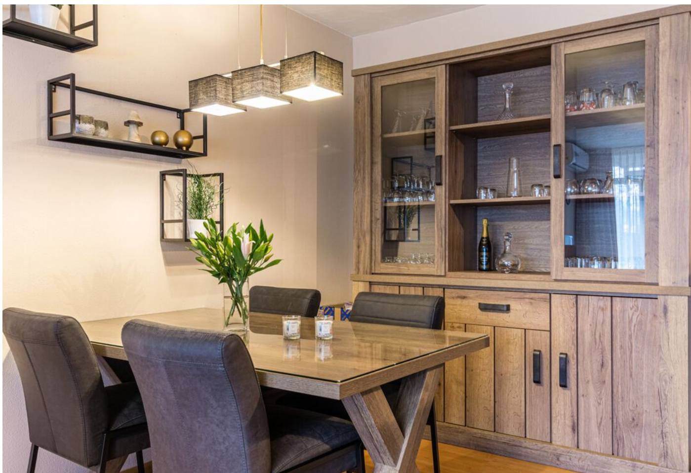
Kastelenplein 2, Eindhoven