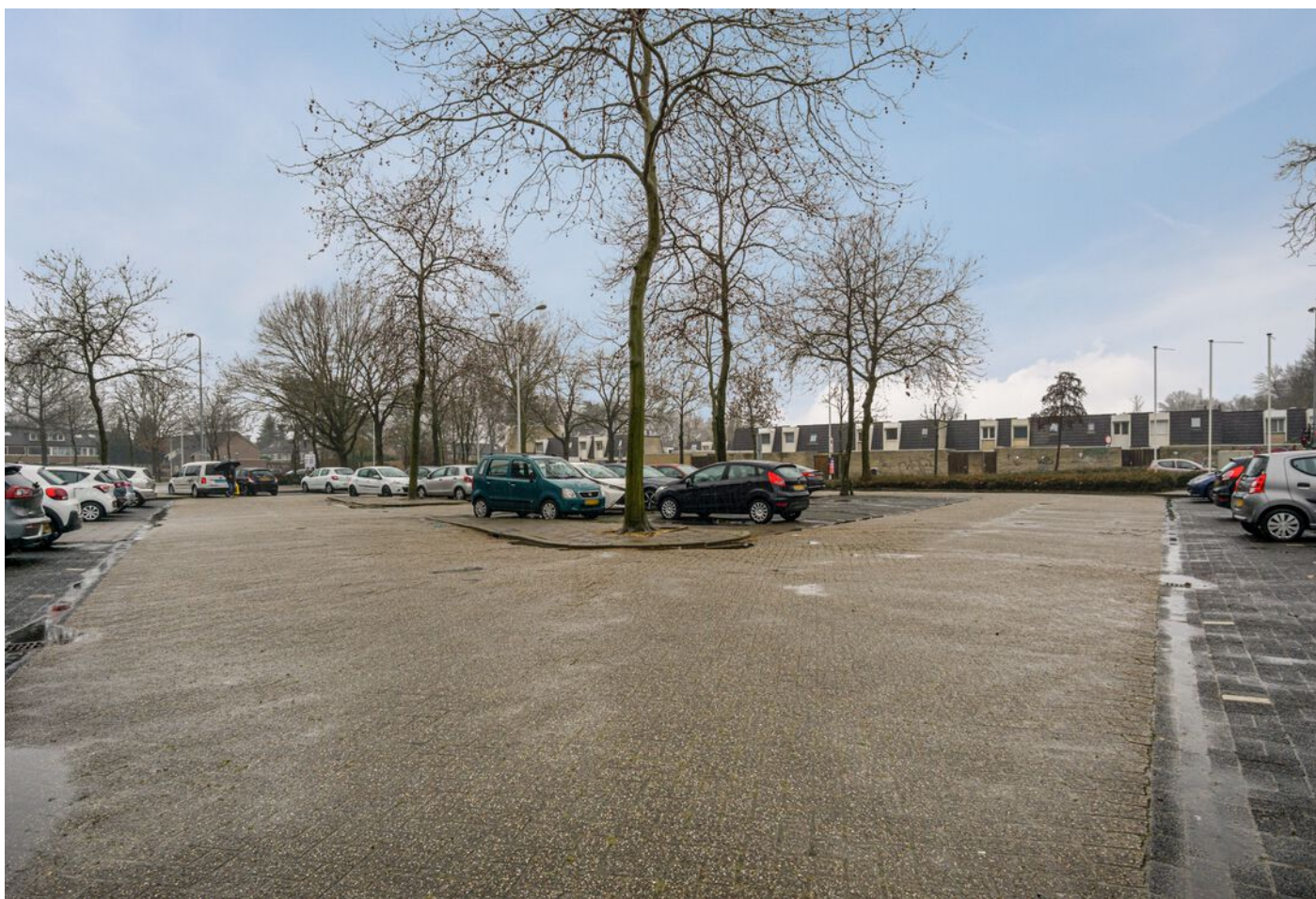
Kasteleplein 2, Eindhoven