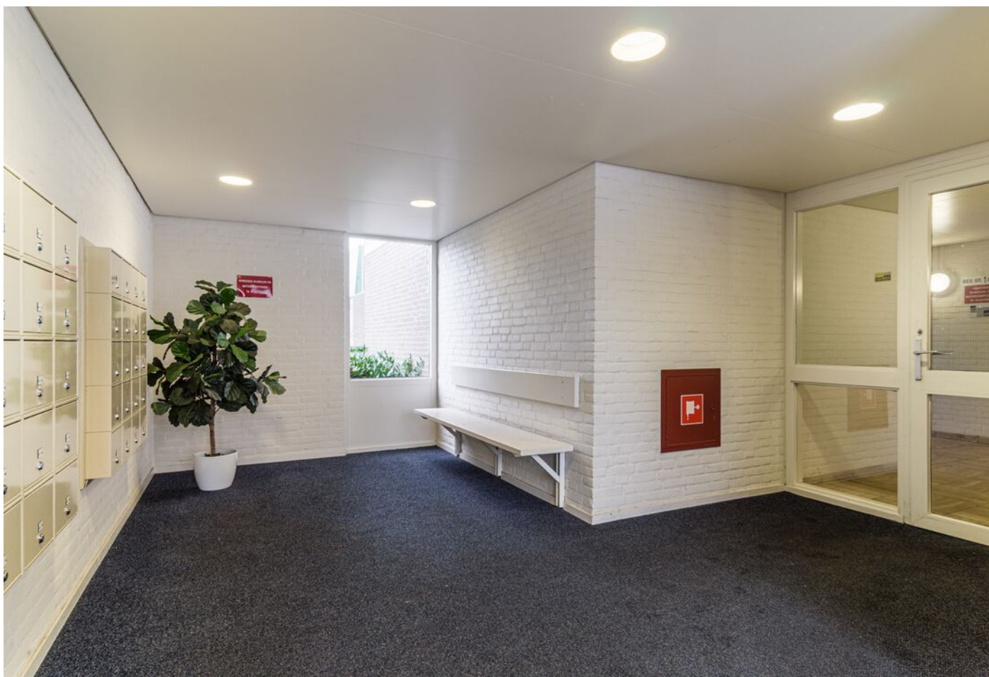
Kastelenplein 2, Eindhoven