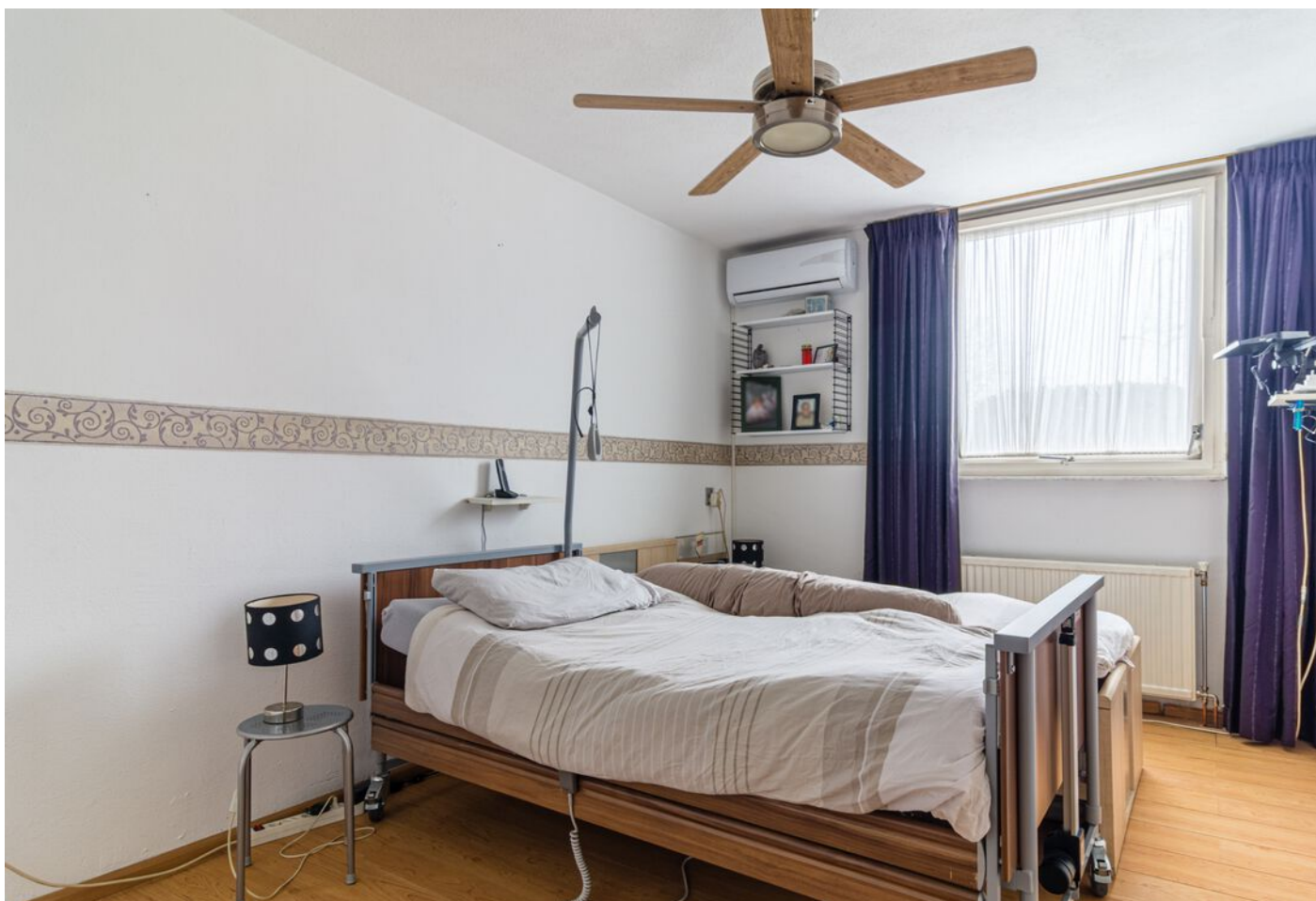
Kastelenplein 2, Eindhoven