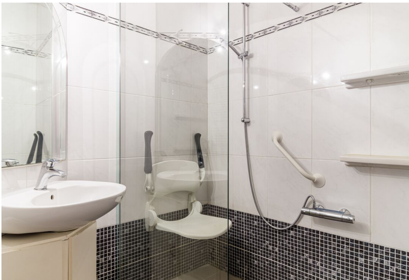
Kastelenplein 2, Eindhoven