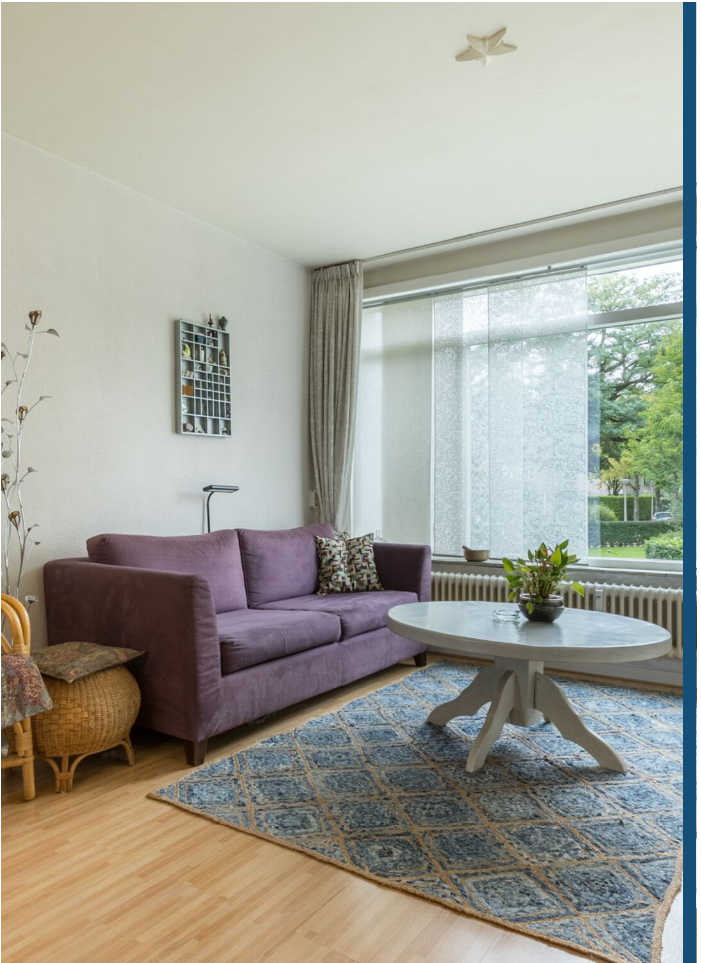
Kaarderstraat 4, Eindhoven