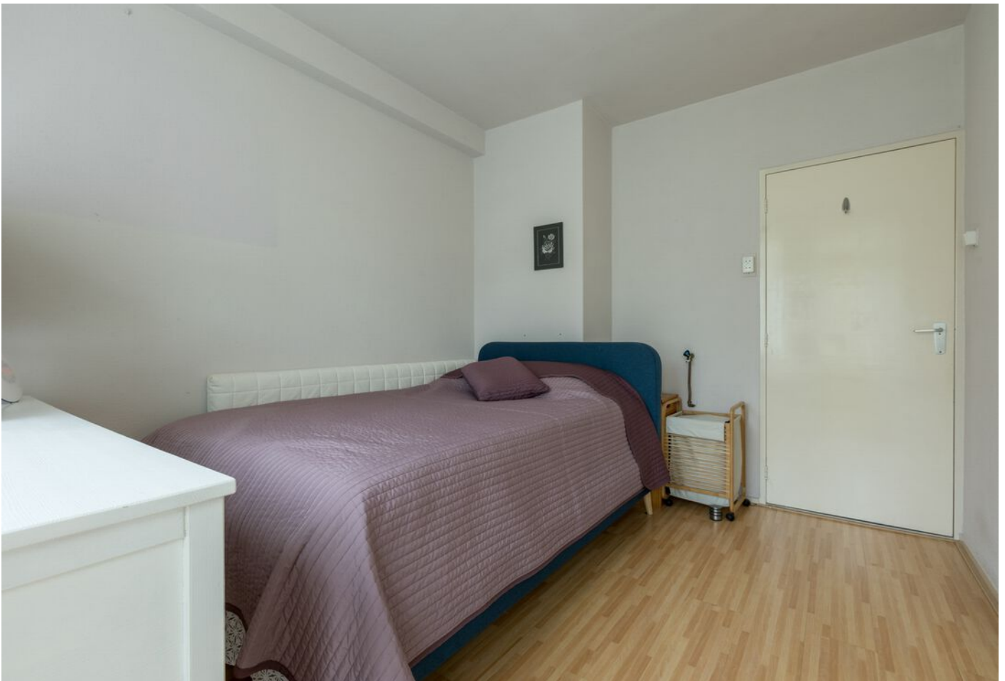
Kaarderstraat 4, Eindhoven