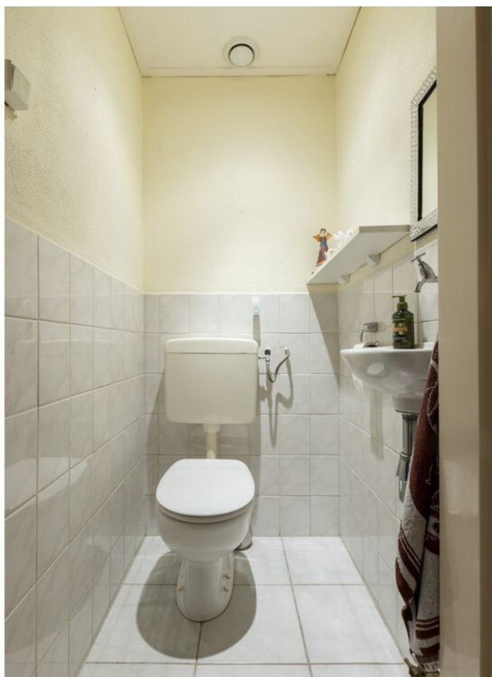
Kaarderstraat 4, Eindhoven