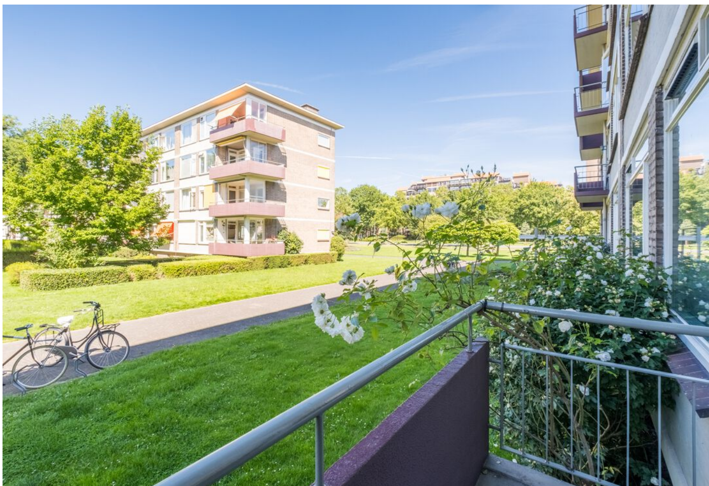
Kaarderstraat 4, Eindhoven