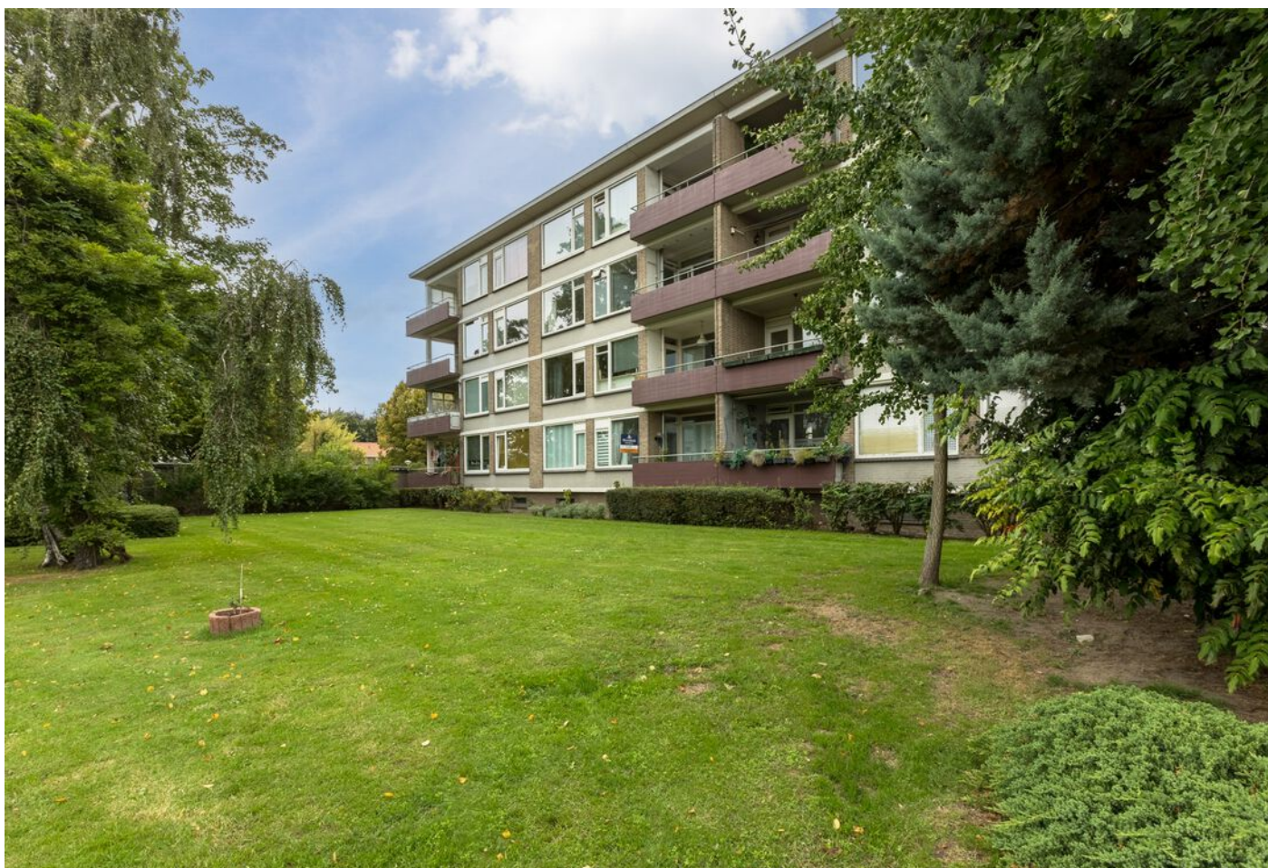
Kaarderstraat 4, Eindhoven