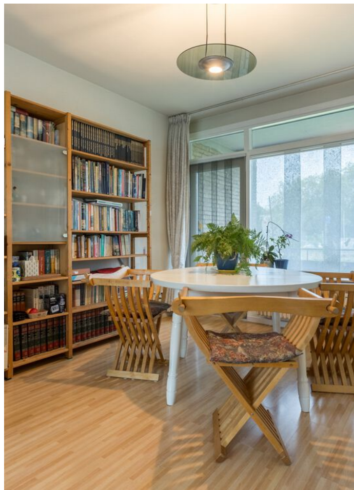
Kaarderstraat 4, Eindhoven