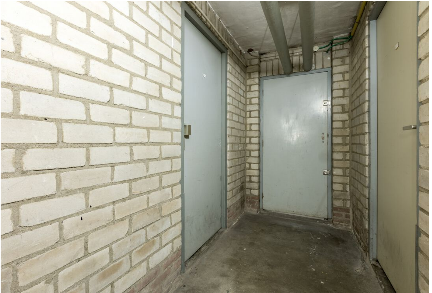
Kaarderstraat 4, Eindhoven