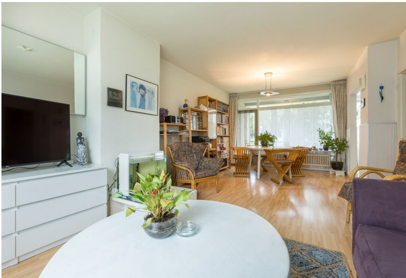
Kaarderstraat 4, Eindhoven