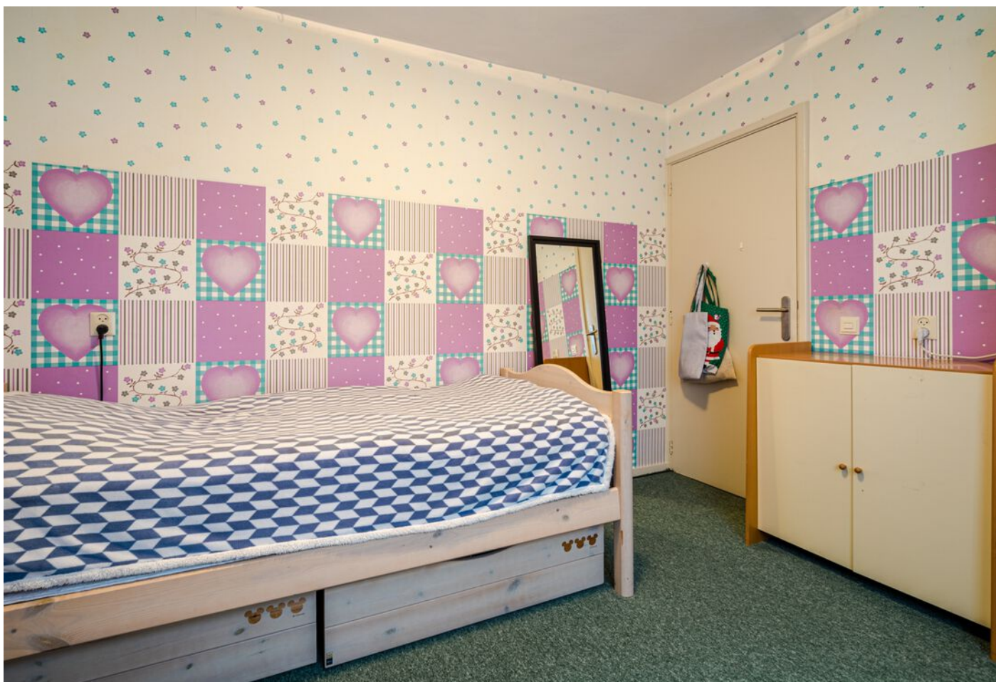
Hulsberg 26, Esch