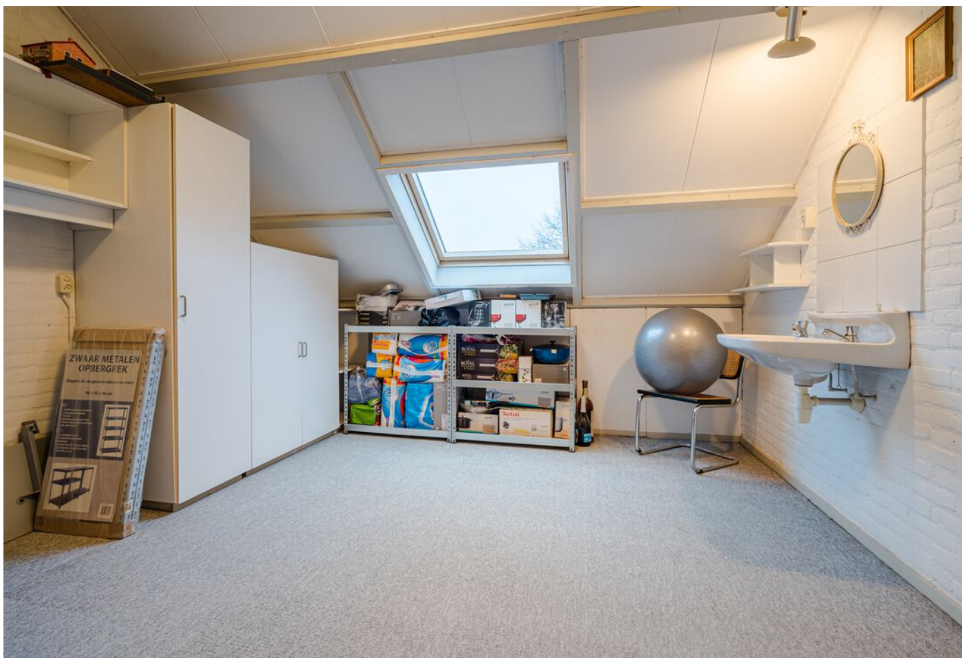
Hulsberg 26, Esch