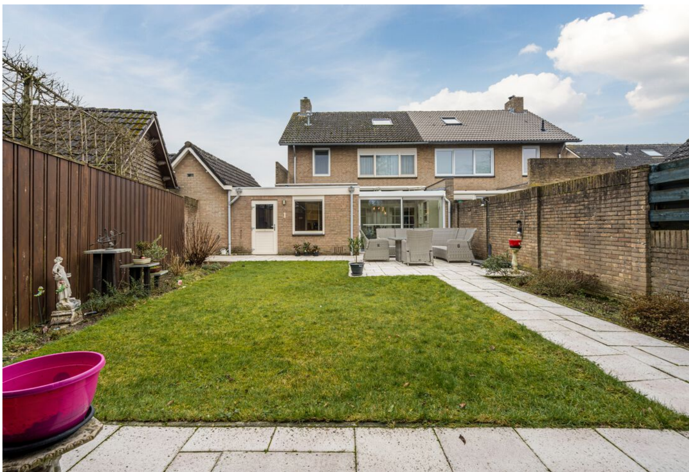
Hulsberg 26, Esch