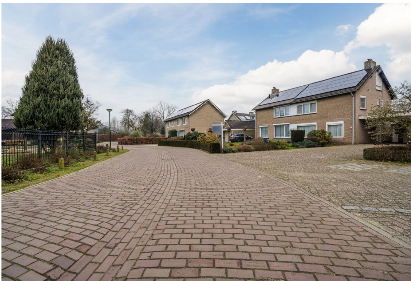
Hulsberg 26, Esch