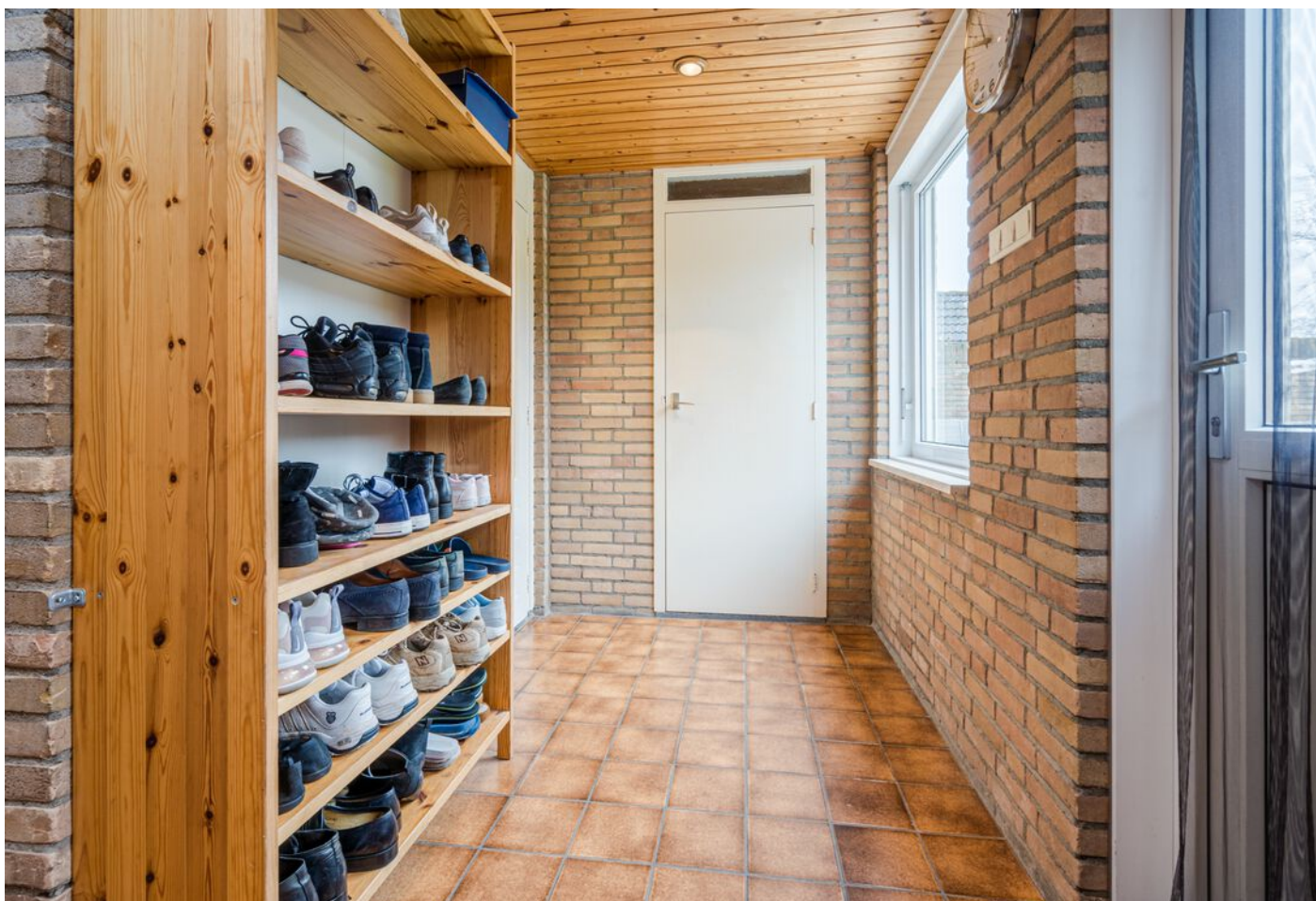
Hulsberg 26, Esch