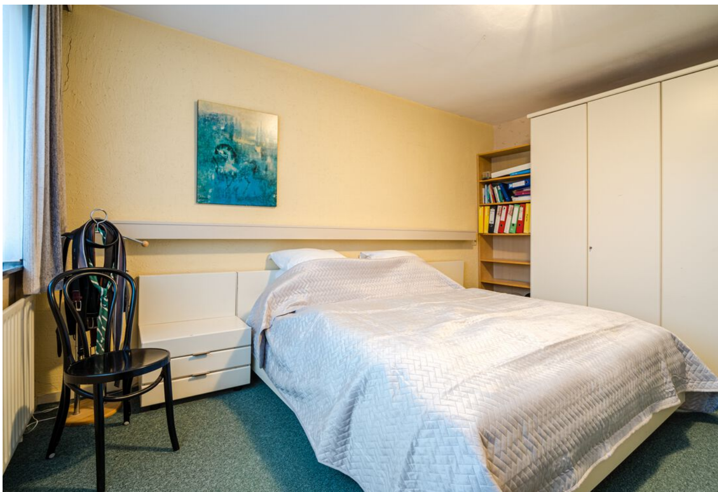
Hulsberg 26, Esch