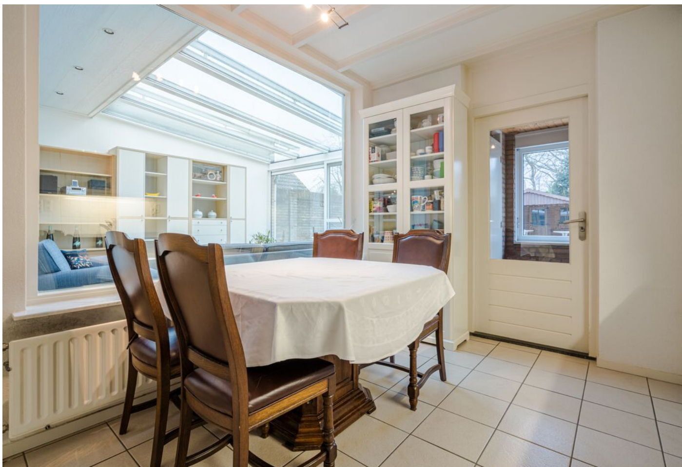
Hulsberg 26, Esch