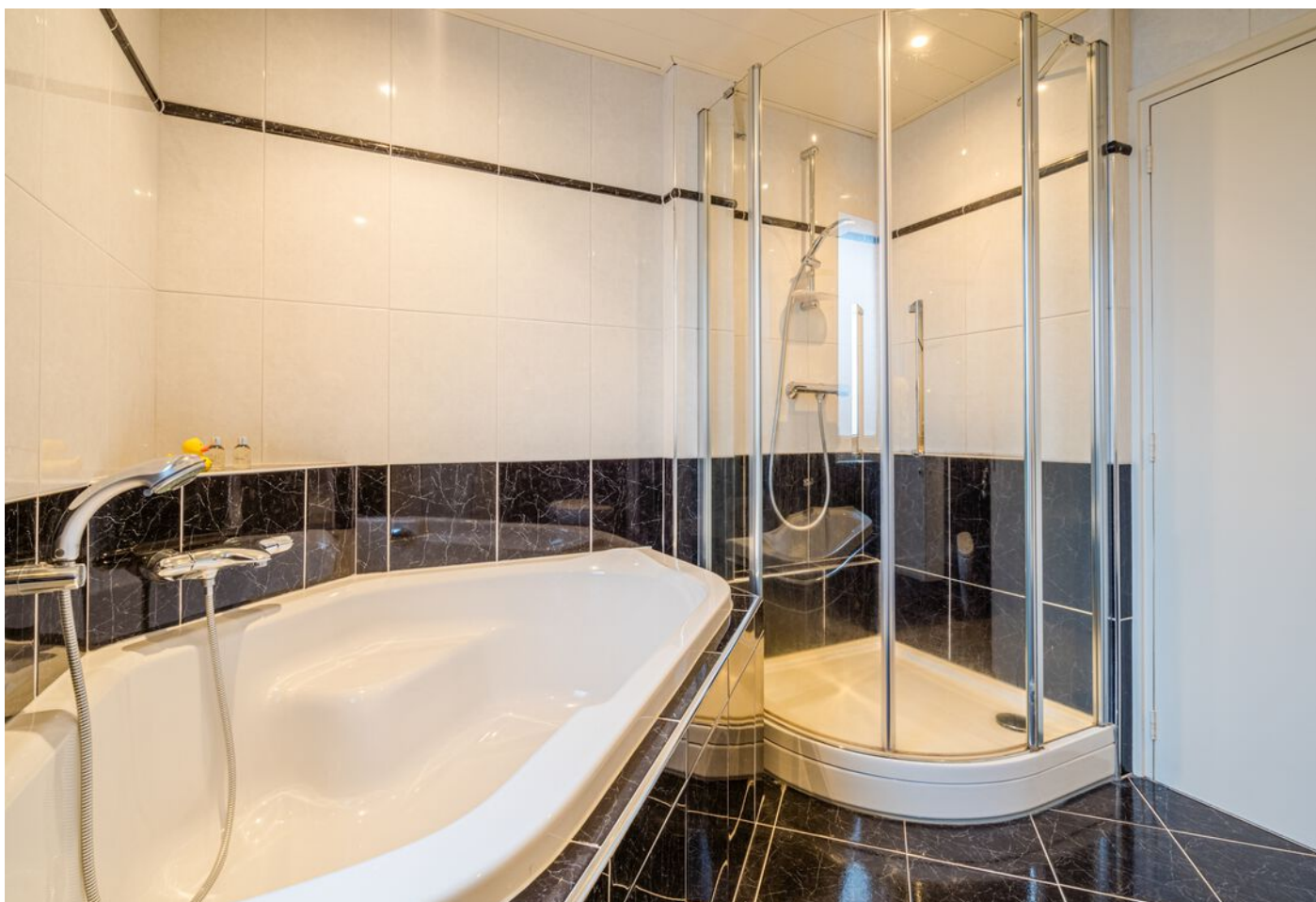
Hulsberg 26, Esch