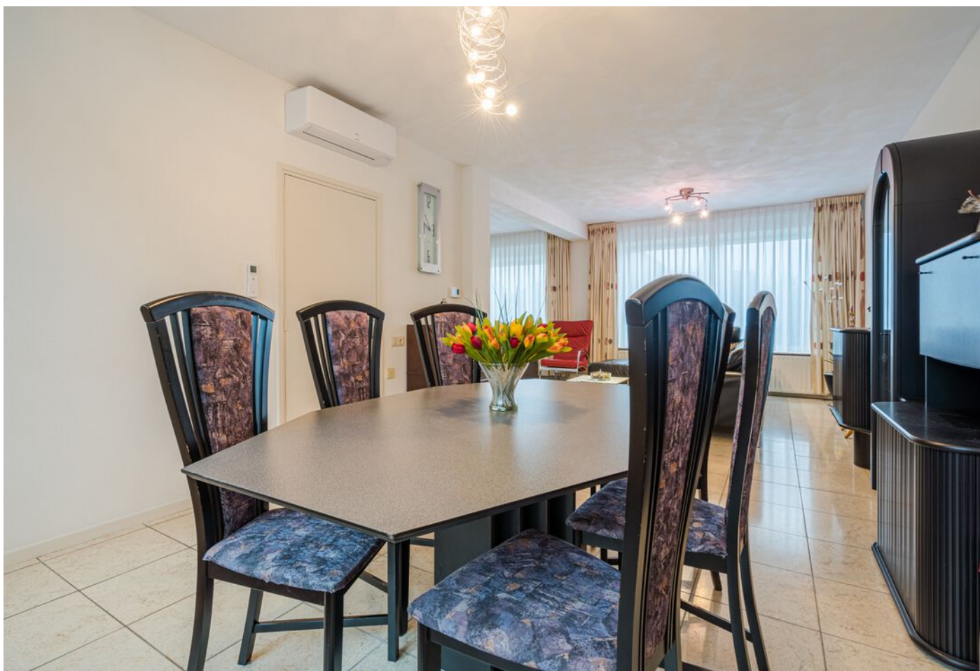
Hulsberg 26, Esch