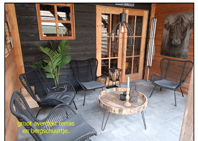
groot overdekt terras en bergschuurtje.