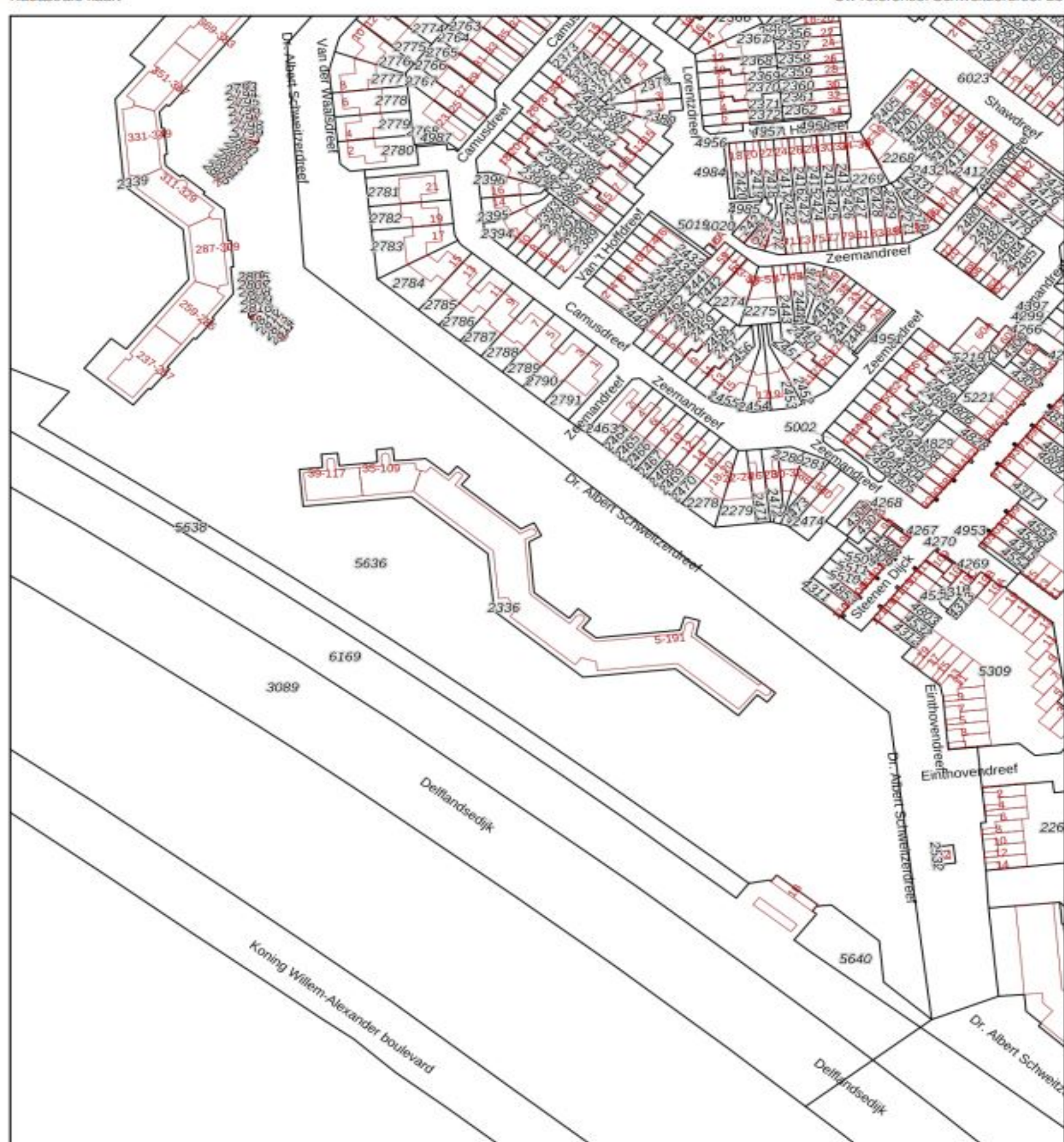
Uw referentie: Schweitzerdreef 25