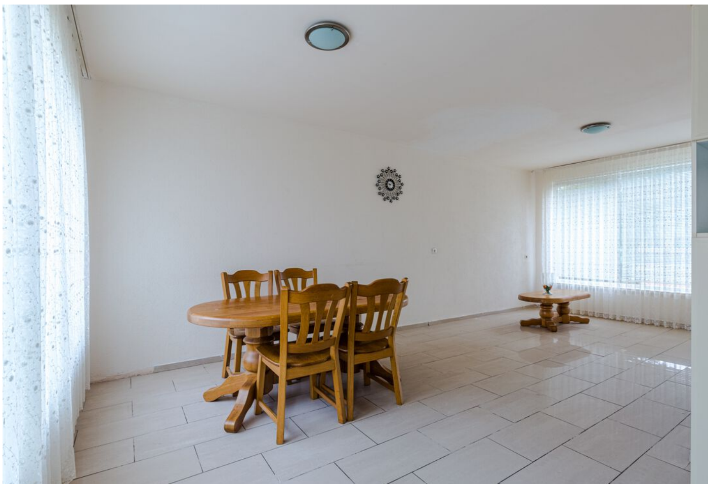
Doctor Berlagelaan 64, Eindhoven