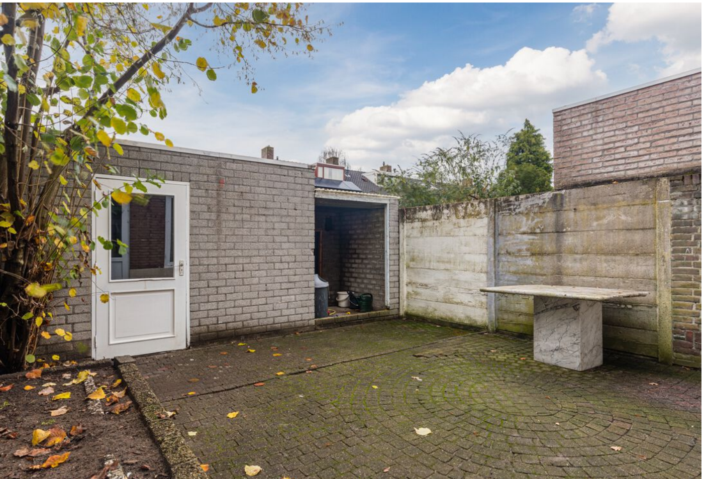
Doctor Berlagelaan 64, Eindhoven