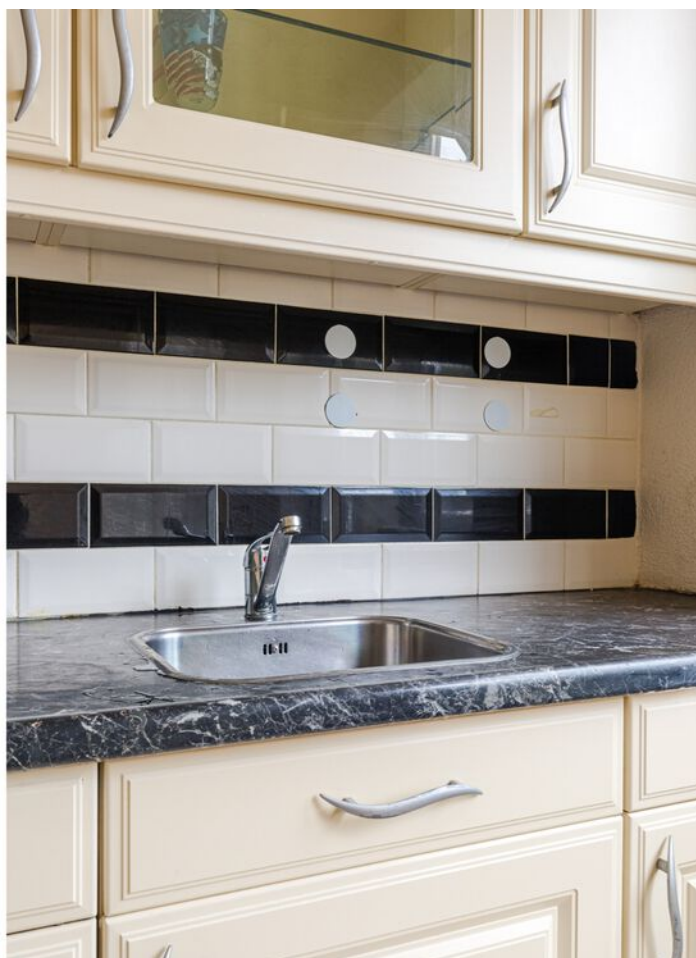
Doctor Berlagelaan 64, Eindhoven