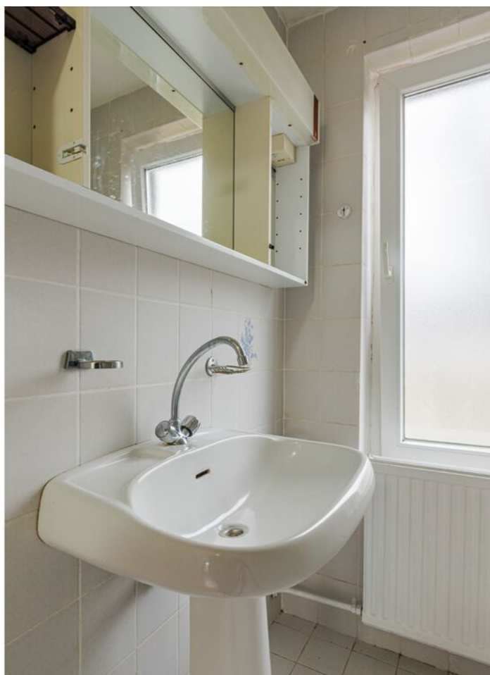
Doctor Berlagelaan 64, Eindhoven