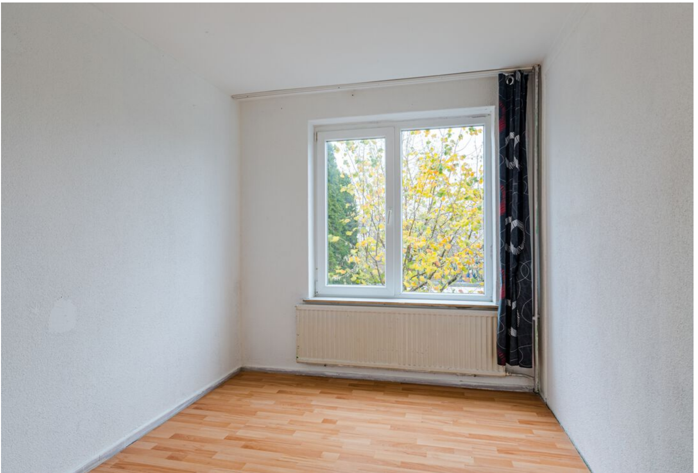
Doctor Berlagelaan 64, Eindhoven