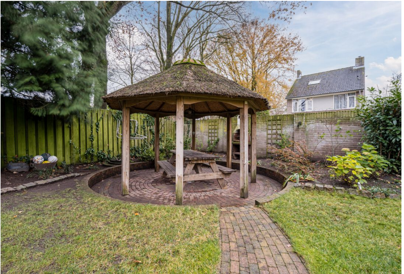
Diamantring 124 A, Eindhoven