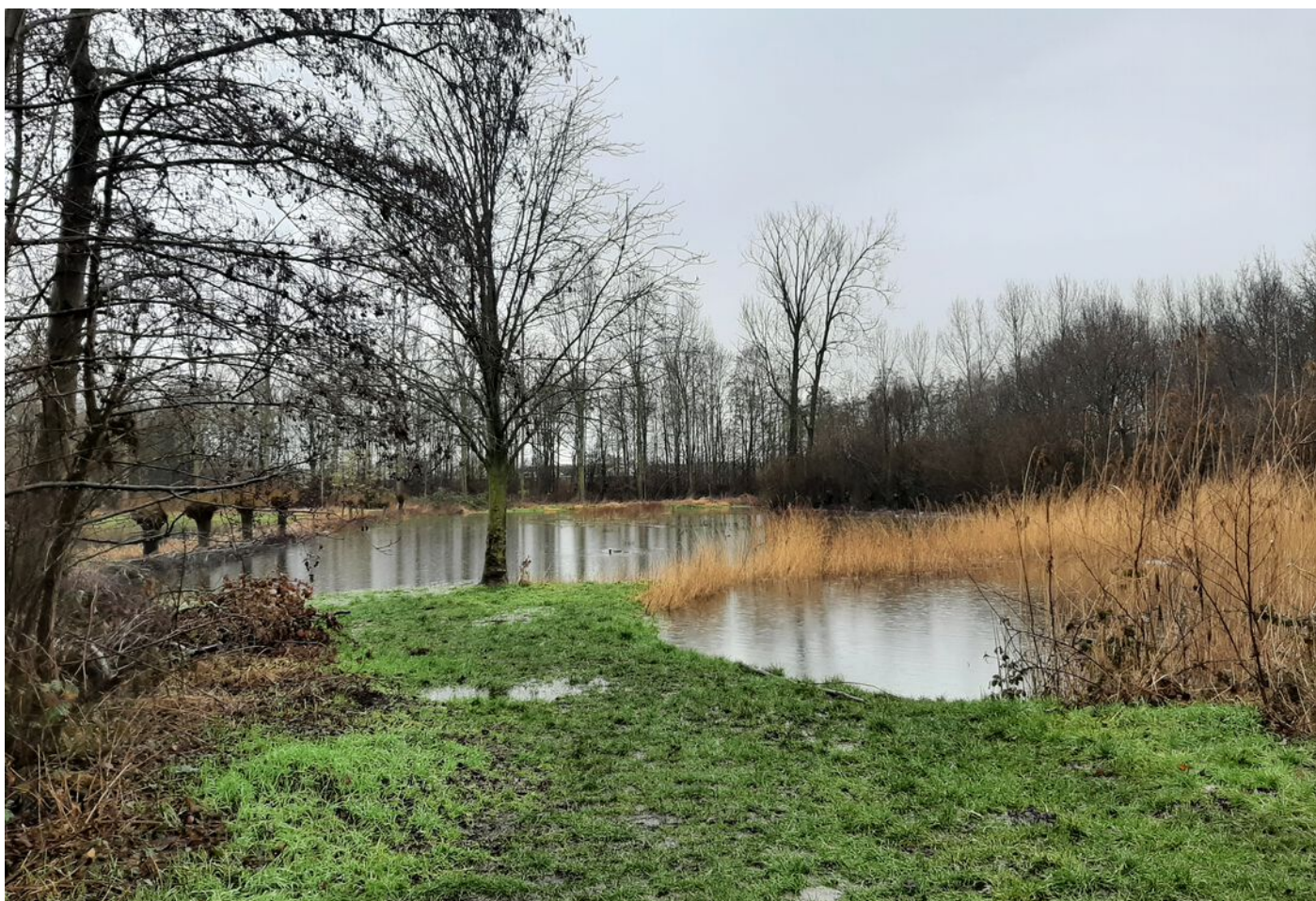
Diamantring 124 A, Eindhoven