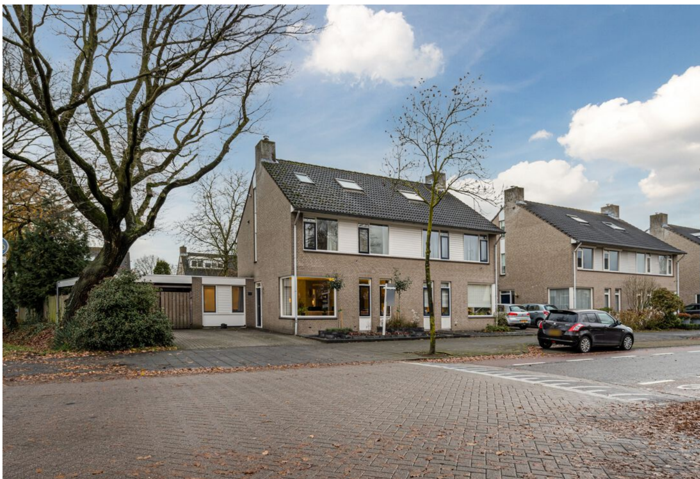
Diamantring 124 A, Eindhoven