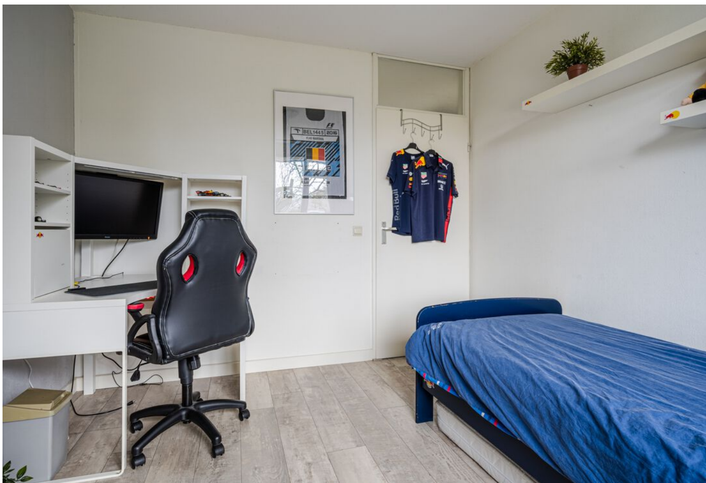
Diamantring 124 A, Eindhoven