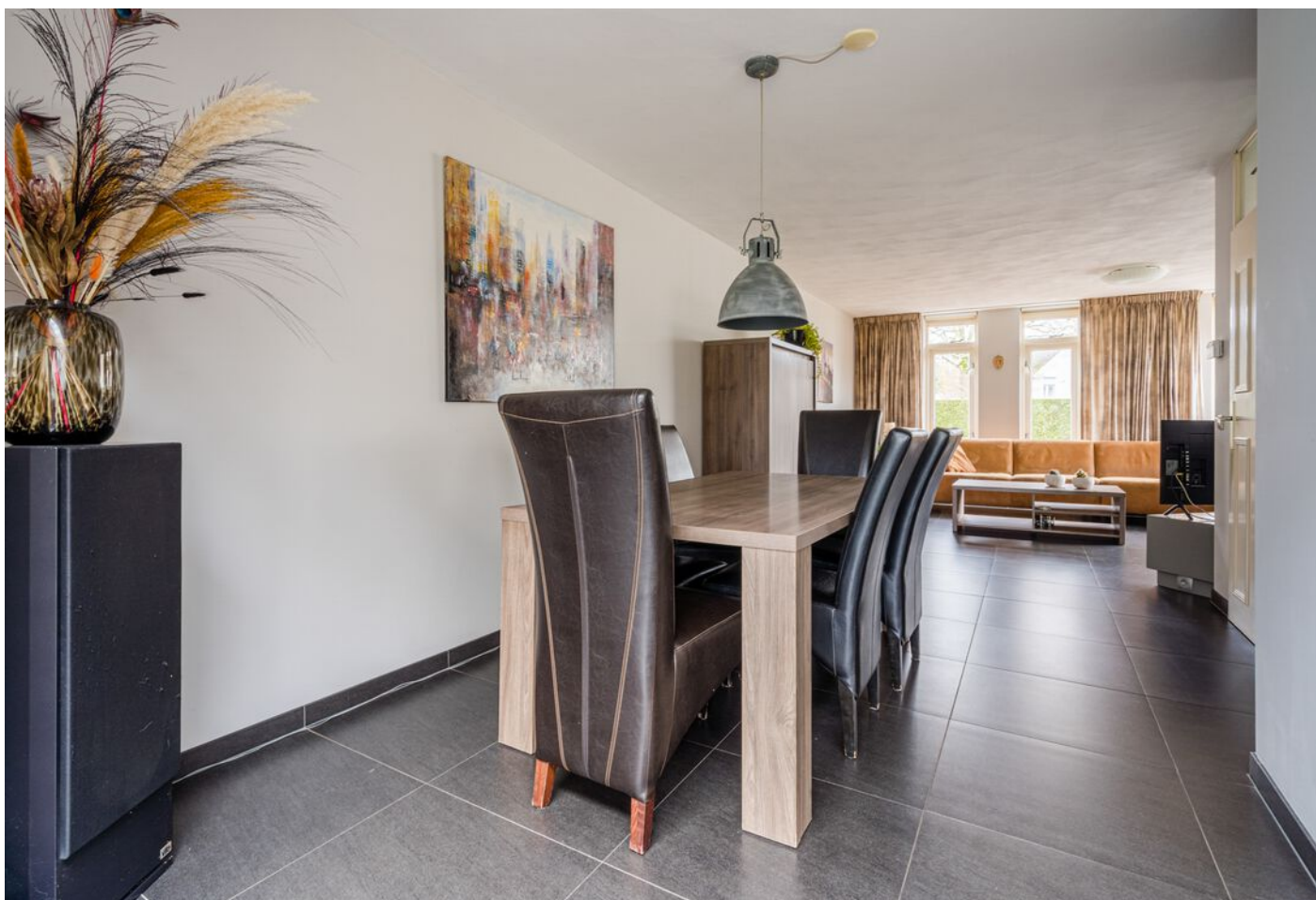
Diamantring 124 A, Eindhoven