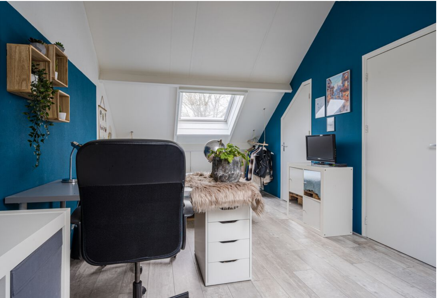
Diamantring 124 A, Eindhoven