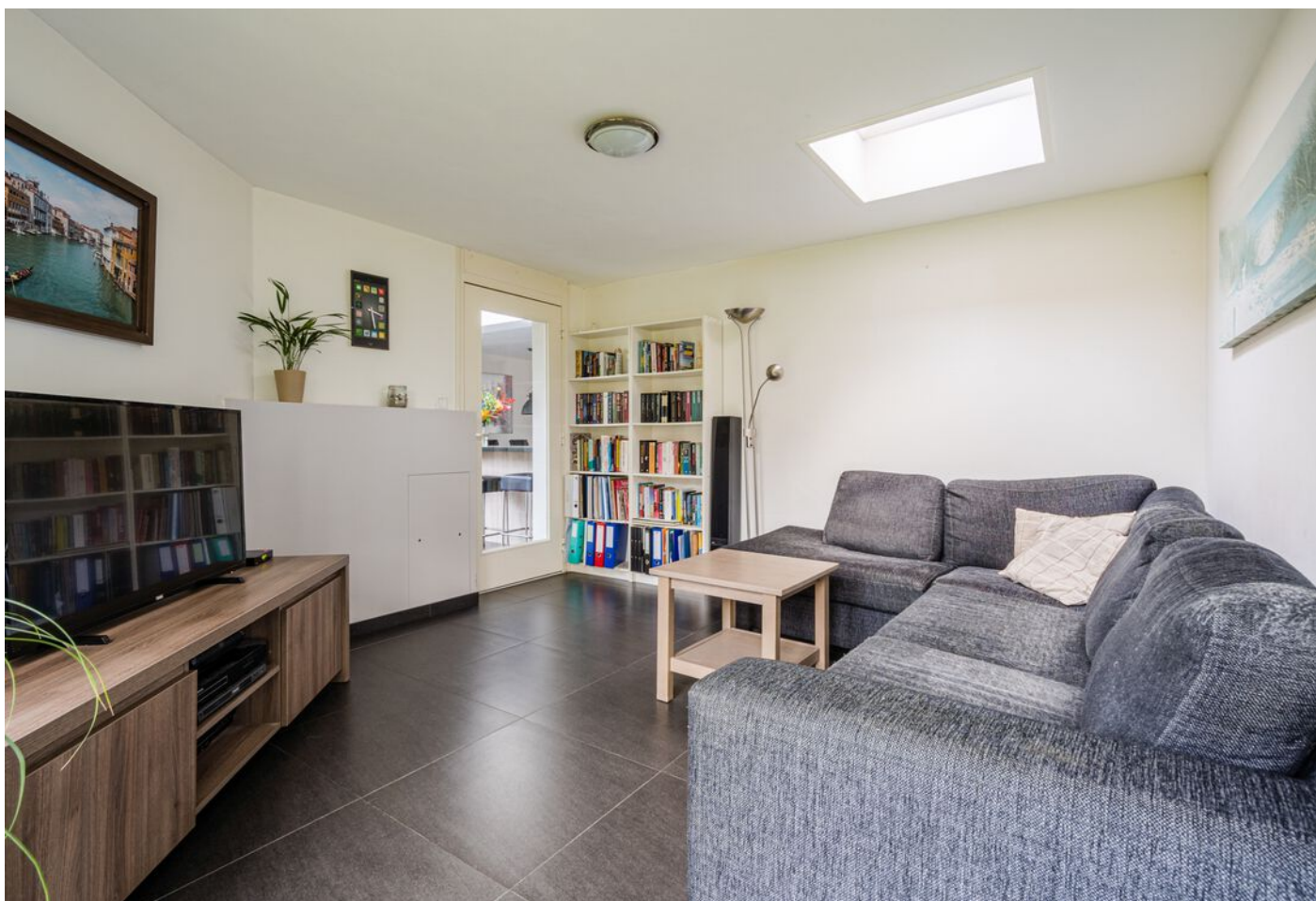
Diamantring 124 A, Eindhoven