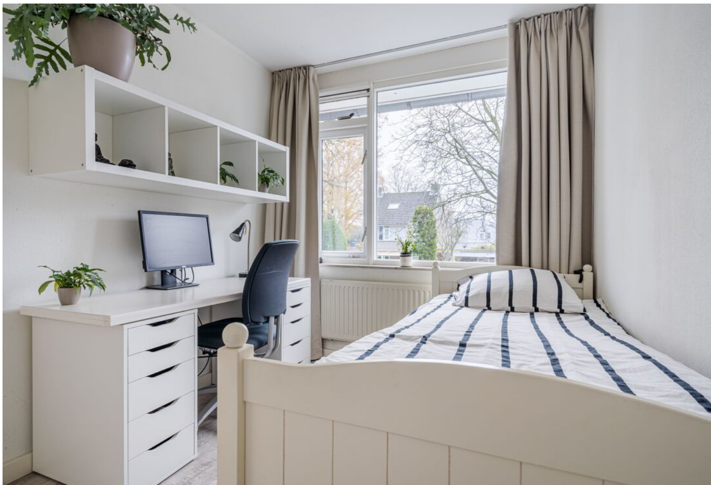
Diamantring 124 A, Eindhoven