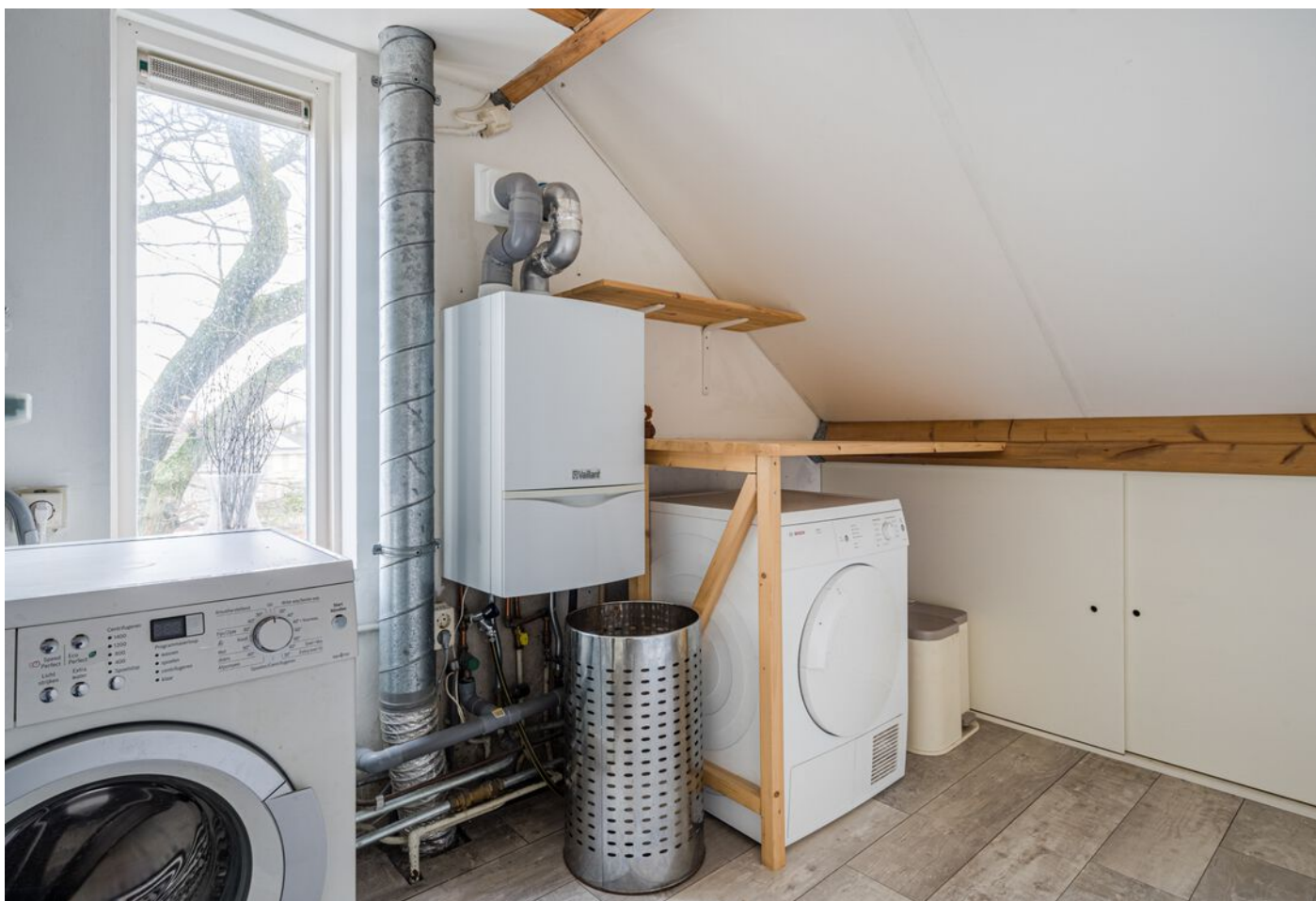
Diamantring 124 A, Eindhoven