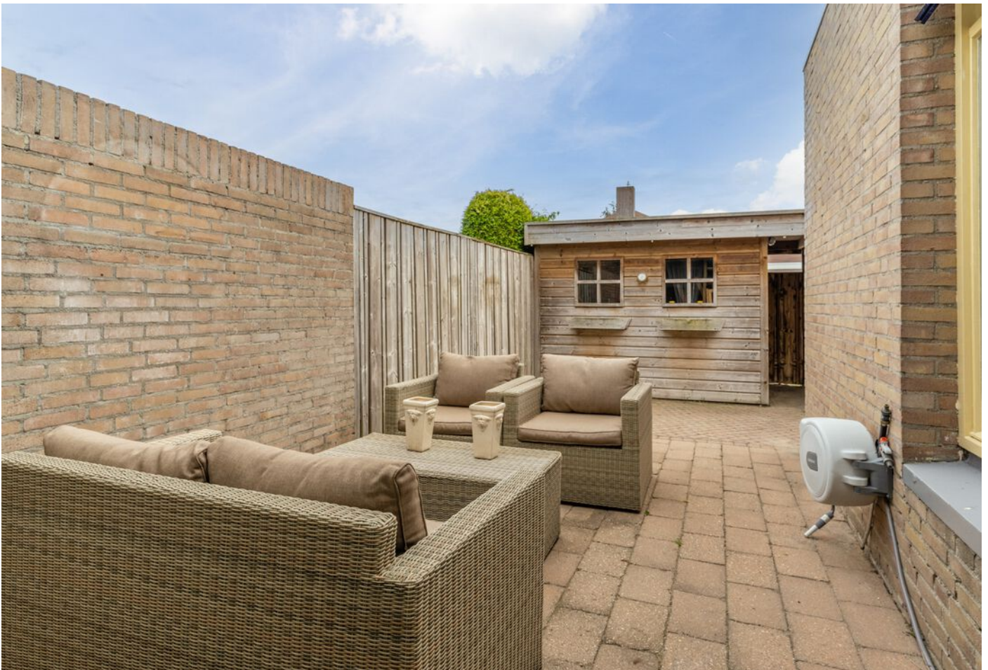
Derde Rompert 71, 'S-Hertogenbosch