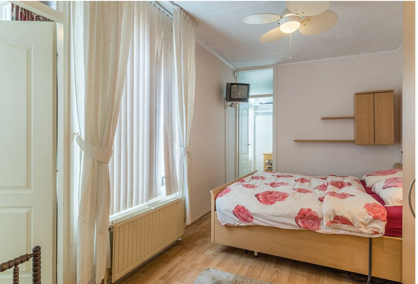
Derde Rompert 71, 'S-Hertogenbosch