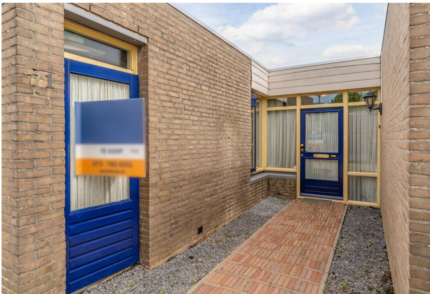
Derde Rompert 71, 'S-Hertogenbosch