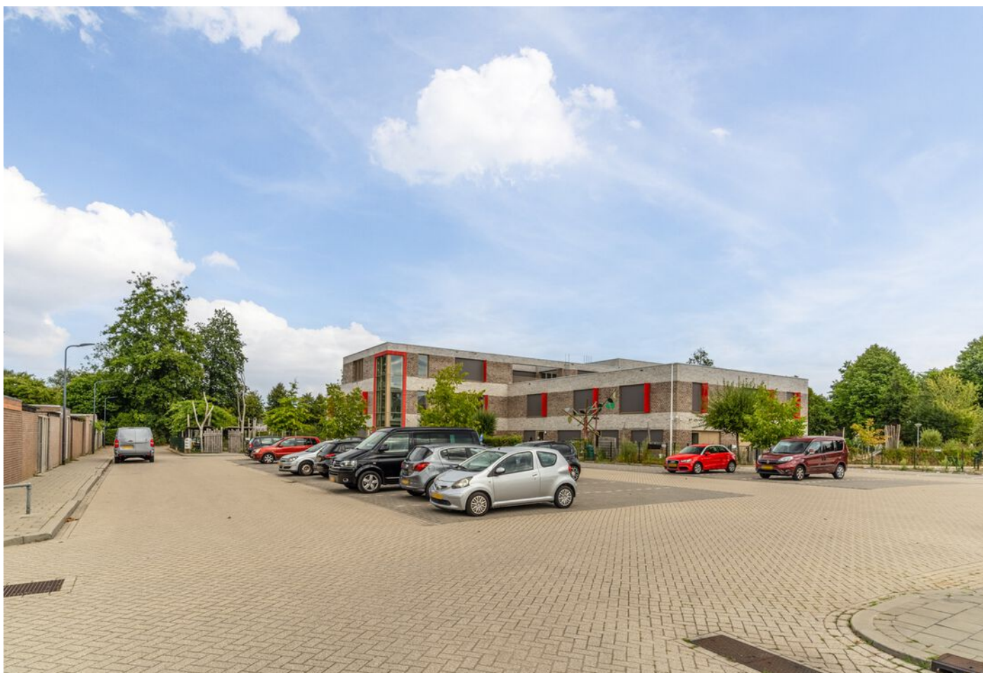
Derde Rompert 71, 'S-Hertogenbosch