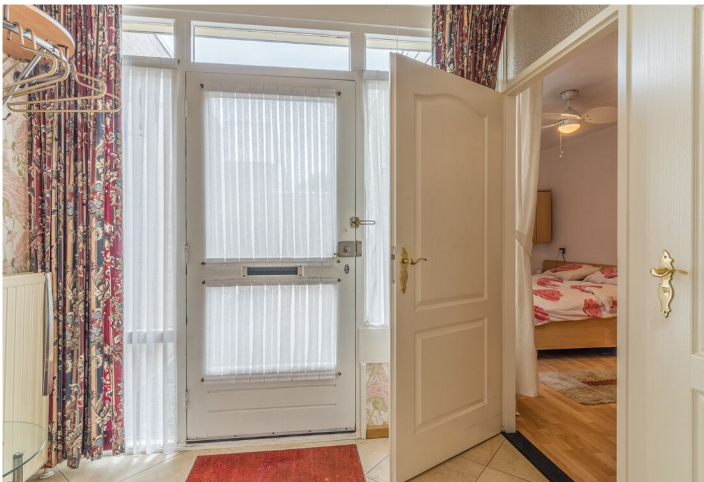
Derde Rompert 71, 'S-Hertogenbosch