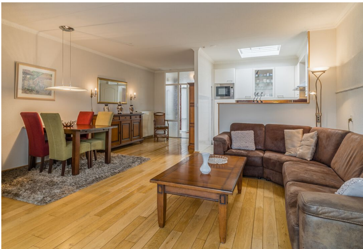
Derde Rompert 71, 'S-Hertogenbosch