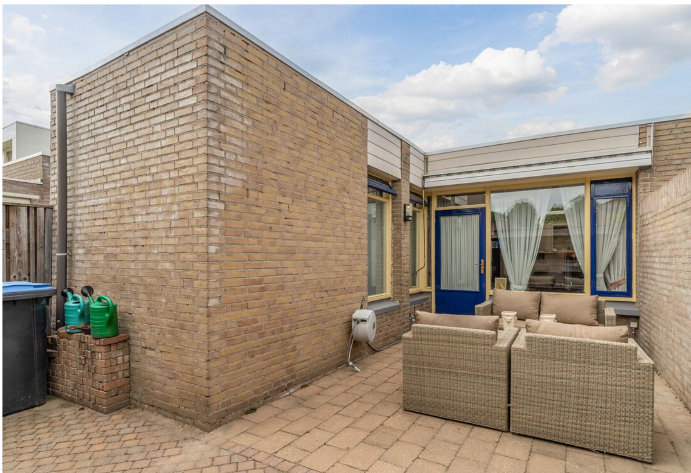
Derde Rompert 71, 'S-Hertogenbosch