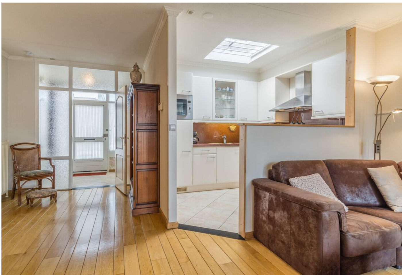
Derde Rompert 71, 'S-Hertogenbosch