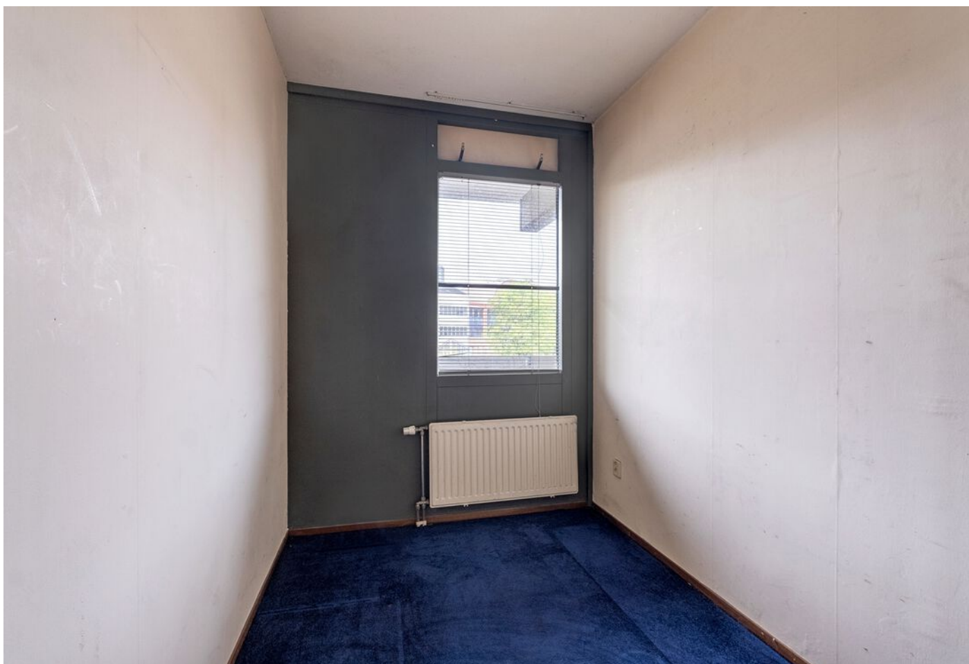
De Rozentuin 15, Eindhoven