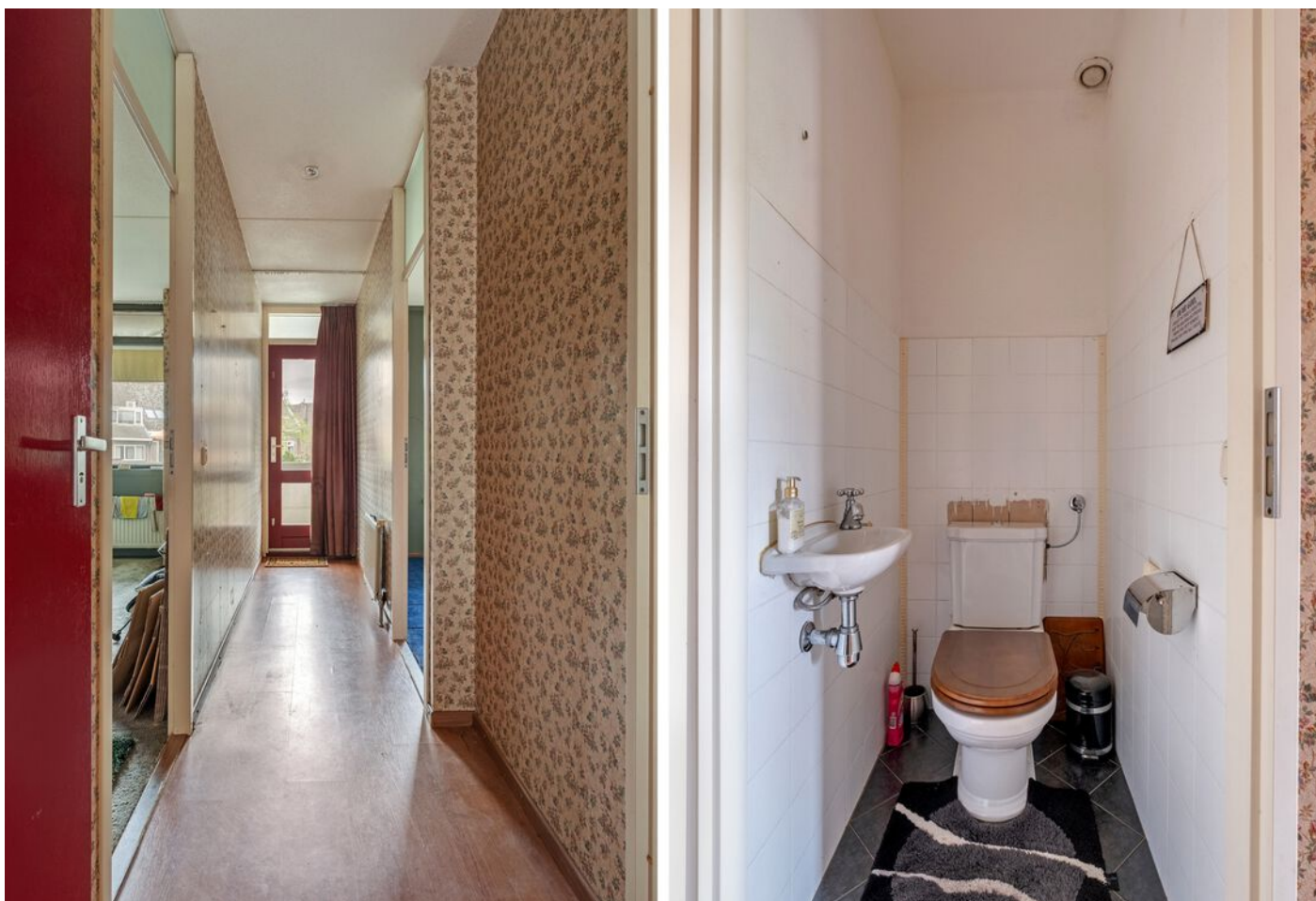
De Rozentuin 15, Eindhoven