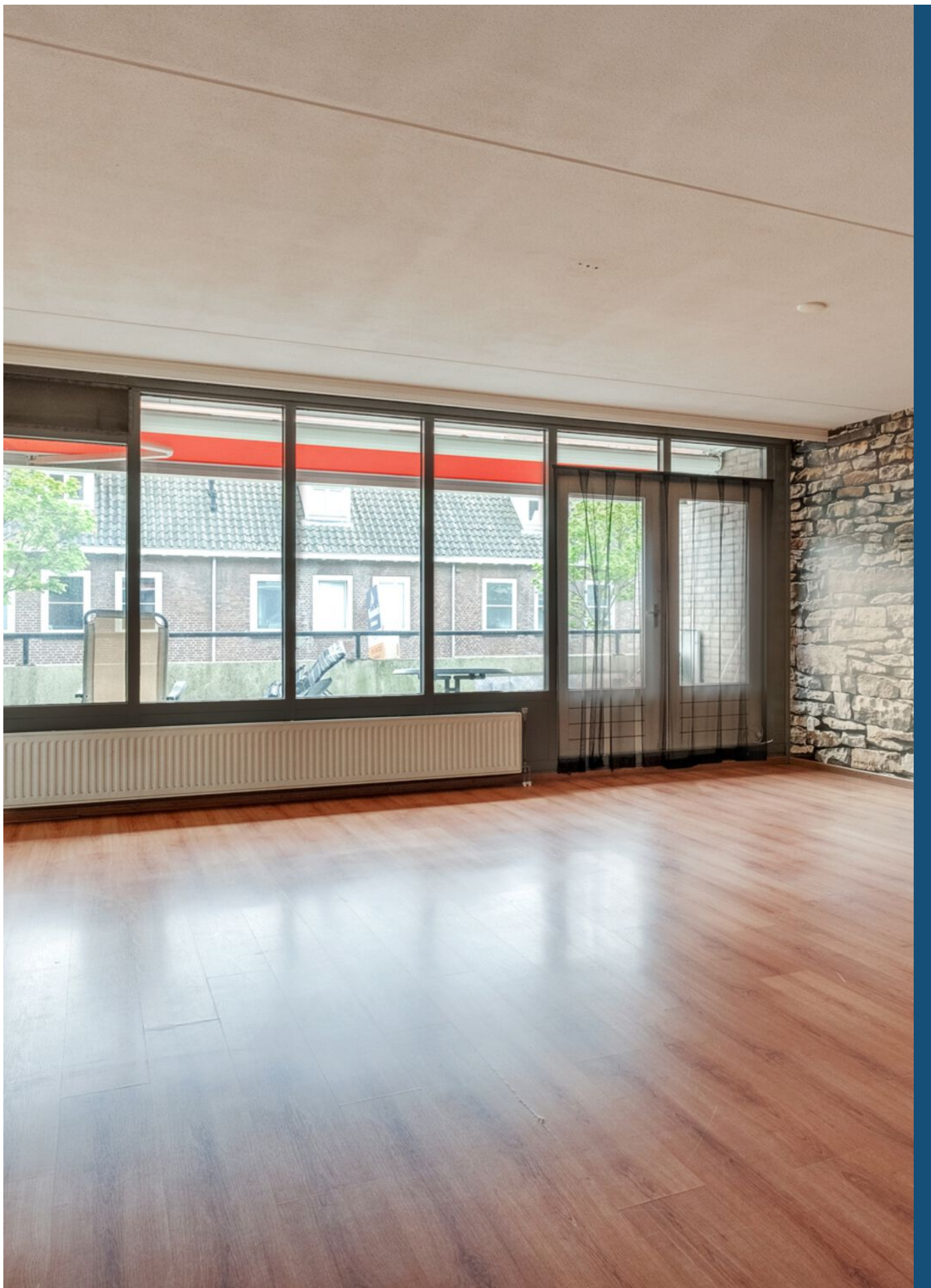
De Rozentuin 15, Eindhoven