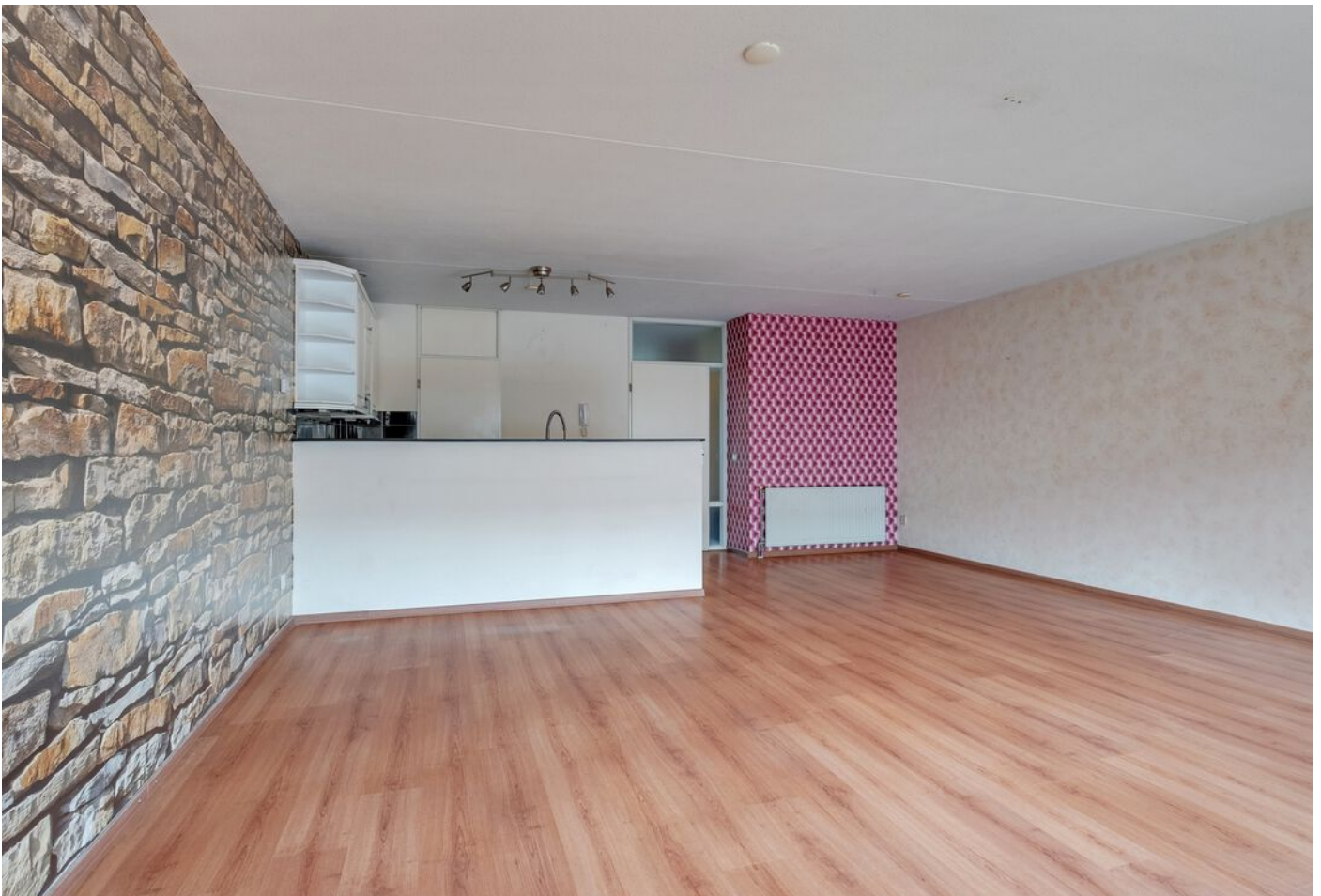
De Rozentuin 15, Eindhoven