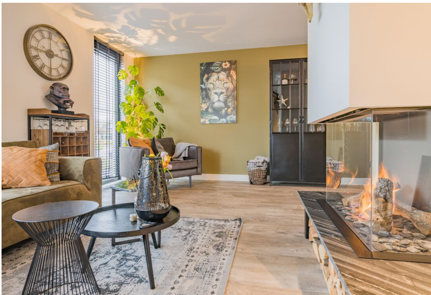
Bronziet 5, Eindhoven