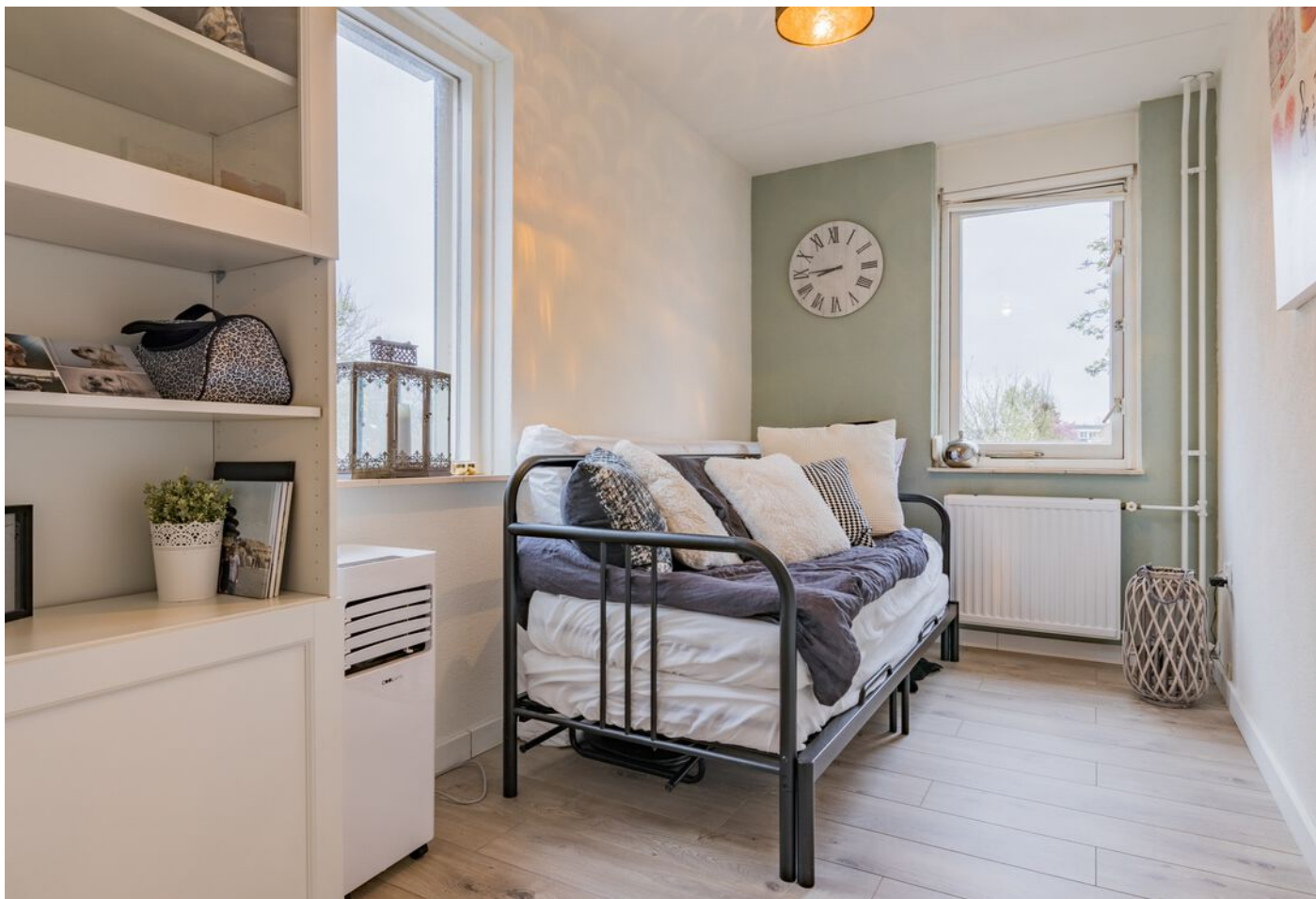
Bronziet 5, Eindhoven