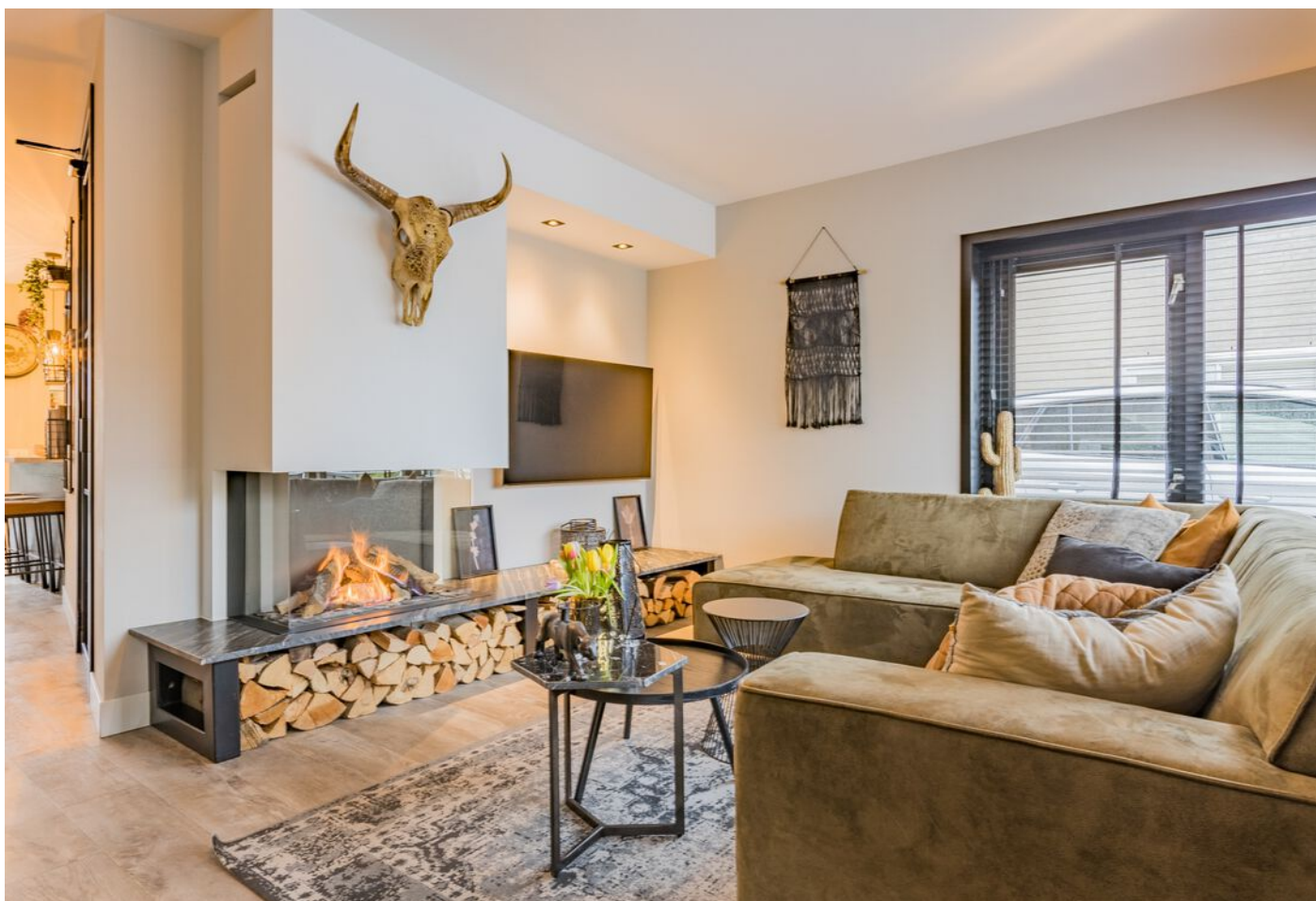
Bronziet 5, Eindhoven