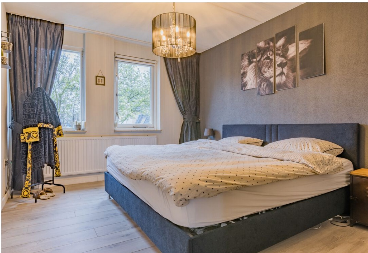
Bronziet 5, Eindhoven