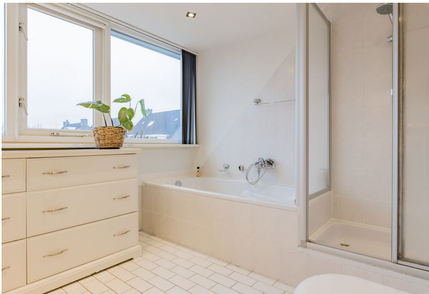
Bronziet 5, Eindhoven