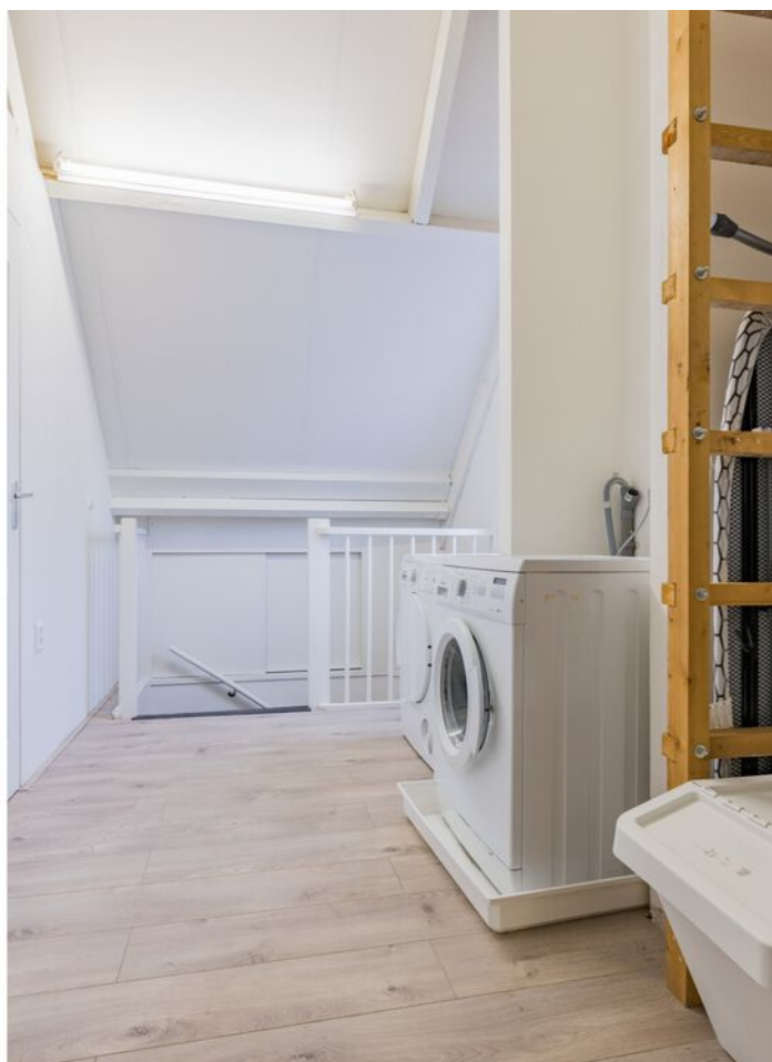
Bronziet 5, Eindhoven