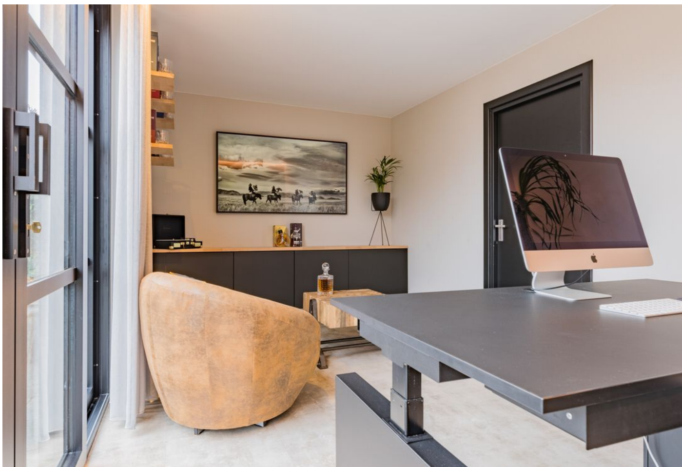
Bronziet 5, Eindhoven