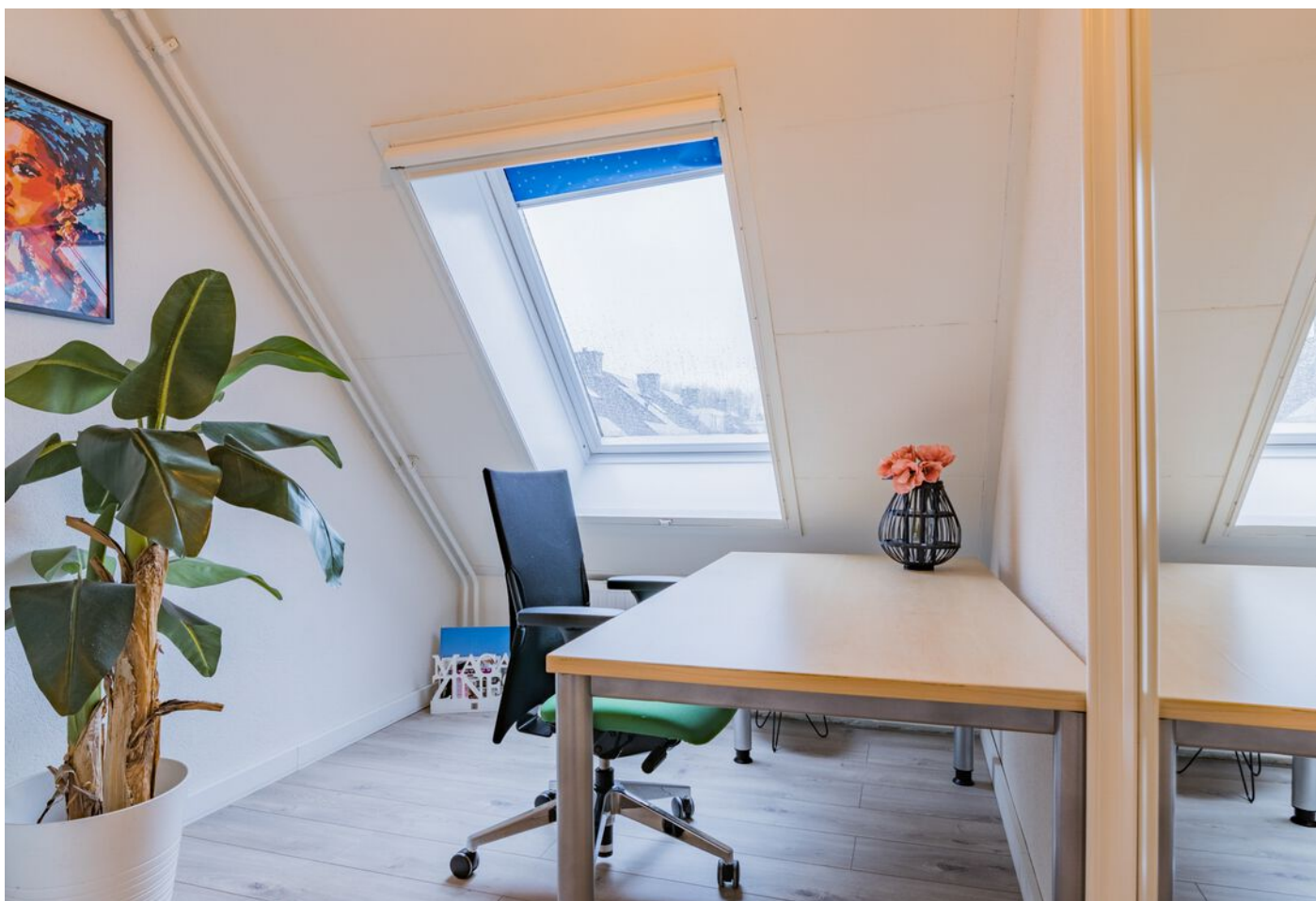
Bronziet 5, Eindhoven