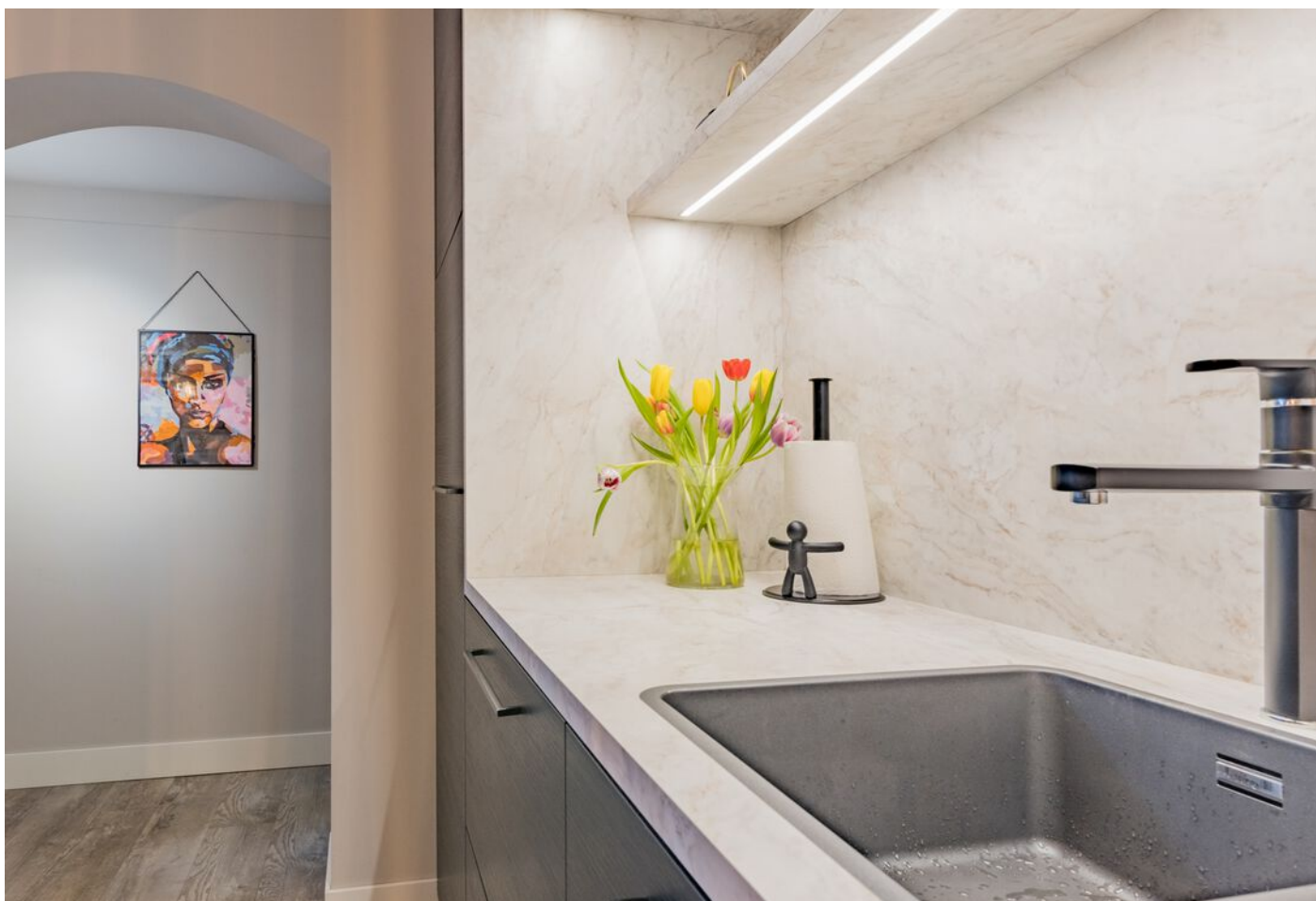
Bronziet 5, Eindhoven