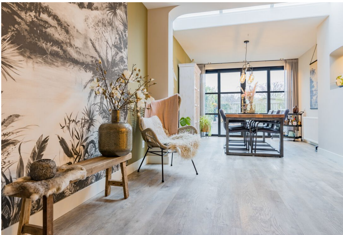
Bronziet 5, Eindhoven