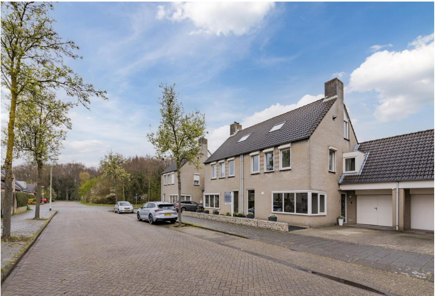
Bronziet 5, Eindhoven