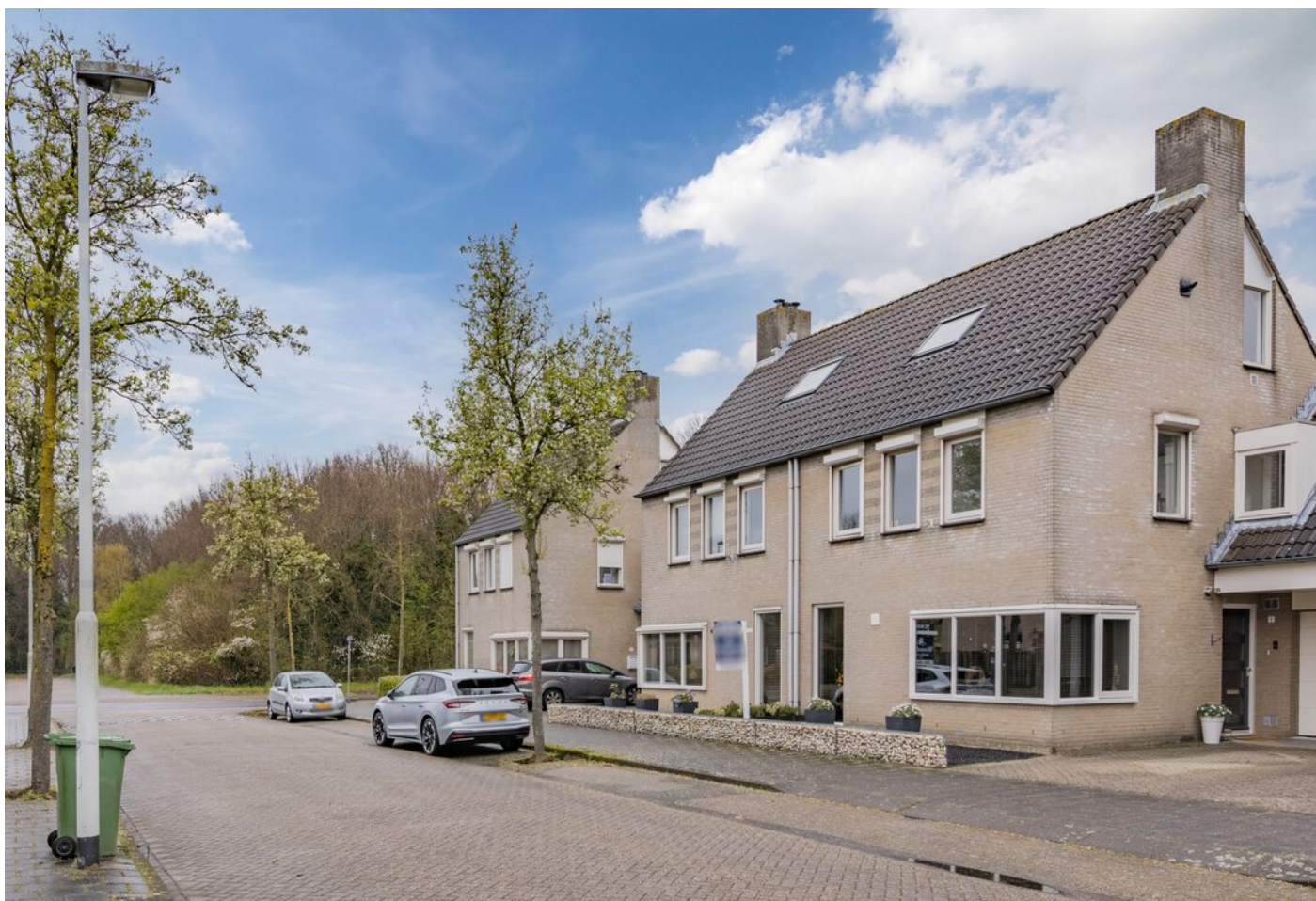
Bronziet 5, Eindhoven