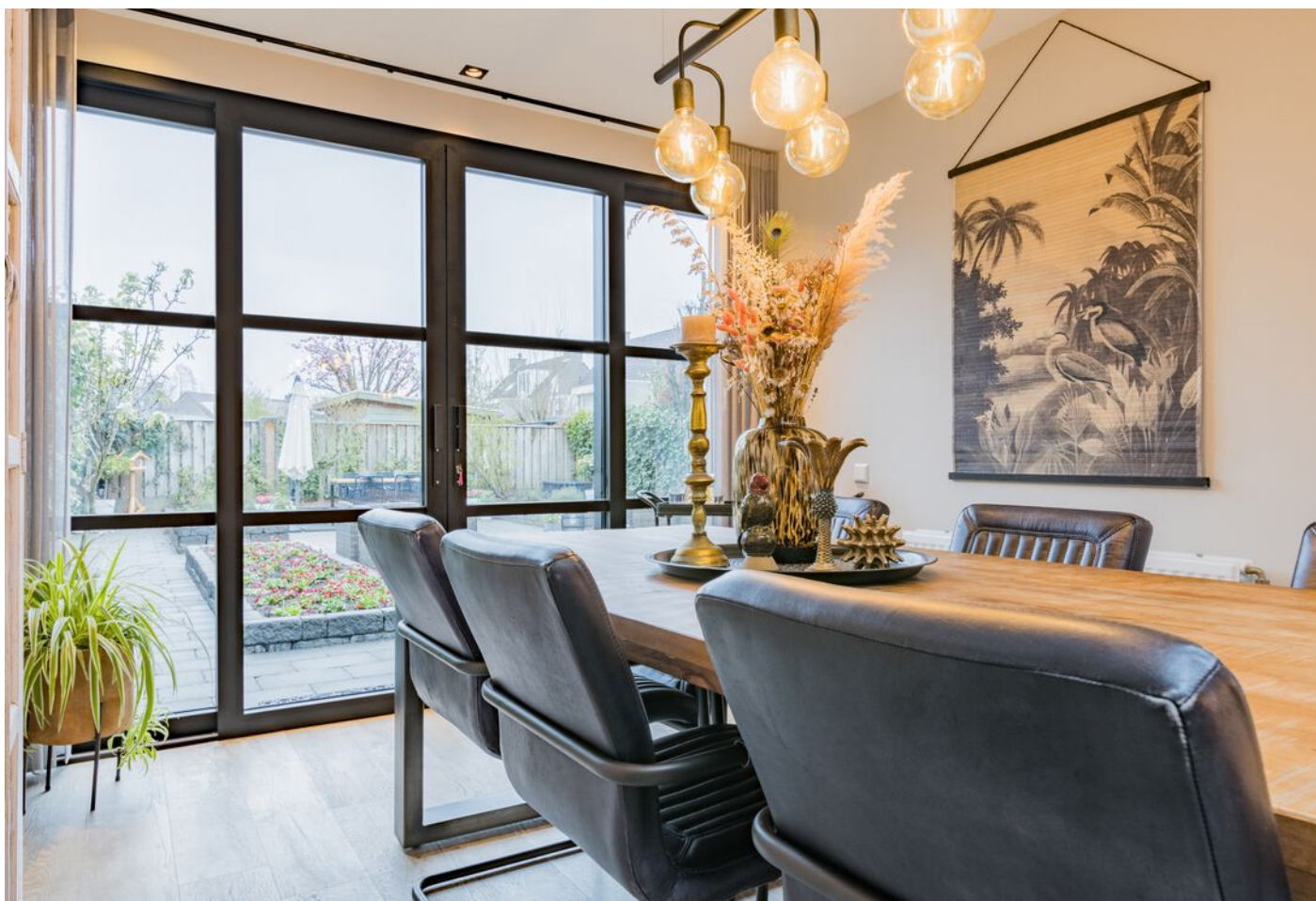
Bronziet 5, Eindhoven