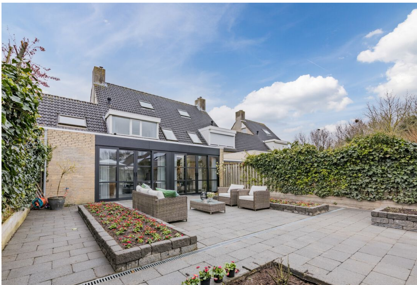
Bronziet 5, Eindhoven