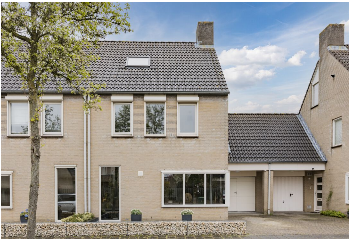
Bronziet 5, Eindhoven