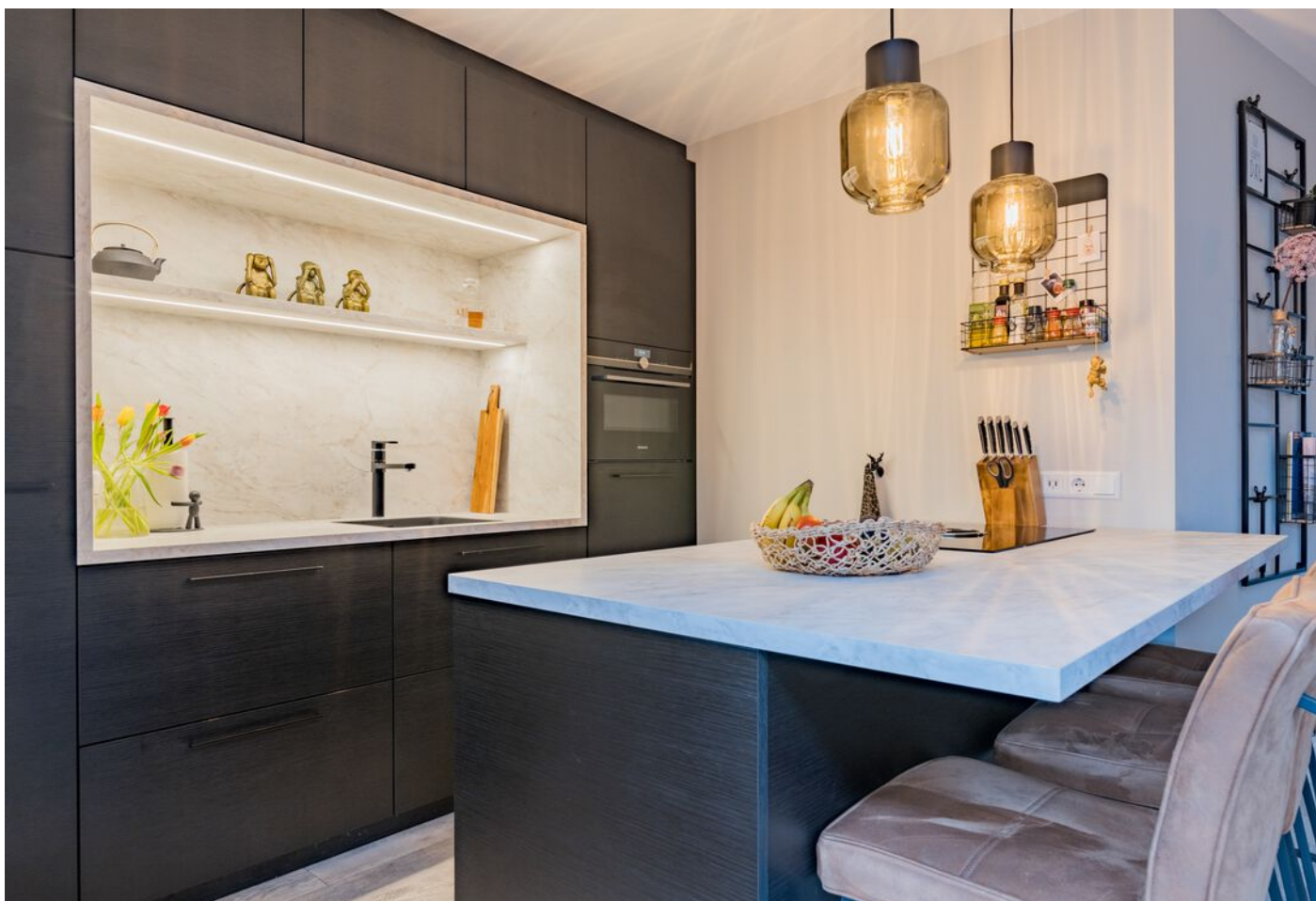
Bronziet 5, Eindhoven