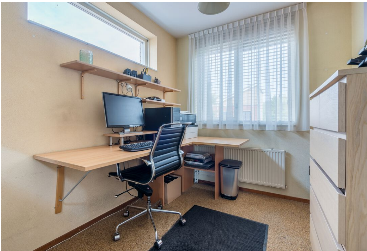
Braspenninglaan 28, 's-Hertogenbosch