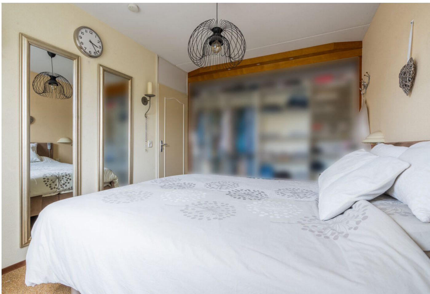
Braspenninglaan 28, 's-Hertogenbosch