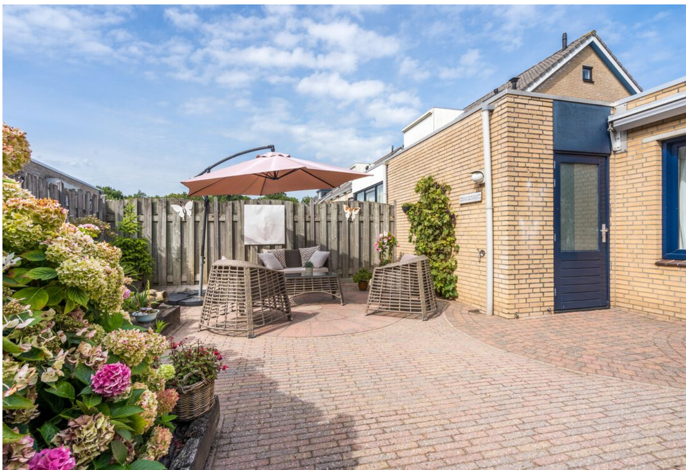
Braspenninglaan 28, 's-Hertogenbosch