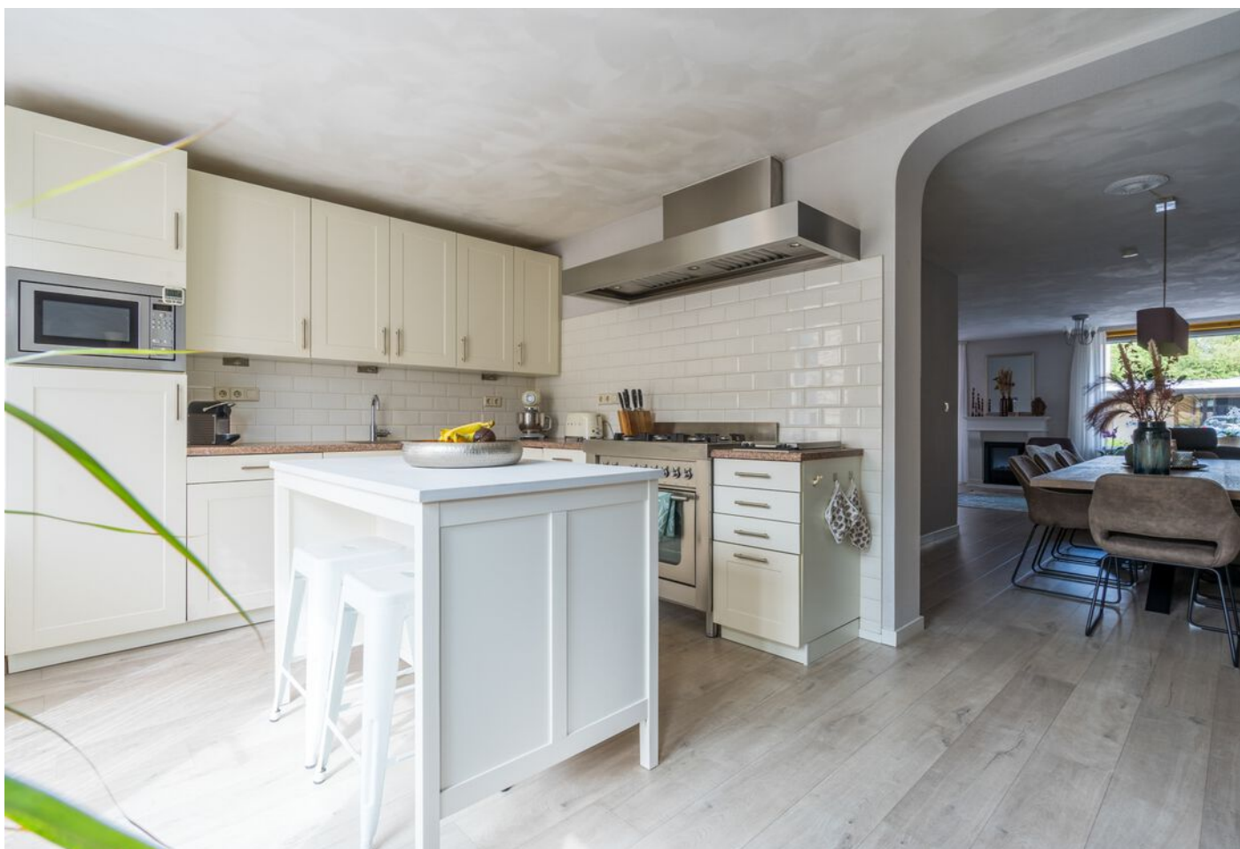
Braspenninglaan 28, 's-Hertogenbosch