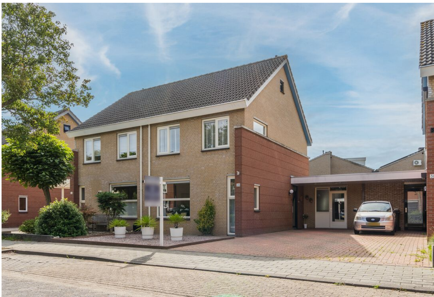
Braspenninglaan 28, 's-Hertogenbosch