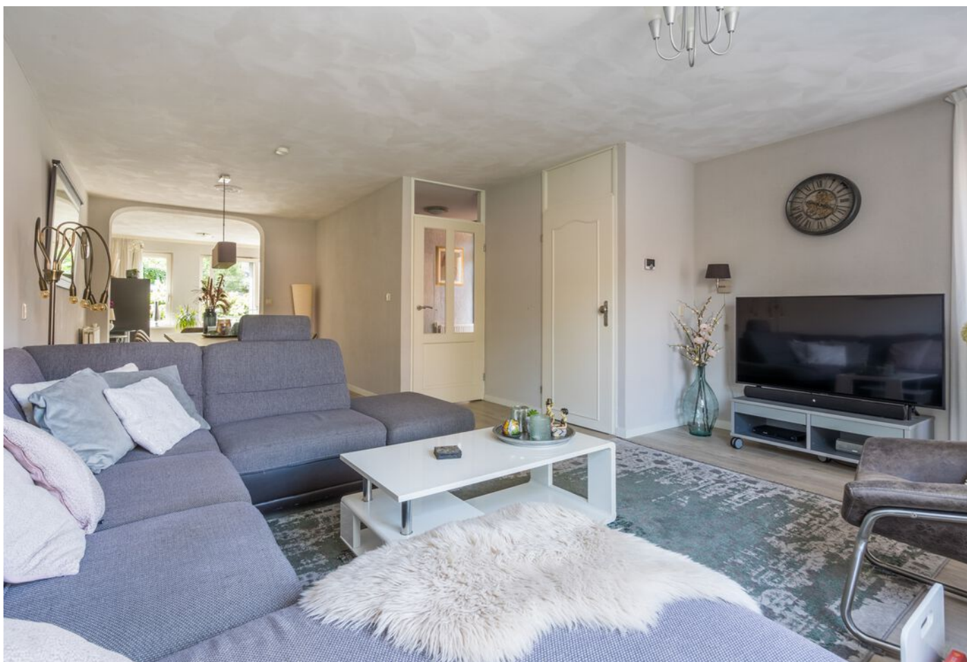
Braspenninglaan 28, 's-Hertogenbosch