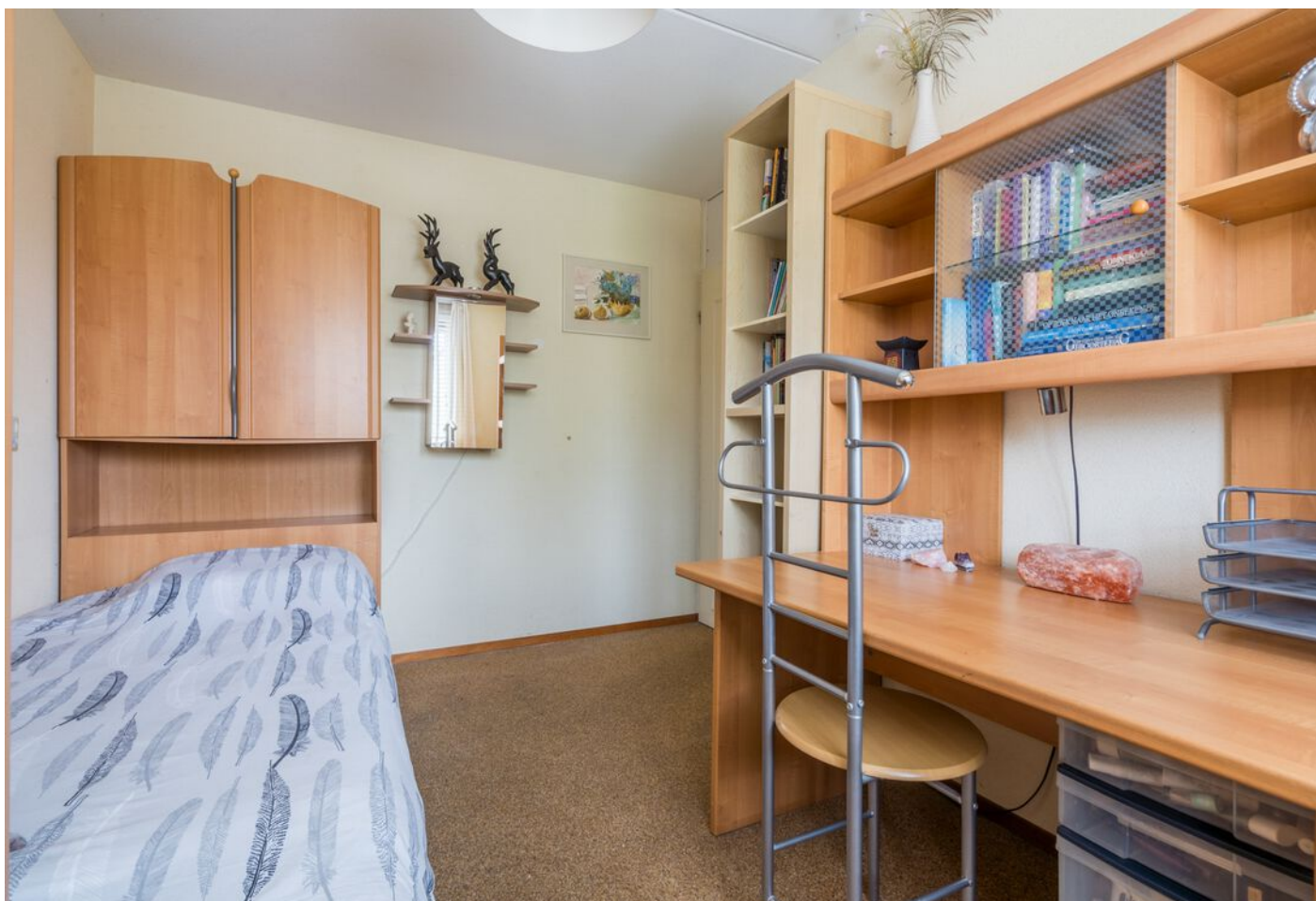
Braspenninglaan 28, 's-Hertogenbosch