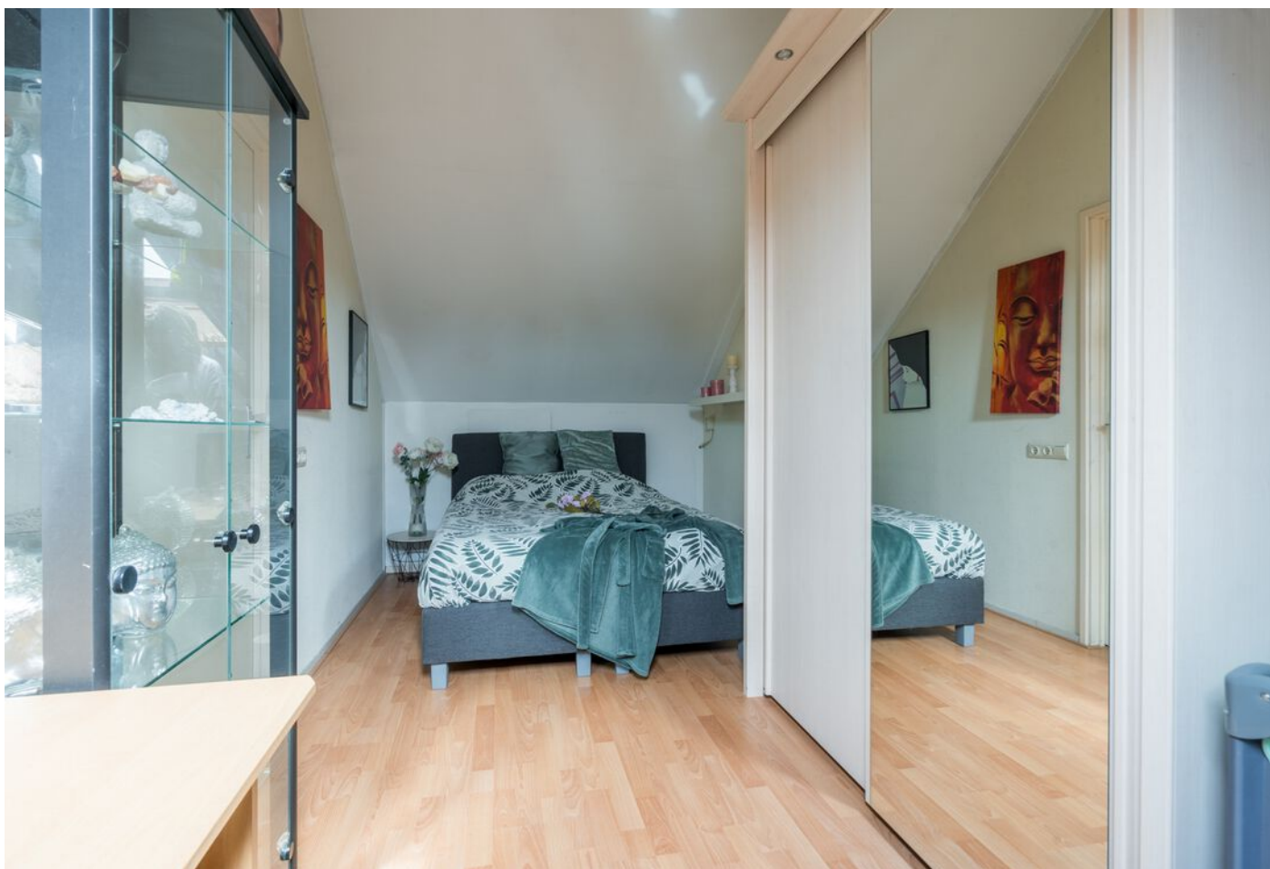
Braspenninglaan 28, 's-Hertogenbosch