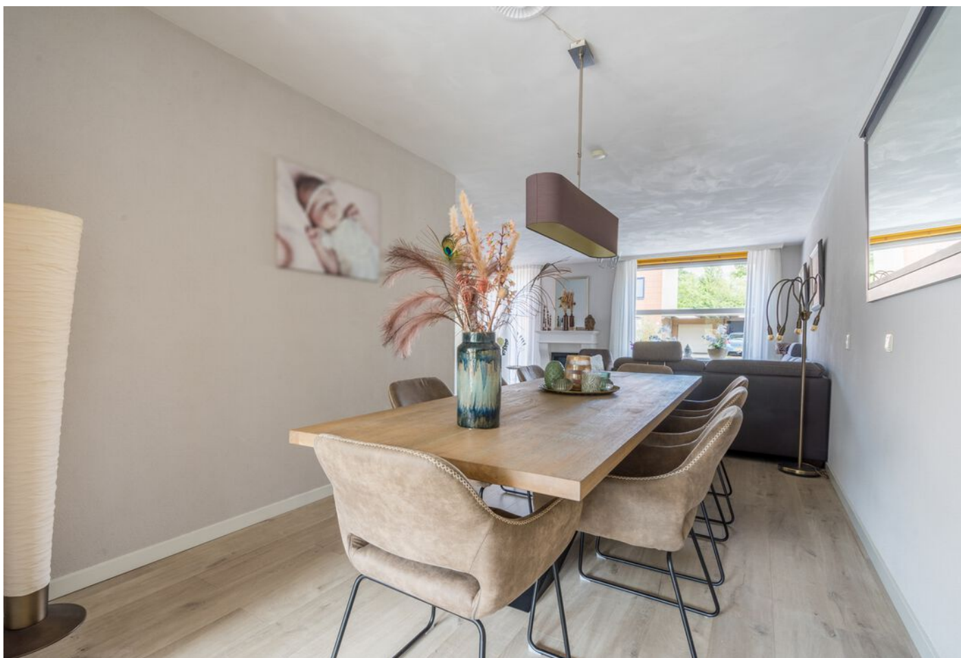
Braspenninglaan 28, 's-Hertogenbosch