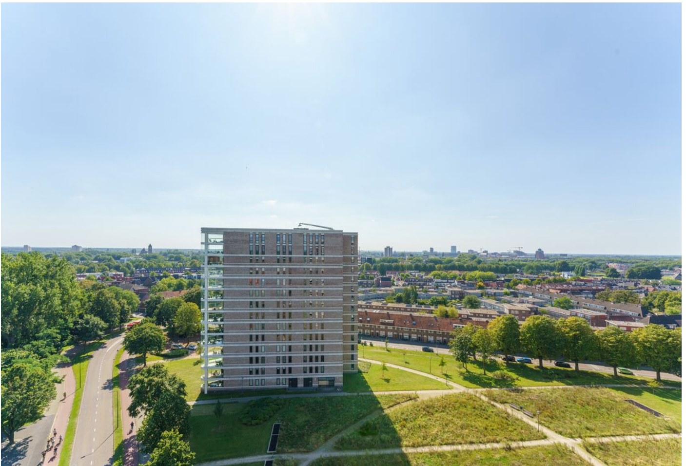
Baden Powellstraat 79, 's-Hertogenbosch