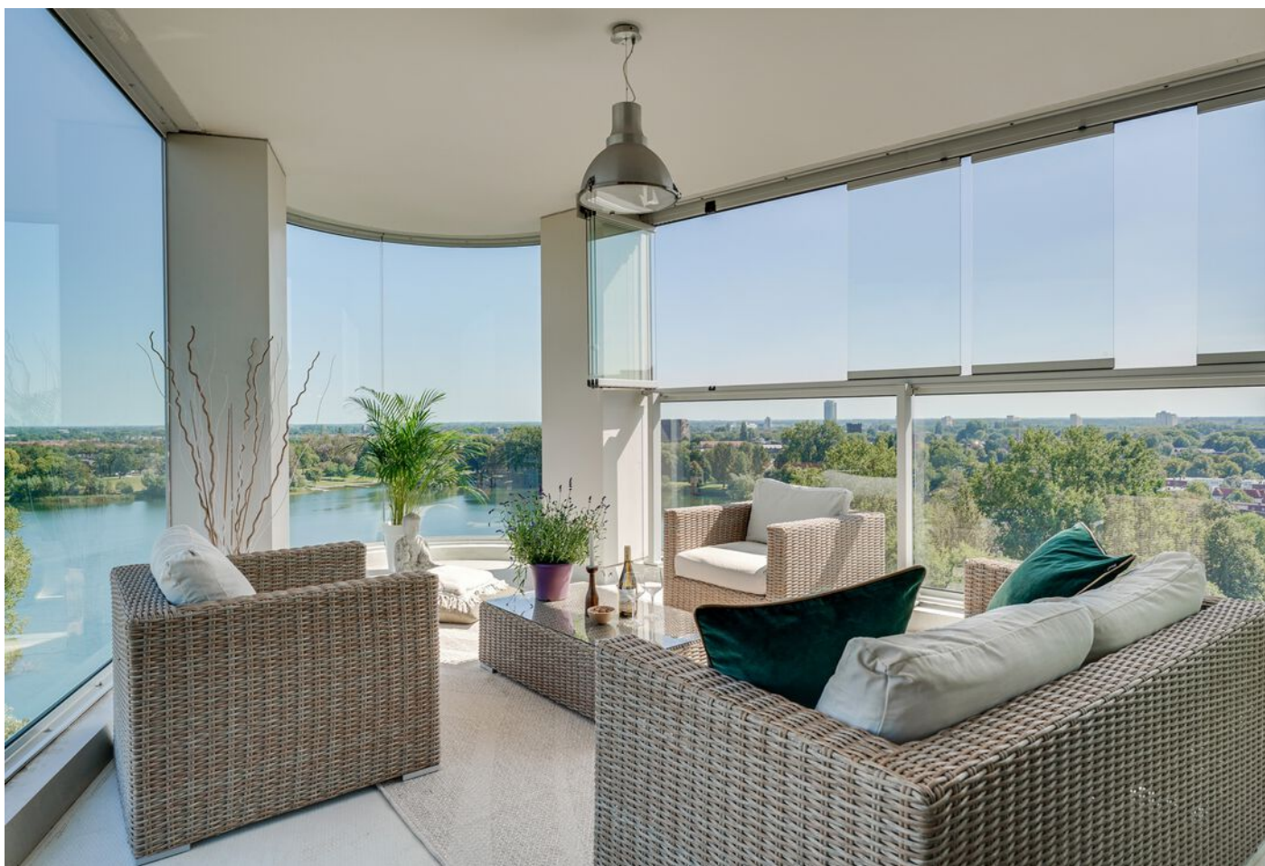
Baden Powellstraat 79, 's-Hertogenbosch