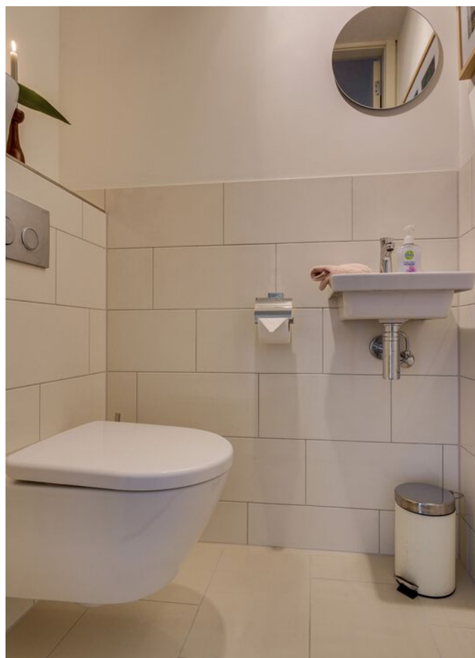
Baden Powellstraat 79, 's-Hertogenbosch