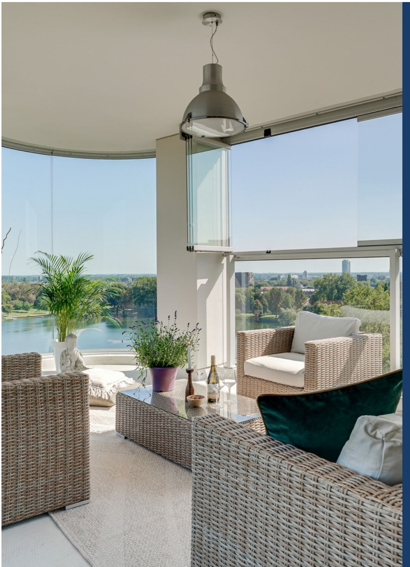
Baden Powellstraat 79, 's-Hertogenbosch