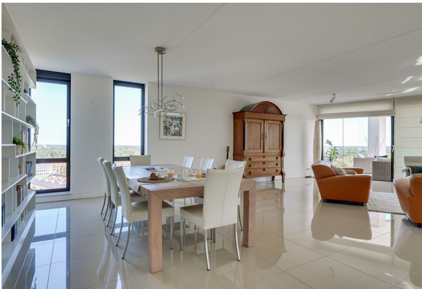
Baden Powellstraat 79, 's-Hertogenbosch