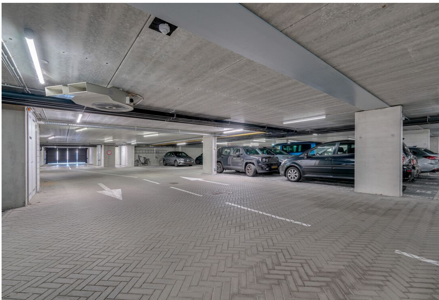
Baden Powellstraat 79, 's-Hertogenbosch