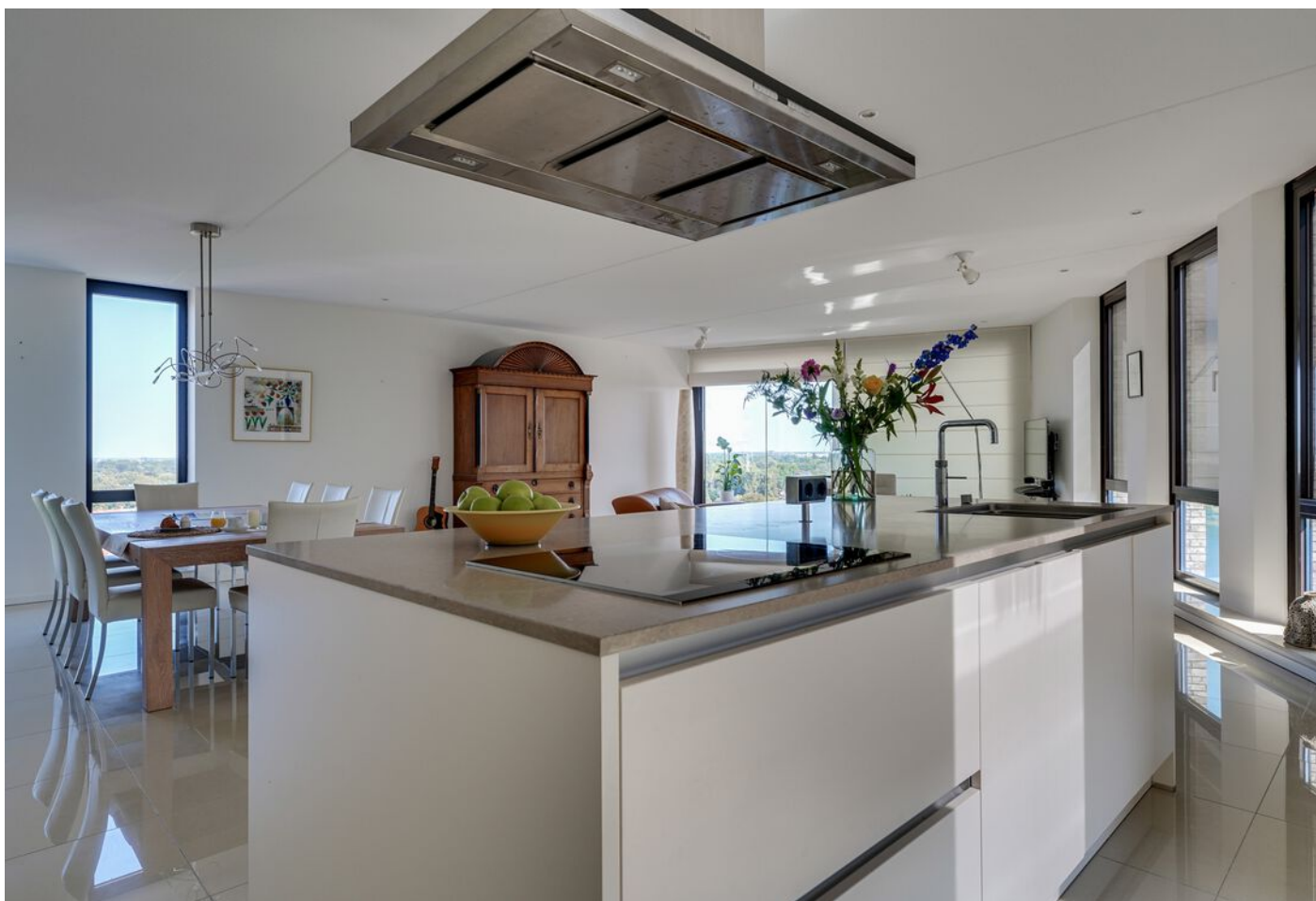
Baden Powellstraat 79, 's-Hertogenbosch