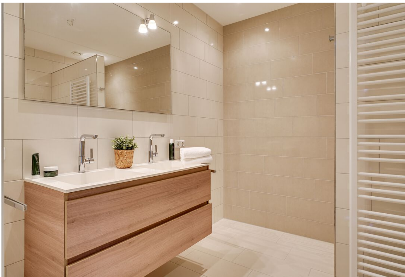
Baden Powellstraat 79, 's-Hertogenbosch