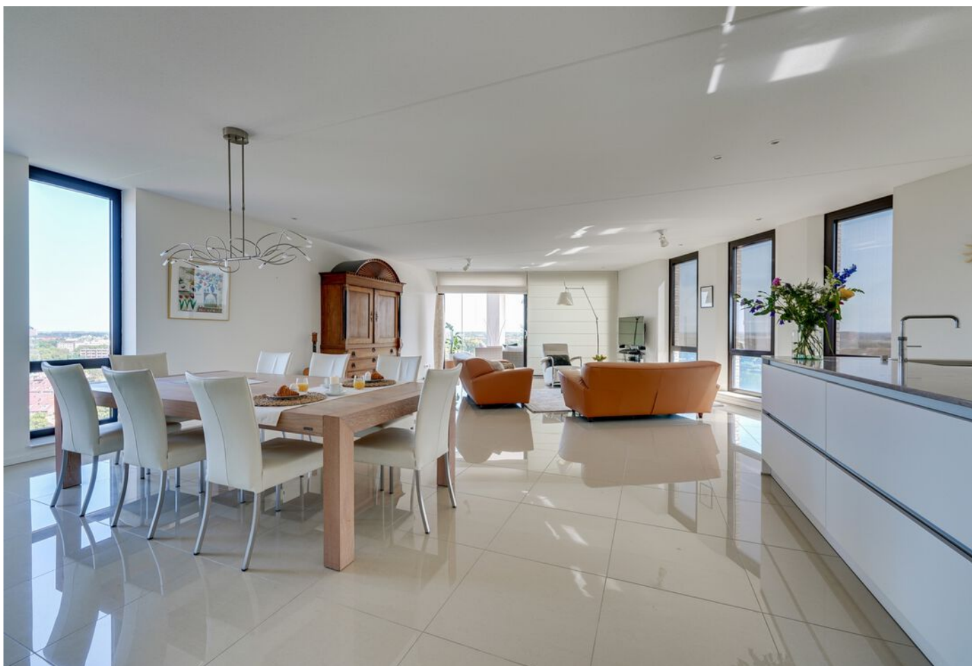
Baden Powellstraat 79, 's-Hertogenbosch