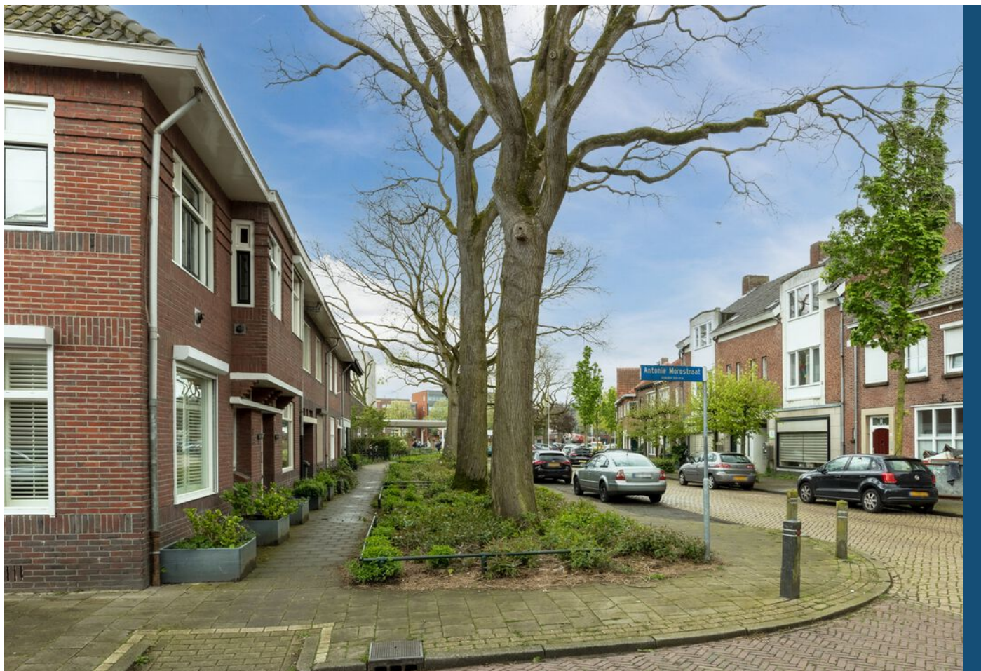
Antonie Morostraat 6, Eindhoven