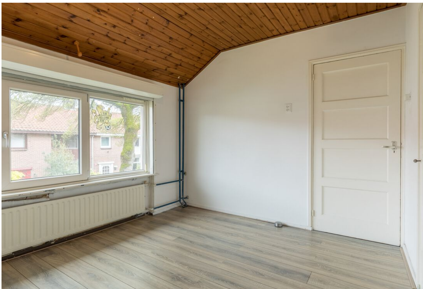
Antonie Morostraat 6, Eindhoven