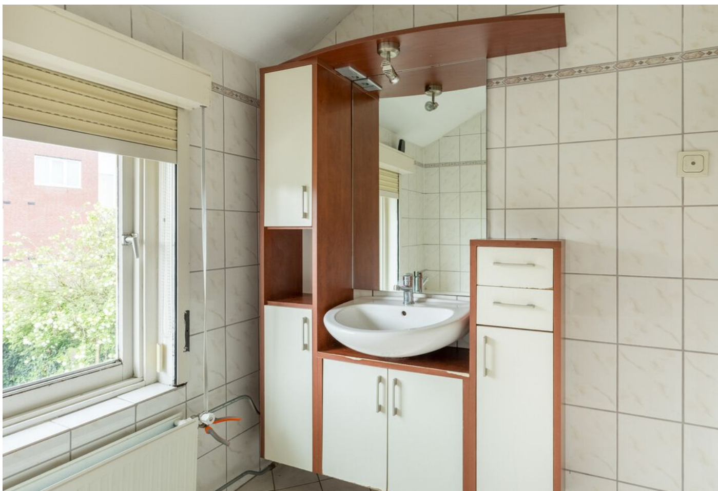
Antonie Morostraat 6, Eindhoven