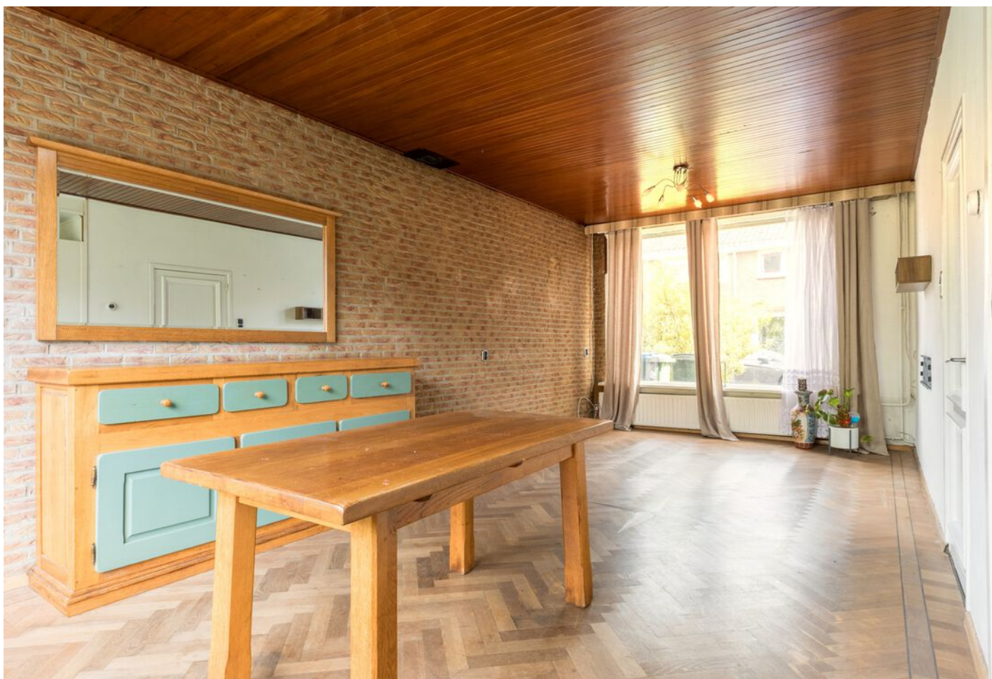
Antonie Morostraat 6, Eindhoven