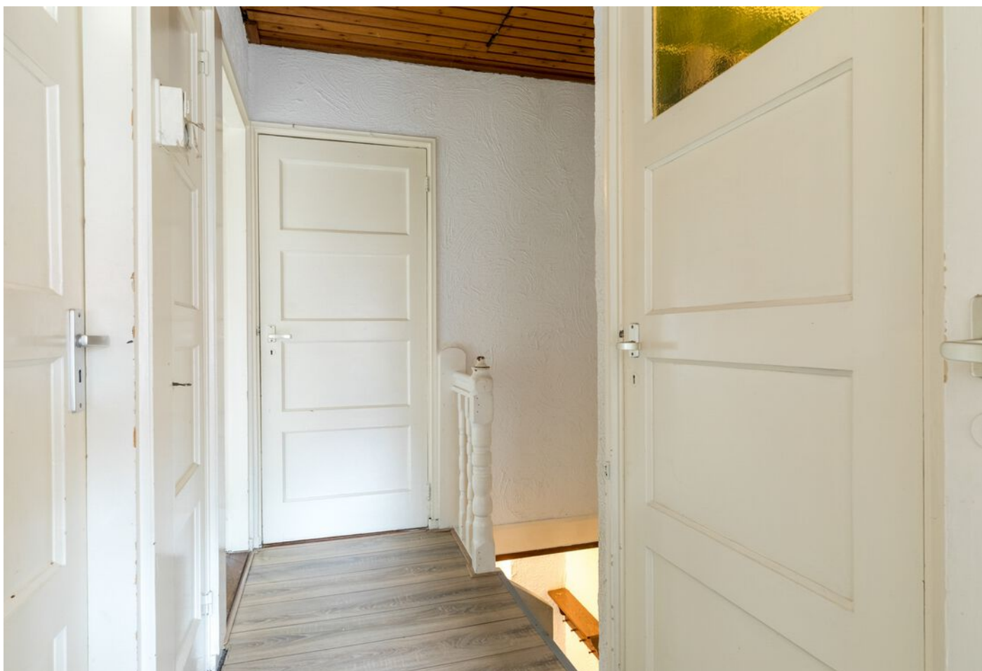
Antonie Morostraat 6, Eindhoven