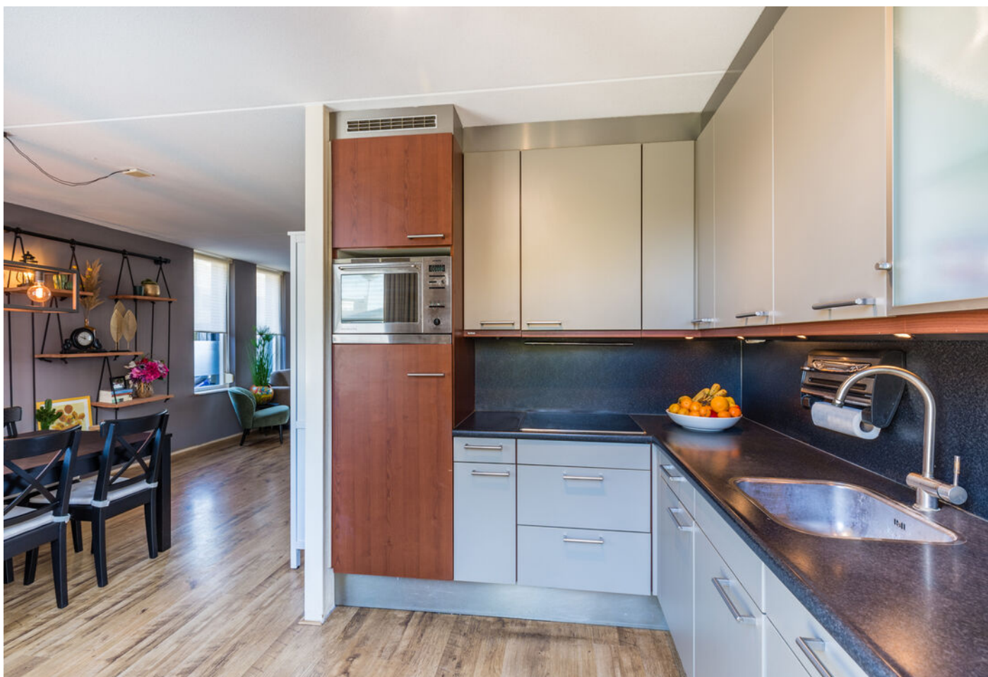
Zilverpark 108, 's-Hertogenbosch