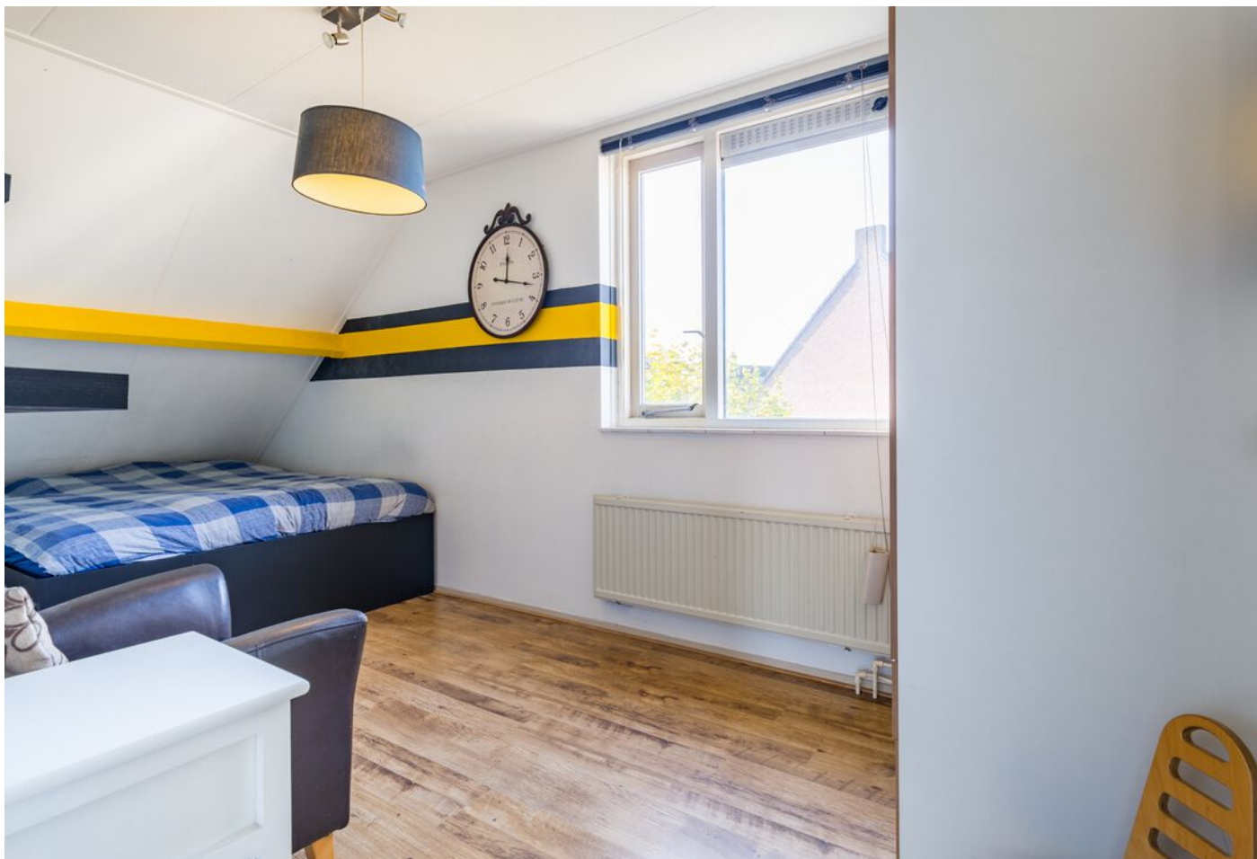
Zilverpark 108, 's-Hertogenbosch