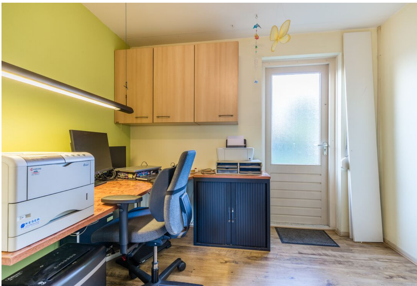
Zilverpark 108, 's-Hertogenbosch