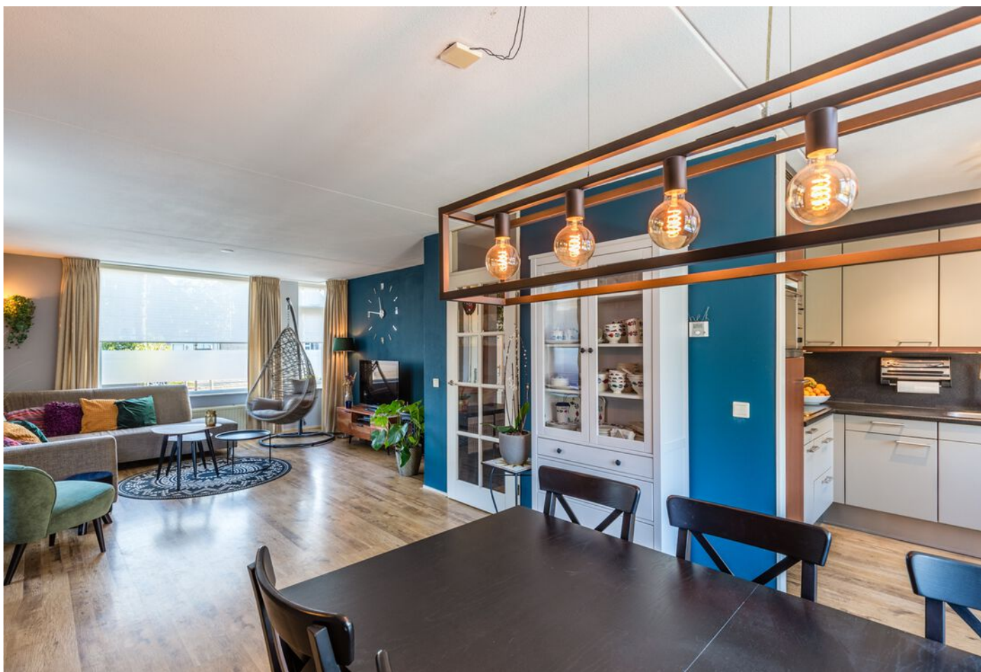
Zilverpark 108, 's-Hertogenbosch