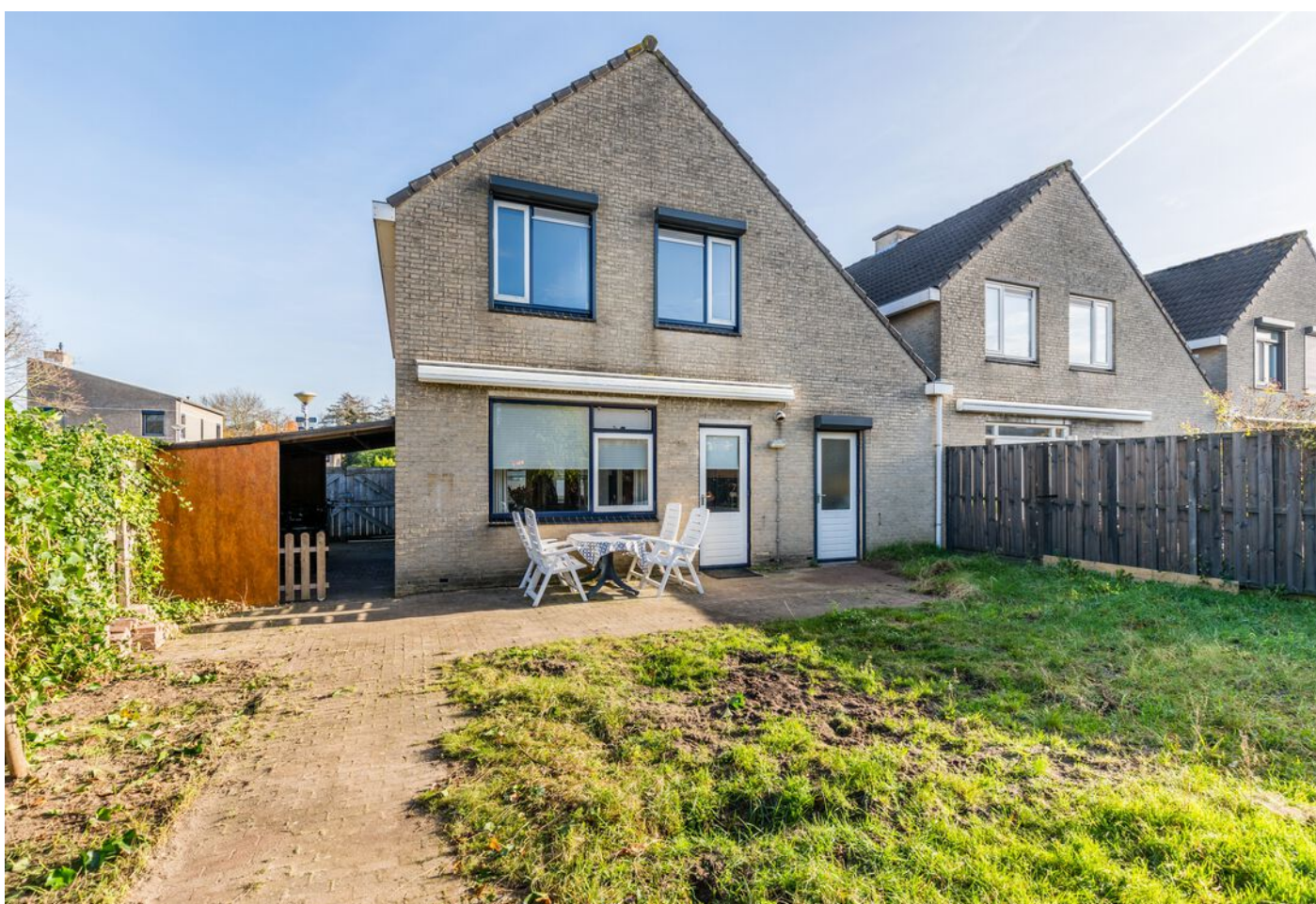
Zilverpark 108, 's-Hertogenbosch