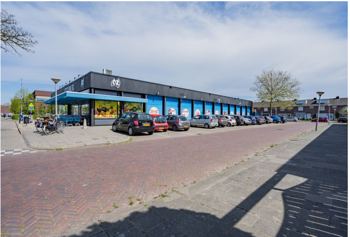
Vicaris Van Alphenstraat 8, Eindhoven