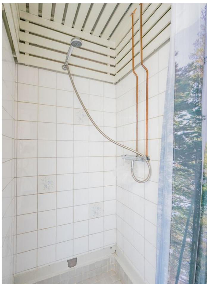
Vicaris Van Alphenstraat 8, Eindhoven