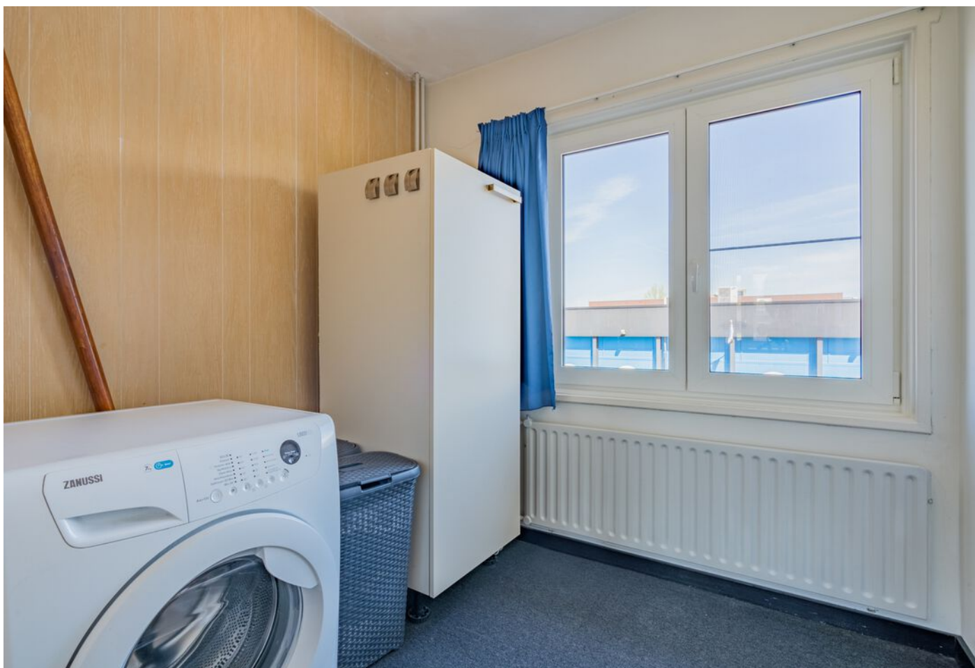
Vicaris Van Alphenstraat 8, Eindhoven