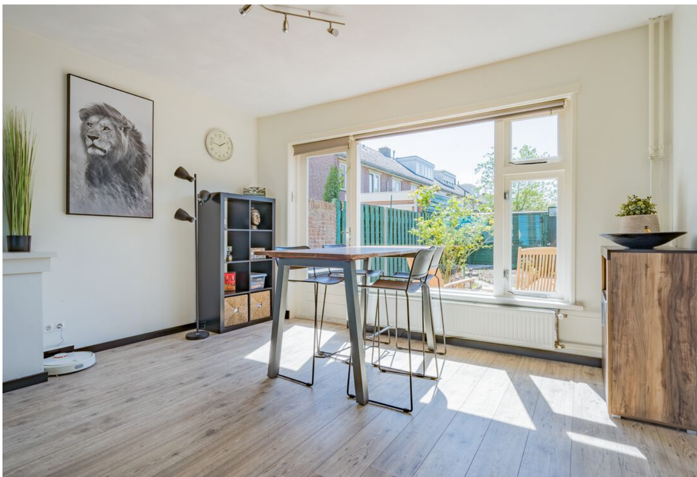
Vicaris Van Alphenstraat 8, Eindhoven