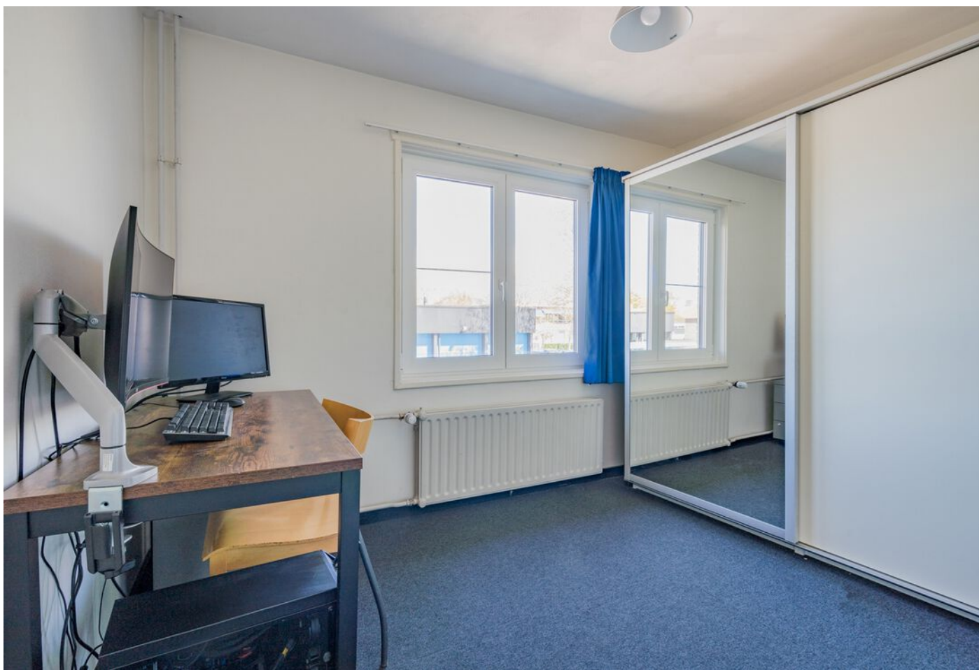
Vicaris Van Alphenstraat 8, Eindhoven