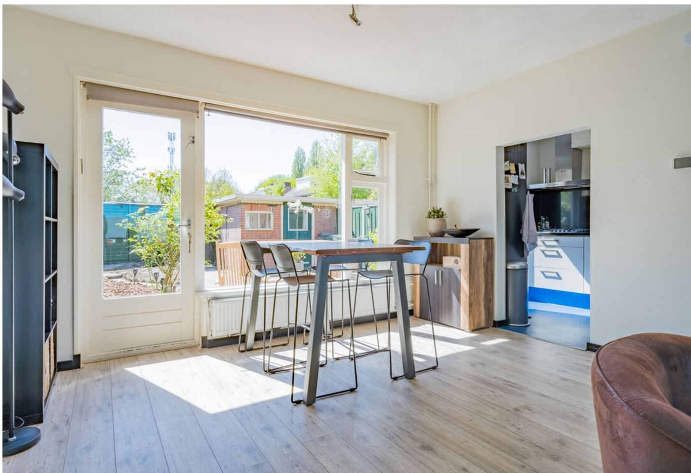
Vicaris Van Alphenstraat 8, Eindhoven