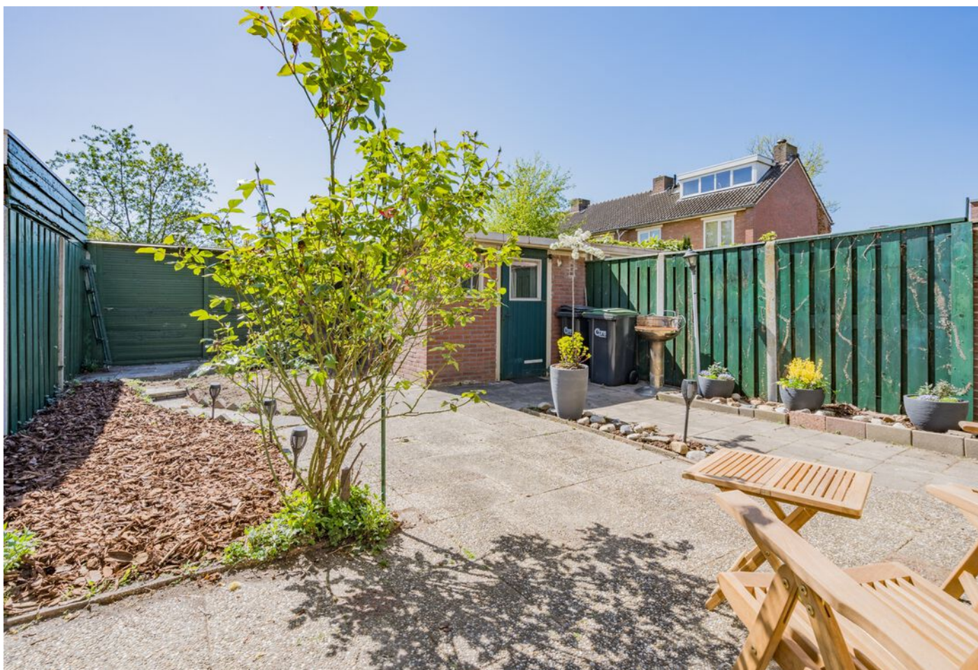
Vicaris Van Alphenstraat 8, Eindhoven