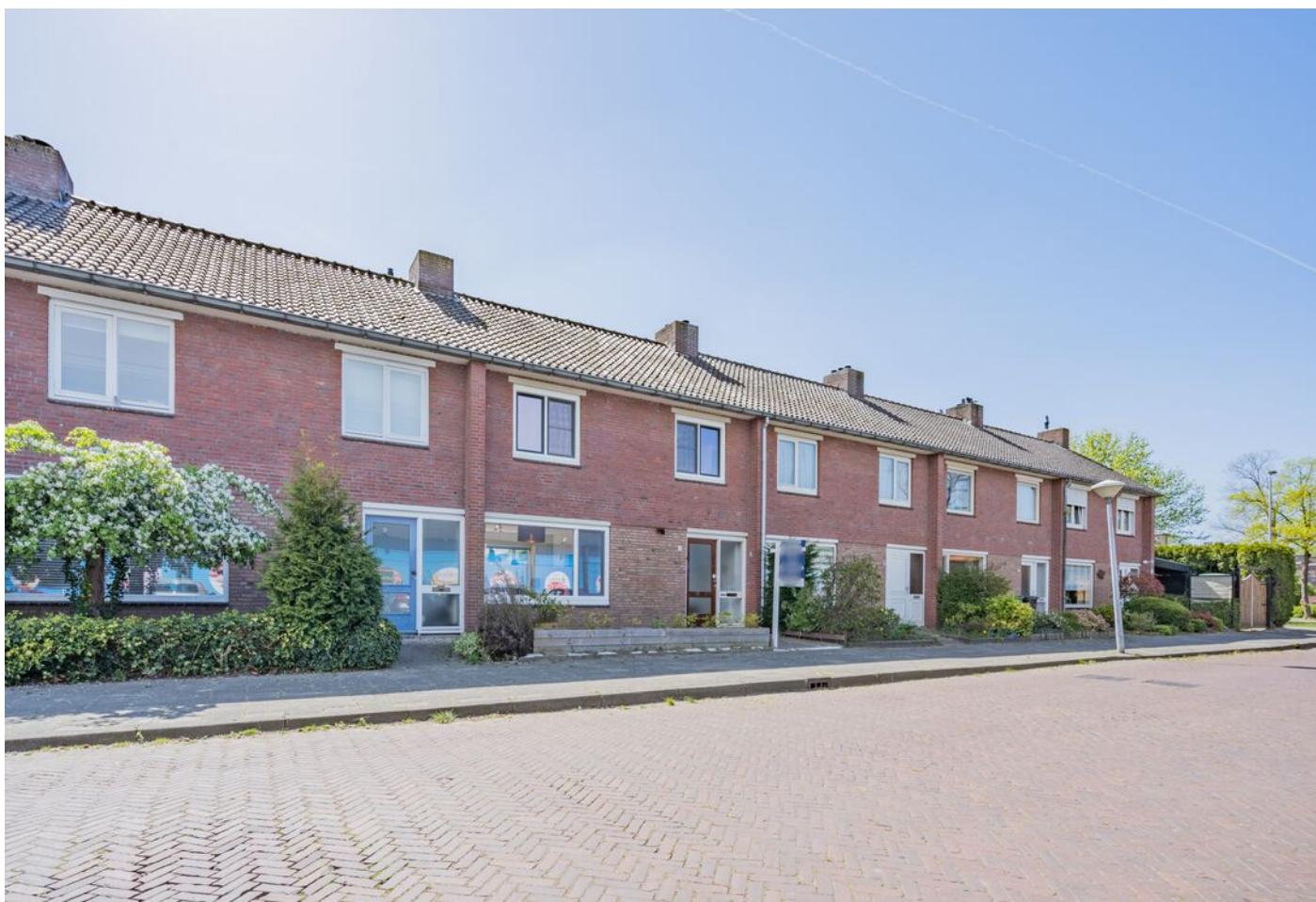
Vicaris Van Alphenstraat 8, Eindhoven