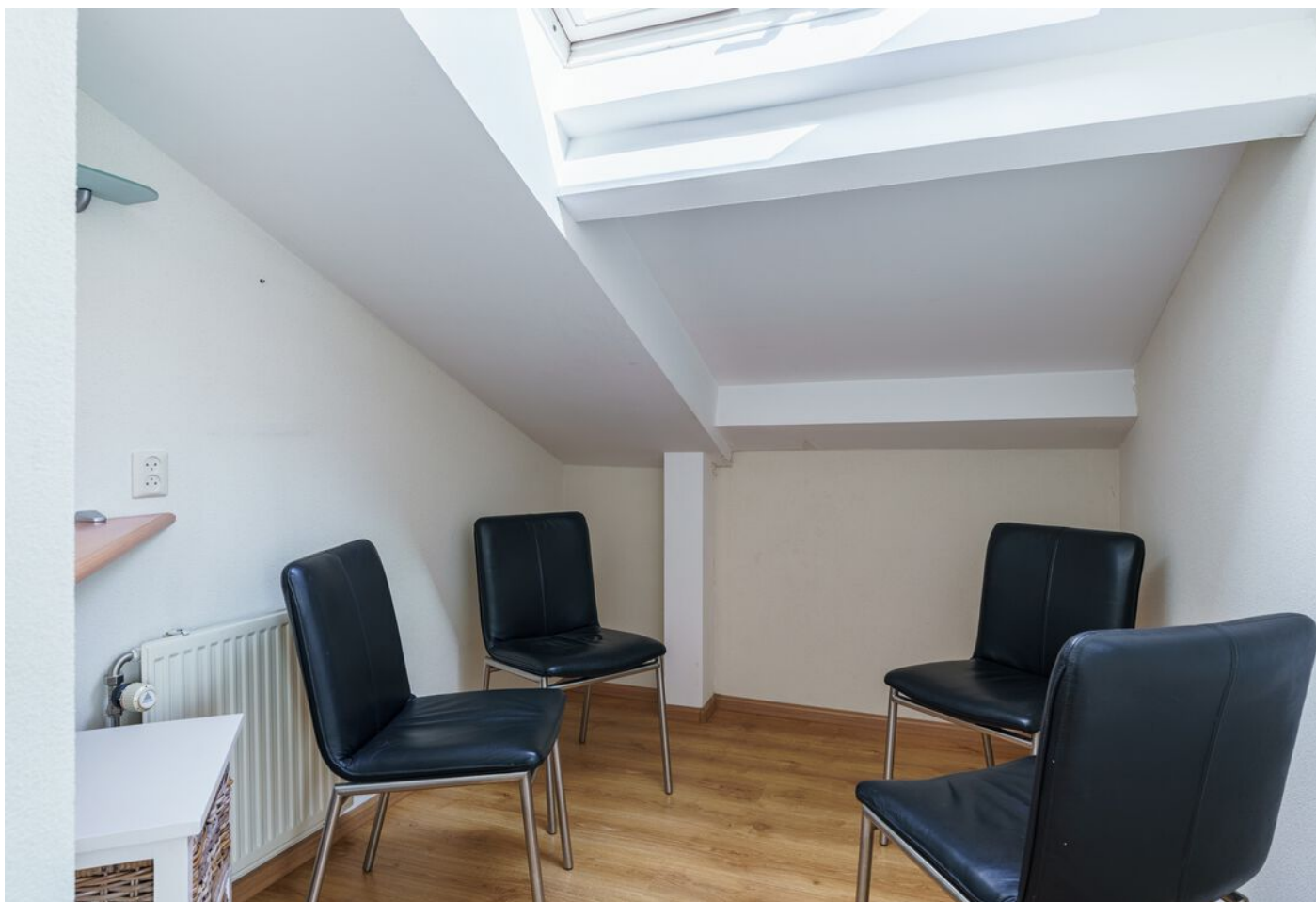
Veronaplein 8, 's-Hertogenbosch