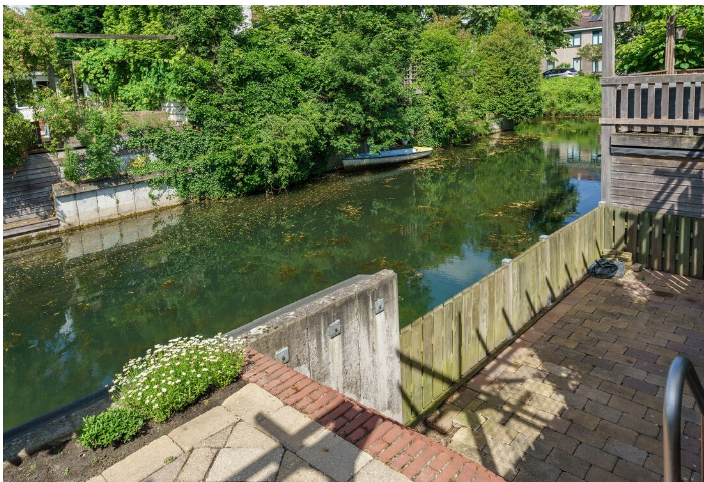
Veronaplein 8, 's-Hertogenbosch