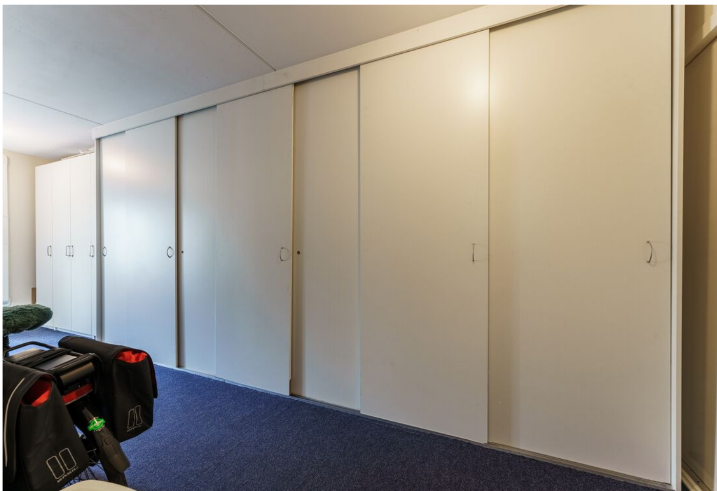
Veronaplein 8, 's-Hertogenbosch