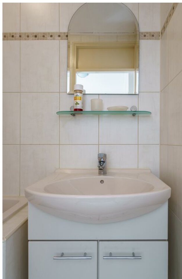
Veronaplein 8, 's-Hertogenbosch