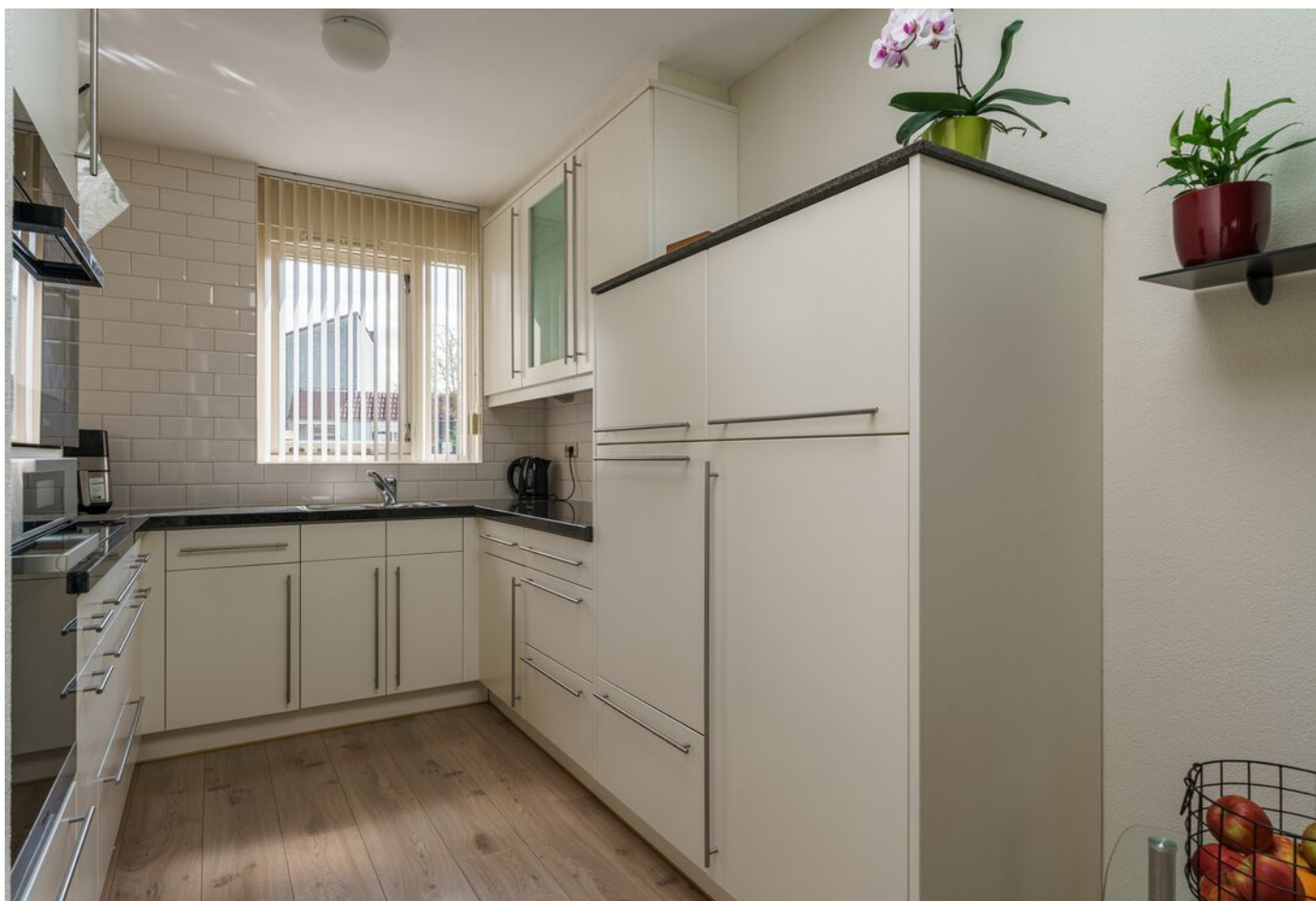
Veronaplein 8, 's-Hertogenbosch