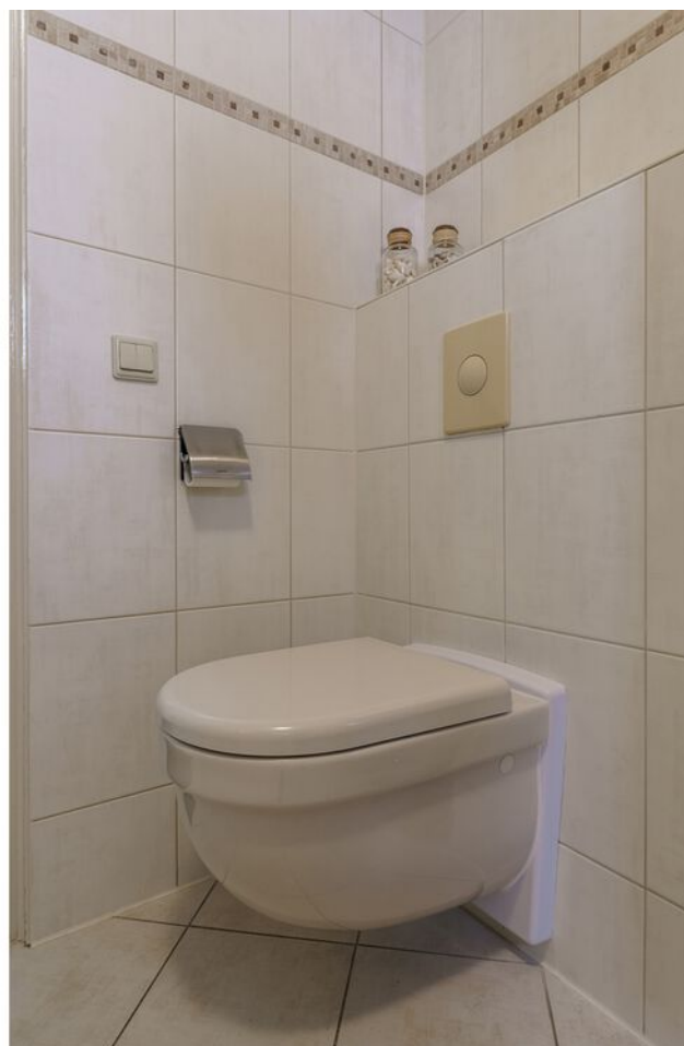
Veronaplein 8, 's-Hertogenbosch