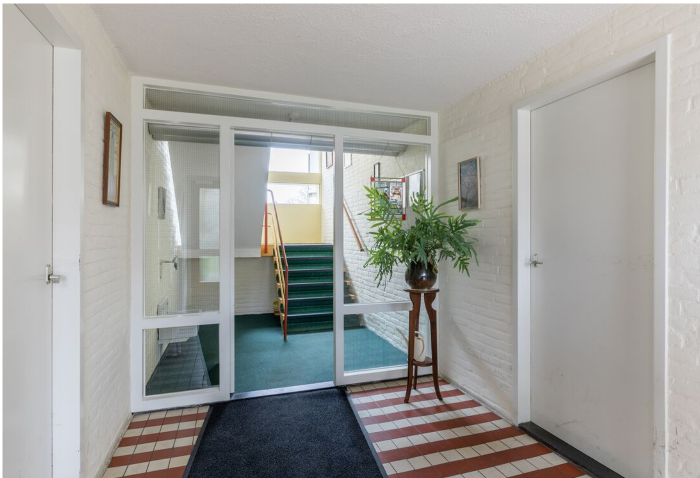
Veldmaarschalk Montgomerylaan 376, Eindhoven