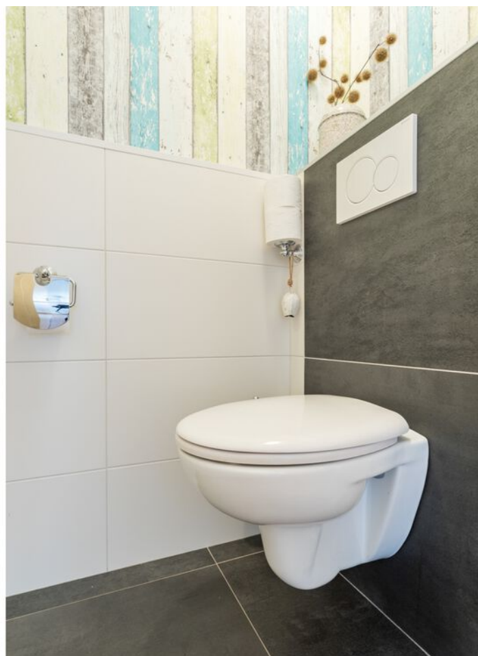
Veldmaarschalk Montgomerylaan 376, Eindhoven