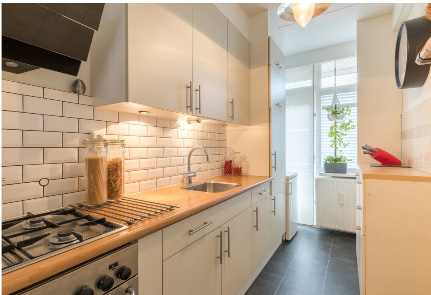
Veldmaarschalk Montgomerylaan 376, Eindhoven