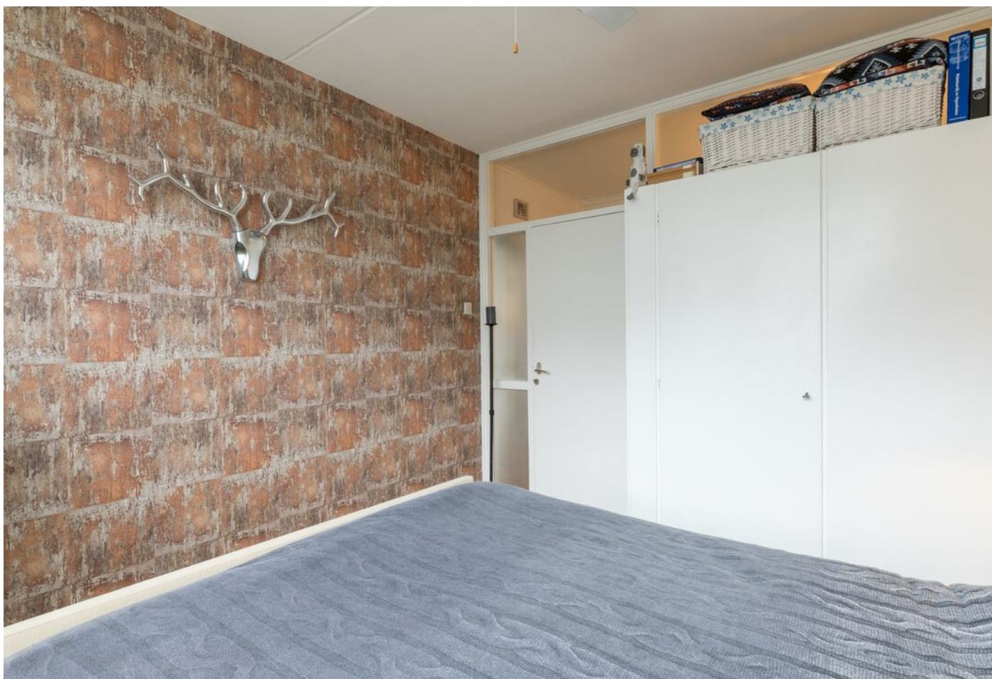
Veldmaarschalk Montgomerylaan 376, Eindhoven