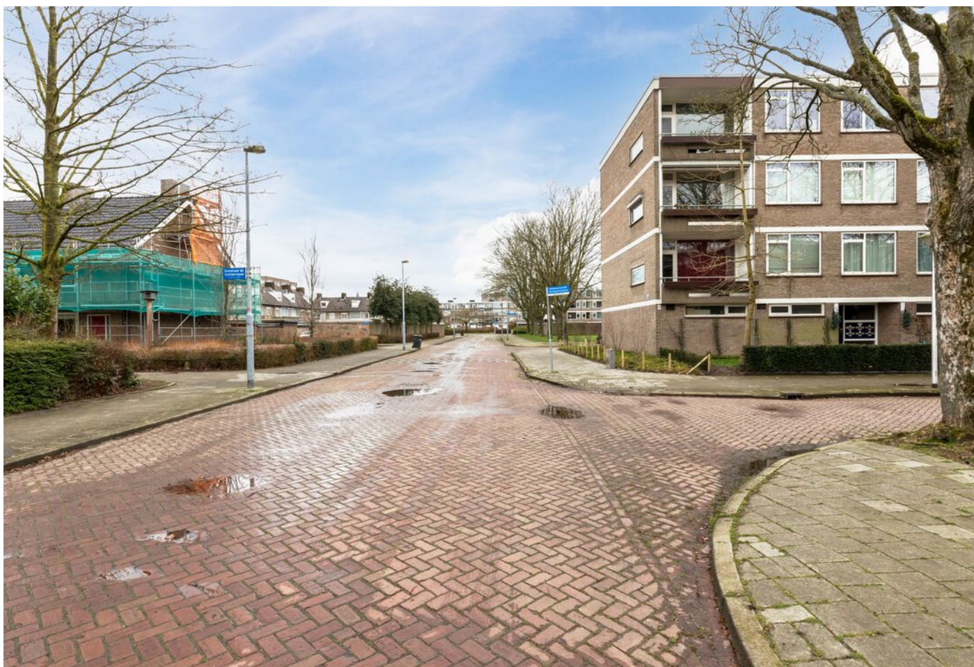
Veldmaarschalk Montgomerylaan 376, Eindhoven