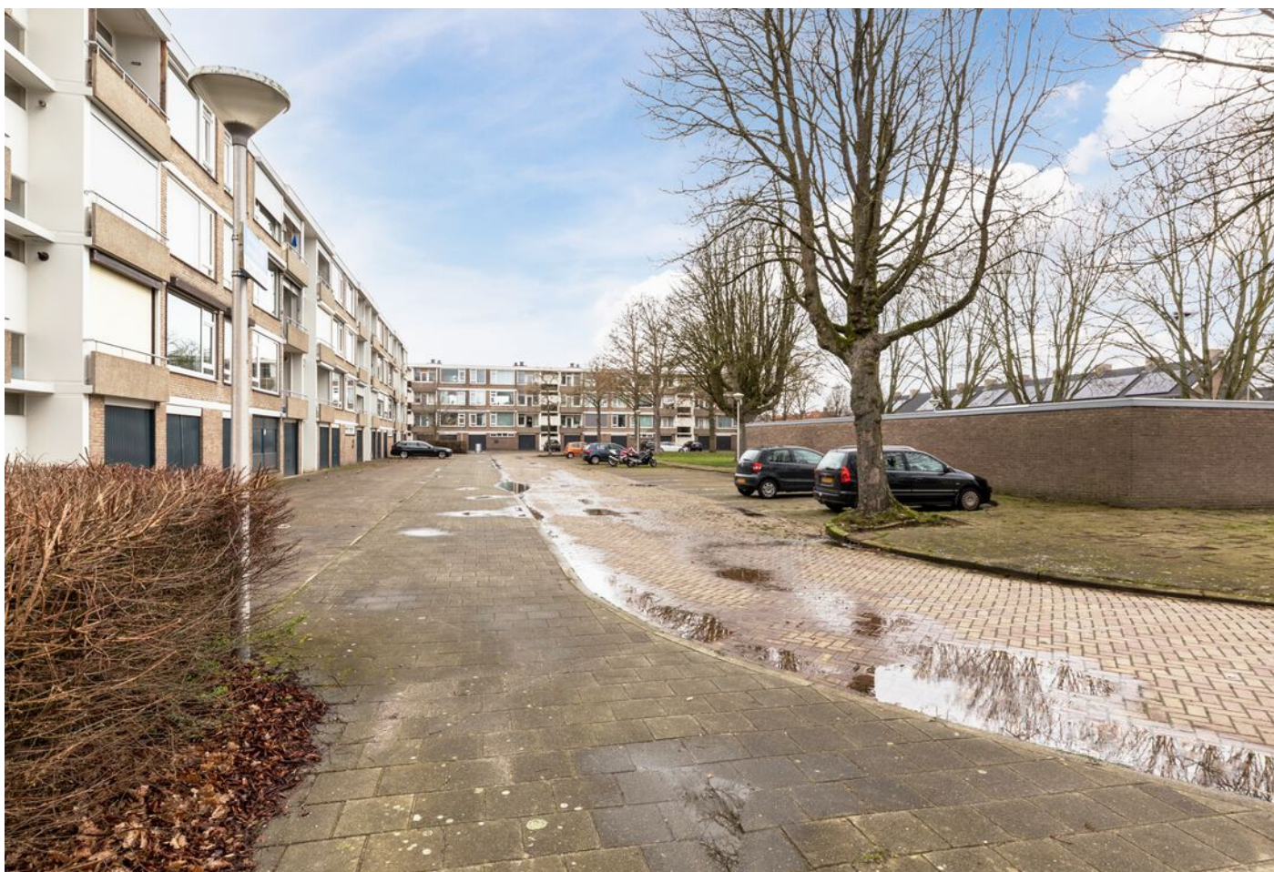
Veldmaarschalk Montgomerylaan 376, Eindhoven