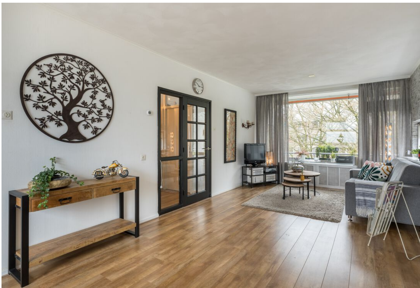
Veldmaarschalk Montgomerylaan 376, Eindhoven