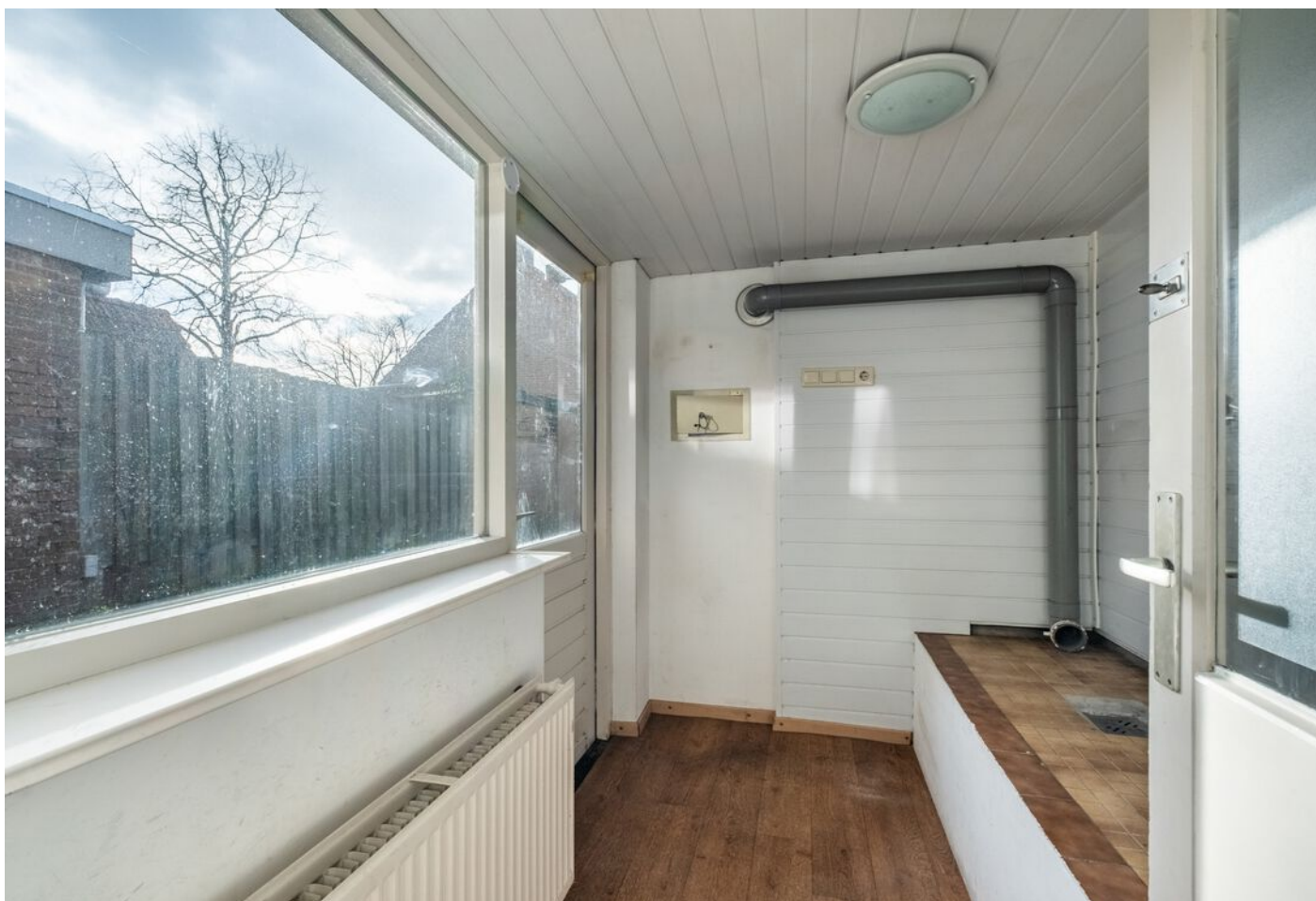
Van Rijckevorselstraat 14, Vught