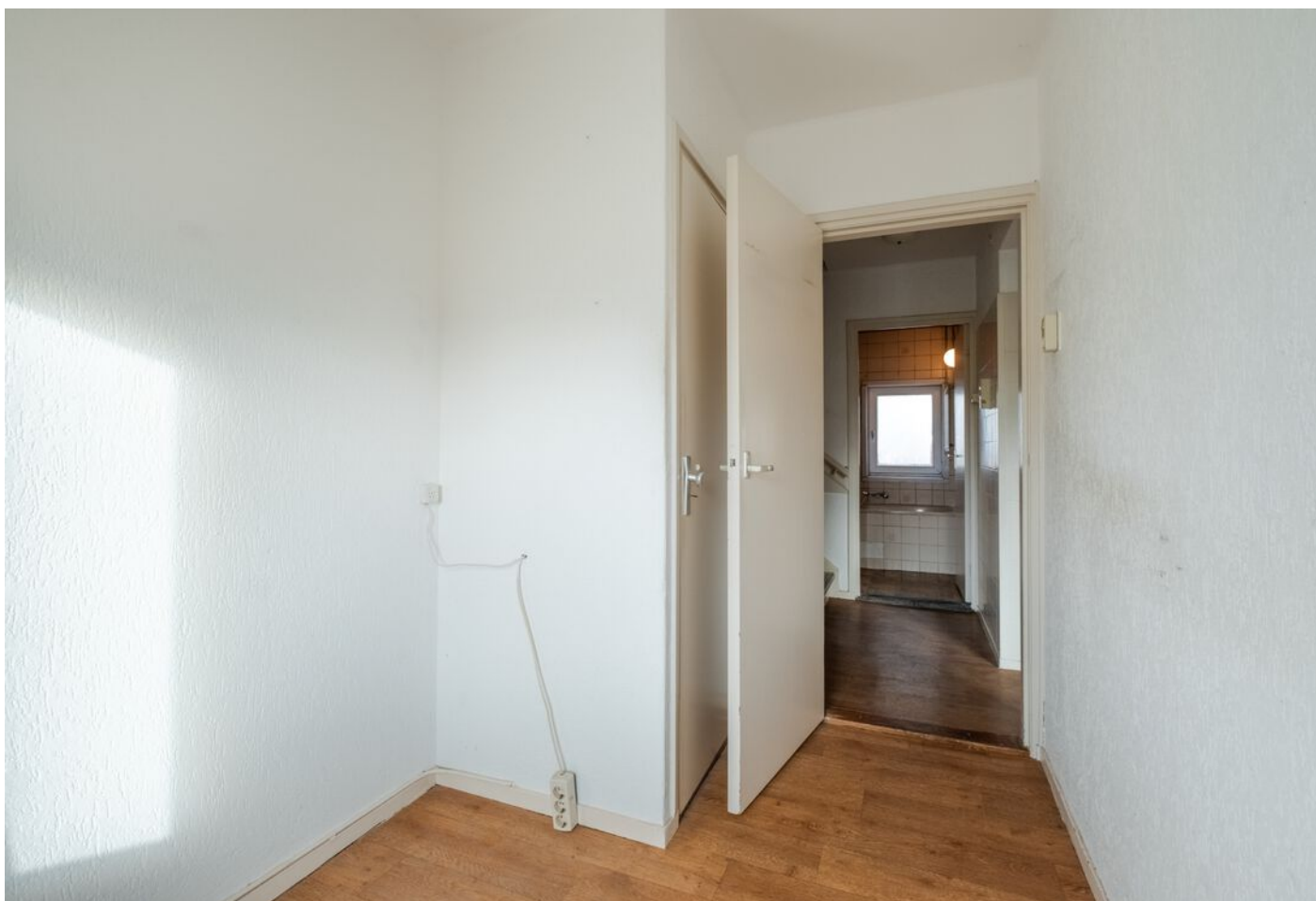
Van Rijckevorselstraat 14, Vught