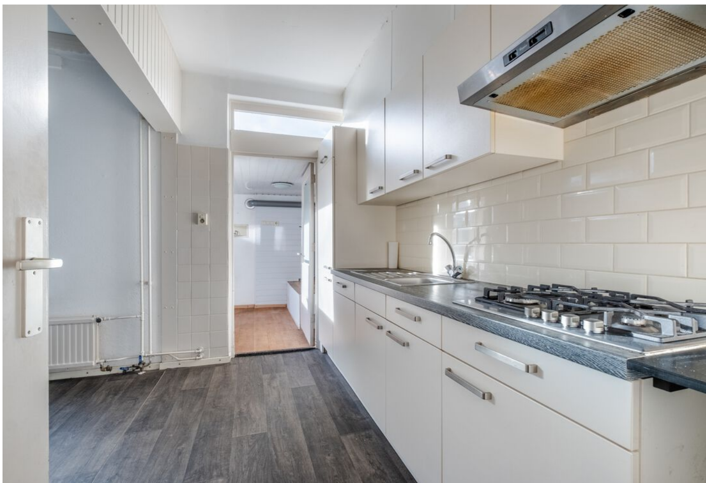
Van Rijckevorselstraat 14, Vught