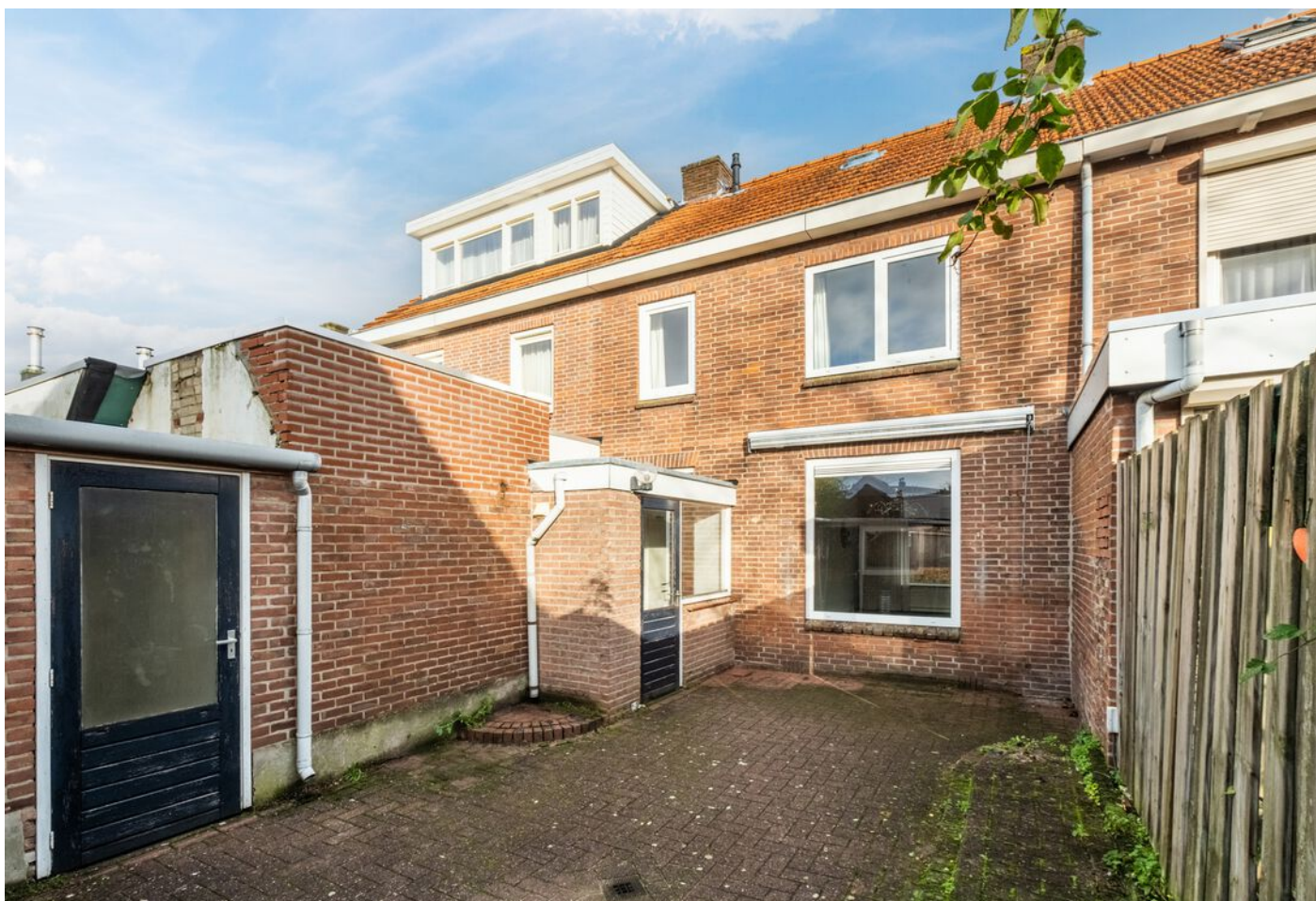
Van Rijckevorselstraat 14, Vught