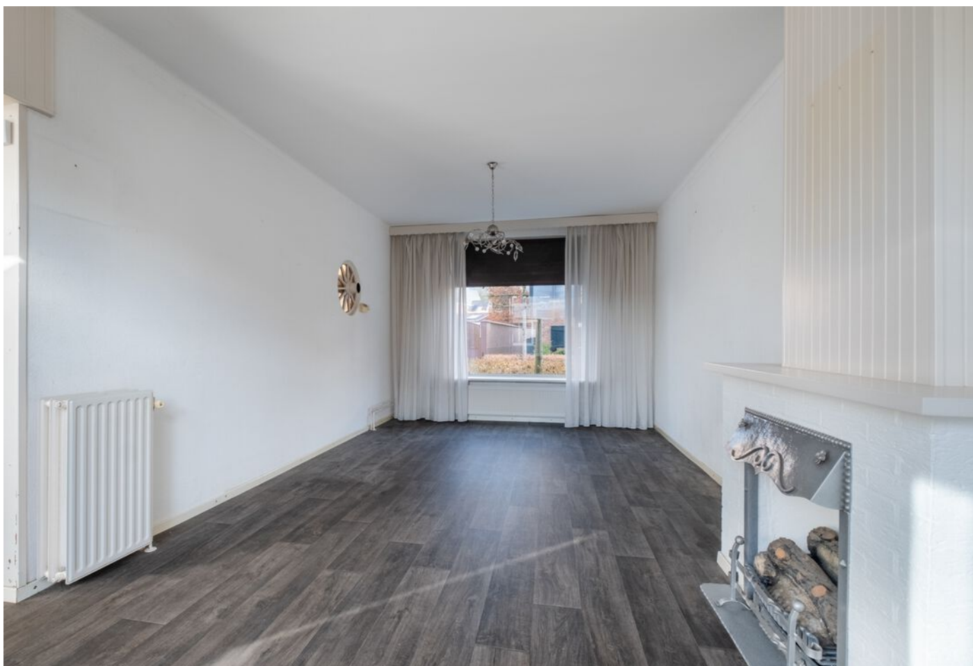
Van Rijckevorselstraat 14, Vught