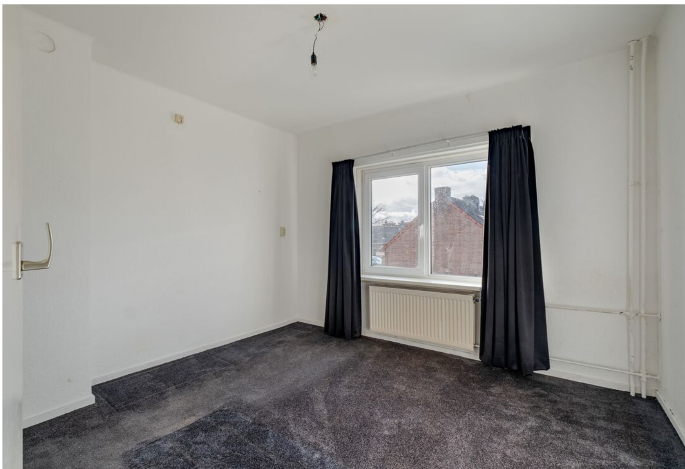
Van Rijckevorselstraat 14, Vught