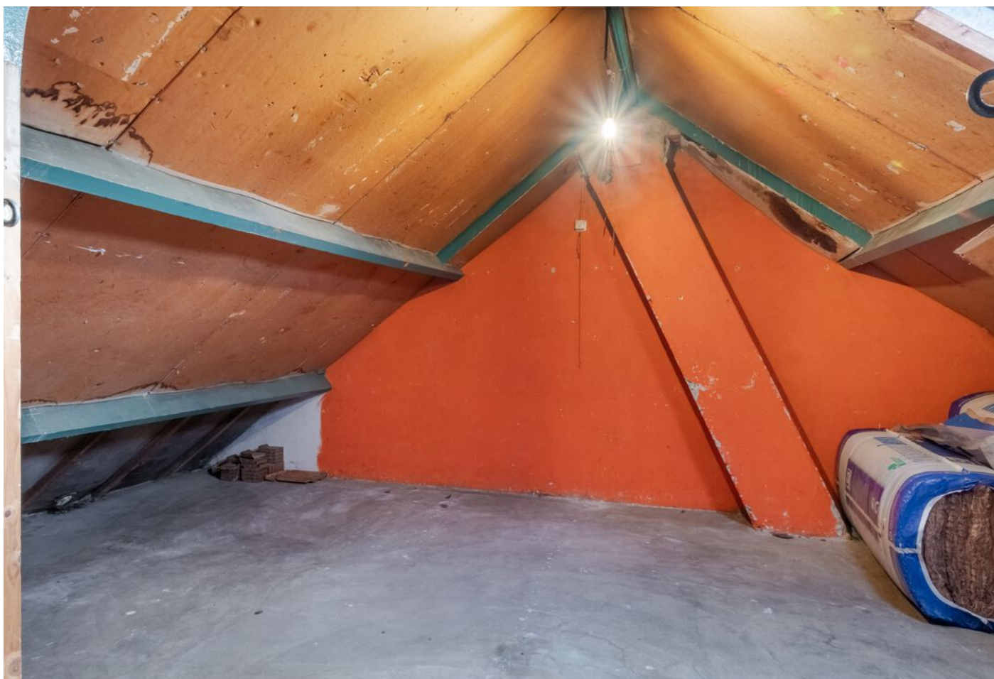
Van Rijckevorselstraat 14, Vught