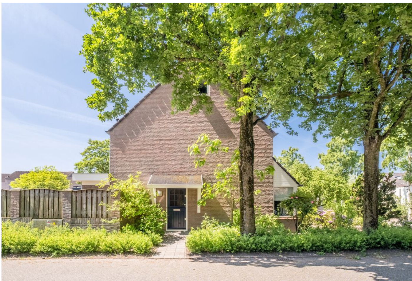
Van Beverwijkstraat 1, Schijndel