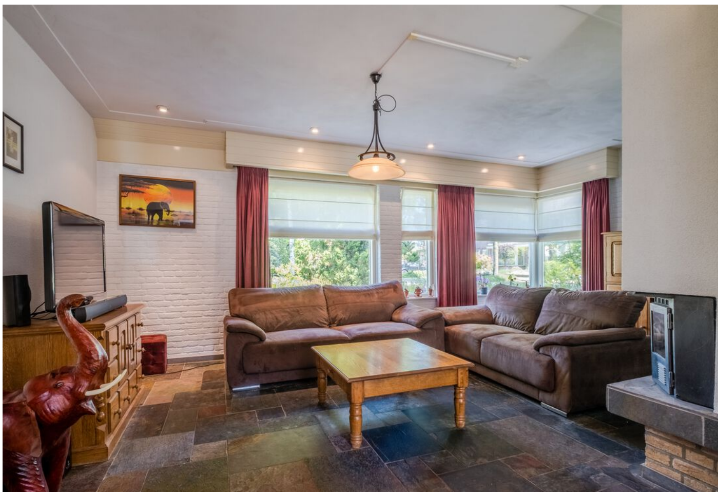
Van Beverwijkstraat 1, Schijndel