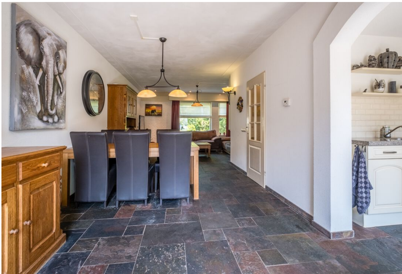
Van Beverwijkstraat 1, Schijndel