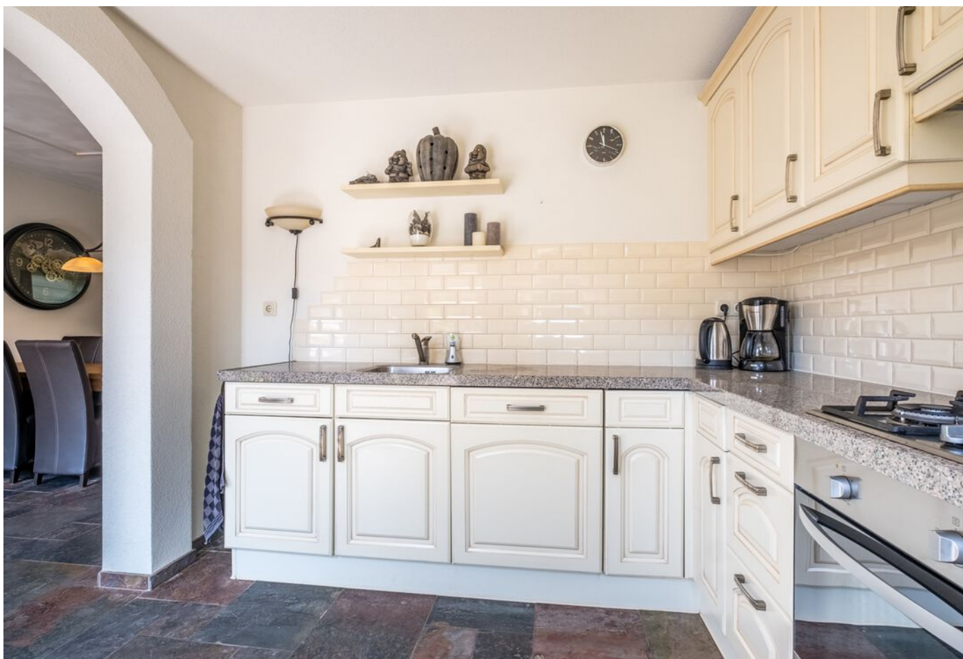
Van Beverwijkstraat 1, Schijndel