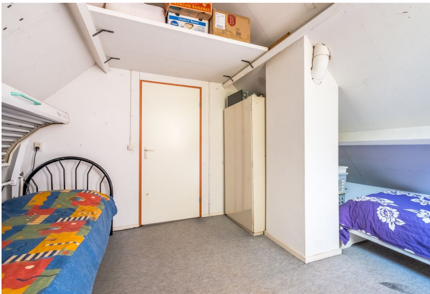
Van Beverwijkstraat 1, Schijndel