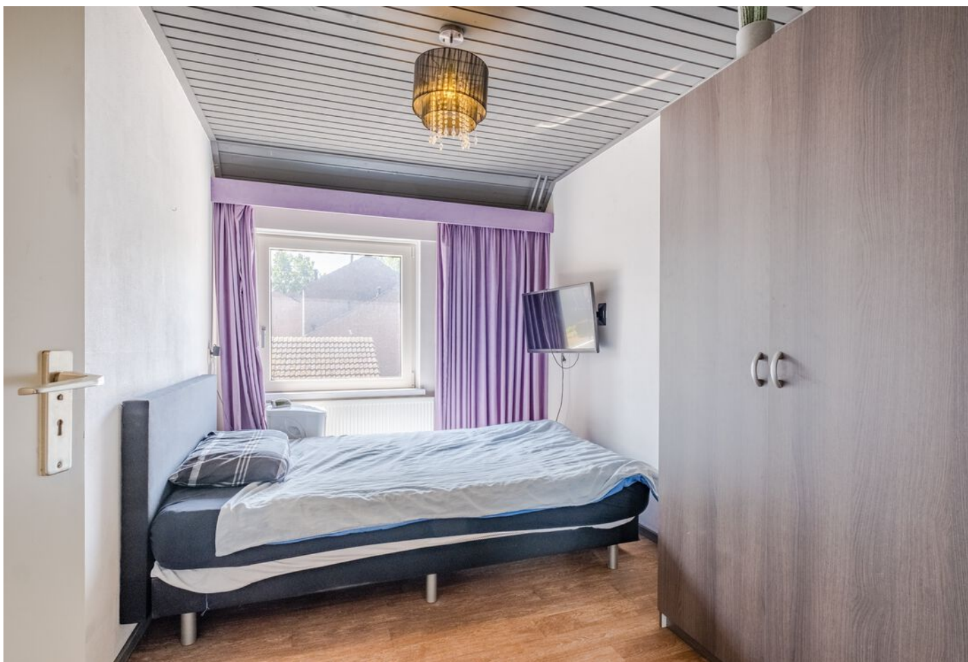
Van Beverwijkstraat 1, Schijndel