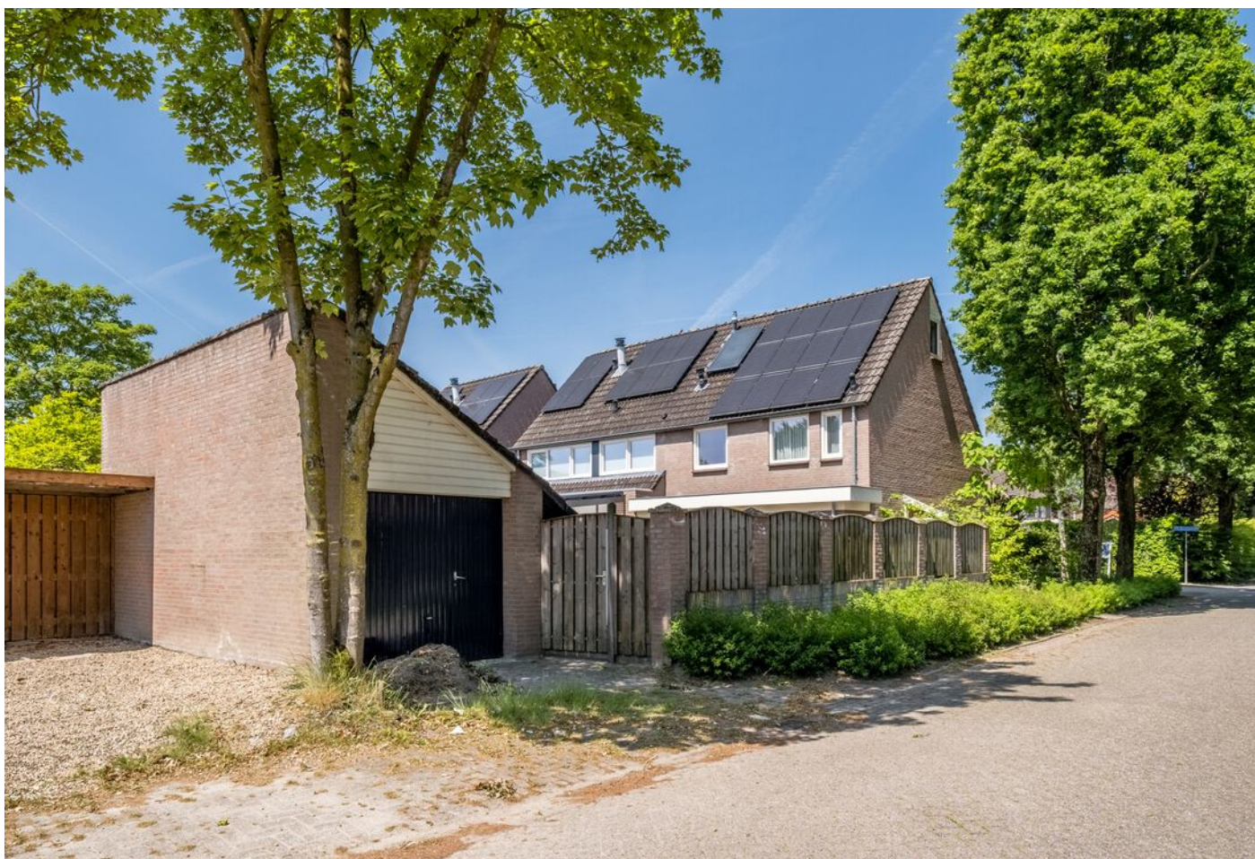
Van Beverwijkstraat 1, Schijndel