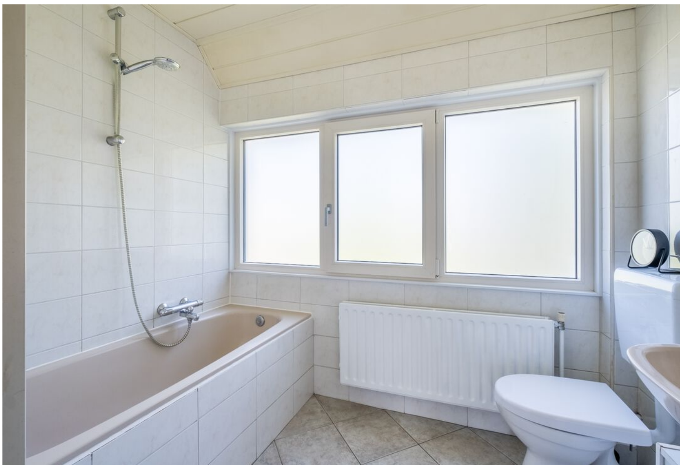
Van Beverwijkstraat 1, Schijndel