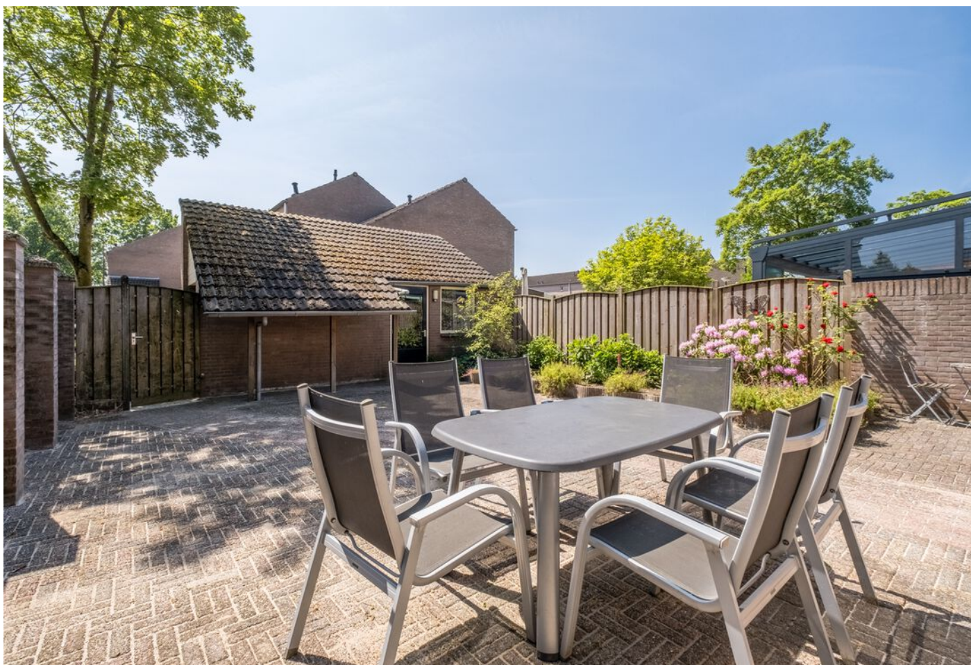
Van Beverwijkstraat 1, Schijndel