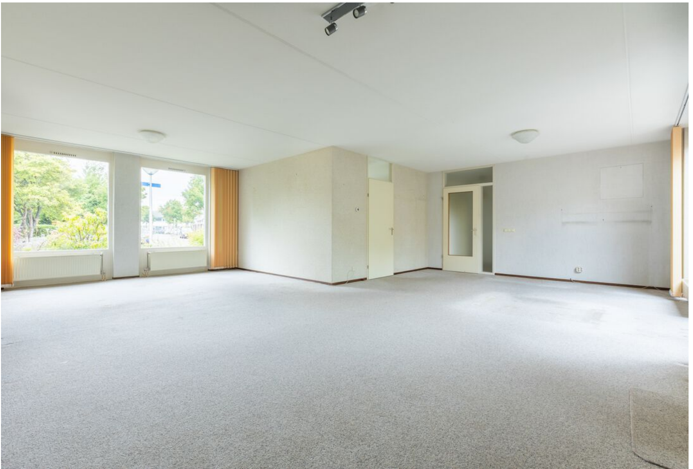
Turfveldenstraat 4, Eindhoven