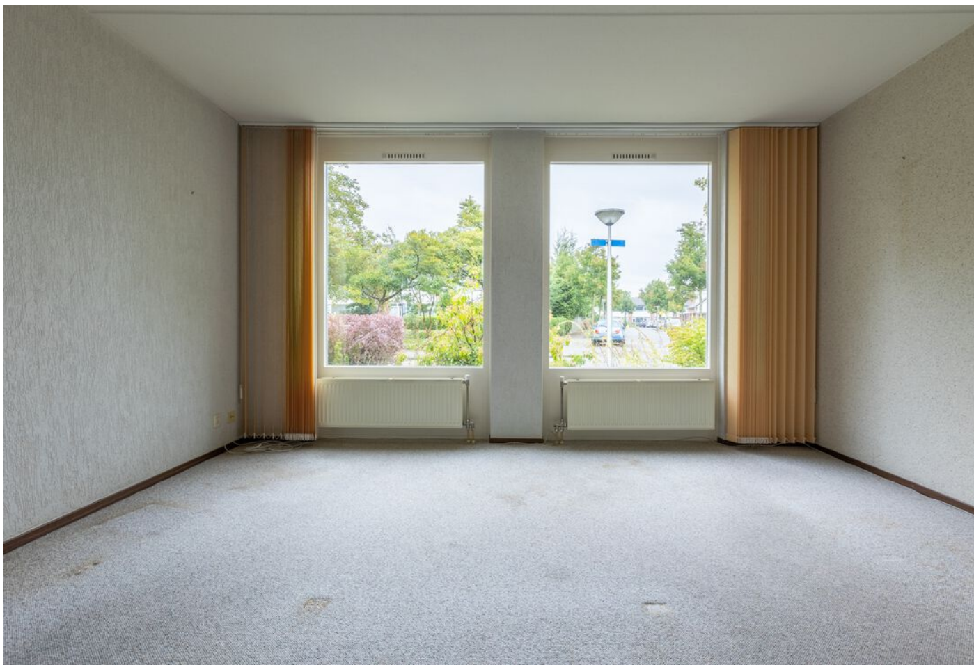
Turfveldenstraat 4, Eindhoven