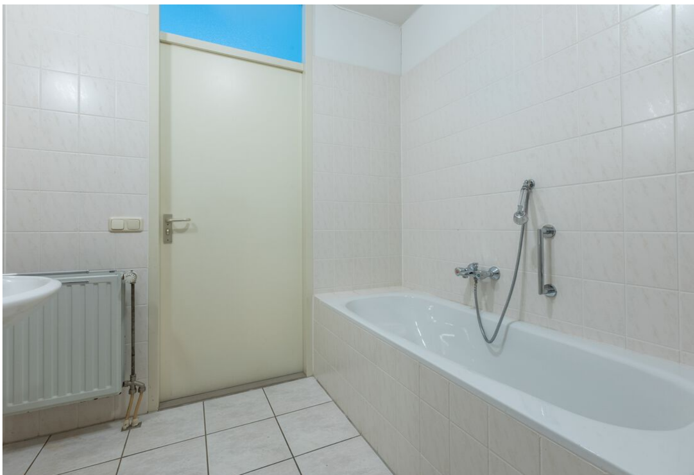
Turfveldenstraat 4, Eindhoven