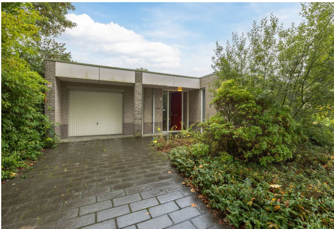
Turfveldenstraat 4, Eindhoven