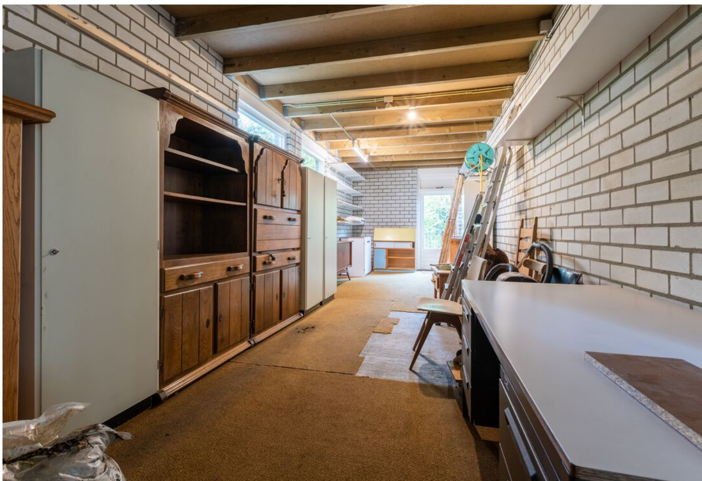
Turfveldenstraat 4, Eindhoven