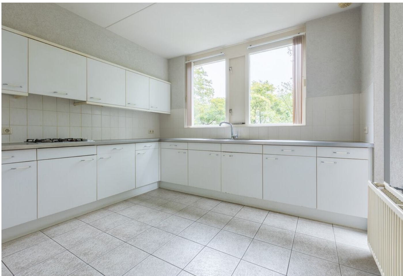
Turfveldenstraat 4, Eindhoven