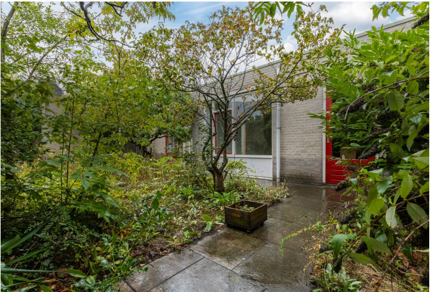
Turfveldenstraat 4, Eindhoven