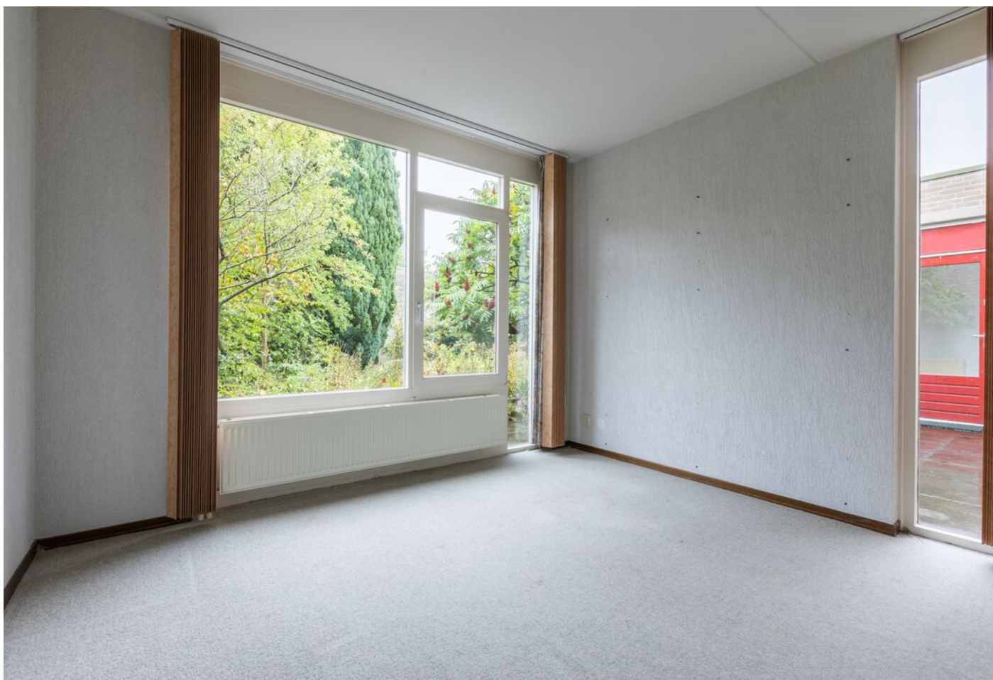
Turfveldenstraat 4, Eindhoven