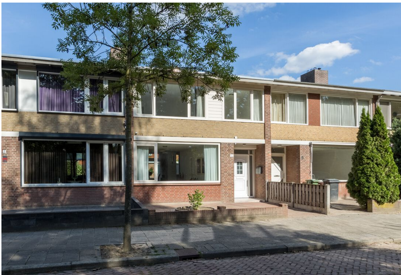
Tilburgseweg-Oost 3, Eindhoven