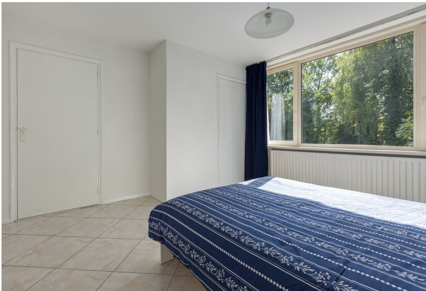
Tilburgseweg-Oost 3, Eindhoven