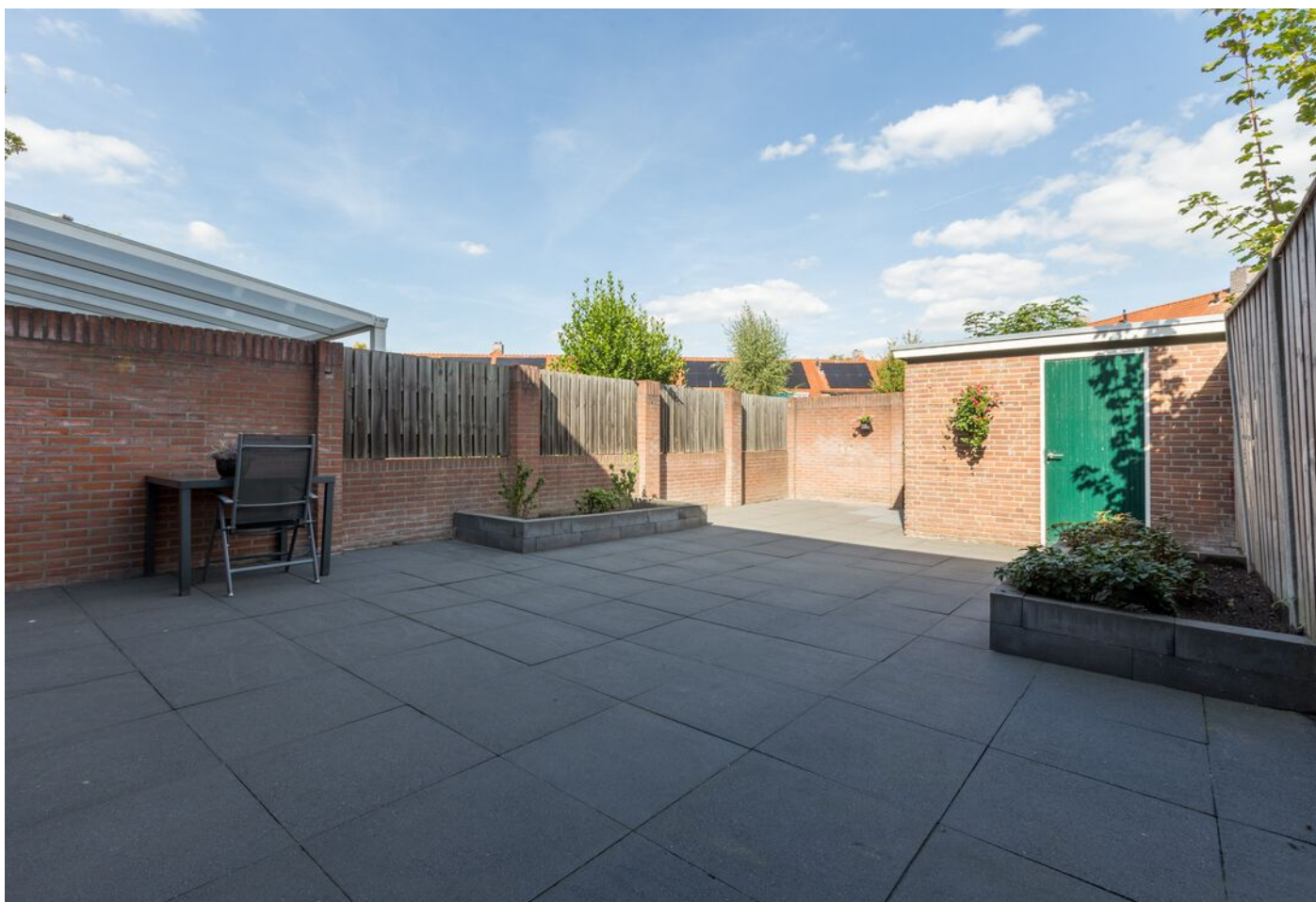
Tilburgseweg-Oost 3, Eindhoven