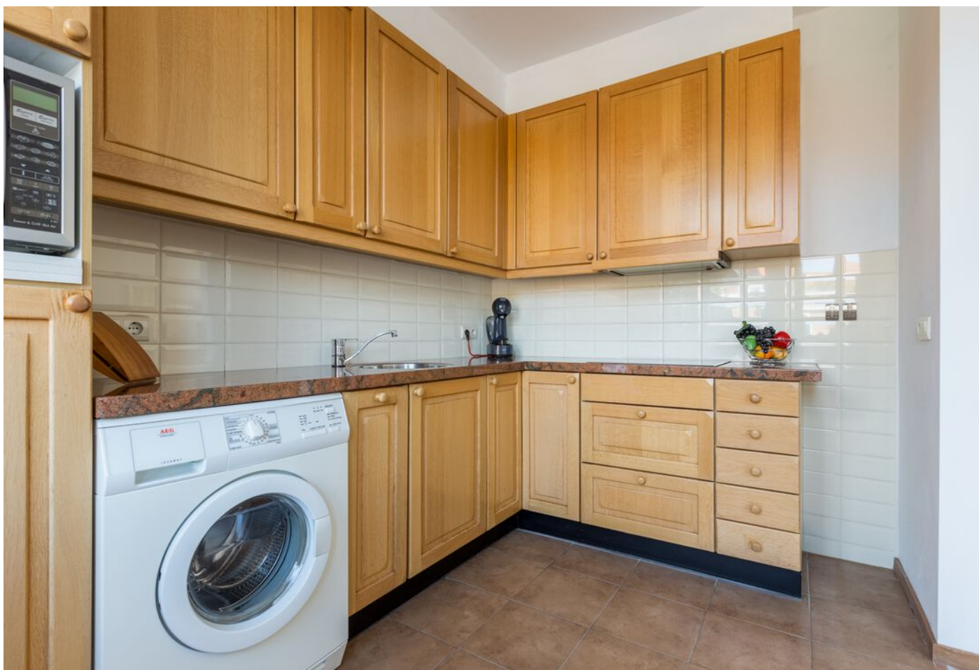
Tilburgseweg-Oost 3, Eindhoven