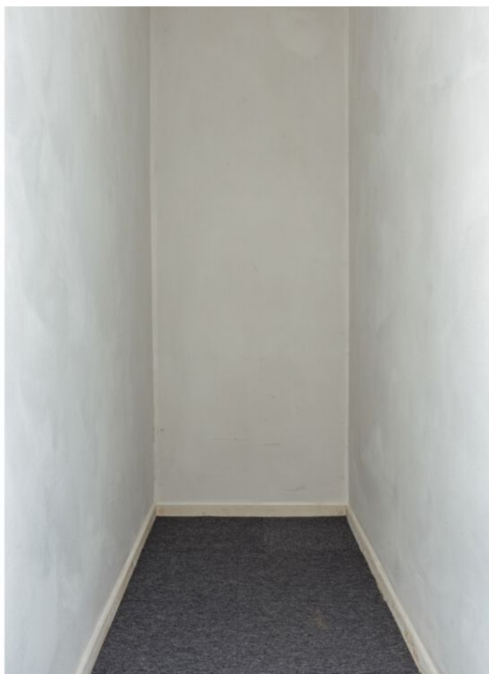
Tilburgseweg-Oost 3, Eindhoven