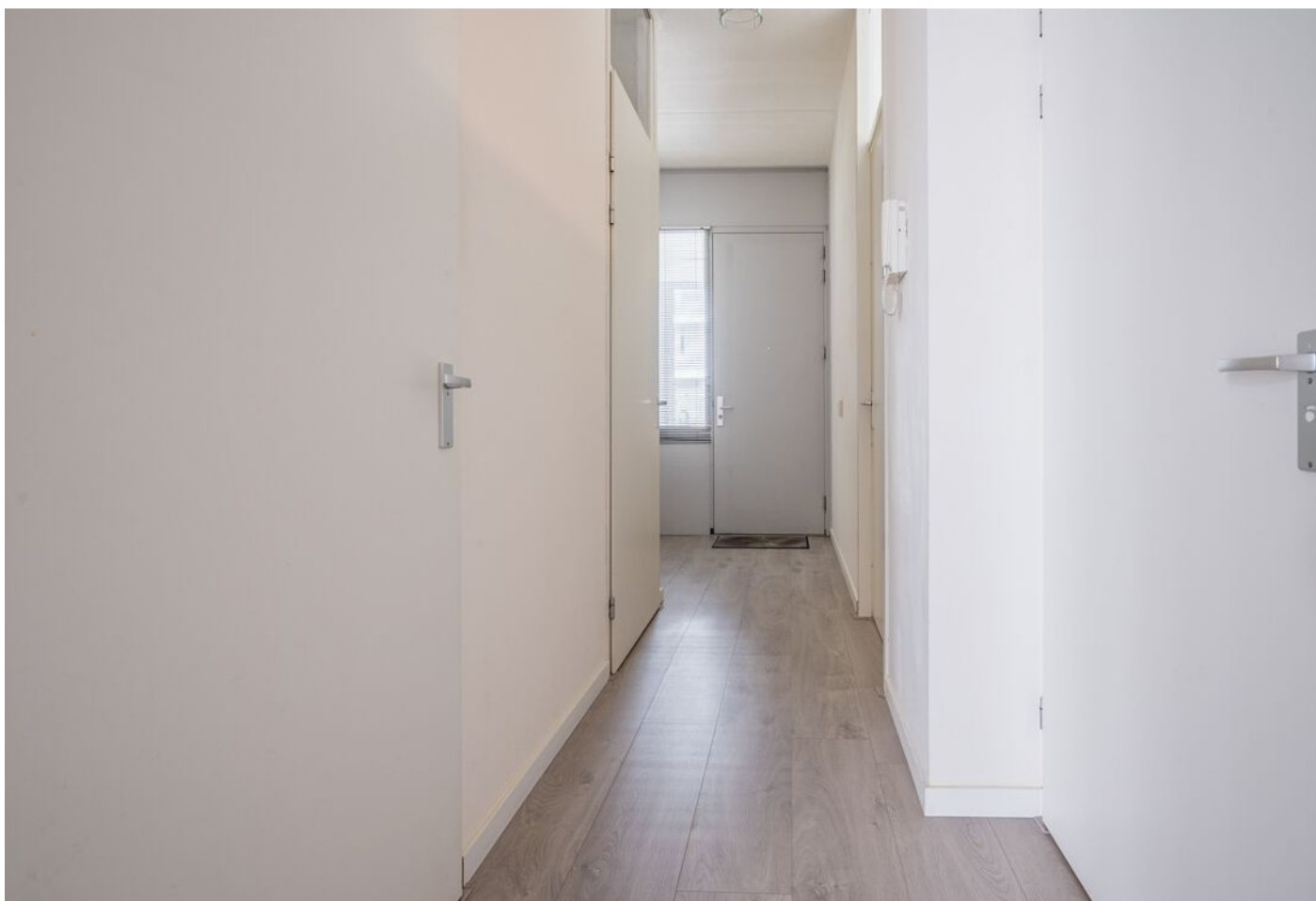
Statenlaan 289, 's-Hertogenbosch