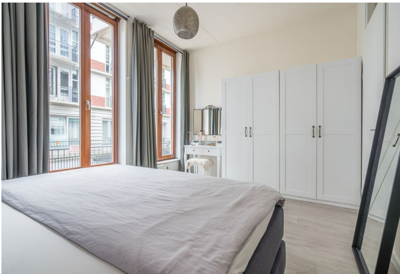
Statenlaan 289, 's-Hertogenbosch