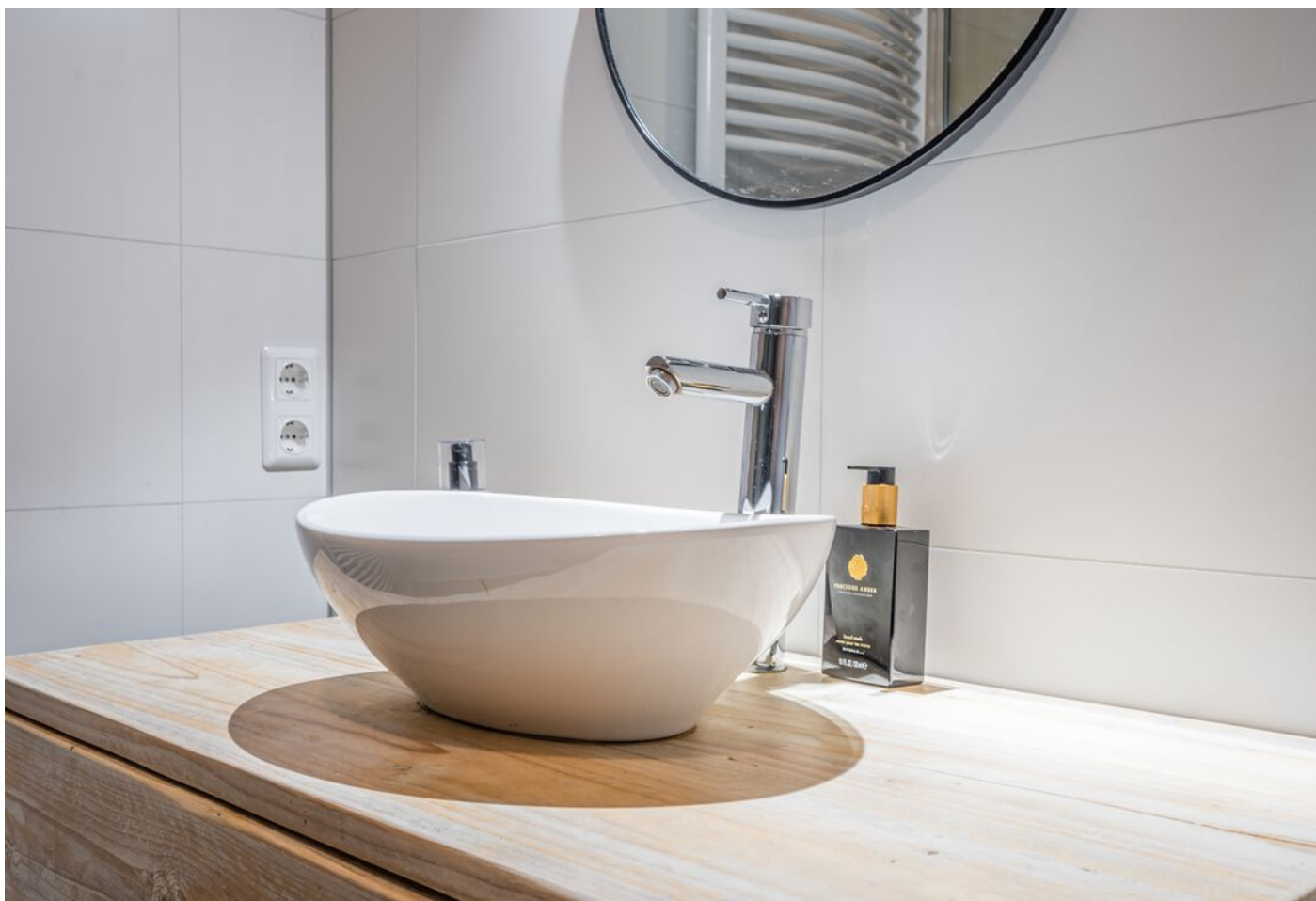
Statenlaan 289, 's-Hertogenbosch