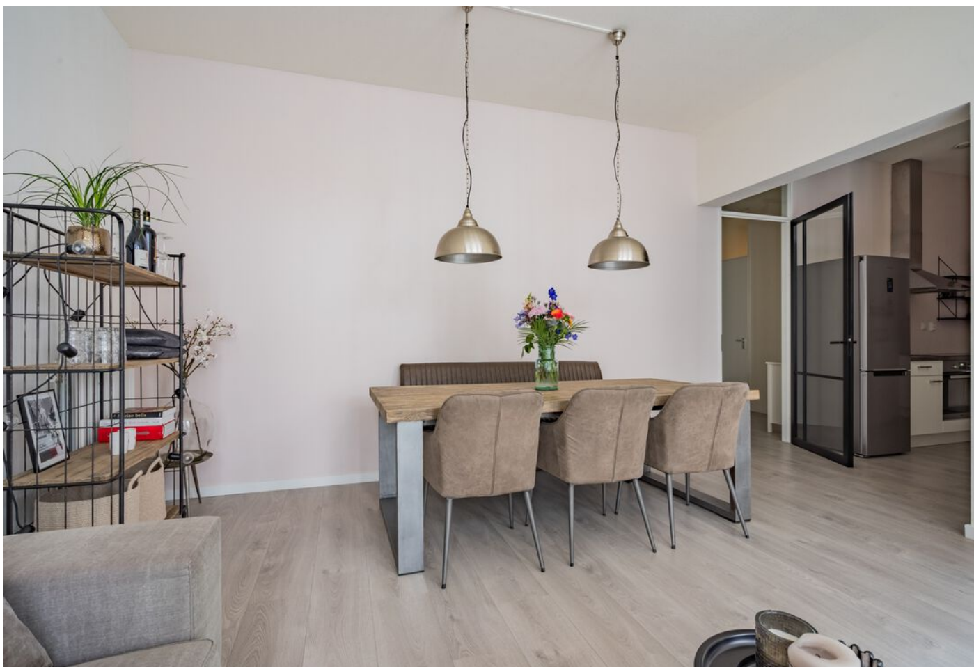
Statenlaan 289, 's-Hertogenbosch