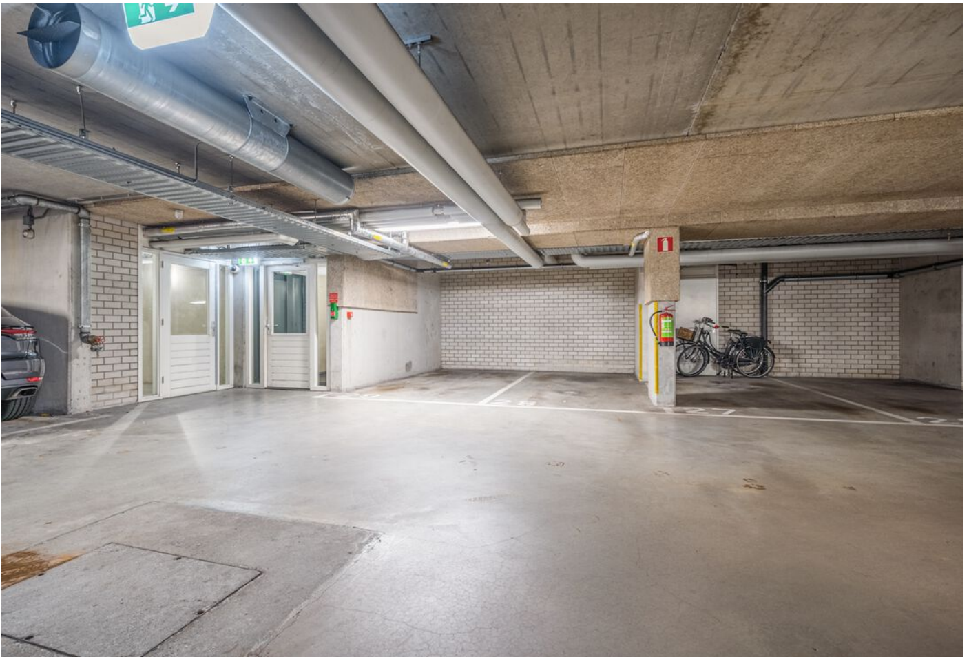
Statenlaan 289, 's-Hertogenbosch