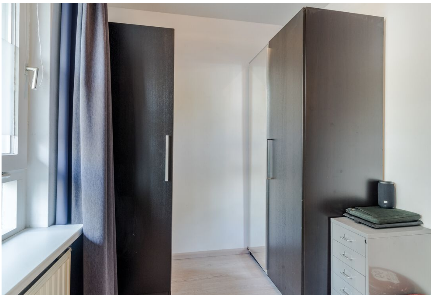
Statenkwartier 158, 's-Hertogenbosch