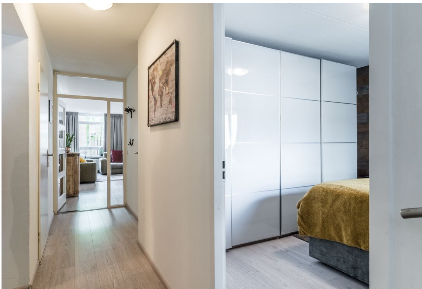
Statenkwartier 158, 's-Hertogenbosch