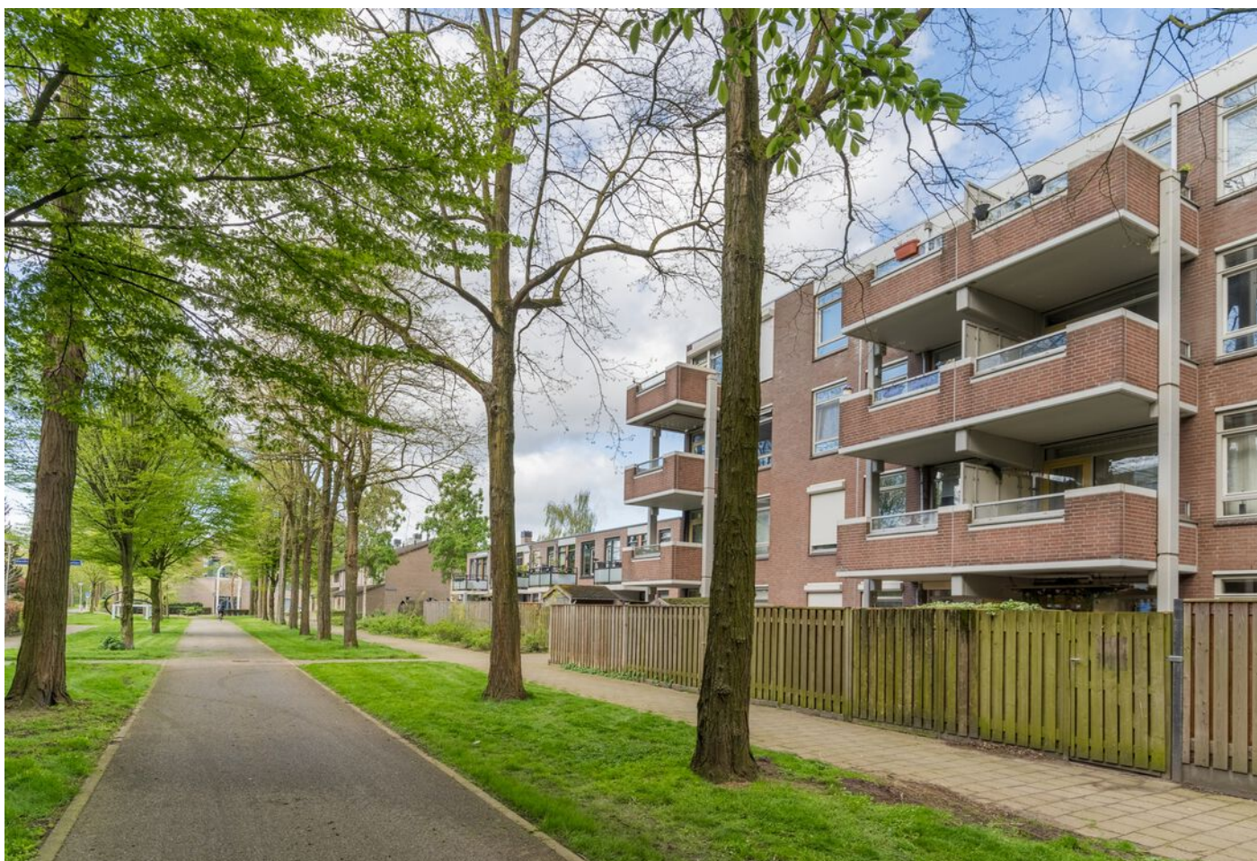
Statenkwartier 158, 's-Hertogenbosch