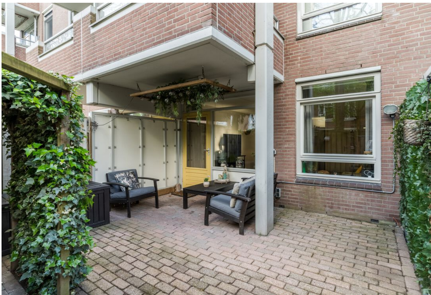
Statenkwartier 158, 's-Hertogenbosch