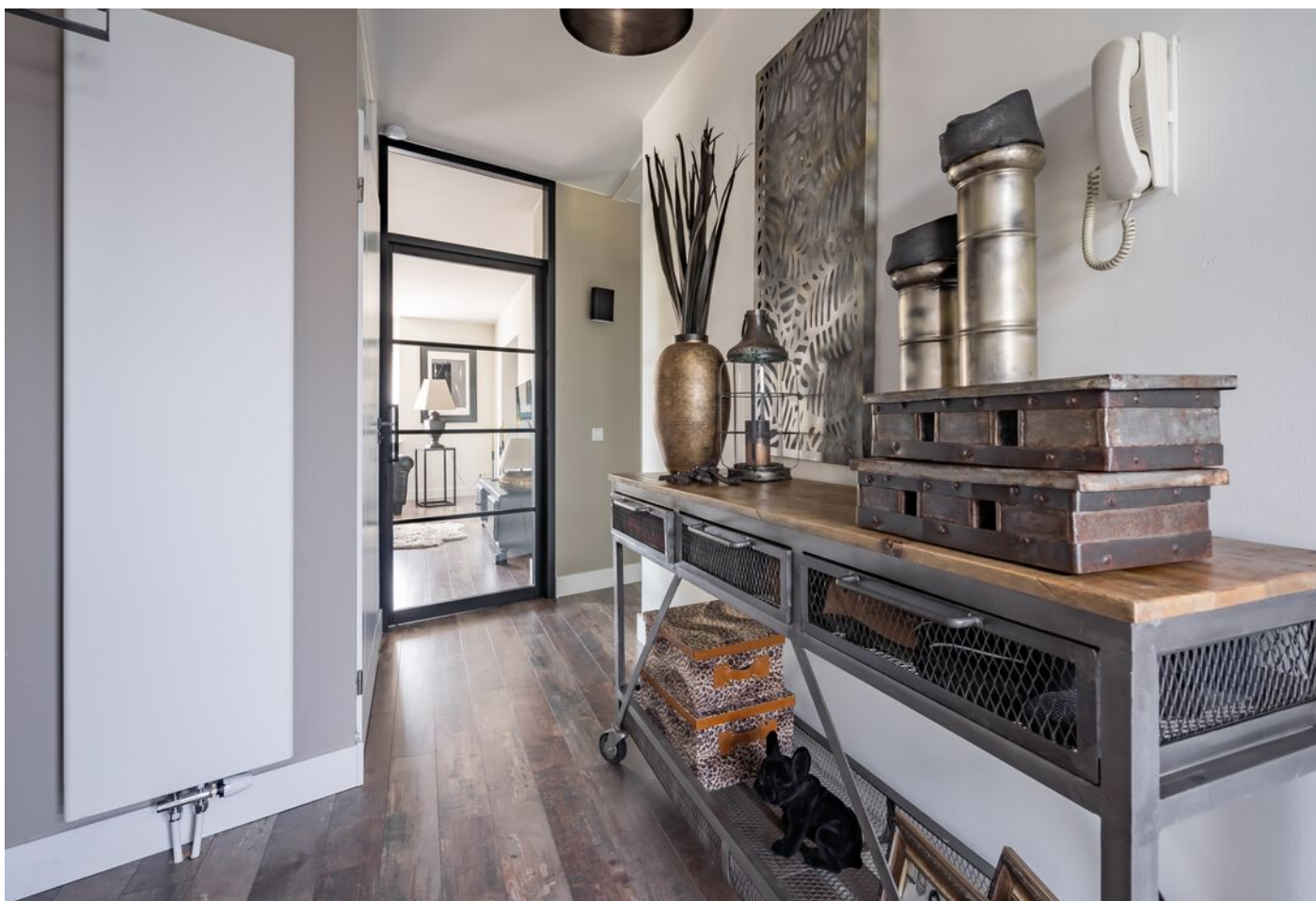
Sint Jorisstate 3, Rosmalen