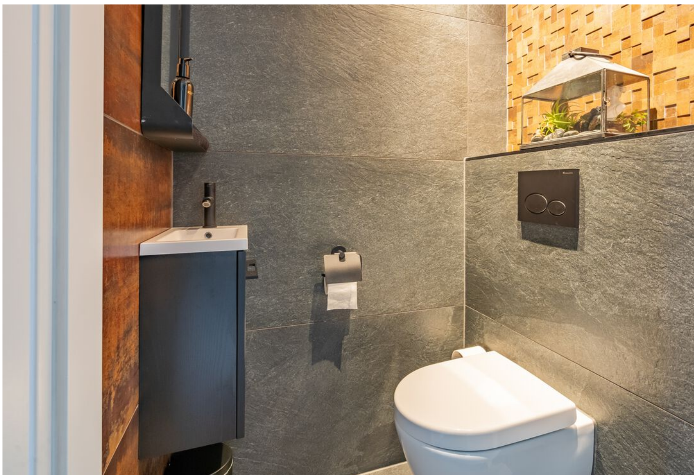
Sint Jorisstate 3, Rosmalen