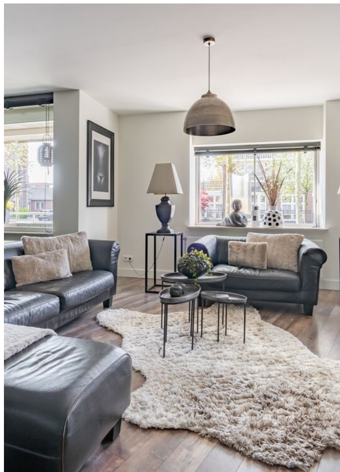
Sint Jorisstate 3, Rosmalen