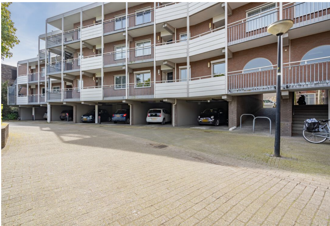
Sint Jorisstate 3, Rosmalen