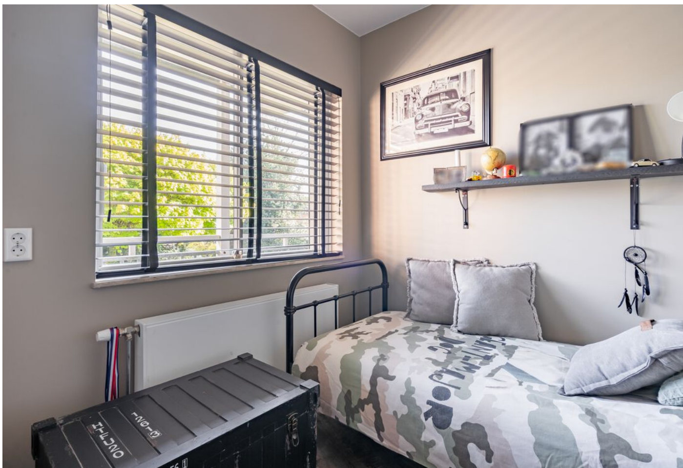
Sint Jorisstate 3, Rosmalen