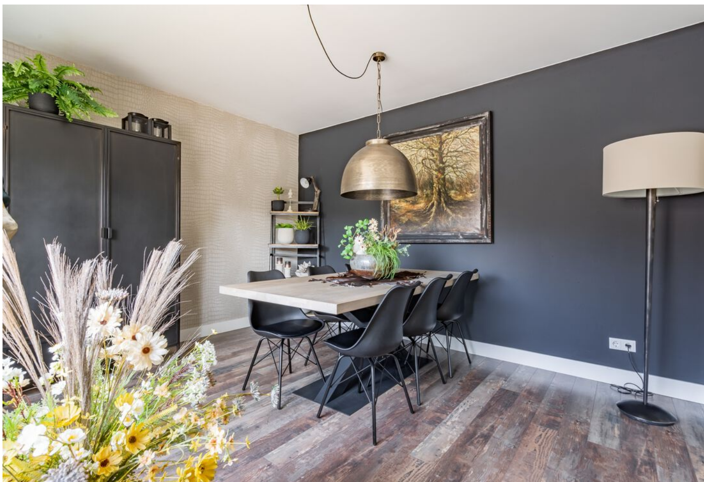
Sint Jorisstate 3, Rosmalen