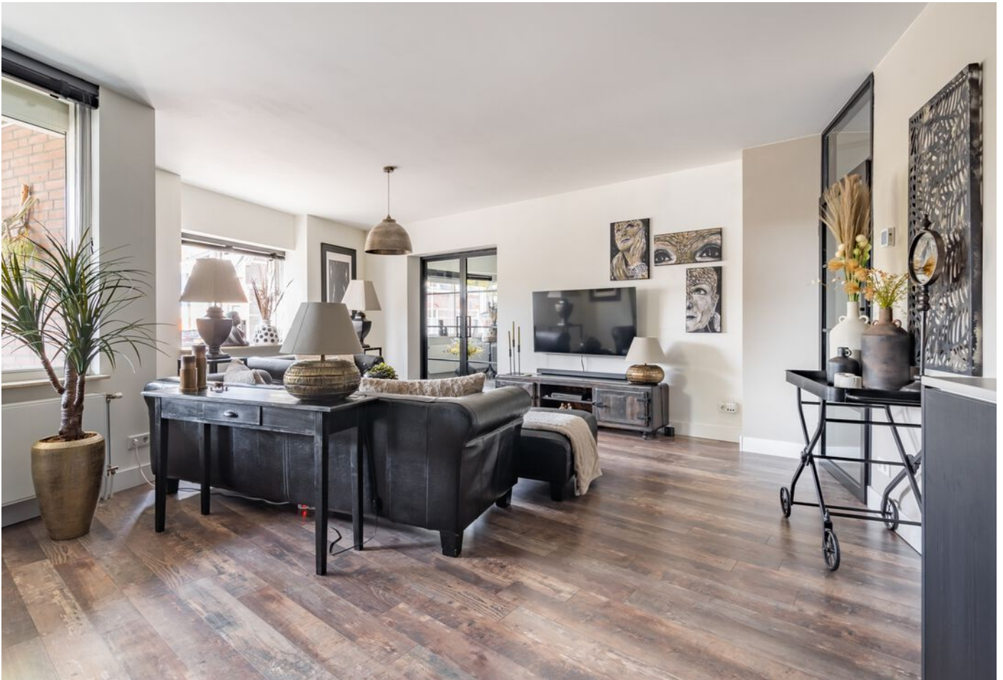
Sint Jorisstate 3, Rosmalen