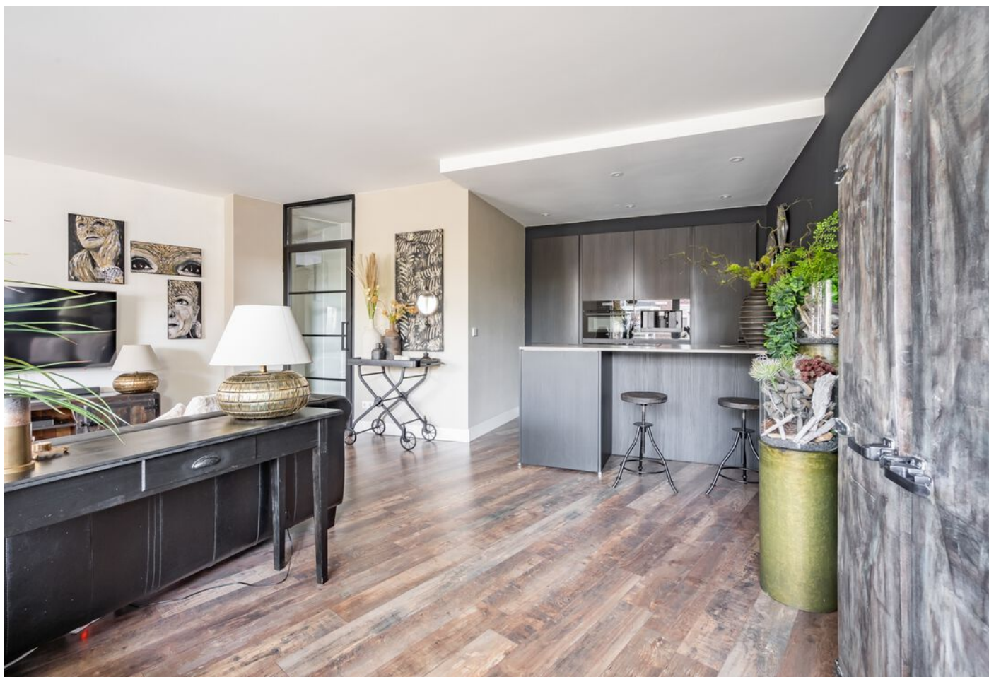
Sint Jorisstate 3, Rosmalen