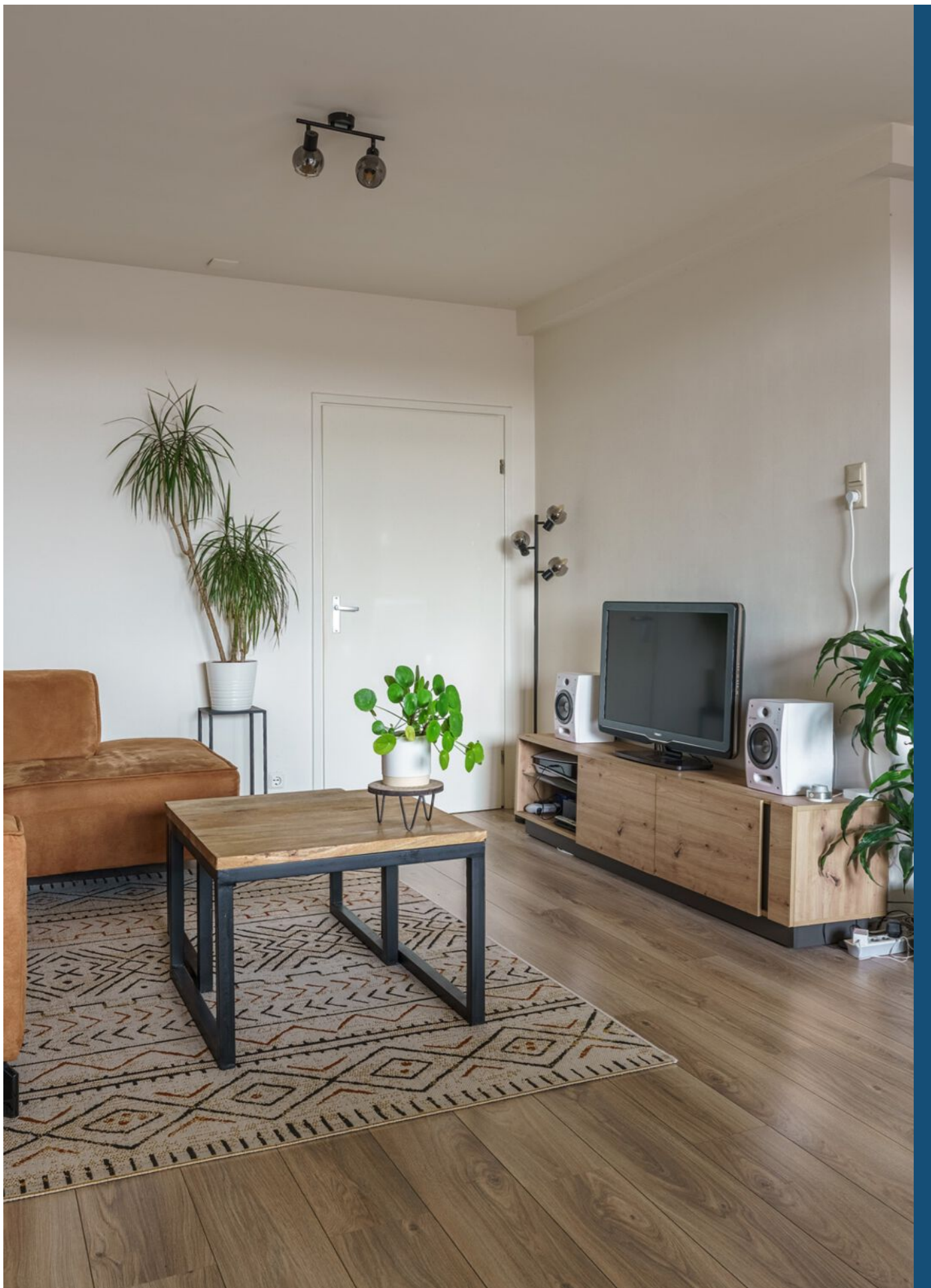
Simon van Leeuwenstraat 18, Eindhoven