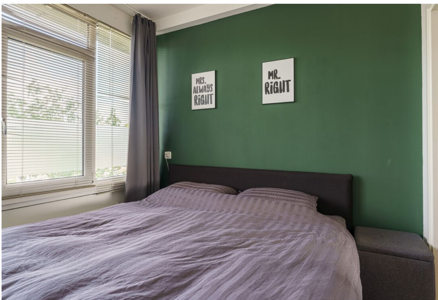
Simon van Leeuwenstraat 18, Eindhoven