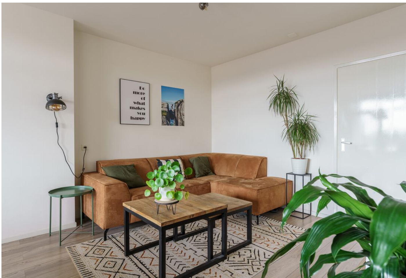
Simon van Leeuwenstraat 18, Eindhoven