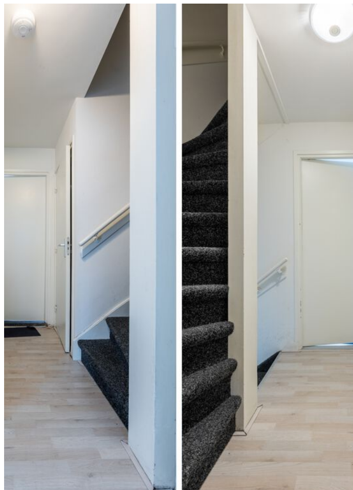
Schubertlaan 100, Eindhoven