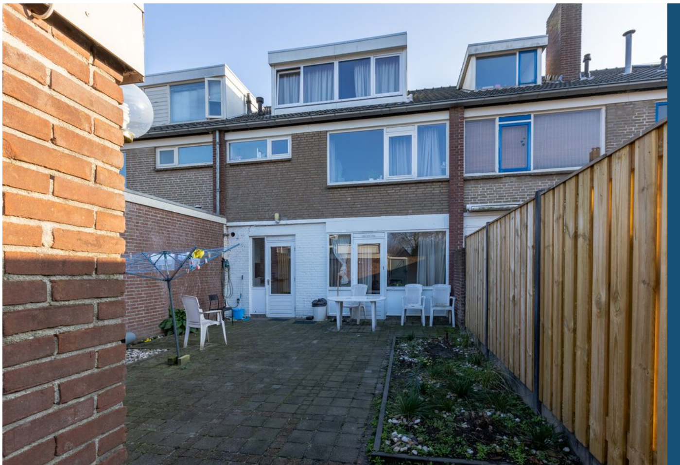
Schubertlaan 100, Eindhoven