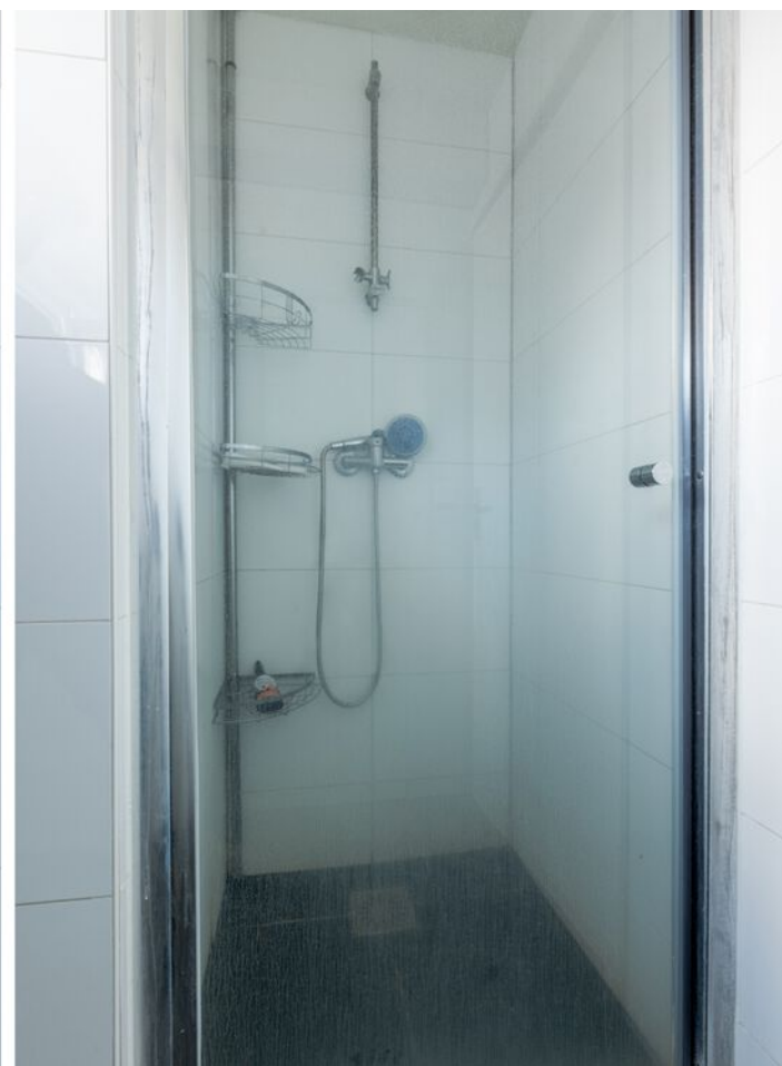
Schubertlaan 100, Eindhoven