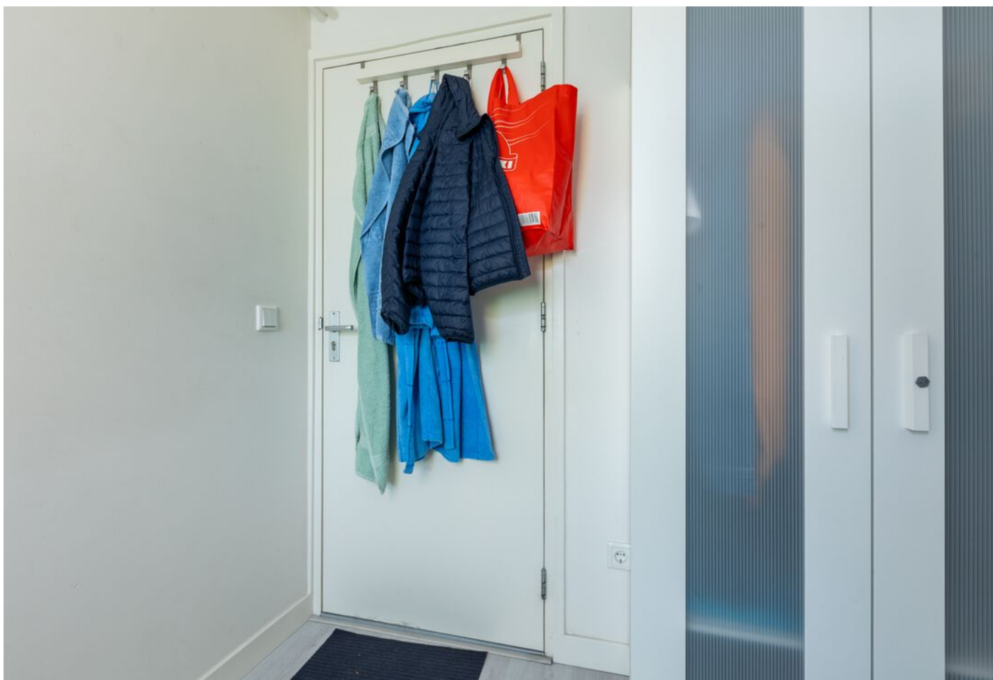
Schubertlaan 100, Eindhoven