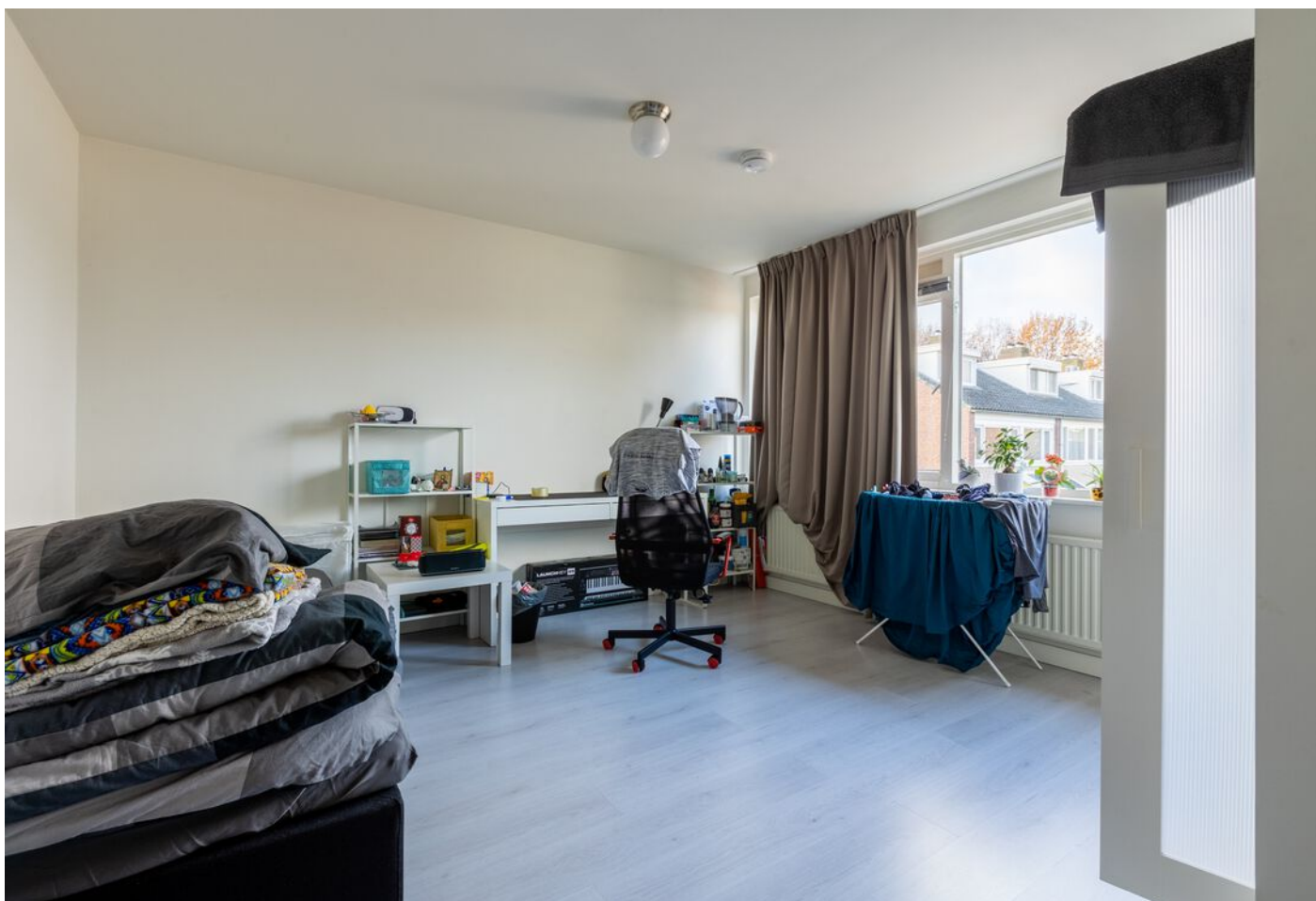
Schubertlaan 100, Eindhoven