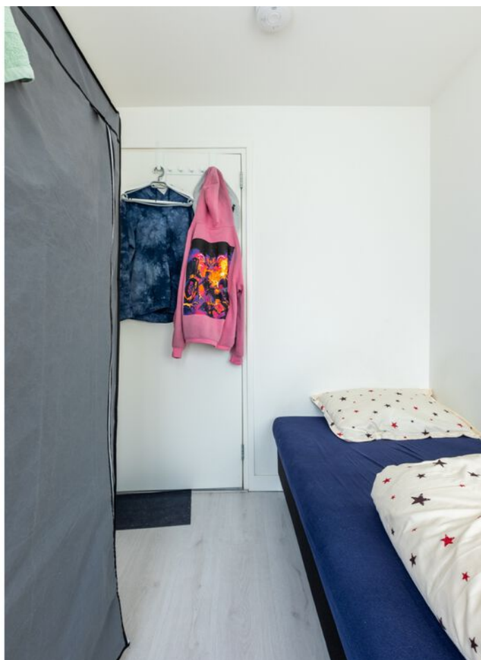
Schubertlaan 100, Eindhoven