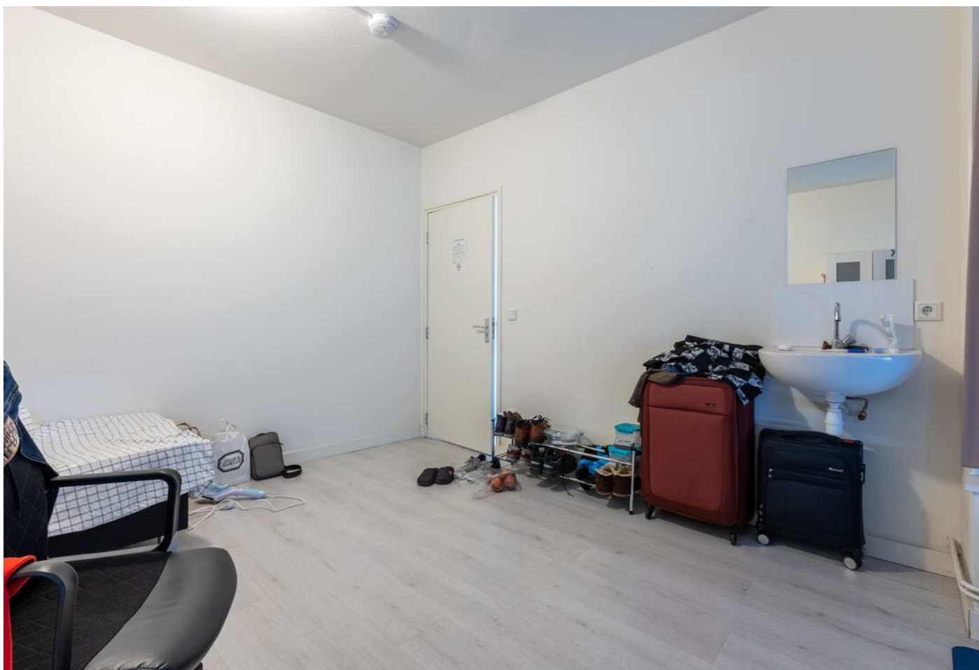
Schubertlaan 100, Eindhoven