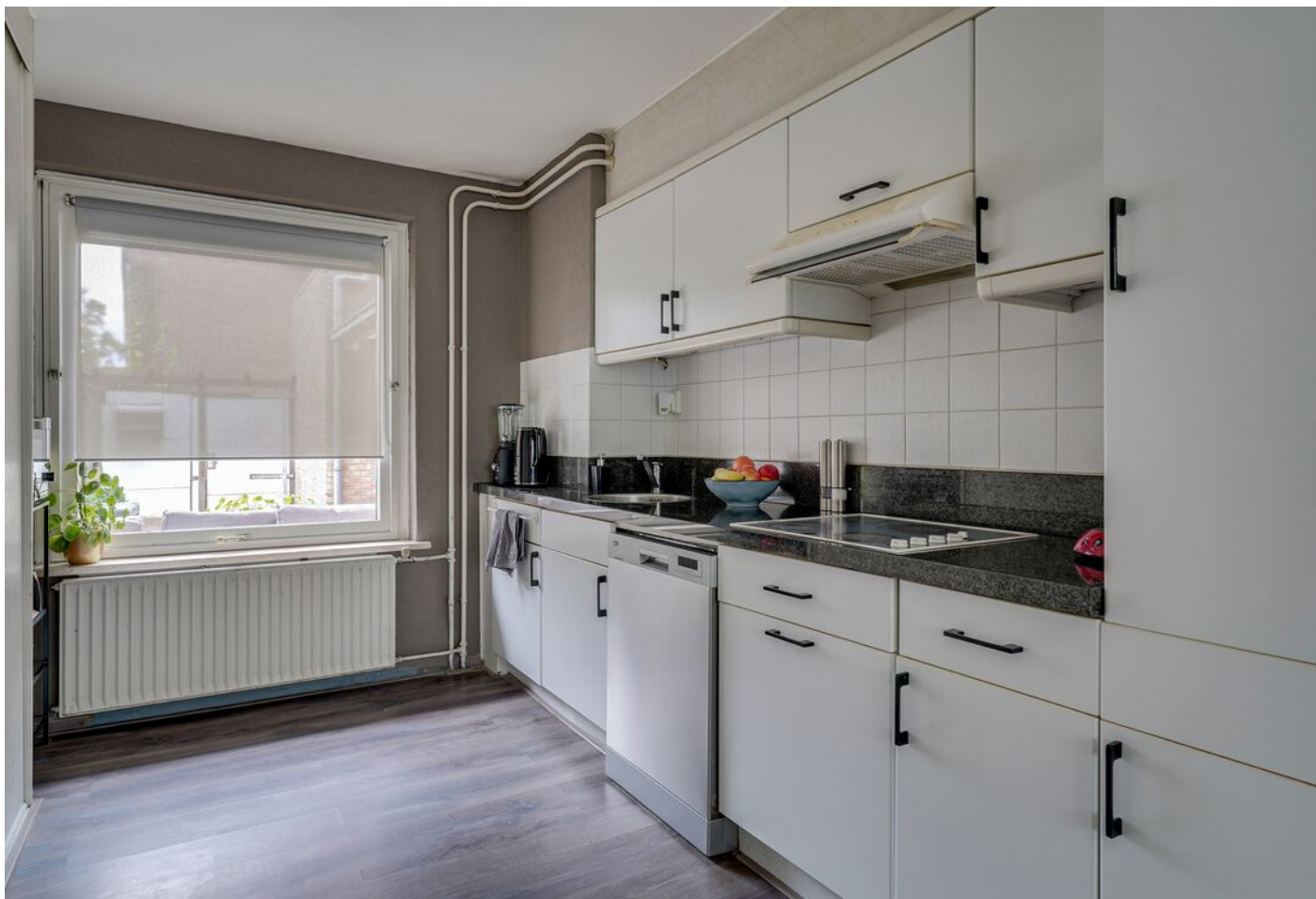
Rutger Van Keulenpad 12, Eindhoven