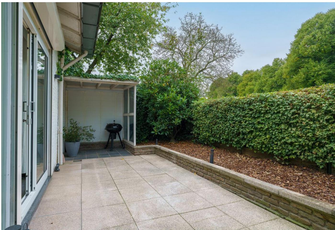
Rutger Van Keulenpad 12, Eindhoven