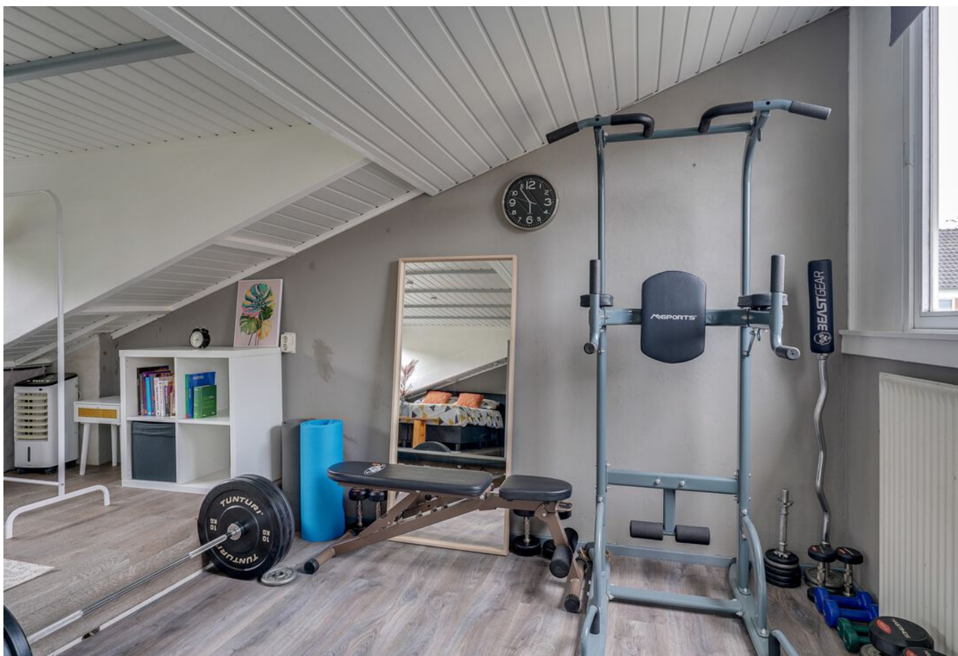
Rutger Van Keulenpad 12, Eindhoven