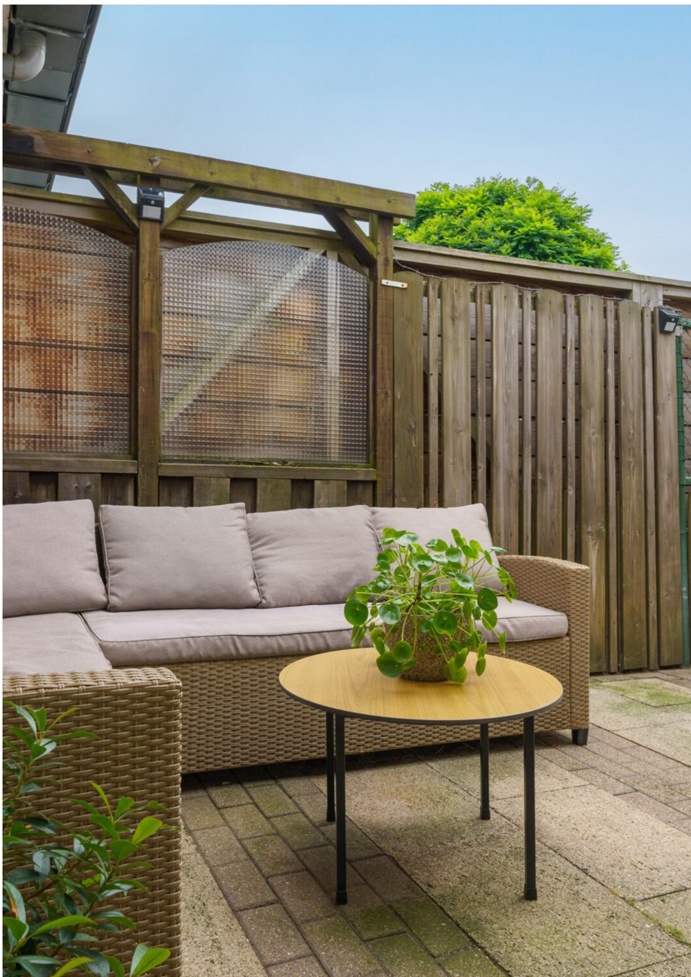
Rutger Van Keulenpad 12, Eindhoven