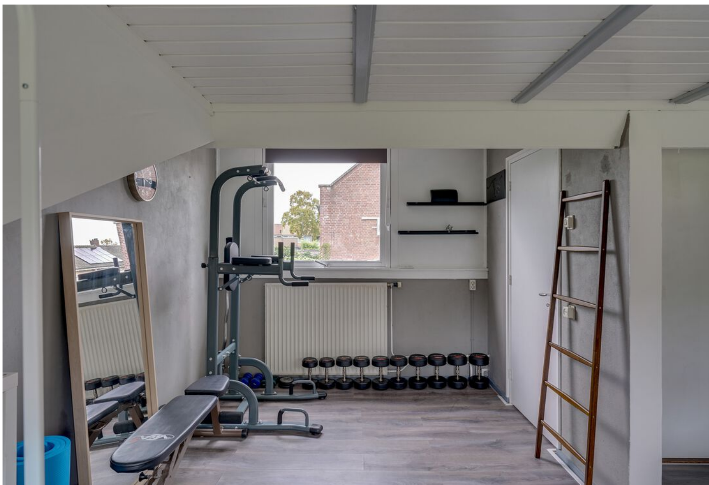
Rutger Van Keulenpad 12, Eindhoven