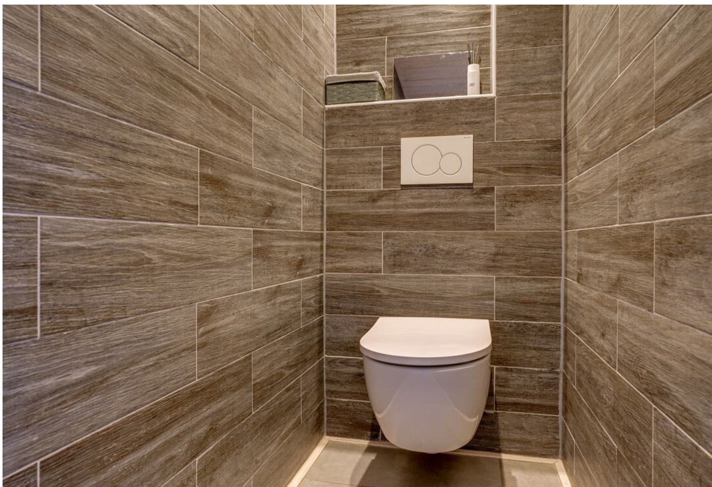
Rutger Van Keulenpad 12, Eindhoven