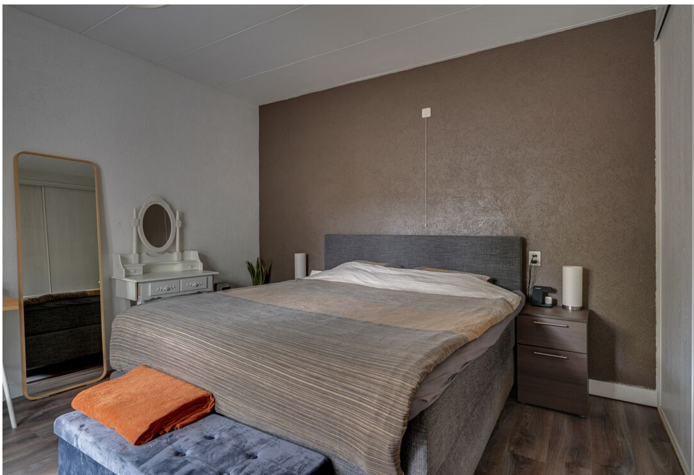
Rutger Van Keulenpad 12, Eindhoven