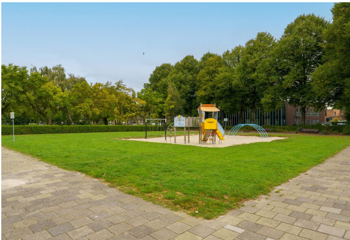
Rutger Van Keulenpad 12, Eindhoven