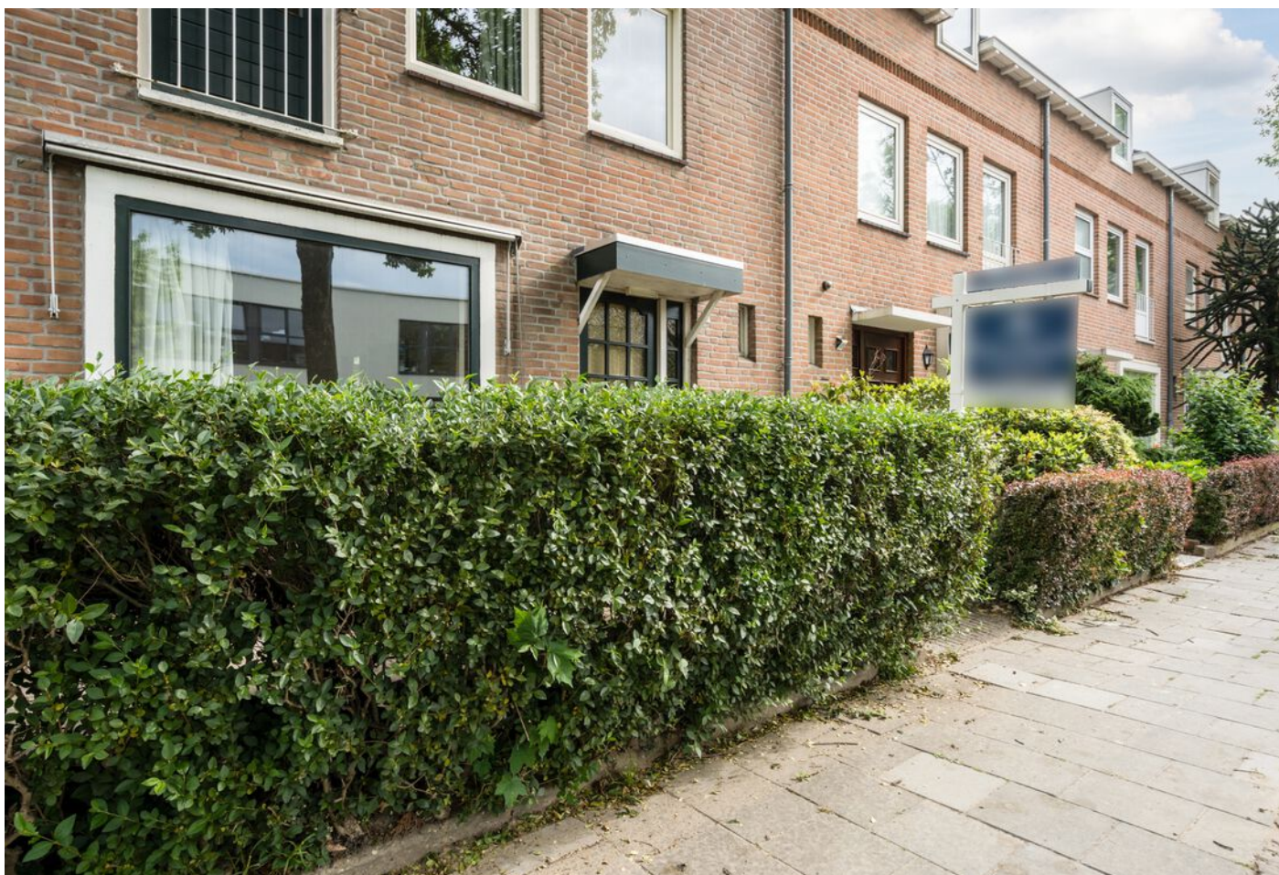
Robbenstraat 10, Eindhoven