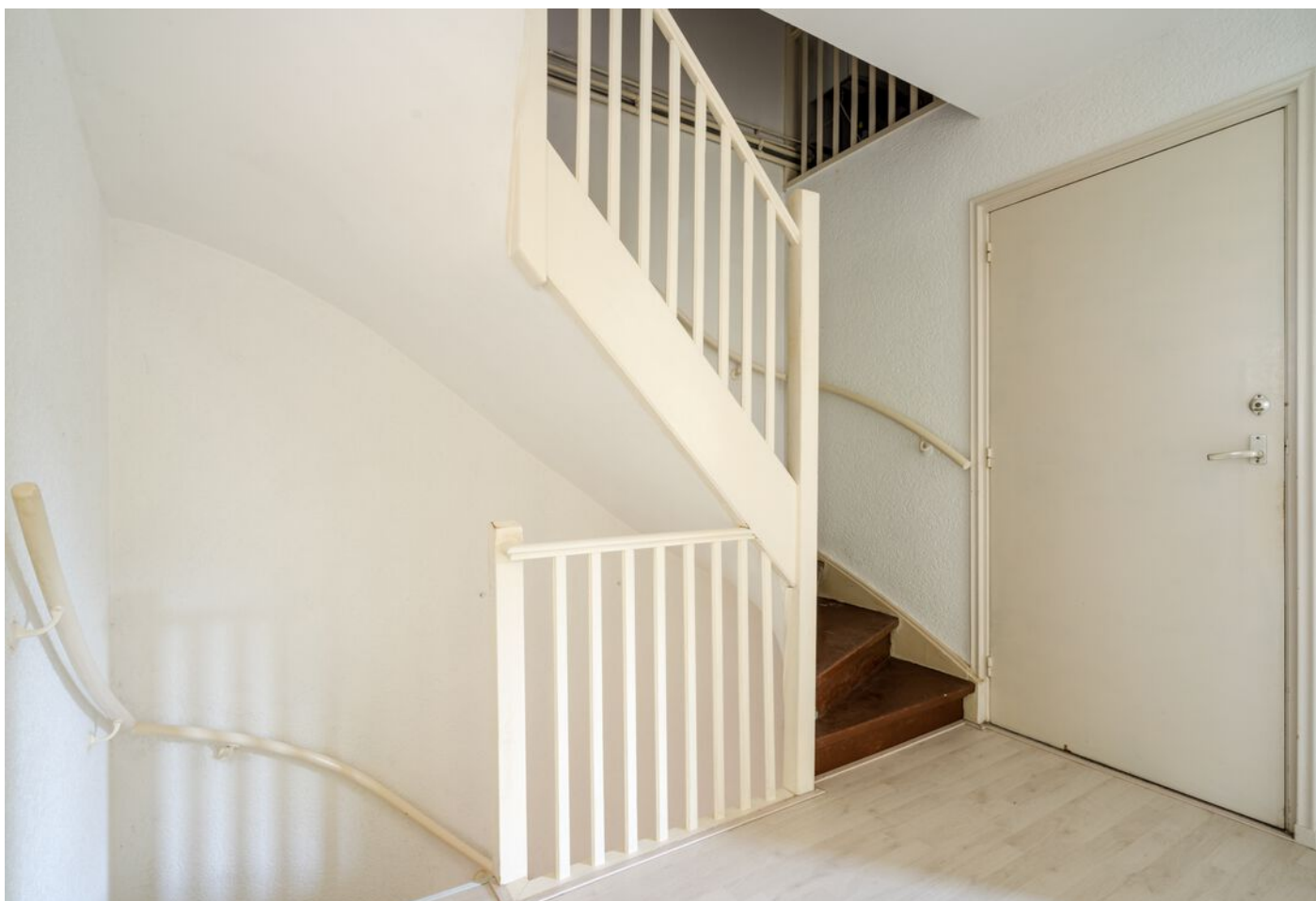
Robbenstraat 10, Eindhoven