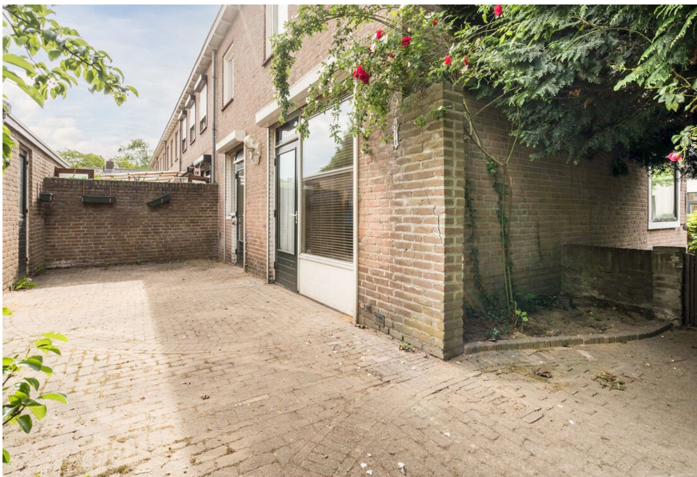
Robbenstraat 10, Eindhoven