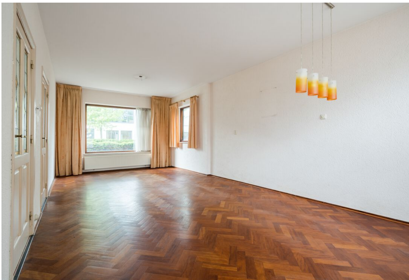
Robbenstraat 10, Eindhoven