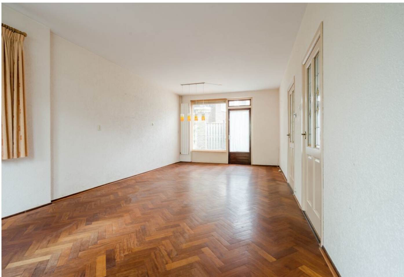
Robbenstraat 10, Eindhoven