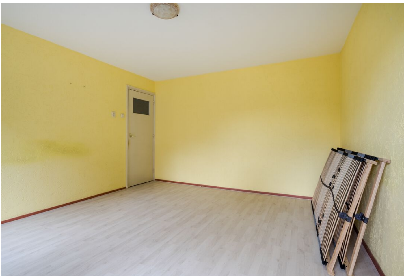
Robbenstraat 10, Eindhoven