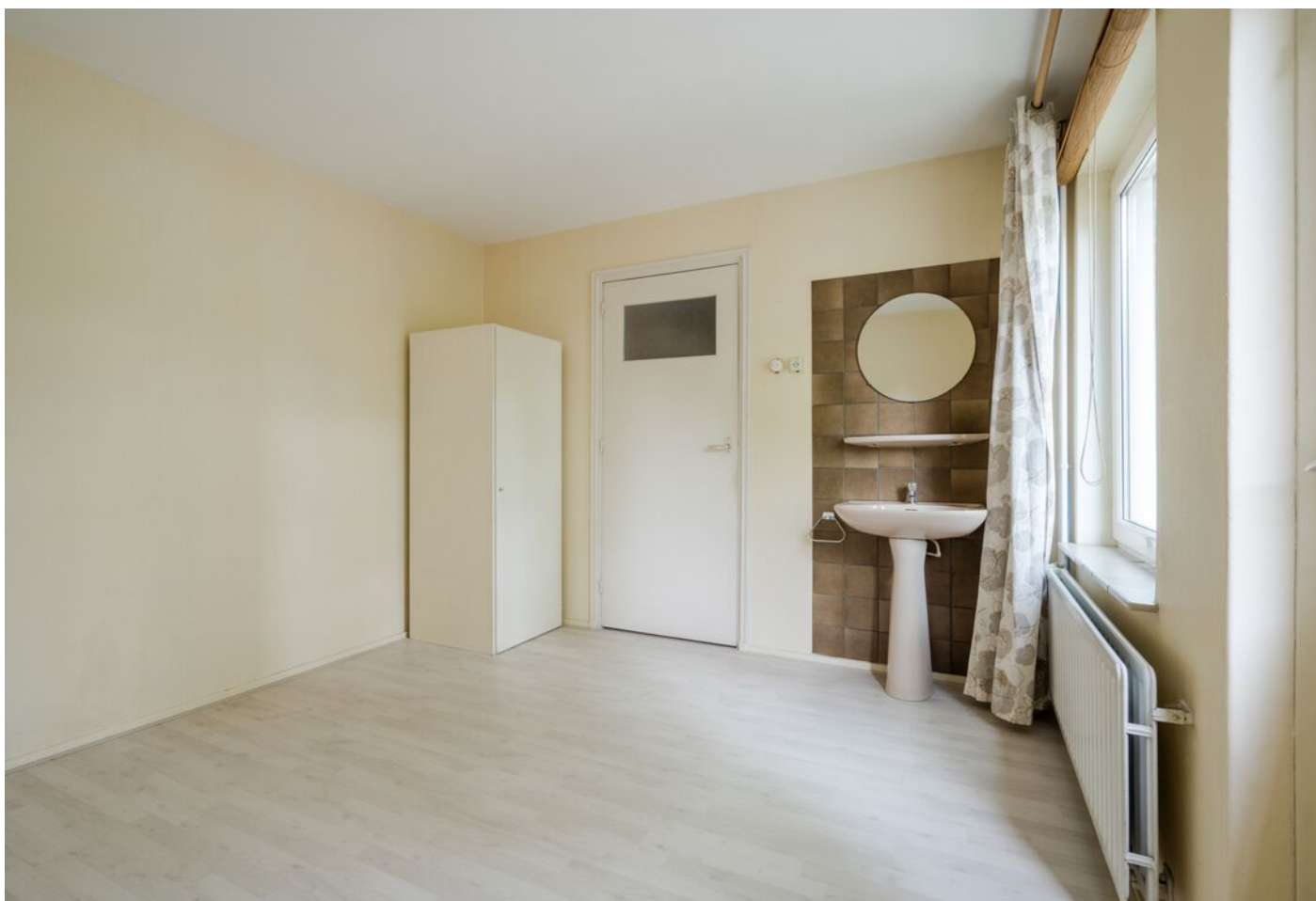
Robbenstraat 10, Eindhoven