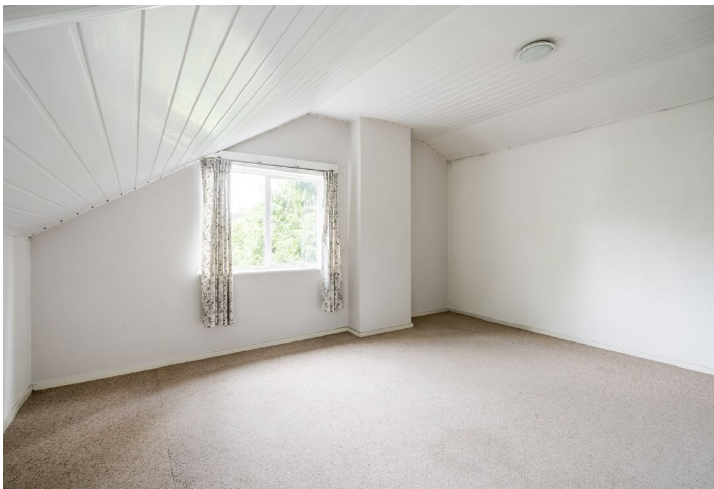
Robbenstraat 10, Eindhoven