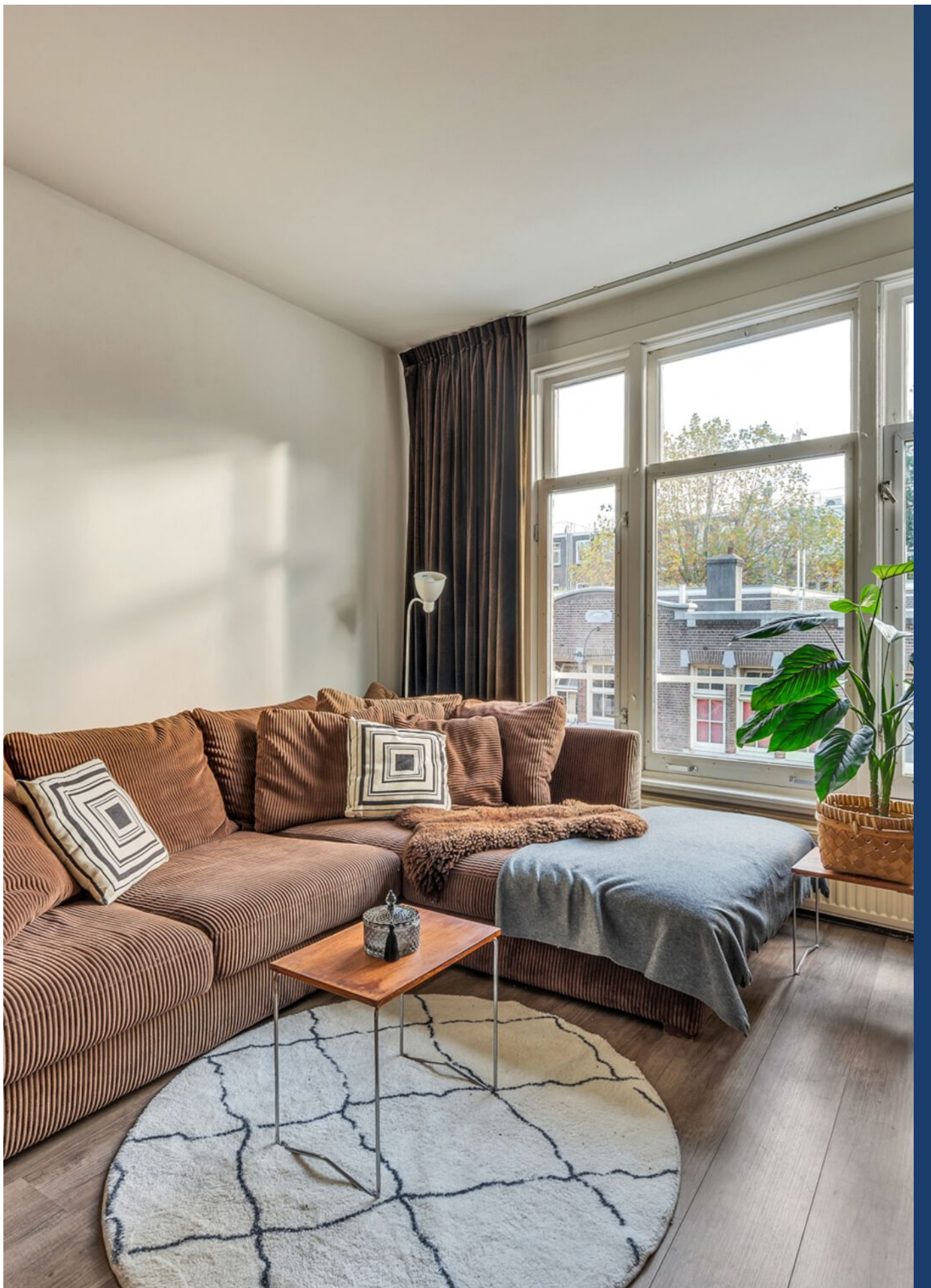
Pieter Aertszstraat 123 2, Amsterdam