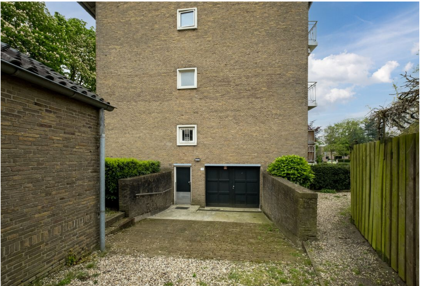
Palestrinastraat 101, 's-Hertogenbosch