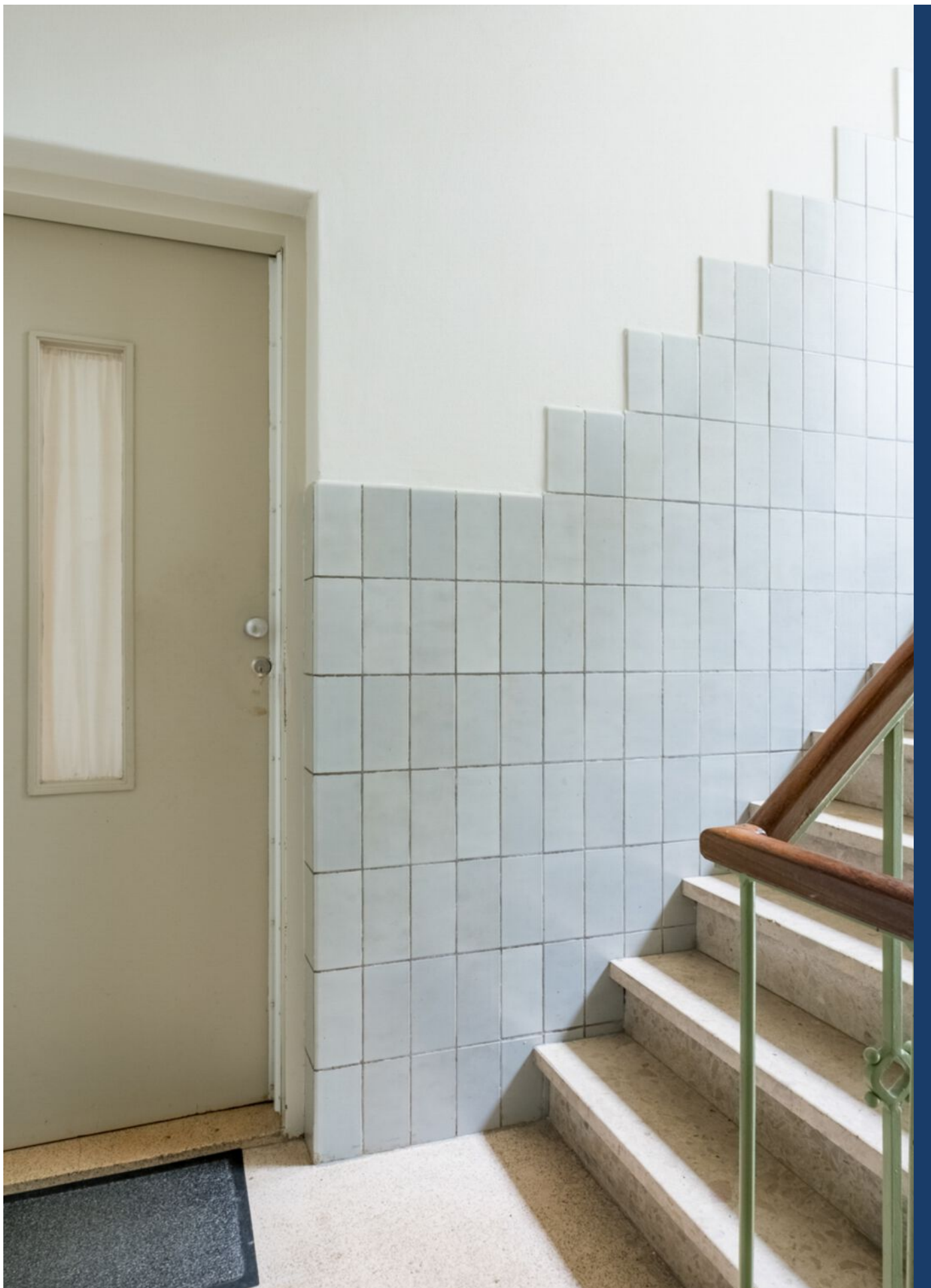
Palestrinastraat 101, 's-Hertogenbosch