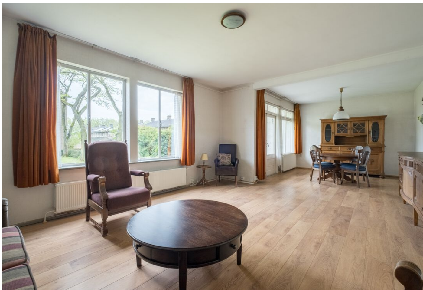
Palestrinastraat 101, 's-Hertogenbosch