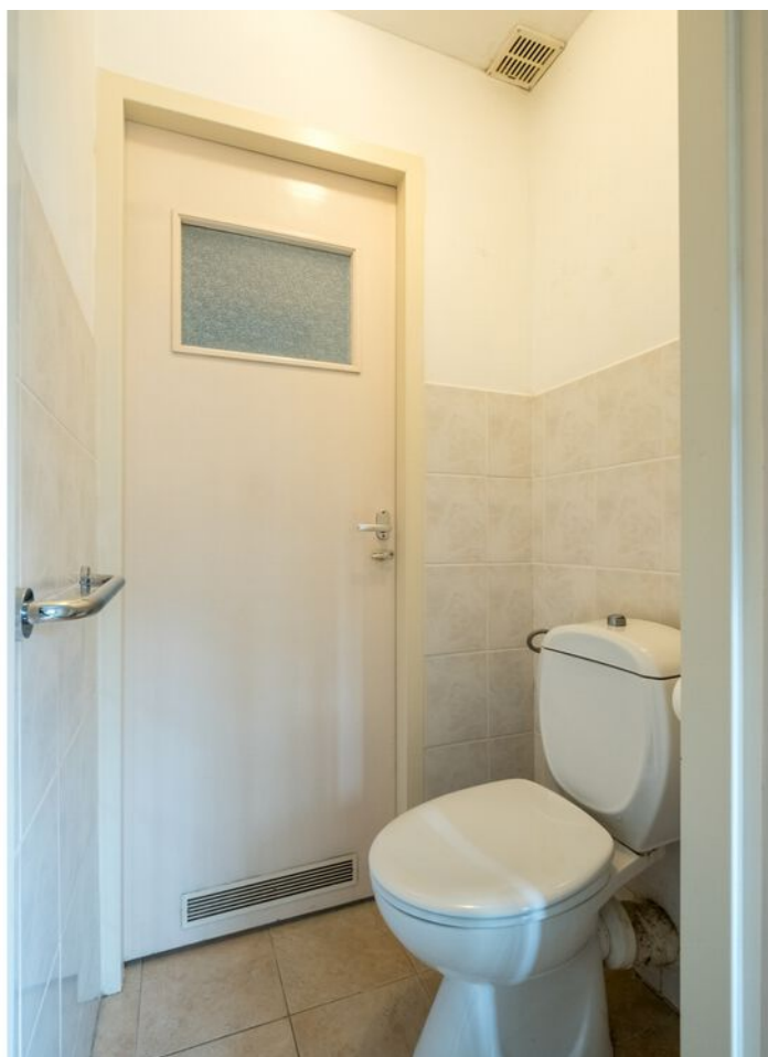
Palestrinastraat 101, 's-Hertogenbosch