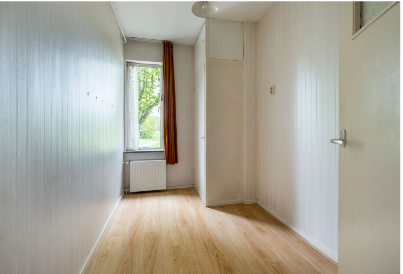
Palestrinastraat 101, 's-Hertogenbosch