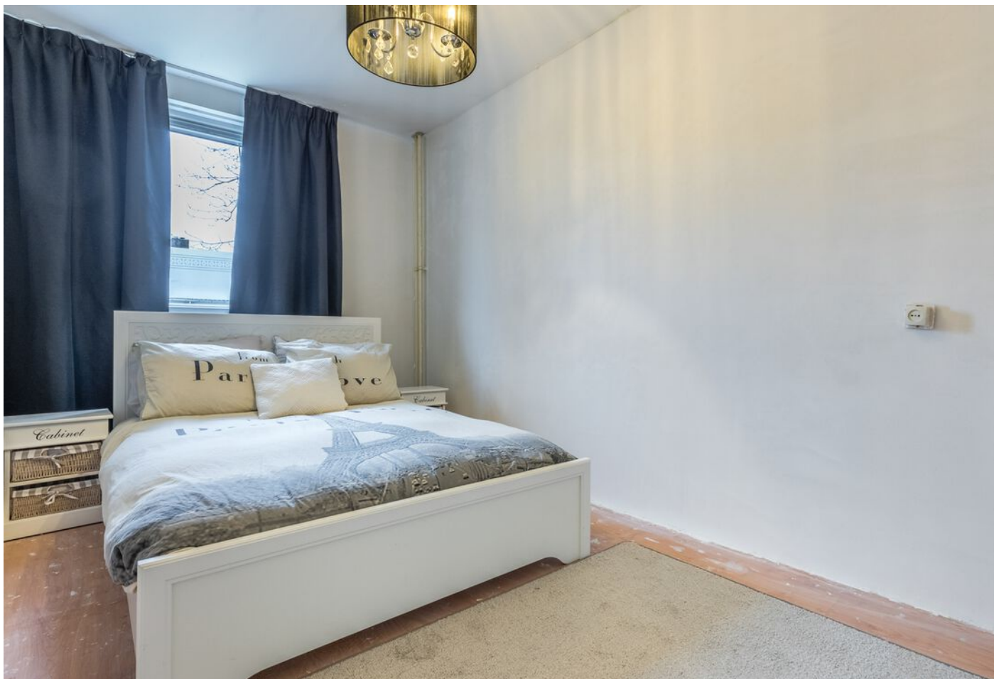
Maassingel 212, 's-Hertogenbosch