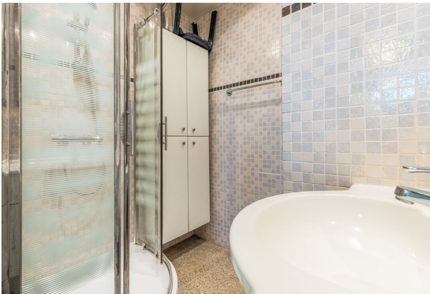
Maassingel 212, 's-Hertogenbosch