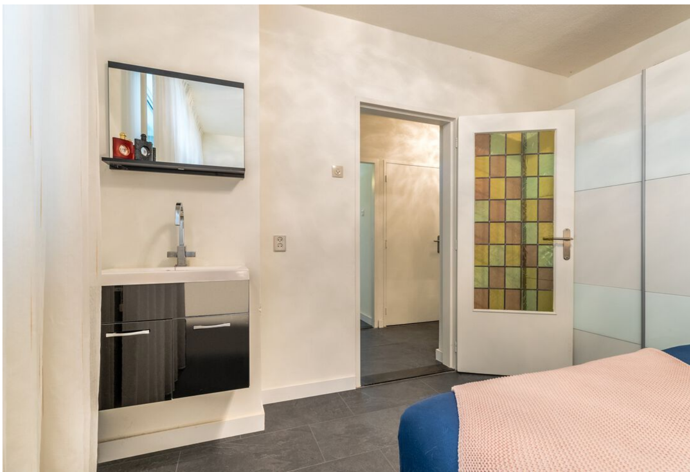
Maassingel 212, 's-Hertogenbosch