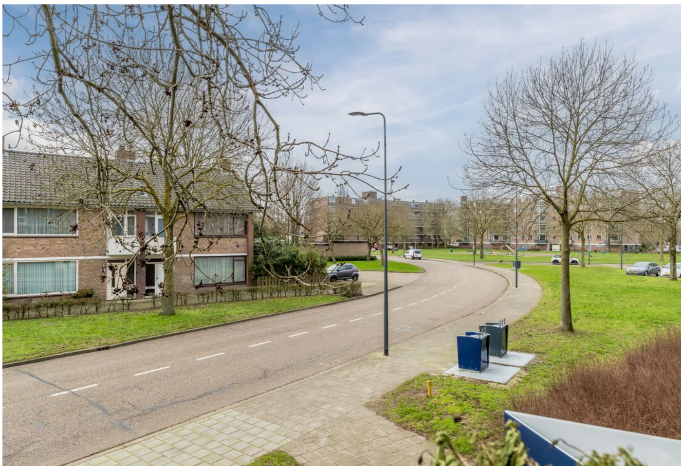
Maassingel 212, 's-Hertogenbosch