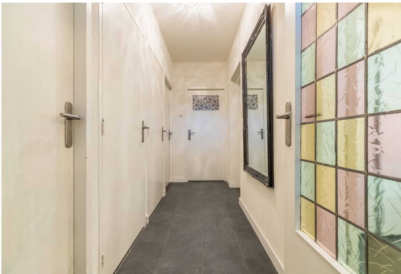
Maassingel 212, 's-Hertogenbosch