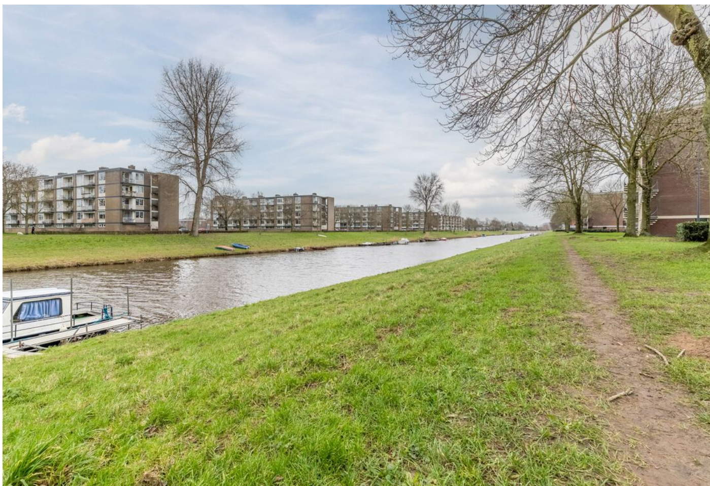
Maassingel 212, 's-Hertogenbosch