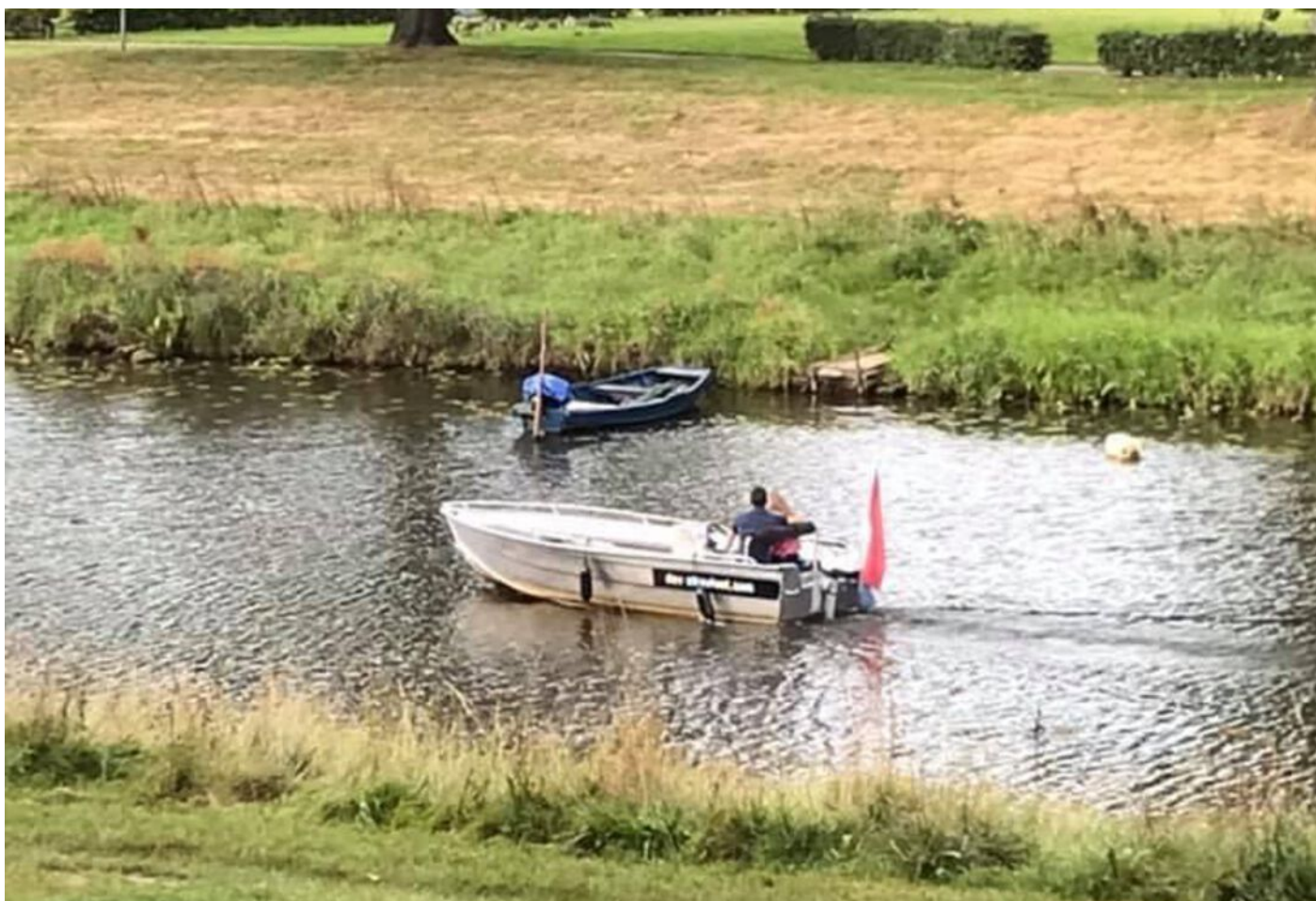
Maassingel 212, 's-Hertogenbosch