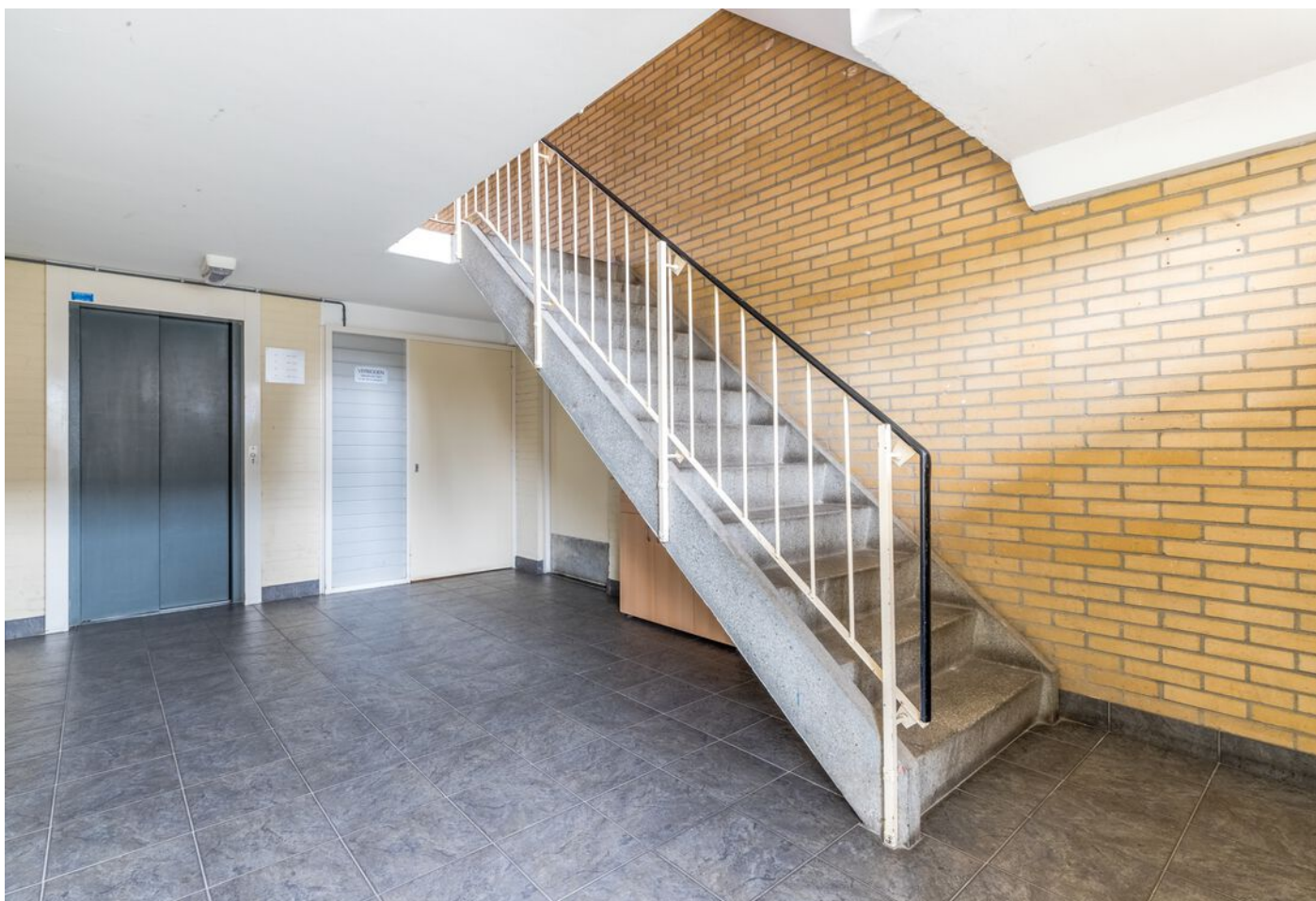
Maassingel 212, 's-Hertogenbosch