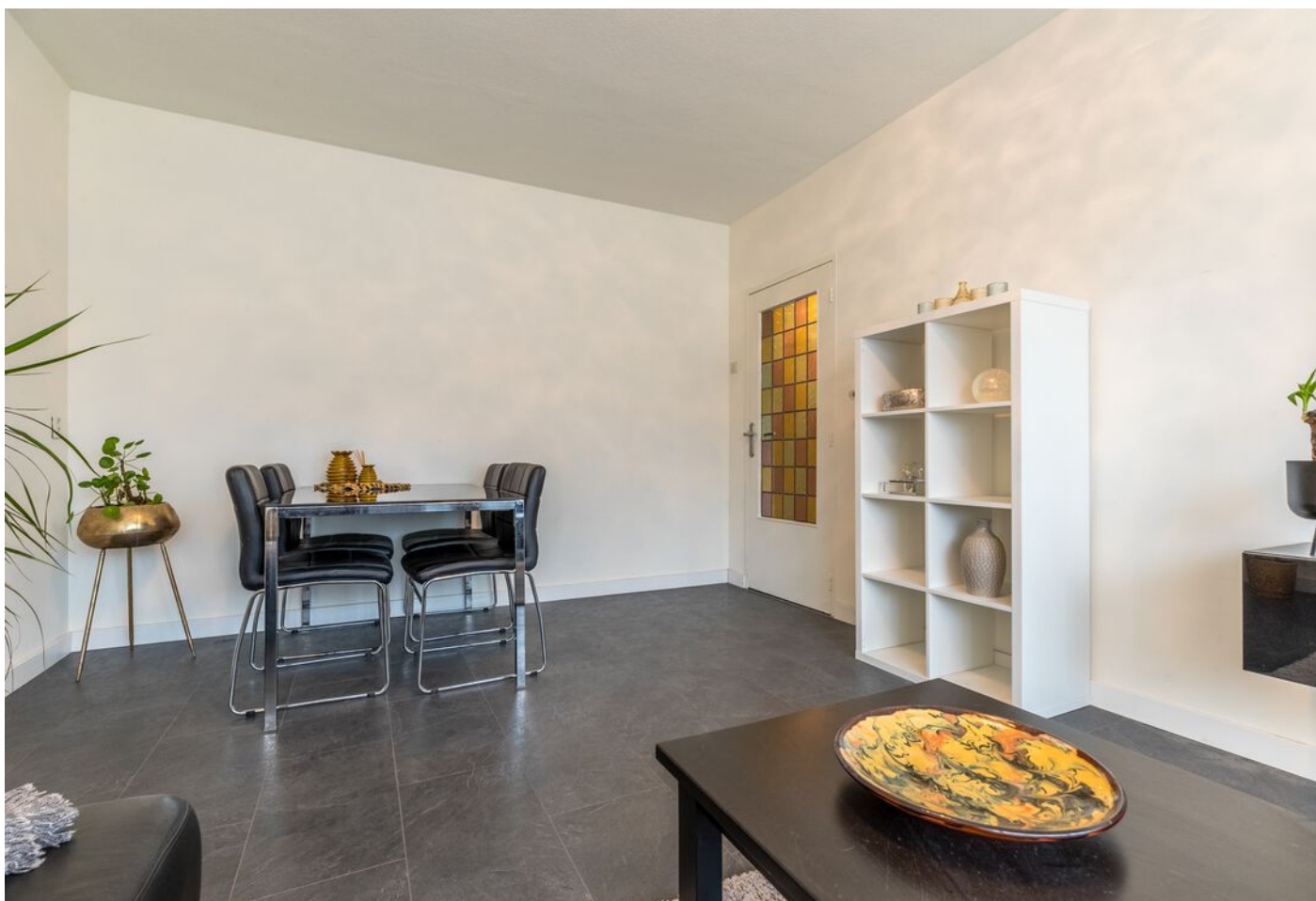
Maassingel 212, 's-Hertogenbosch