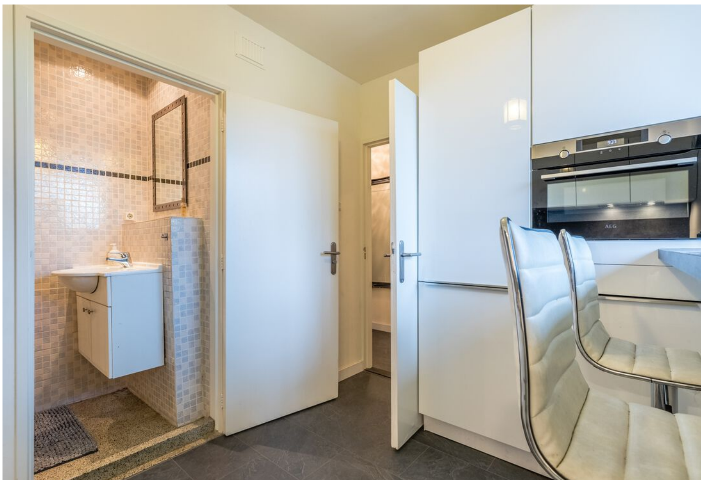
Maassingel 212, 's-Hertogenbosch