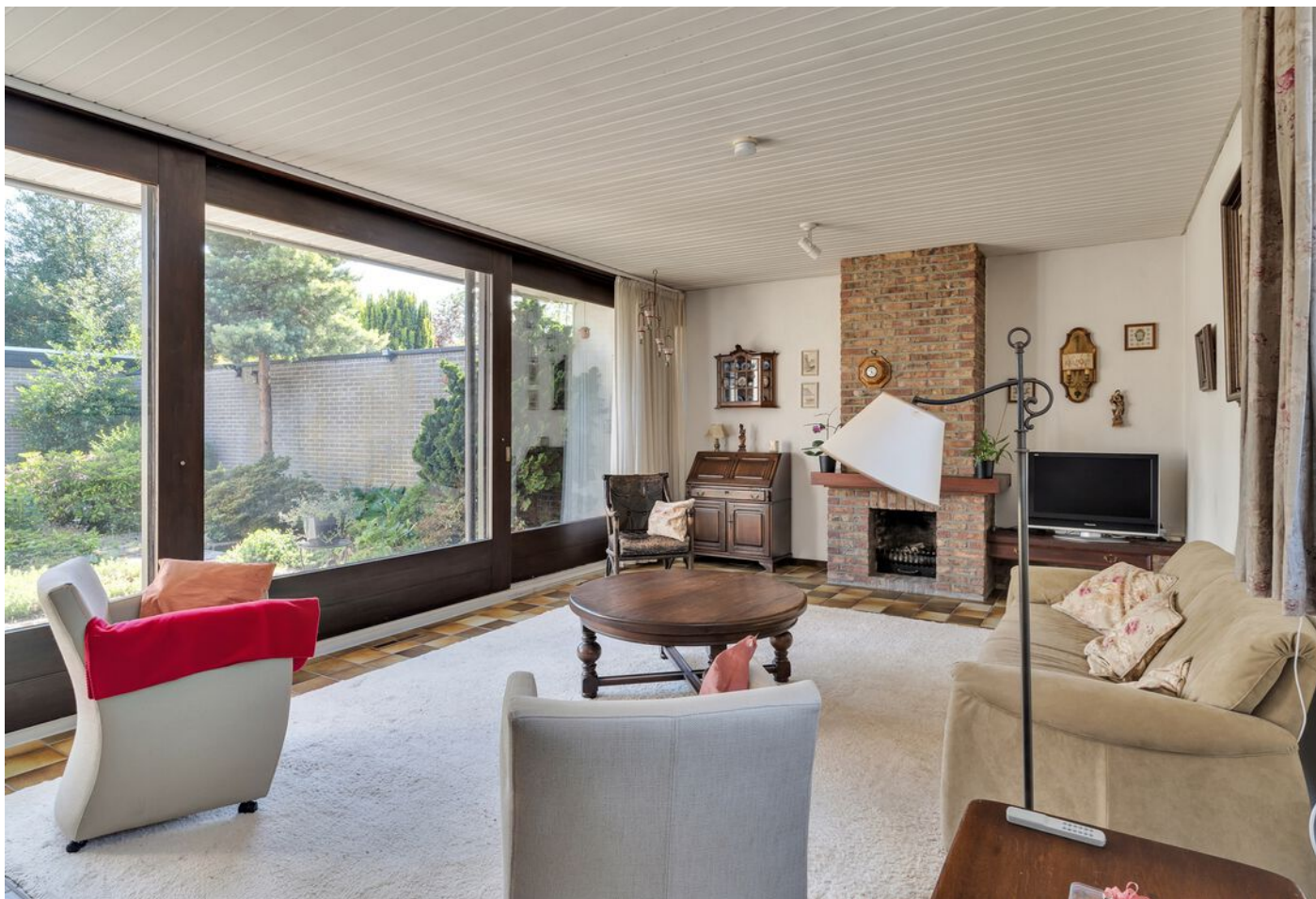
Luxemburglaan 53, Eindhoven