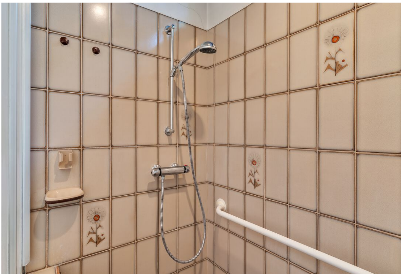
Luxemburglaan 53, Eindhoven