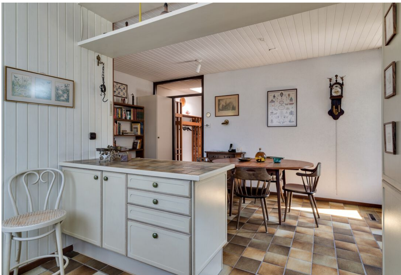
Luxemburglaan 53, Eindhoven