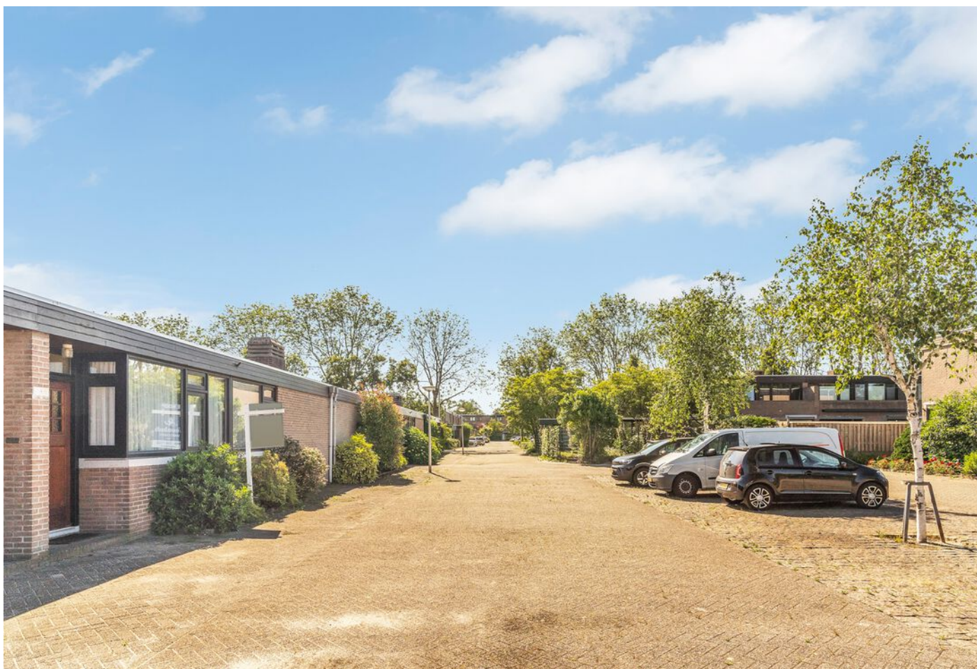
Luxemburglaan 53, Eindhoven