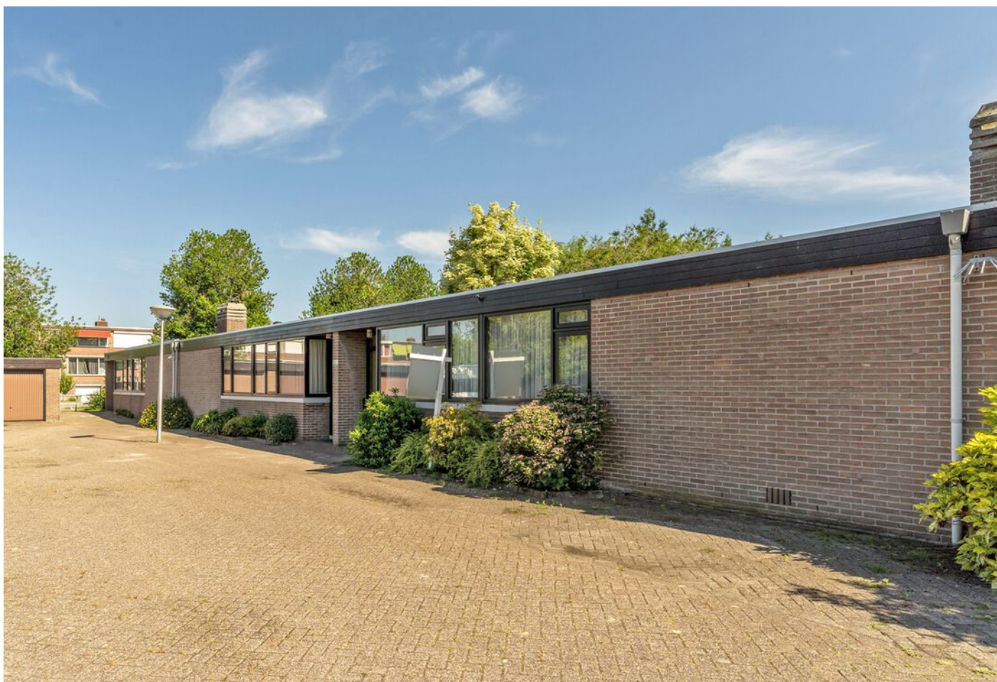
Luxemburglaan 53, Eindhoven