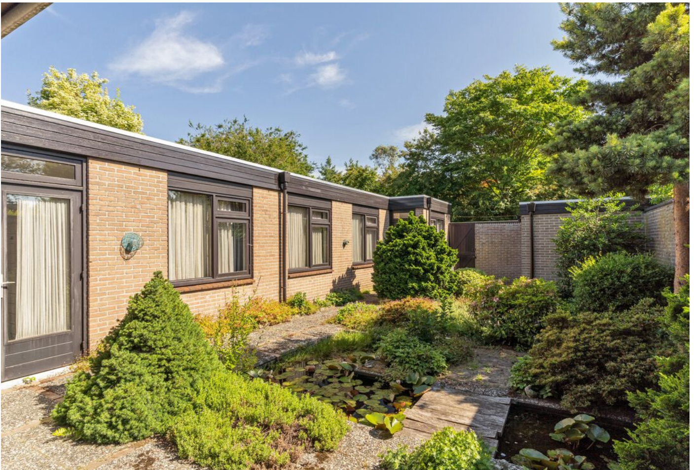
Luxemburglaan 53, Eindhoven