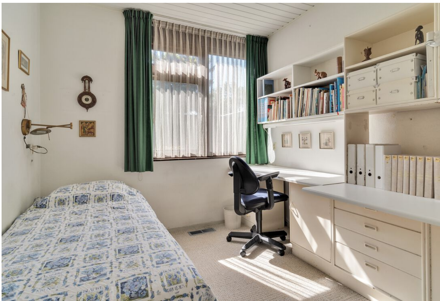
Luxemburglaan 53, Eindhoven