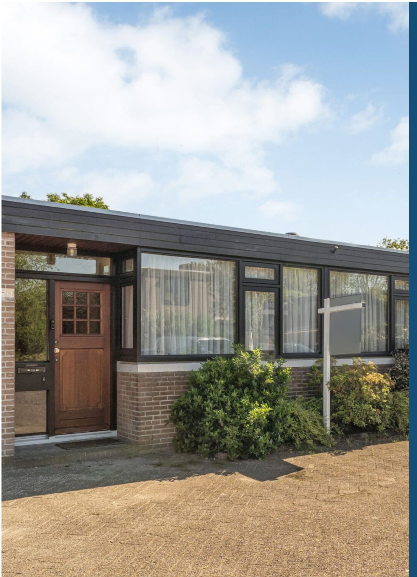
Luxemburglaan 53, Eindhoven