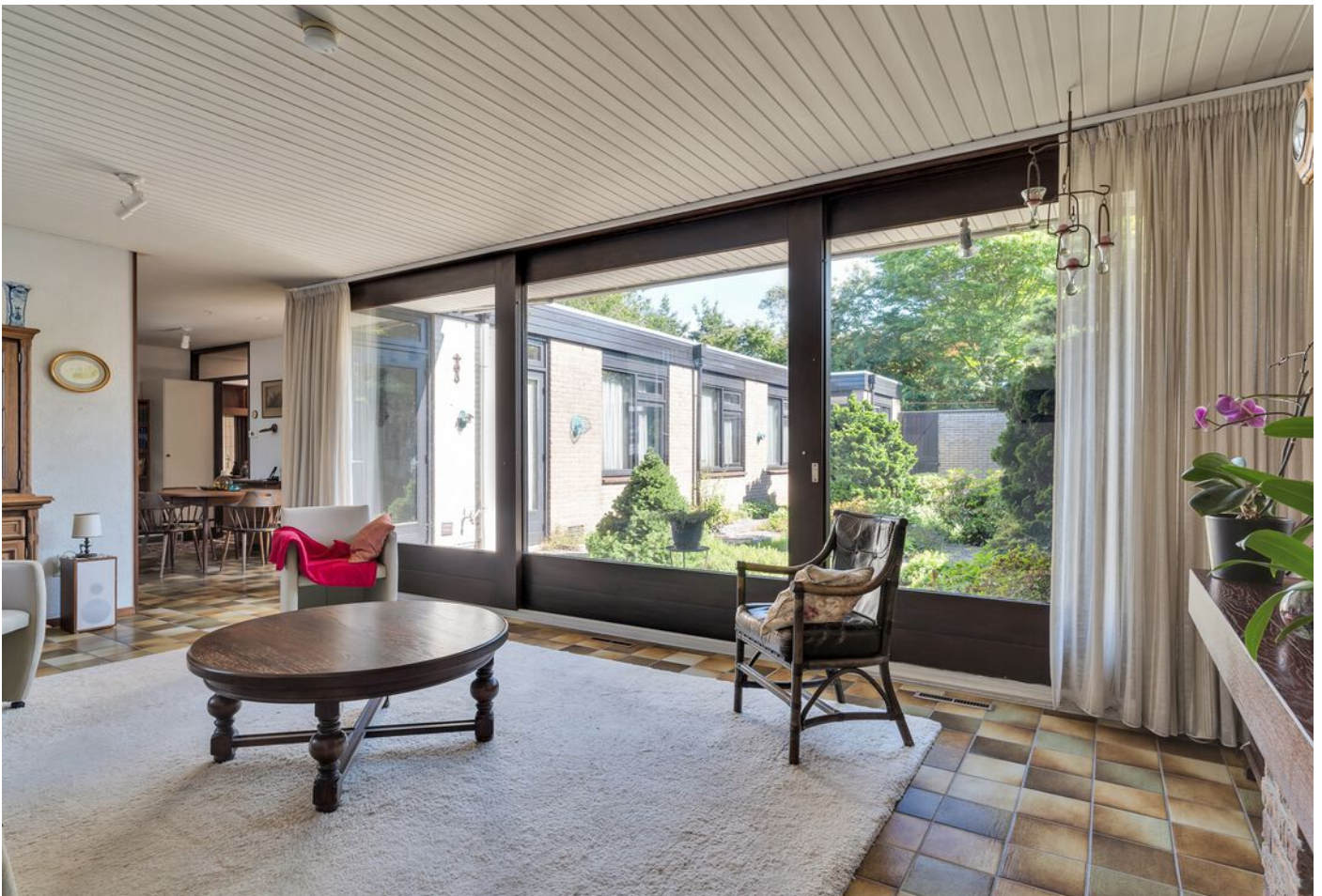
Luxemburglaan 53, Eindhoven