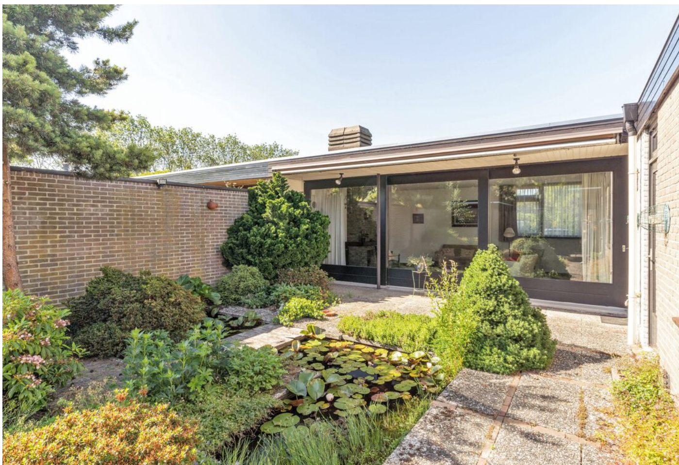
Luxemburglaan 53, Eindhoven