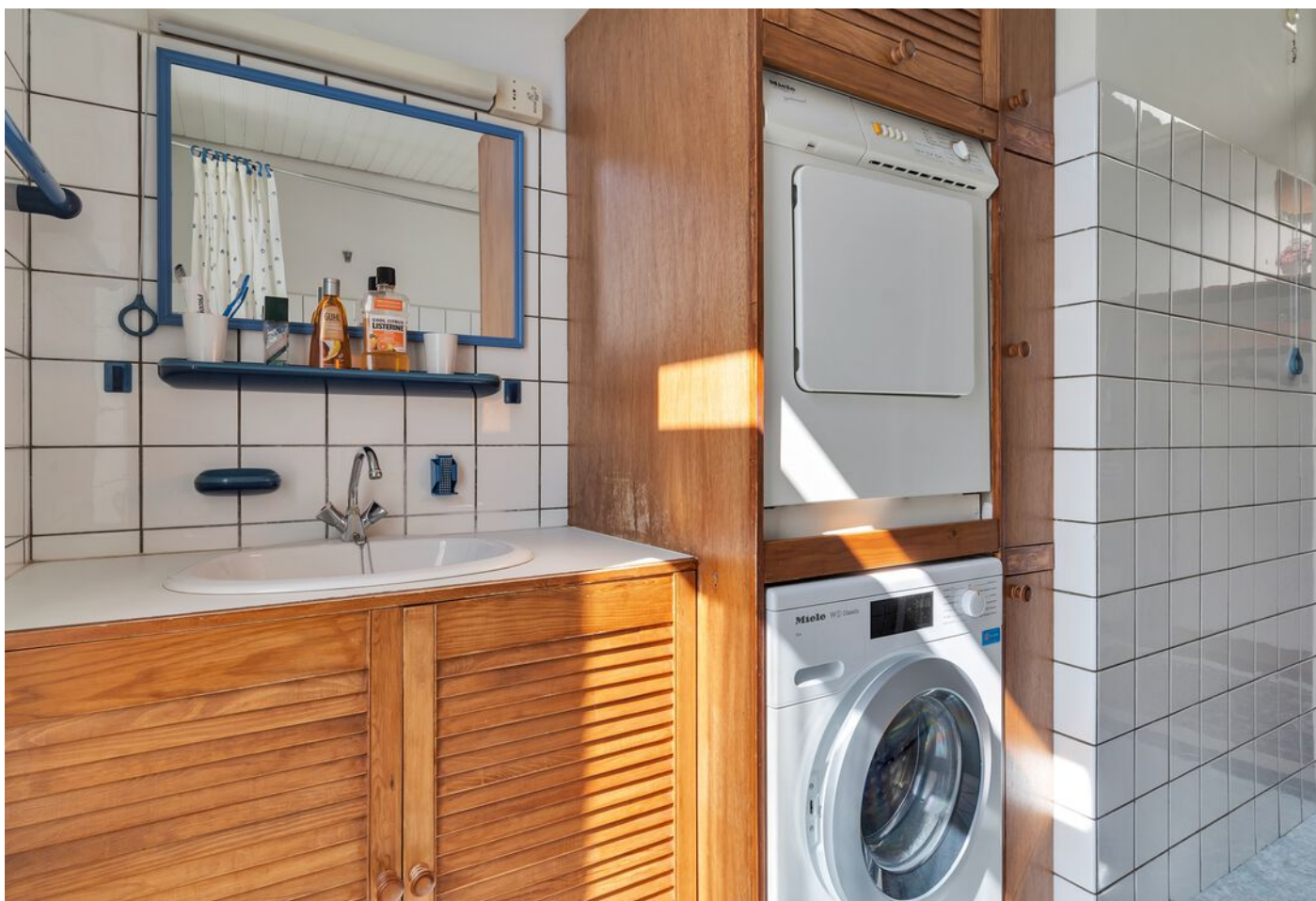
Luxemburglaan 53, Eindhoven