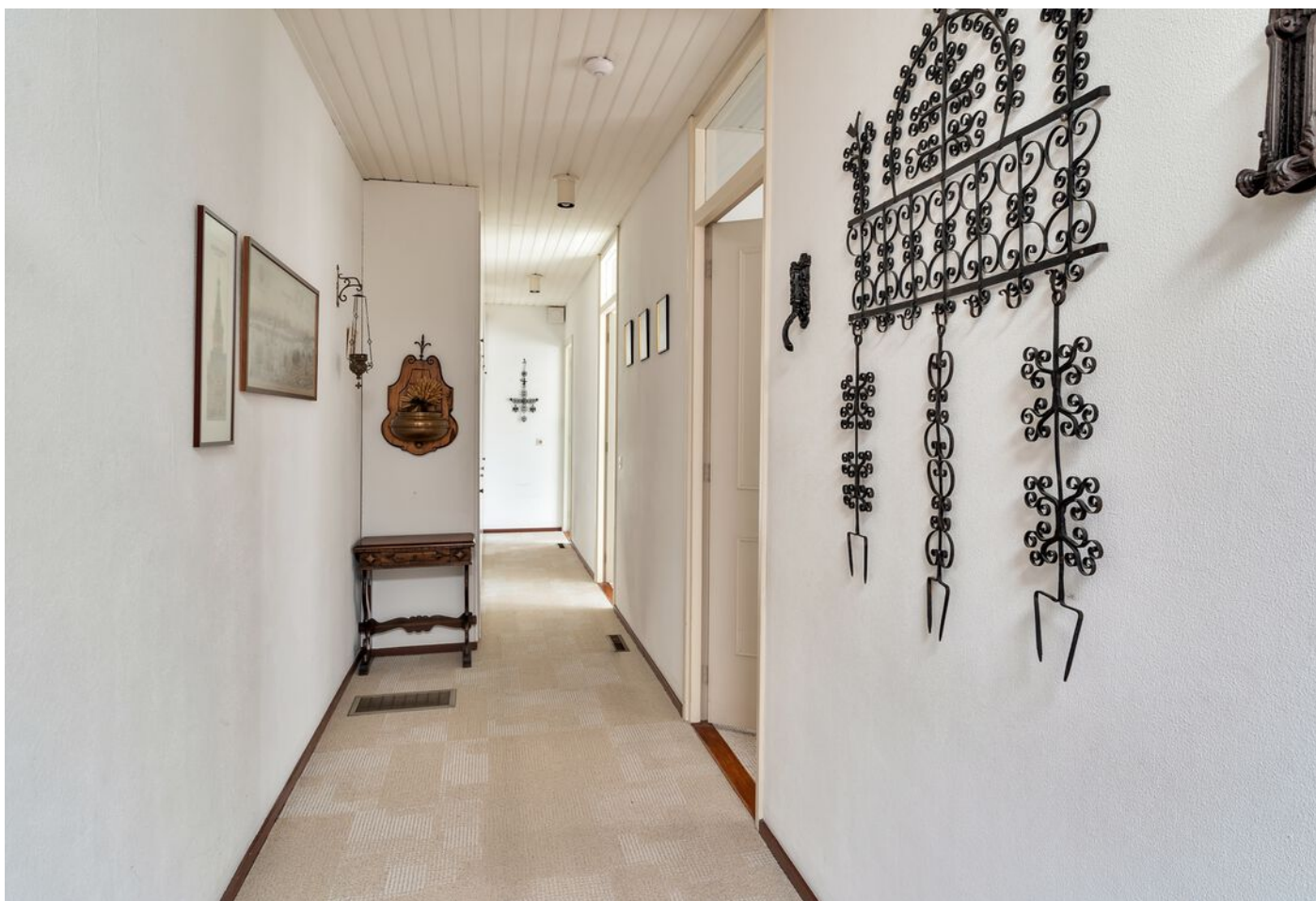
Luxemburglaan 53, Eindhoven