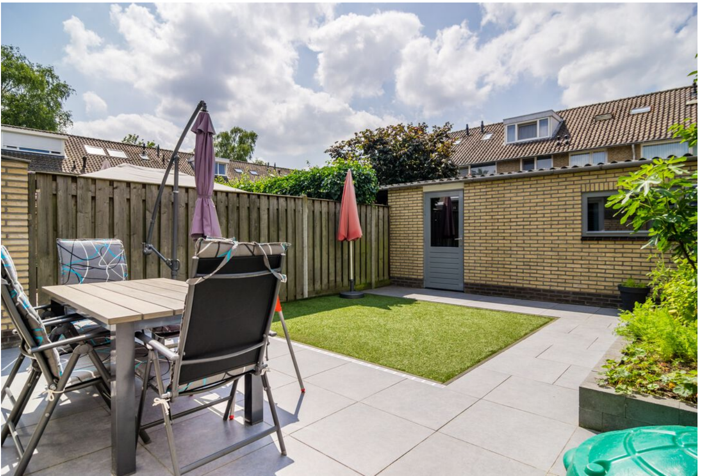
Liesbergstraat 20, Eindhoven