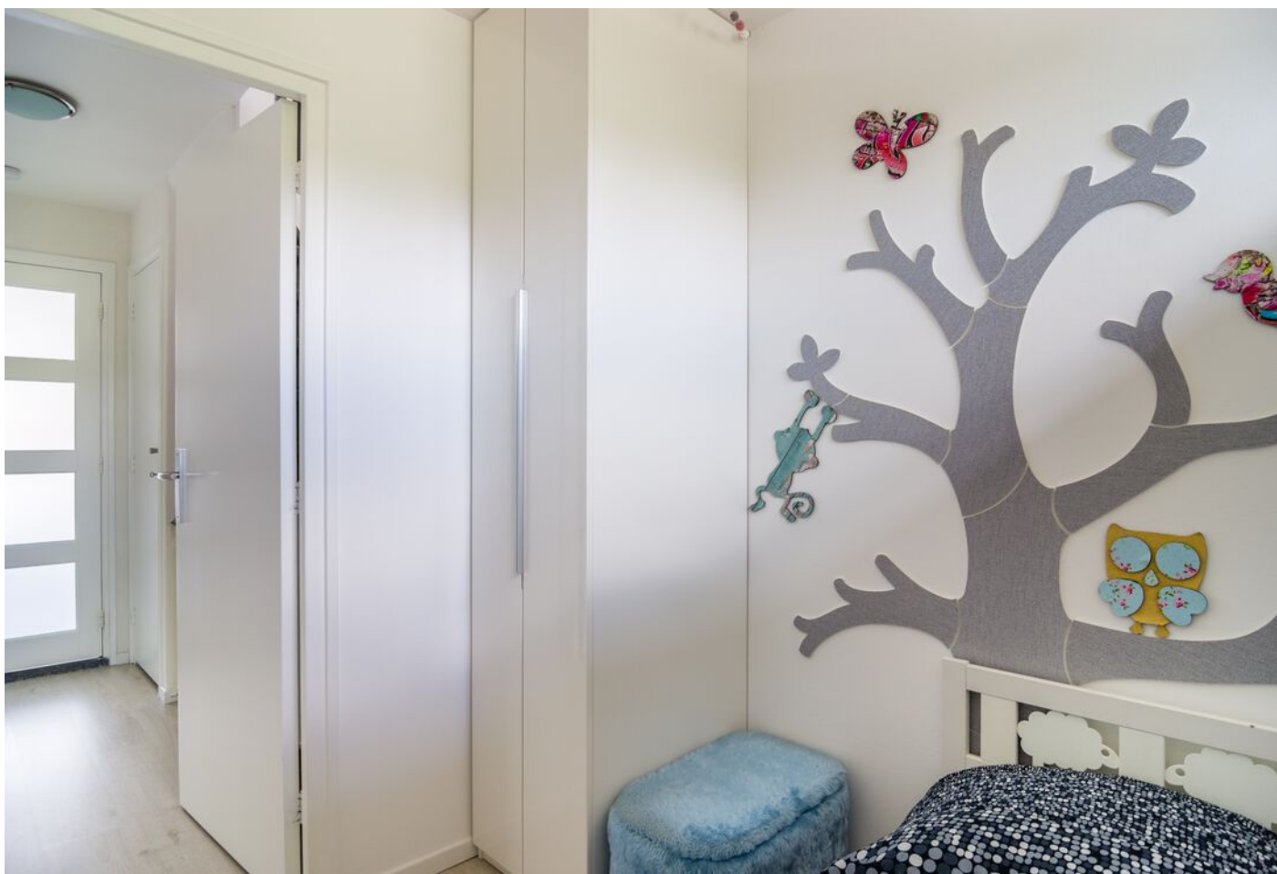
Liesbergstraat 20, Eindhoven