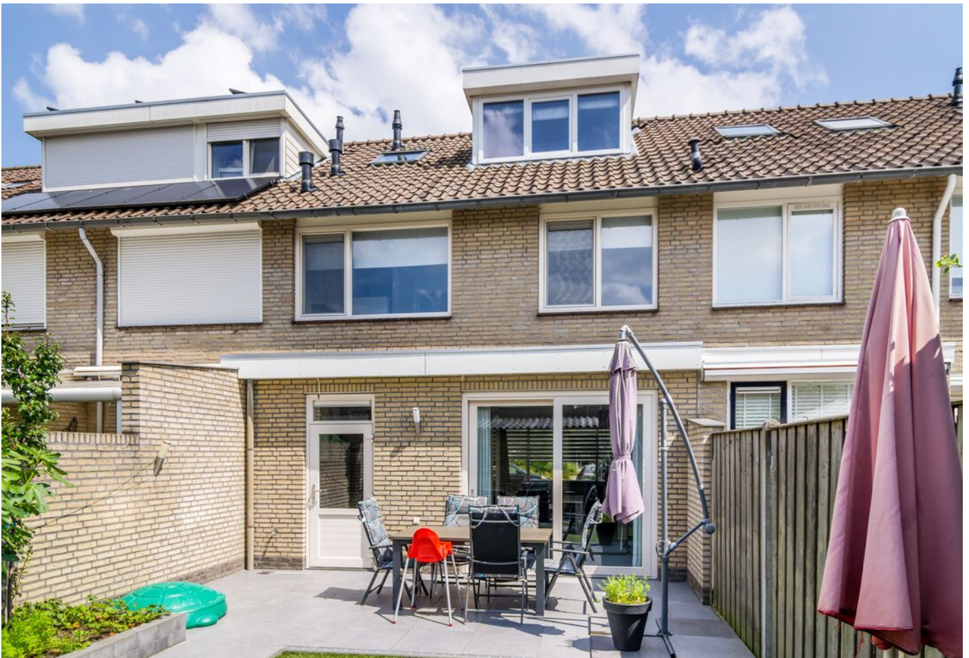
Liesbergstraat 20, Eindhoven