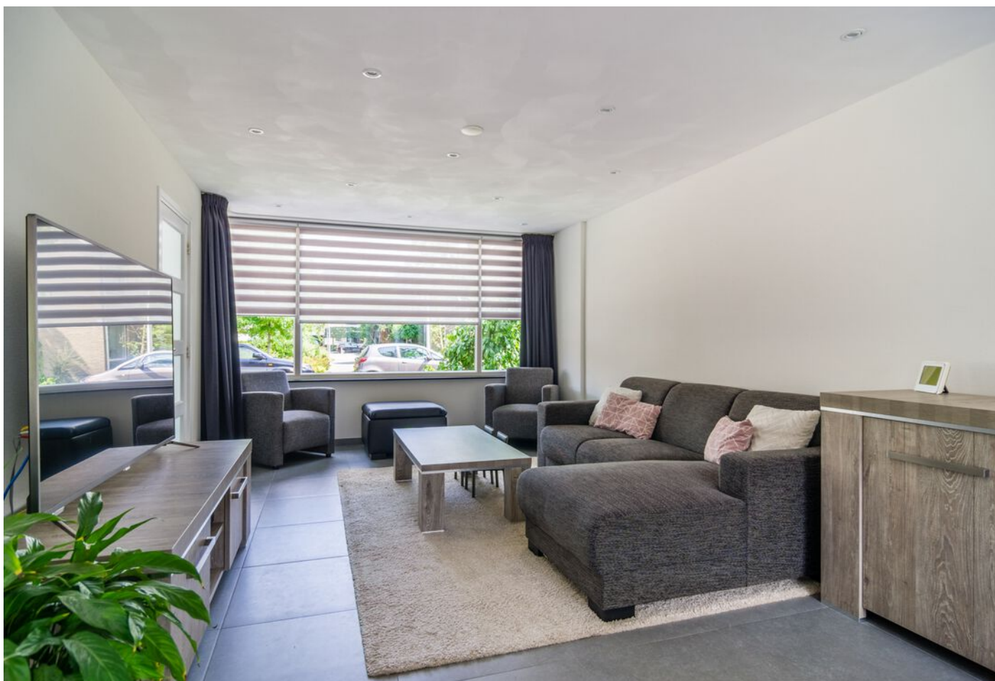
Liesbergstraat 20, Eindhoven