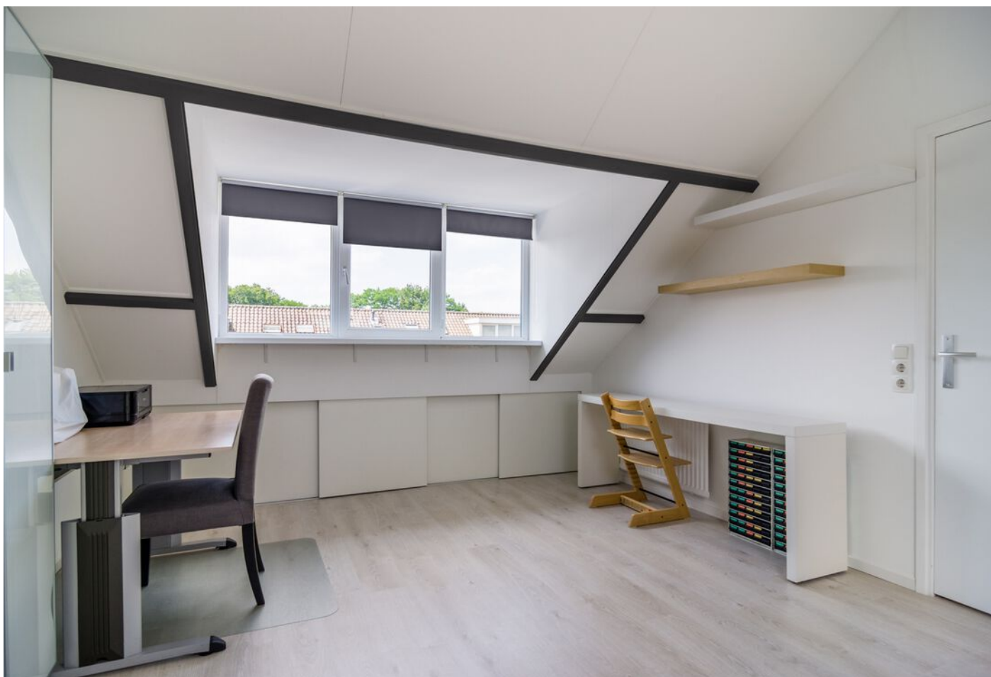
Liesbergstraat 20, Eindhoven