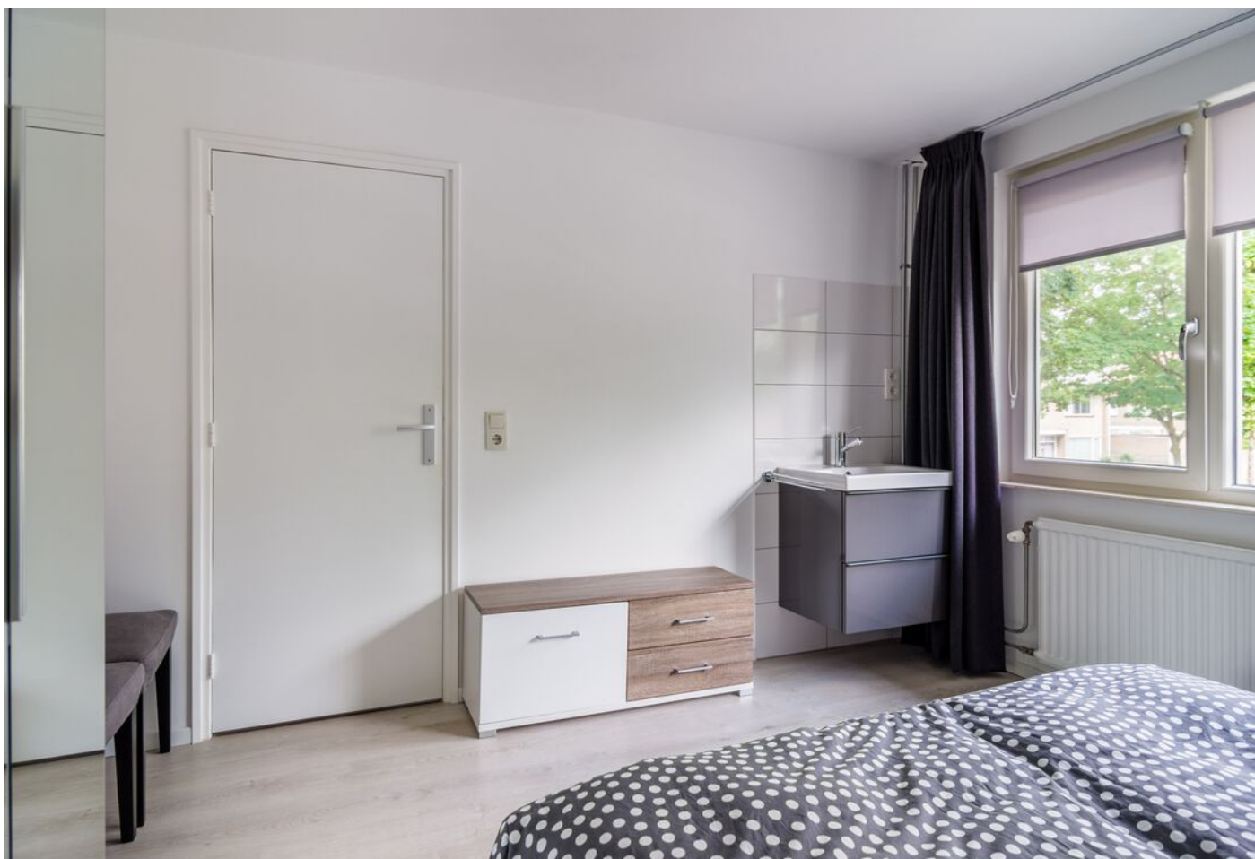
Liesbergstraat 20, Eindhoven